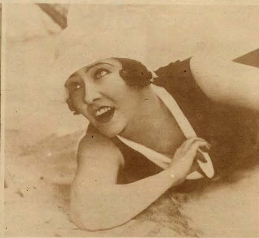
1) P. Lucyna Messal, primadonna operetki warsz. po długiej przerwie wystąpiła znowu na scenie teatru Nowości w Warszawie, witana entuzjastycznie przez publiczność stołeczną. Zdjęcie nasze przedstawia p. Messal z grupą partnerów w operetce Orłow. 2) Gloria Swanson, popularna artystka filmowa, poślubiła niedawno bogatego markiza de la Falais z Paryża i bawi obecnie we Francji, gdzie stanowi wielką atrakcję na plażach nadatlantyckich. Baltic