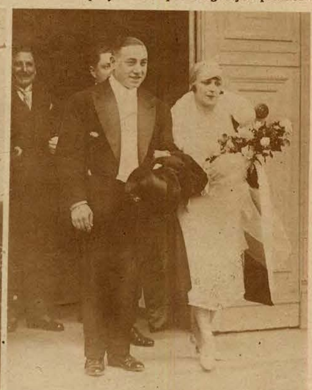
1) Władczyni Bhopalu, jedyna kobieta rządząca w Indjach, bawi wraz z synem (następcą tronu) i rodziną w Anglii. Na zdjęciu widzimy ją w ciężkich zastonach opuszczając meczet w Woking (Surrey), gdzie odprawiono dla niej uroczyste nabożeństwo. — 2) Pierwsze autentyczne zdjęcie z pożaru parlamentu w Tokio. Częste pożary w Japonii przypisać należy głównie materiałowi budulcowemu, który składa się przeważnie z drzewa i naoliwionego papieru. — 3. Słynnego atletę francuskiego, Rigoulota, uważanego za najsilniejszego człowieka świata, spotkał los, który po dłuższym czy krótszym czasie „spotyka” obecnie wszystkich wybitnych sportowców. Mianowicie został mężem divy filmowej. Ślub ten wywołał w Paryżu wielką sensację.