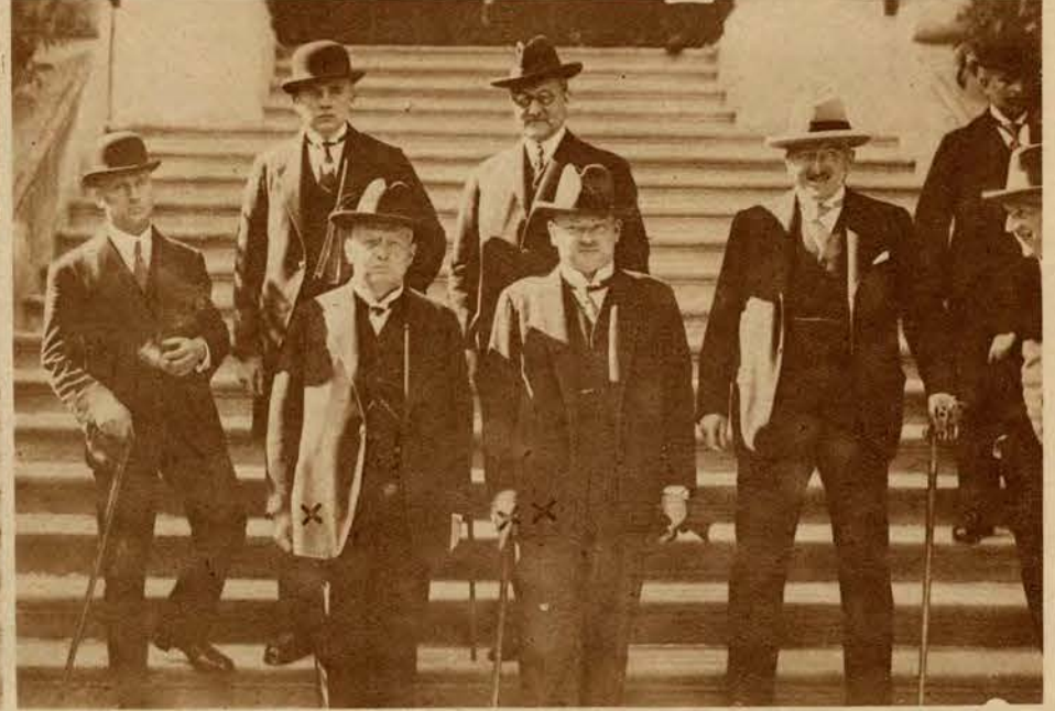
Wszystkie ostatnie konferencje dyplomatyczne znane są z tego, że odbywały się w miejscowościach bardzo przyjemnych i pięknie położonych. Także i teraz wybrali sobie europejscy dyplomaci za miejsce swych obrad przepiękne letnisko szwajcarskie Locarno, na którego czar składają się niebotyczne wierzchołki Alp i tonie jezior szwajcarskich. Zdjęcia nasze przedstawiają: 1) Ogólny widok Locarno, położonego nad jeziorem Lago Maggiore — 2) Wnętrze sali obrad, w której zapadły uchwały, mające tak doniosłe znaczenie dla Europy i Polski. Na dole widzimy delegacje, które wiodły prym w obradach. Na lewo angielska × Chamberlain, na prawo niemiecka × dr Luther, ×× Streseman.