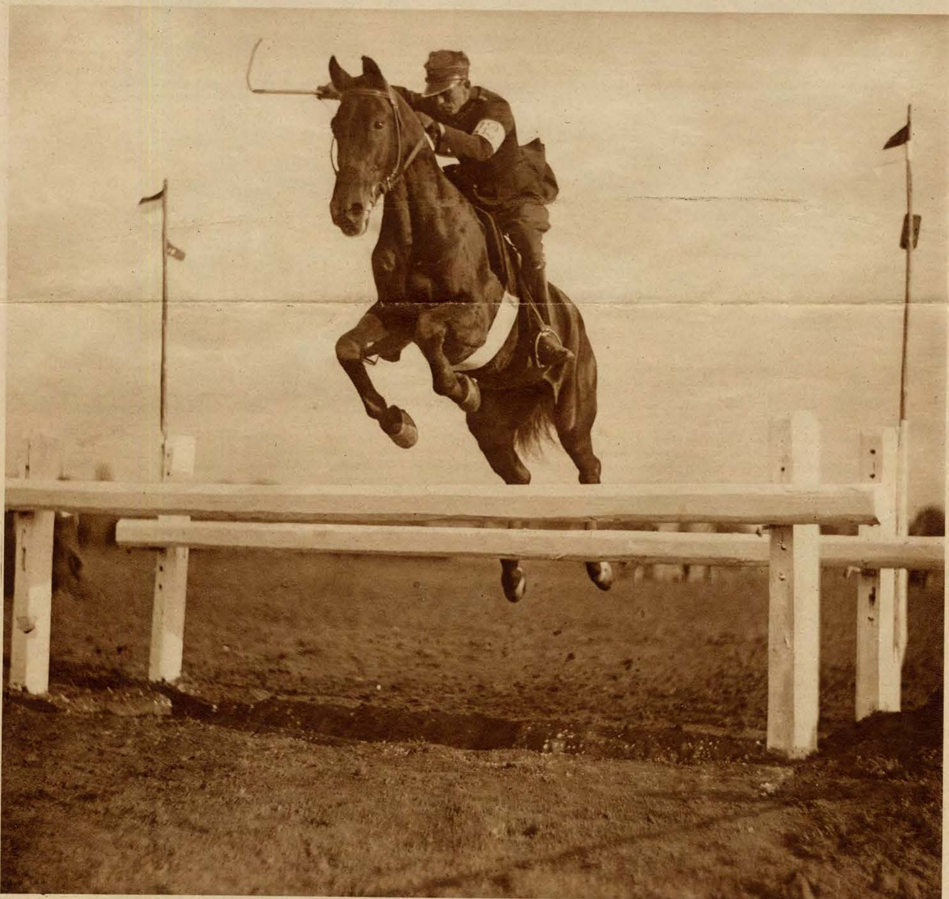
Na Matych Błoniach w Krakowie odbyły się w dn. 18 b. m. zawody konne oficerów artylerji O. K. V. Program objął bieg dystansowy z 5 przeszkodami na przestrzeni 10 km., bieg myśliwski, oraz liczne konkursy. W konkursie ciężkim z 15 przeszkodami zwyciężył kpt. Płotnicki (5 d. a. k.). Zdjęcie nasze przedstawia wspaniały moment brania trudnej przeszkody w ciężkim konkursie przez por. Cisowskiego na „Hrabi”.