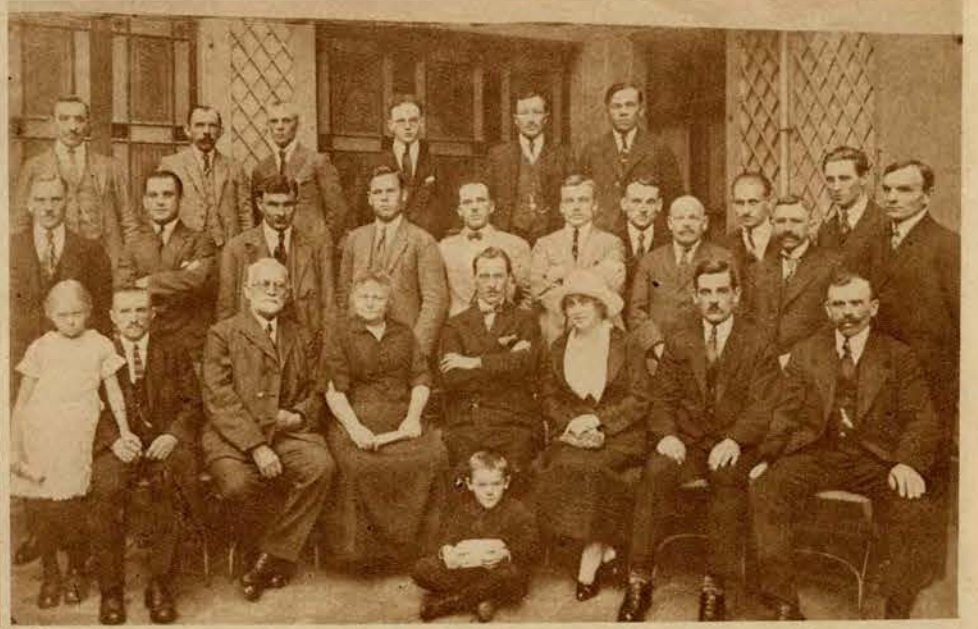
1) Z sensacyjnego procesu Bajot-Daudet. Komisarz policji Colombo oskarżony przez Daudeta o współudział w zamordowaniu jego syna, składa w sądzie zeznania. 2) Z życia wychodźstwa polskiego we Francji. Koło robotników polskich w Strassburgu.