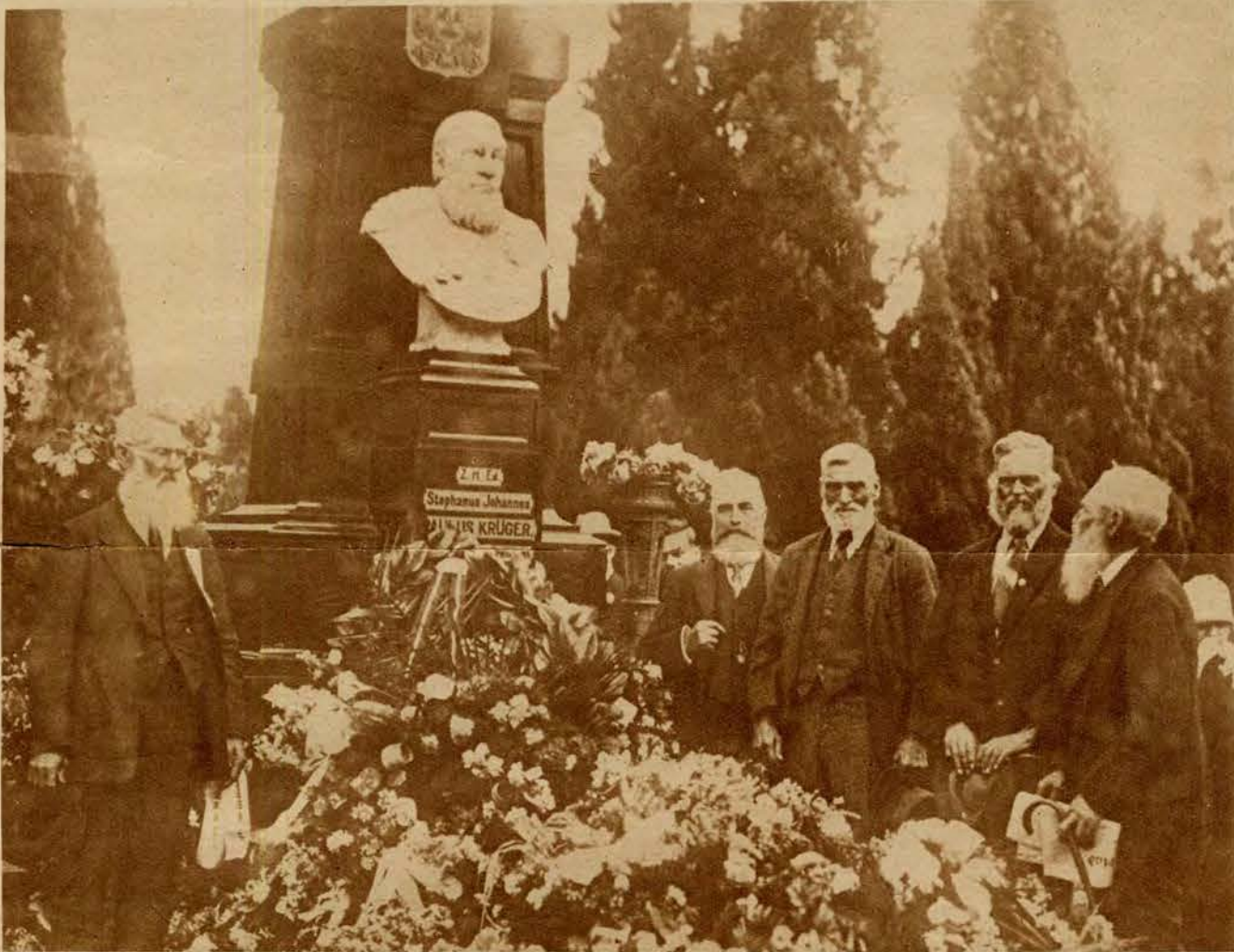
W połd. Afryce obchodzono obecnie uroczyste 100-letnią rocznicę urodzin Pawła Krügera, pierwszego prezydenta Transvaalu, bohatera wojny Burów z Anglikami. Na grobie jego w Pretorji koledzy i towarzysze Krügera z czasów wojny złożyli wieńce i kwiaty.