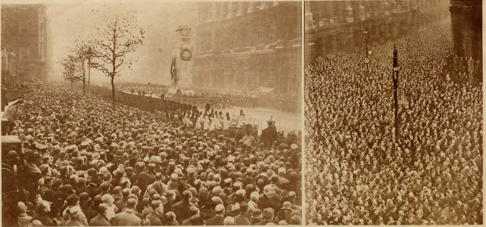
Siedmioletnią rocznicę zawieszenia broni obchodził Londyn 2-minutowym powszechnym milczeniem. Zdjęcia nasze przedstawiają uroczystości przed grobem Nieznanego Żołnierza, oraz moment z centrum miasta, przed Bankiem Angielskim.