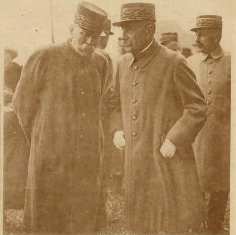
Siedmioletnią rocznicę zawieszenia broni obchodzono również uroczystości w Paryżu. Na lewo widoczna deflada wojsk przed grobem Nieznanego Żołnierza, znajdującym się pod Łukiem Triumfalnym, na prawo bohaterowie Wielkiej Wojny Joffre i Foch.