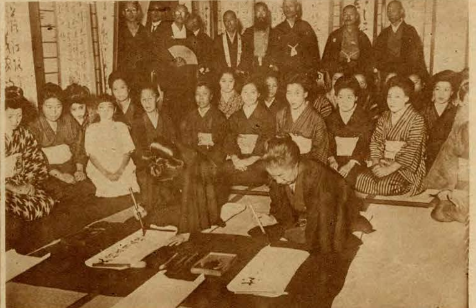
Obrazki z Japonji. 1) Poświęcenie nowego mostu w Osaka. Pierwsi przechodnie stanowili 3 generacje tej samej rodziny, potem przeszli przedstawiciele władzy a dopiero potem most został oddany do użytku publicznego. 2) Zdjęcie nasze przedstawia konkurs kaligraficzny w Tokio. Sztuka pisania po japońsku jest bez porównania trudniejsza niż u nas. Odbywa się ona zapomocą szerokiego pędzelka i tuszu.