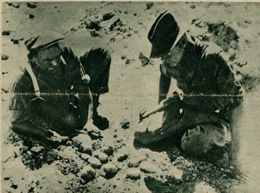
Wyprawa do Mongolji i na pustynię Gobi, zorganizowana przez amerykańskie muzeum przyrodnicze, dokonała wielu nader ciekawych odkryć. Pomiędzy innymi zaleziono niewylęte lub częściowo wylęte skamieniałe jaja dinosaurów, których wiek określić wypada na około 10 milionów lat.