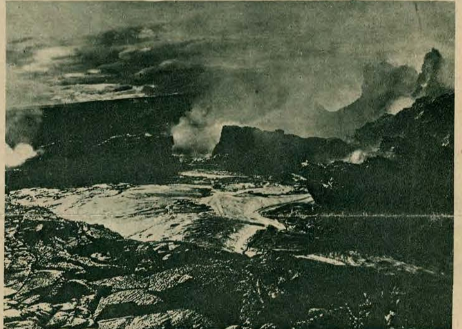
Wnętrze krateru przedstawia podczas wybuchu nader groźną scenerję. Z pomiędzy oziębionych i stężonych już ścian lawy wyrwywają się dymy a w ślad za nimi ogień i potoki płynnej lawy. Chmury przestaniają widok, a z pomroki dochodzą głucho podziemne grzmoty.