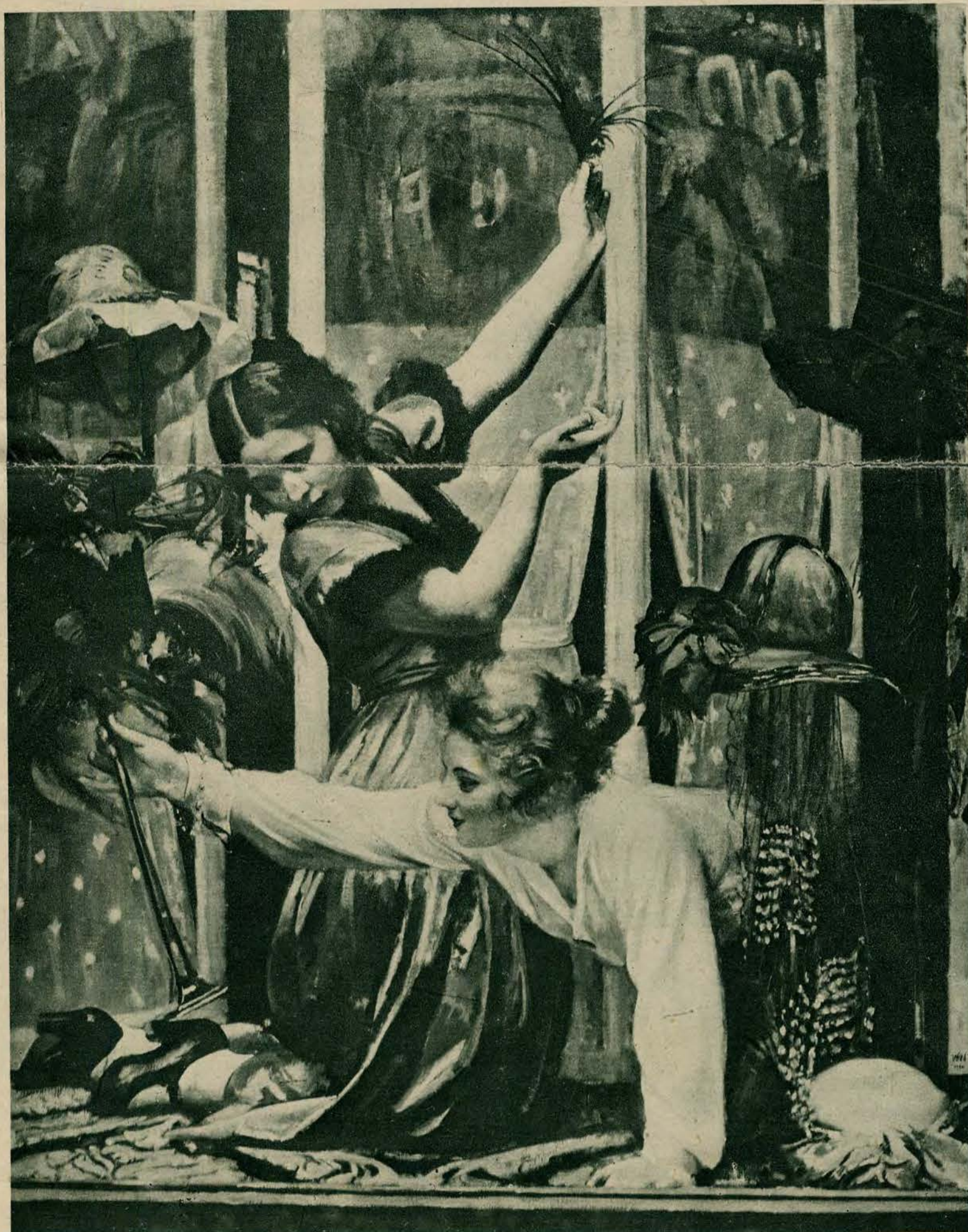
Obraz pod tytułem „Modystki“ (ol. 1922) pędzla jednego z największych naszych mistrzów, profesora Wojciecha Weissa. — W Krakowie została obecnie otwarta zbiorowa wystawa prac artysty, wzbudzająca powszechne zainteresowanie.