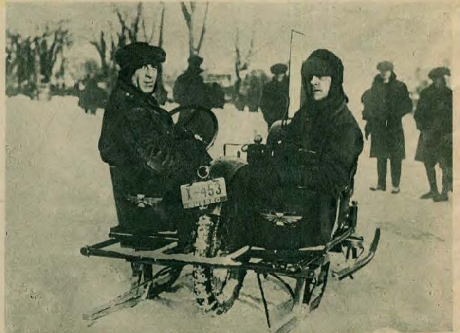
Na rozmaite sposoby starano się rozwiązać problem sanek motorowych. Używa się w tym celu śmigi powietrznej lub też koła zębatego. Zdjęcie nasze przedstawia ten drugi typ, skonstruowany w Kanadzie i mogący rozwinąć w miarę sprzyjających warunków wcale znaczną szybkość.