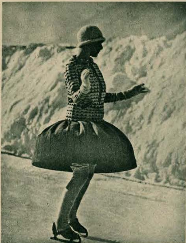
Za przykładem „cudownego dziecka tyżwiarskiego“ Soni Henje z Norwegji, która zwróciła na siebie uwagę całego świata, także i inne dzieci pragną być nie mniej cudownymi. Że nie jest to zadaniem łatwym, świadczy powyższe zdjęcie.