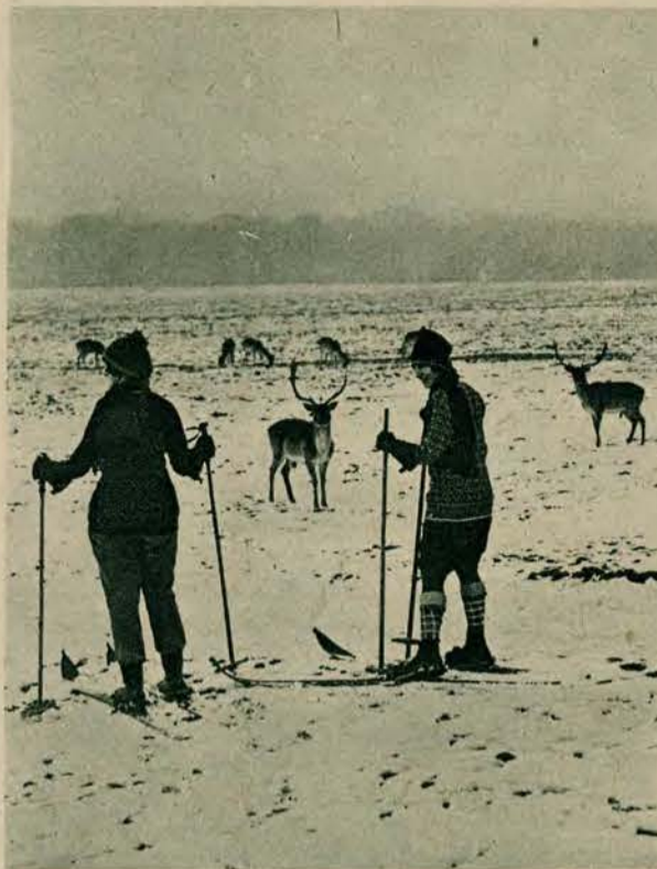
Zdawałoby się, że scena powyższa odgrywa się gdzieś na dalekiej północy, gdzie spotkanie rena nie należy do żadnych osobliwości. Tymczasem i w największym mieście świata w Londynie, w parku Richmond, modnie ubrane narciarki mogą teraz wyobrazić sobie odległą północ.