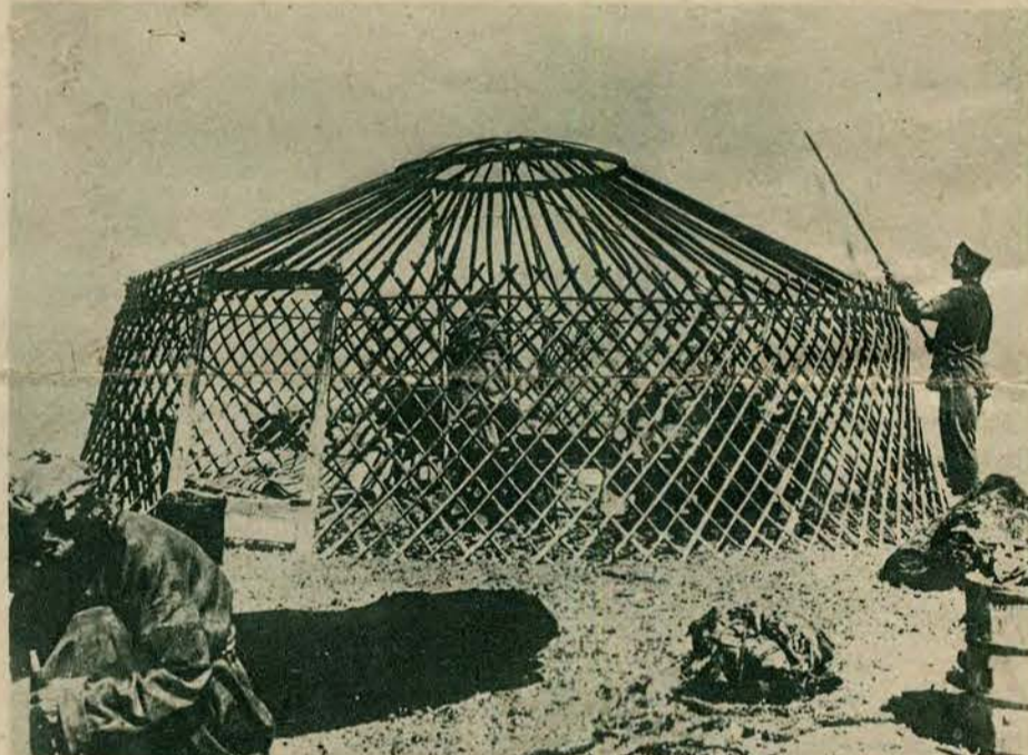
Ta sama wyprawa zapoznała się w Mongolji z całym szeregiem szczegółów życia mieszkańców tego mało znanego kraju. Zdjęcie przedstawia drewniane rusztowanie „jurty“ czyli domu mieszkalnego. Rusztowanie to pokrywa się wołjokiem i mieszkanie gotowe.