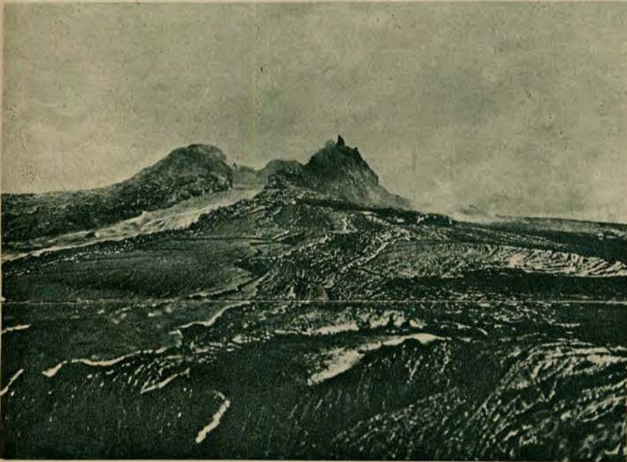
„Domem wiecznego ognia” zowią Hawajczycy największy wulkan swego kraju. „Kilauea” jest prawie ciągle czynny i ogromne masy płynnej lawy zalewają rozległe pola bazaltowe na zboczach i u stóp wulkanu leżące. Pochodowi lawy towarzyszą prawie zawsze silne trzęsienia ziemi.