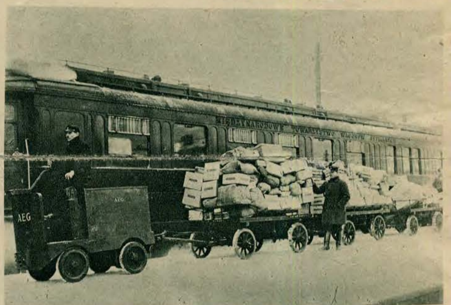
Na głównym dworcu warszawskim zaprowadzono niedawno elektryczne lokomotywy z doczepkami, celem ułatwienia w transporcie bardzo licznych przesyłek pocztowych. Przesyłki te wożono przedtem na małych wózkach ręcznych, co było nader nieekonomicznem.