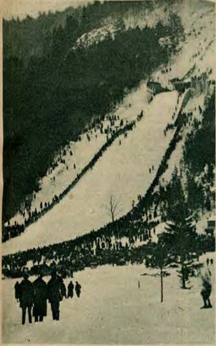
W Zakopanem, na północnych stokach regli, zbudowano po dwuletniej pracy wielką skocznię narciarską, nie ustępującą rozmiarami zagranicznym tego rodzaju urządzeniom. Zdjęcie przedstawia ogólny widok skoczni „na Krowki”.