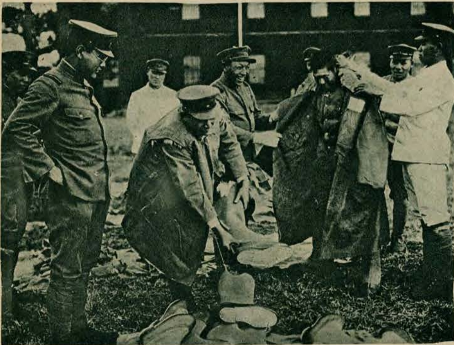
Japonia wkroczyła do Mandżurji, która z powodu walk chińskich wojsk narażona jest na szkody. Ilustracja nasza przedstawia ekwipowanie się żołnierzy japońskich, nie przyzwyczajonych jeszcze do surowego klimatu Mandżurji.