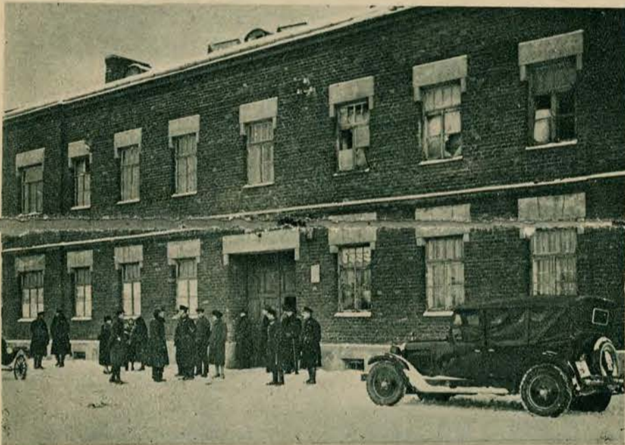
Fabryka amunicji „Granat” na Czystem w Warszawie była 21 stycznia b. r. widownią wybuchu, spowodowanego krótkim spięciem przewodów elektrycznych. Katastrofa zdarzyła się w oddziale soplek i pociągnęła za sobą ofiary oraz spowodowała oparzenia licznych robotnic.