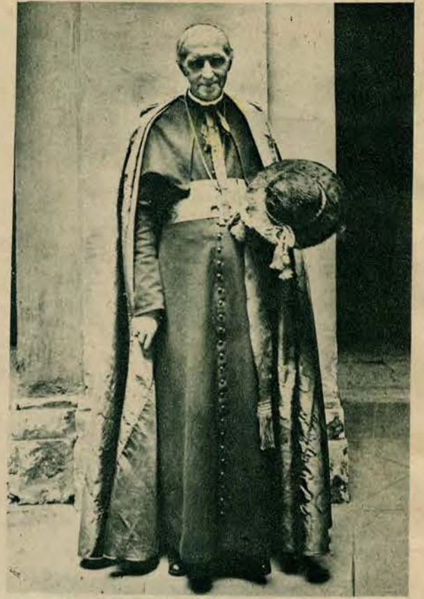
Bohaterski prymas Belgji, kardynał Mercier, zmarł niedawno w Malines. Zmarły kardynał odgrywał podczas wojny doniosłą rolę w swym kraju, krzepiąc ducha i dodając otuchy, oraz stwarzając szereg instytucyj dla społecznego dobra.