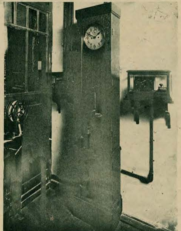
Ilustracja przedstawia nam centralny zegar elektryczny automatycznie wysyłający do dyrekcji kolejowych w Polsce ścisły czas. Zegar połączony jest z obserwatorium astronomicznym uniwersytetu warszawskiego i codziennie o godz. 12 w południe telegrafuje automatycznie.