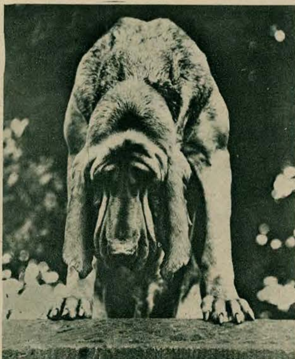
Nader ciekawy okaz „rasowego“ psa, na którego trzeba chyba palcem wskazać i powiedzieć, że jest on psem, by wierzyć, że nie jest na przykład małpą, na co bez mała wygląda.