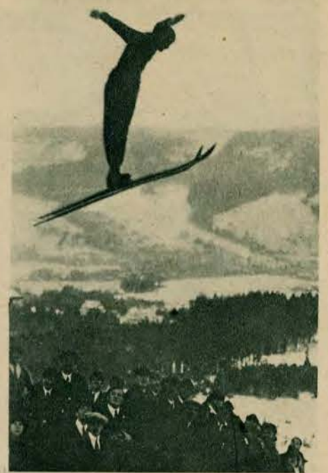
Na wielkiej skoczni w Zakopanem, zawodnicy nasi mają częstą sposobność do ćwiczenia. Prawie co tydzień urządzone są zawody i postęp naszych sportowców jest duży. Obecnie już dochodzą oni do skoków pięćdziesięciometrowych.