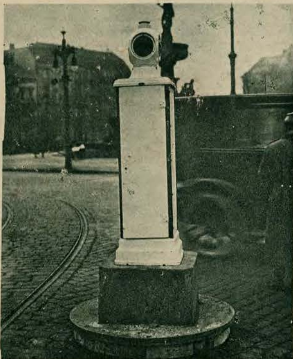
Wzmógłony ruch kołowy na ulicach wielkich miast wymaga coraz troskliwszego regulowania. Dużą pomoc oddają w tym kierunku wieże sygnalizacyjne, rozstawione na ruchliwych punktach.