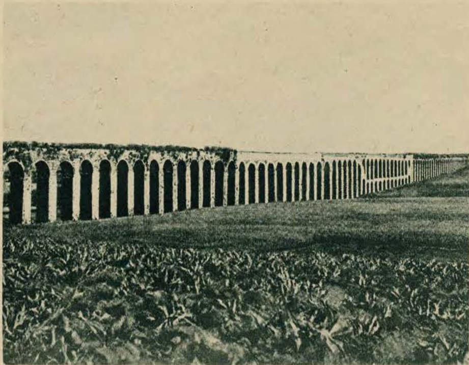
Imponujący „aquedukt” zbudowany przez Arabów, doprowadzający wodę do miasta Akka w Syrii, znanego z wojen krzyżowych i napoleońskich.