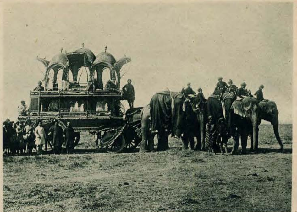
Ruchomy pałac w zmniejszonym wydaniu. Landara jakiegoś indyjskiego kacyka, ciągnięta przez 4 słonie. Pałac wymiarami swymi odpowiada zdaje się powadze władzy możnego władcy.