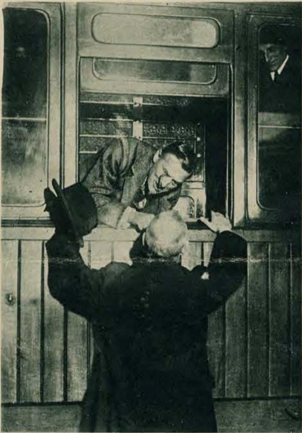
Chamberlain na „Gare du Nord” w Paryżu, w przejeździe do Genewy.