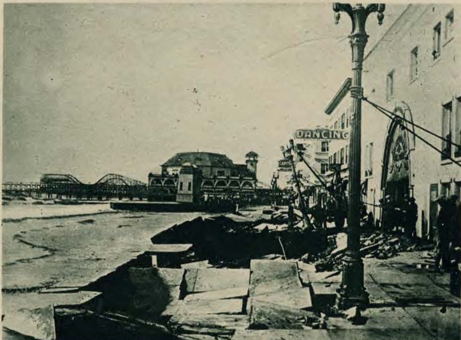
Z końcem lutego szalała na wybrzeżu kalifornijskim burza morską, która szczególnie w Long Beach, znanej miejscowości kuracyjnej, sprawiła straszne spustoszenia. Zdjęcie powyższe daje wyobrażenie o potędze wzburzonych fal morskich, które kamienne moło potrafiły rozerwać w kawałki.