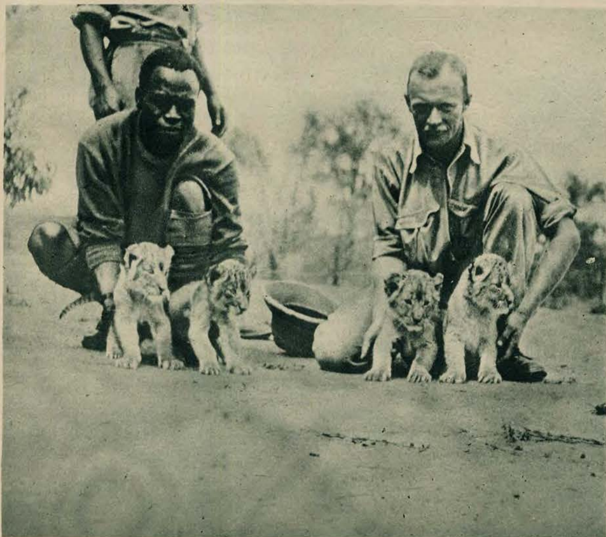
Cztery młode, jednomiesięczne lwiątko schwyfane na polowaniu po zabiciu matki. Polowanie odbyło się w wschodnim Transvaalu (Afryka południowa) nad rzeką Zand.