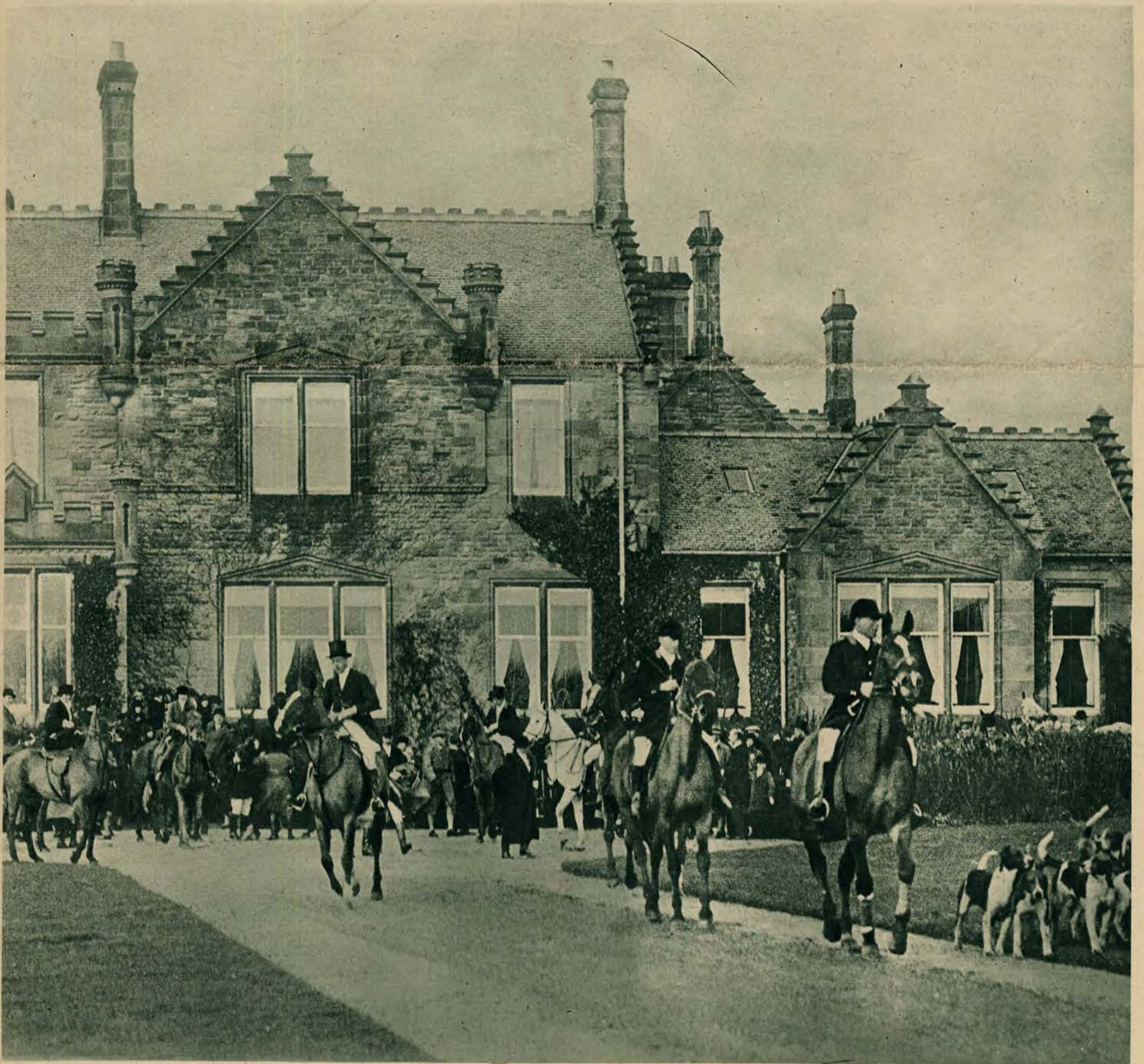
Książę Walji, angielski następca tronu, na polowaniu w Ayr, Szkocja. Obraz powyższy przedstawia moment wyruszenia na polowanie z zamczku myśliwskiego, zwanego „Ladykirk House“.