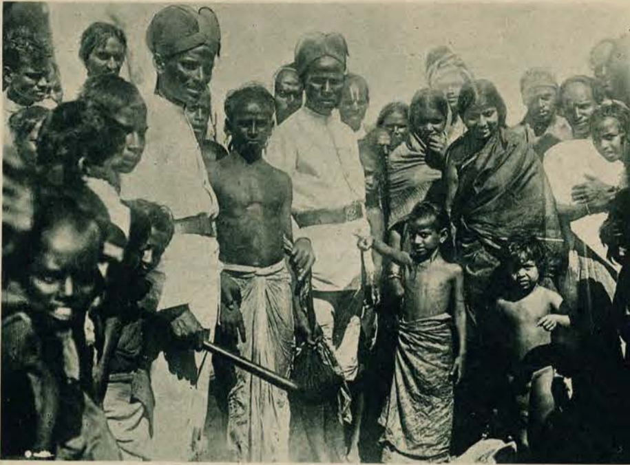
Policja indyjska przy pracy. W ręku gumowe pałki, na głowie dziwaczne hełmy a stopy bosc. Między nimi przestępca, na prawo młodociany oskarżyciel. Myny u wszystkich zadowolone, w sam raz dla fotografa.