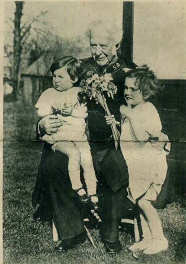
Bramwell Booth, syn założyciela słynnej Armji Zbawienia, obecnie generał tej armji obchodzi rocznicę 70-lecia urodzin. Na zdjęciu widzimy go z wnuczkami w posiadłości Hadley-Woods (Anglja).