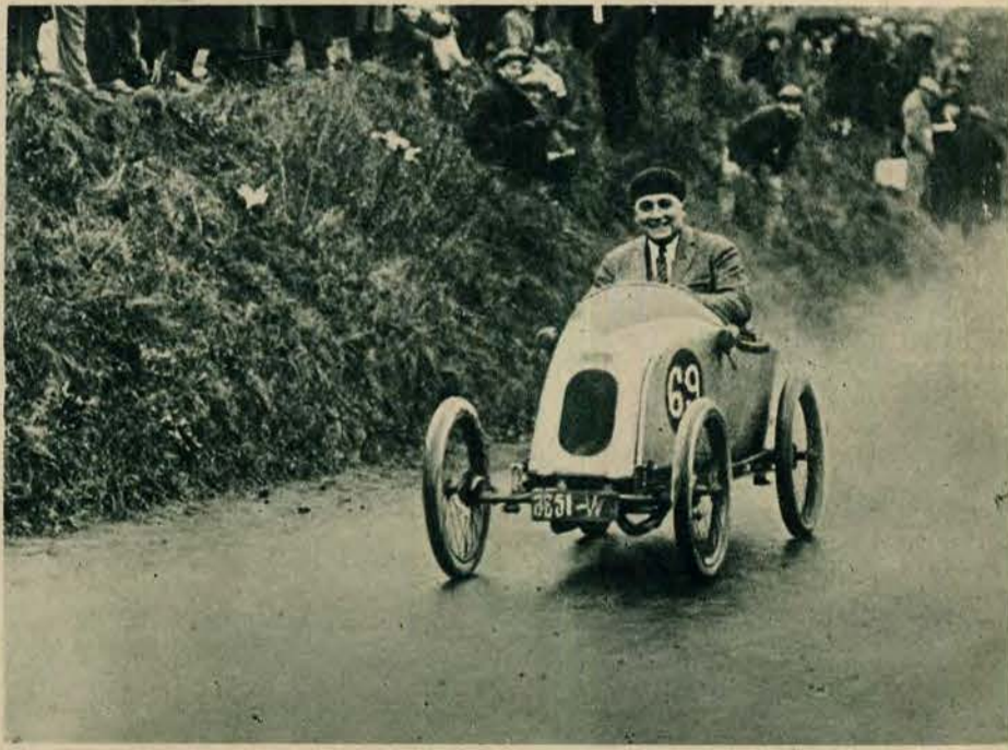
Wóz powyższy nie jest dziecinną zabawką, ale najnowszego typu samochodem na jedną osobę, używanym obecnie we Francji. Zdjęcia dokonano podczas wyścigów pod Paryżem.