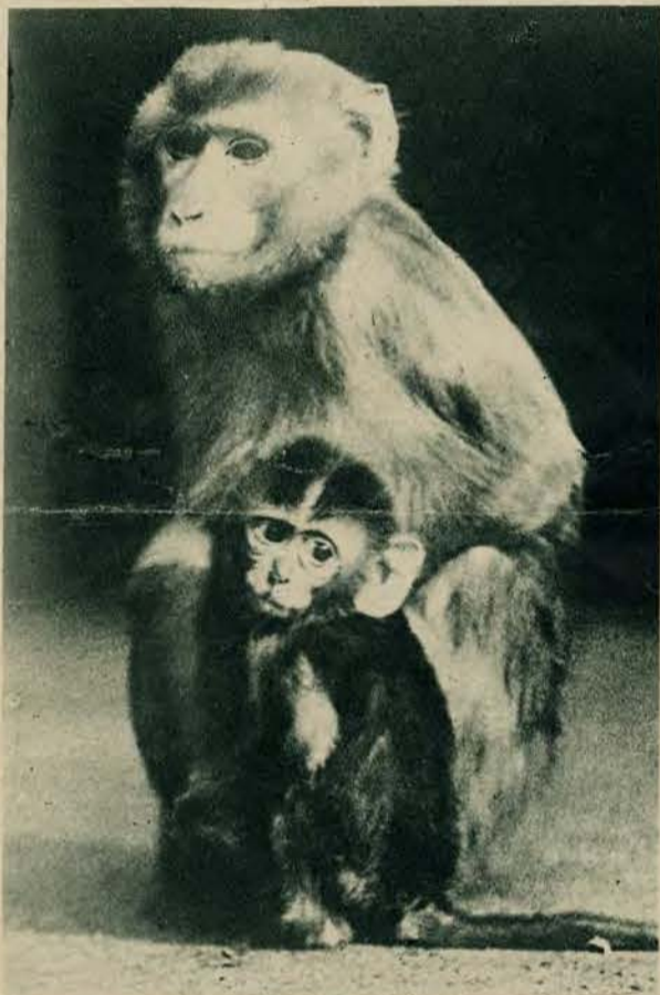
W londyńskim ogrodzie zoologicznym przyszła na świat małpka, która przez matkę otaczana jest przysłowia i wyszydzana „małpią miłością”.