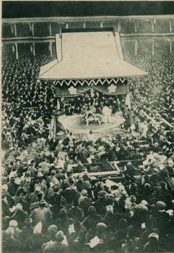
Obrazek z walk zapaśniczych w Chibiga (Japonja) które cieszą się tam wielką popularnością.