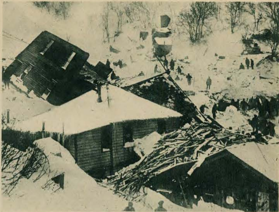
Niebywałej wielkości i siły lawina śnieżna zasypała wioskę Sap Gulch koło Bingham w St. Zjedn. 40 osób straciło pod nią życie a szereg domów uległo zupełnemu zniszczeniu.