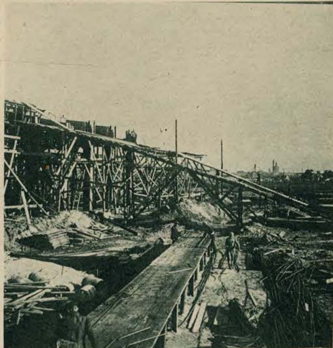
Towarzystwo Obrony Przeciwgazowej buduje w Warszawie na Żoliborzu „Chemiczny Instytut badawczy” dla prac nad rozwojem polskiego przemysłu chemicznego.