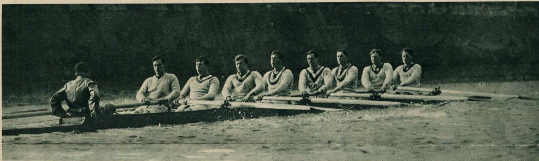
Dnia 27 marca odbędą się tradycyjne regaty międzyuniwersyteckie Cambridge-Oxford, ściągające na siebie uwagę całej Anglii. Obie drużyny znajdują się już w pełnym treningu. Na obrazie ósemka oksfordzka.