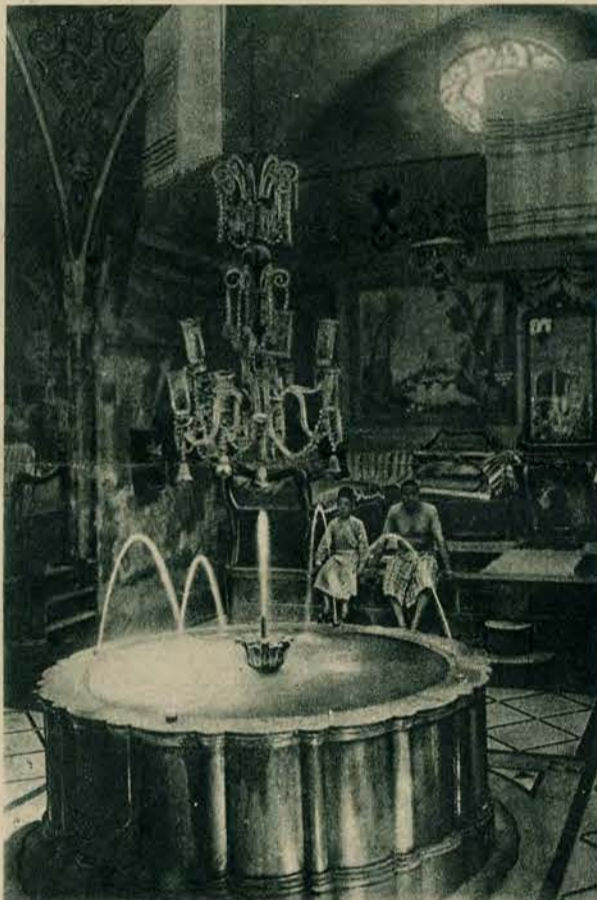
Wnętrze z przepychem urządzonej łaźni arabskiej w Damaszku. Uwagę zwraca starożytny świecznik.