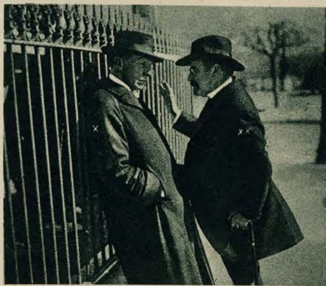
Lord Robert Cecil (X) i Vanderwelde omawiają na ulicy krytyczną sytuację Ligi.