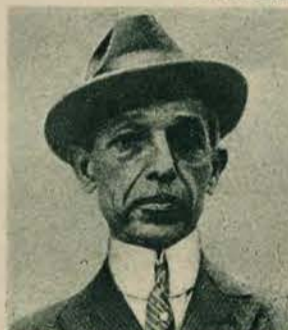
Mello Franco delegat brazylijski do Ligi Narodów, który sprzeciwił się przyjęciu Niemców do Ligi.