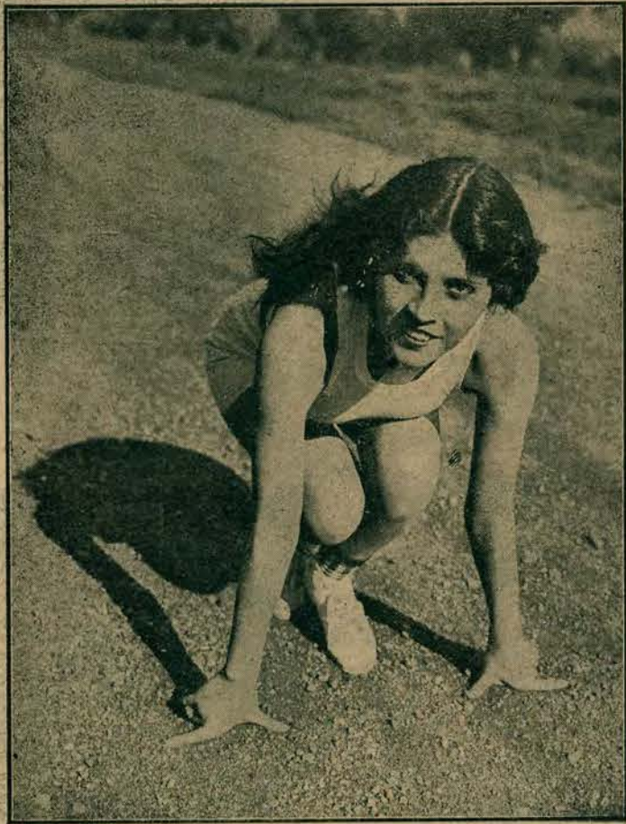
Olive Borden, głośna gwiazda filmowa, podczas treningu codziennego.