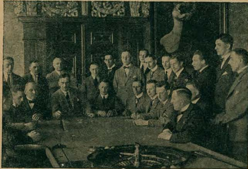
Jedna z sal słynnej jaskini gry w Sopotach.