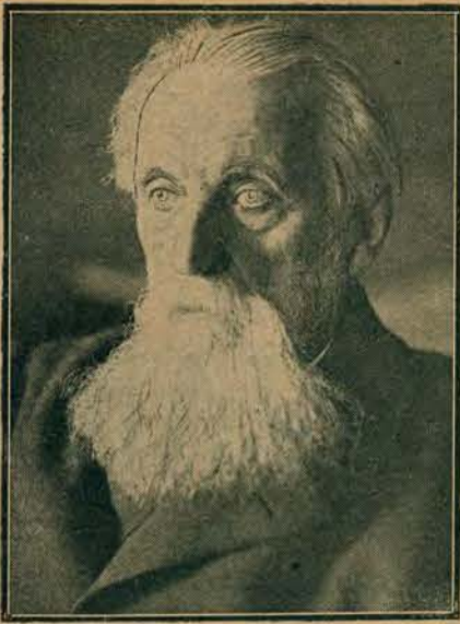
Aleksander Świętochowski, laureat nagrody literackiej m. Łodzi.