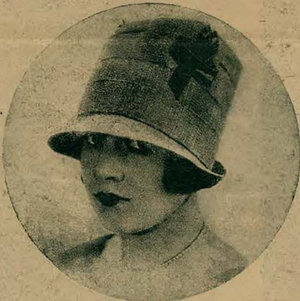
Kapelusik z różowej słomki. Z kapelusikiem tym harmonizuje sznur perel na szyi.