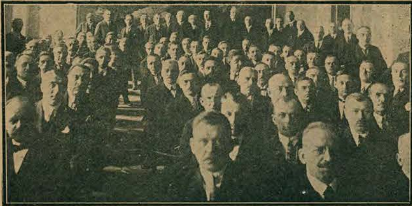
Otwarcie zjazdu delegatów zrzeszeń pracowników samorządowych miejskich we Lwowie. Na zdjęciu posiedzenie w sali Muzeum przemysłowego we Lwowie.