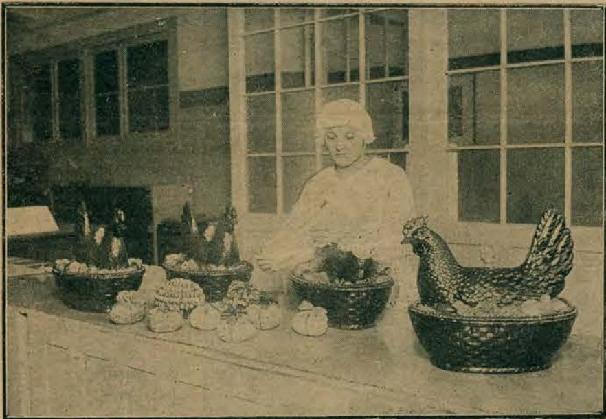
Przedświąteczne przygotowania na wielkanocny stół.