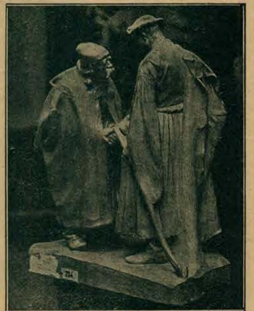
„Pożegnanie”, rzeźba w drzewie Jana Pasztorza