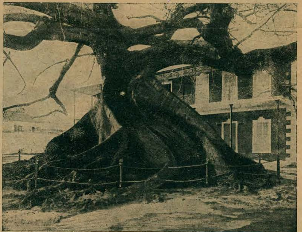
Kalifornia szczyli się największymi olbrzymami leśnymi. Na zdjęciu widzimy właśnie takiego olbrzyma leśnego przed jedną z term. kalifornijskich.