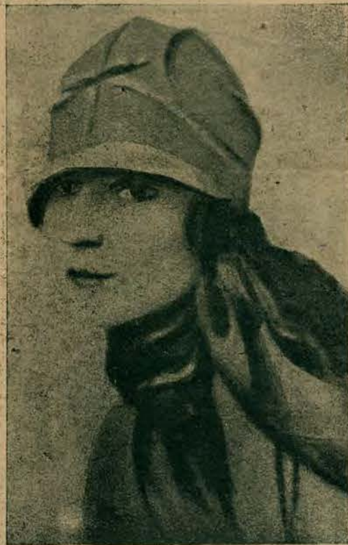
Najmodniejszy model kapelusza, który ostatnio jest noszony przez wszystkie eleganki paryskie.