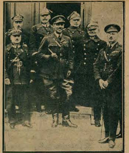
W Poznaniu odbyło się śniadanie wydane przez D-cę O. K. VII gen. Dzierżanowskiego na cześć ustępującego attaché wojskowego ambasady angielskiej płk. Claytona i jego następcy płk. Bridge.