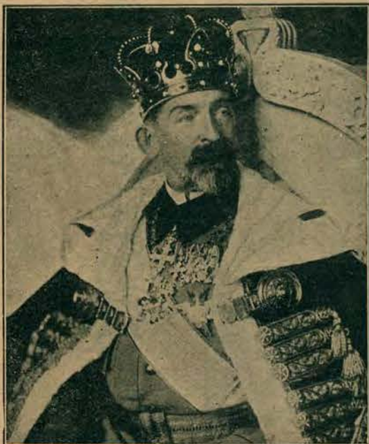
Król Ferdynand rumuński, którego stan zdrowia od dłuższego czasu jest tak zły, że lekarze uważają go za beznadziejny.