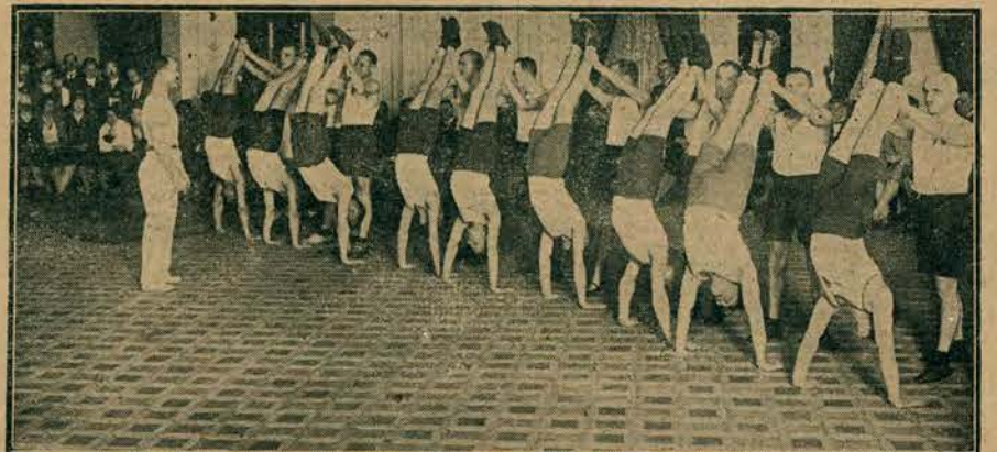
Dnia 7 kwietnia w lokalu Warszawskiego Tow. Wioślarskiego odbył się pokaz gimnastyki i sportu członków Towarzystwa. Zdjęcie nasze przedstawia członków sekcji sportowej w trakcie odbywania ćwiczeń gimnastycznych.