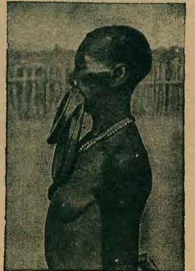
Elegantka murzyńska, o względy której napróżno ubiegają się setki czarnych Don Juanów.