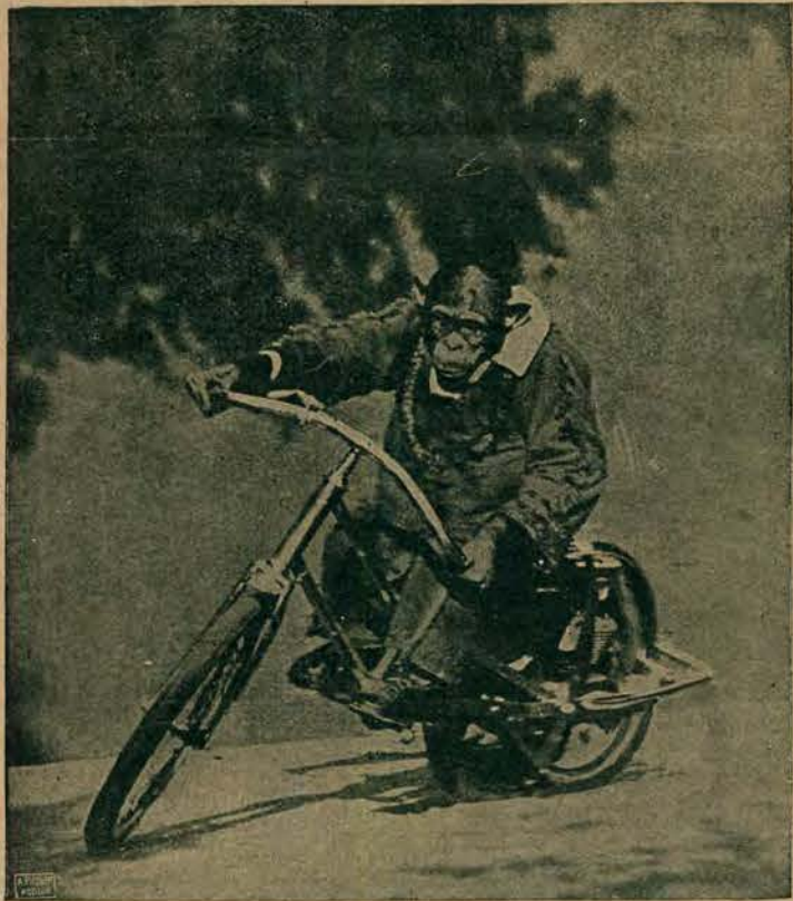
Małpa, mieszkanka jednego z ogrodów zoologicznych, korzysta ze świetnego środka lokomocji, jakim jest rower.