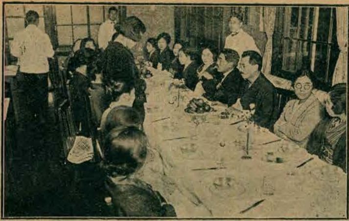
Zgromadzenie sufrażystek japońskich t. zw. „nowych kobiet”.