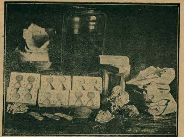
Fabryka fałszywych dwuzłotówek w Będzynie przy ul. Furmańskiej Nr. 20.