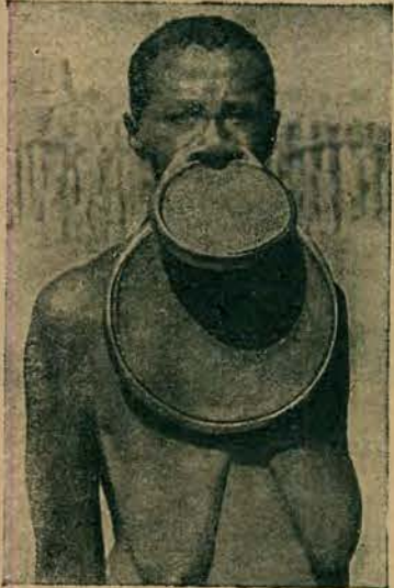
„Królowa piękności” Czarnego lądu.