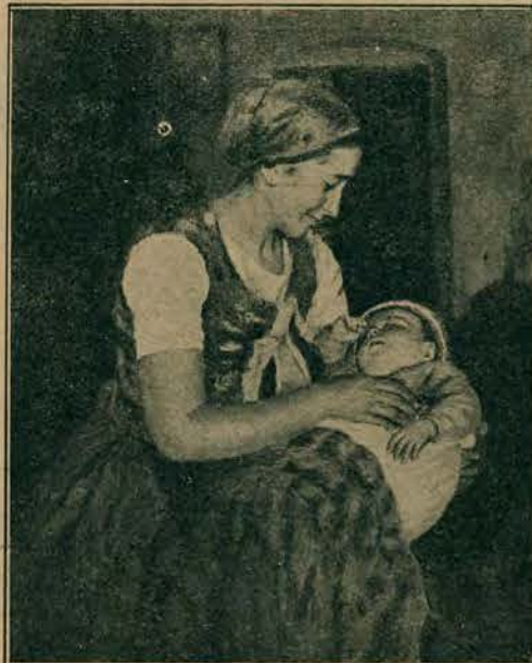
„Matka z dzieckiem”, Oskara Glatza.