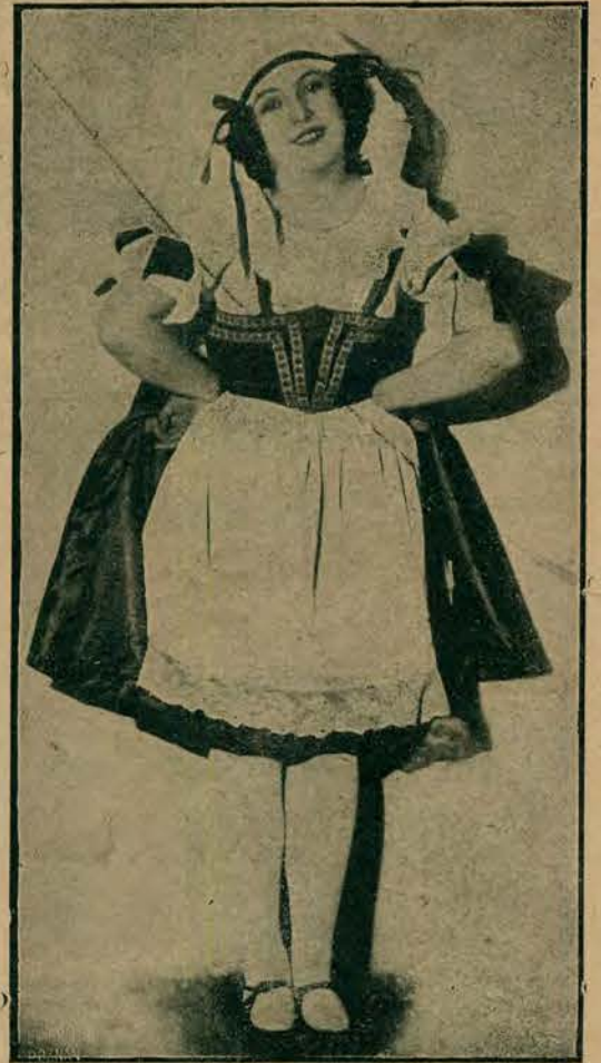
Leokadja Greloff, artystka baletu opery poznańskiej, świetna odtwórczyni tańców charakterystycznych.