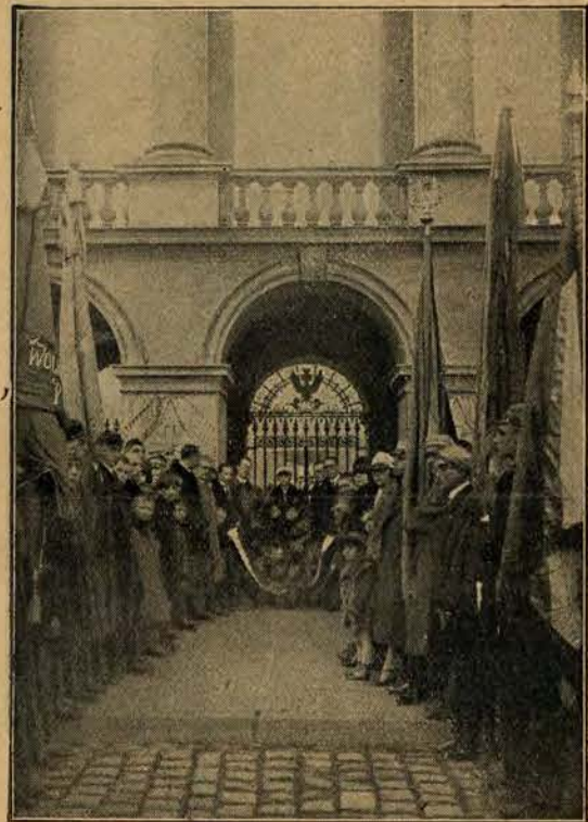
Złożenie wieńca na grobie Nieznajomego Żołnierza przez studentów w tygodniu akademickim.