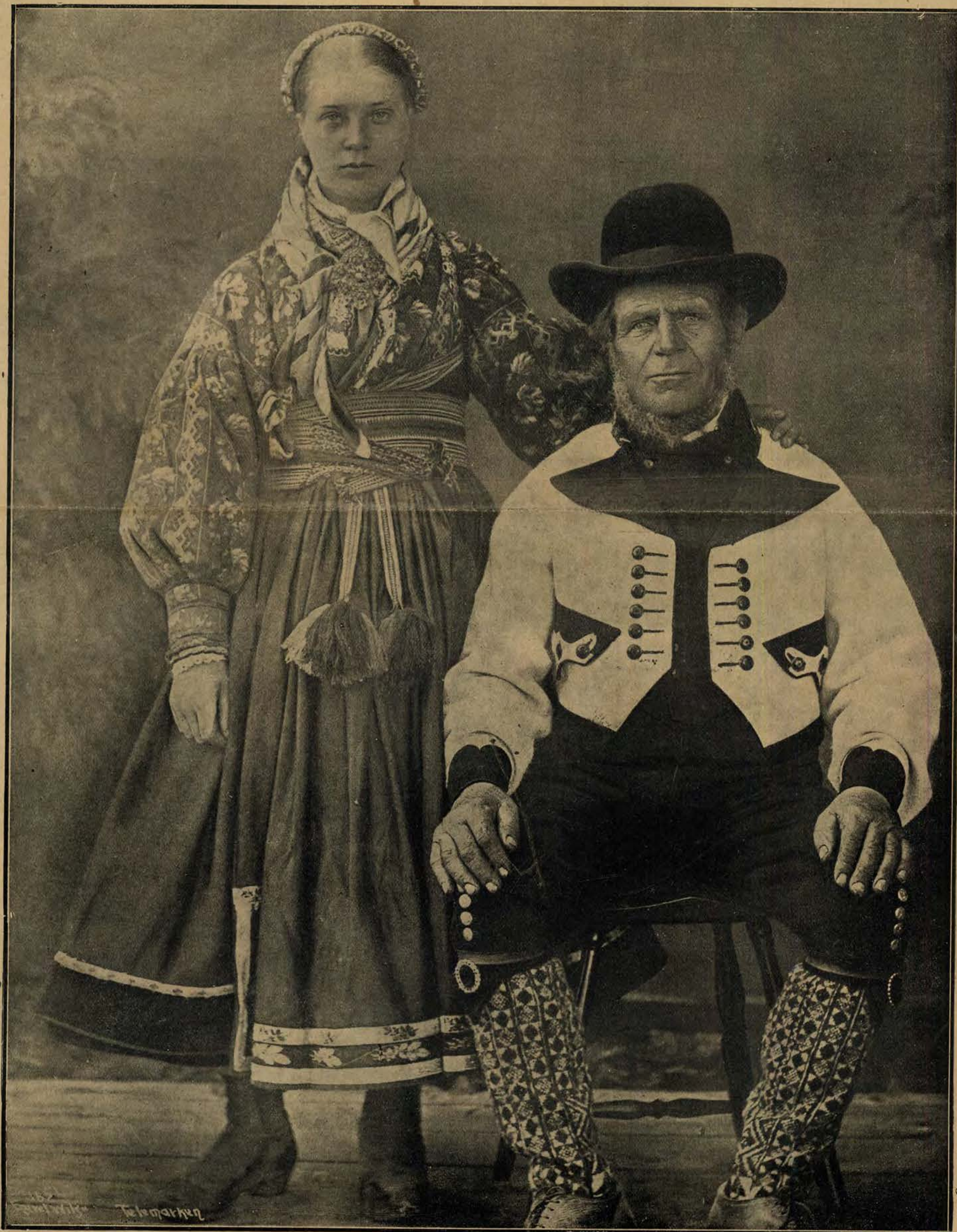
Typy ludowe norweskie, z okolic Telemarken, w malowniczych strojach ludowych.