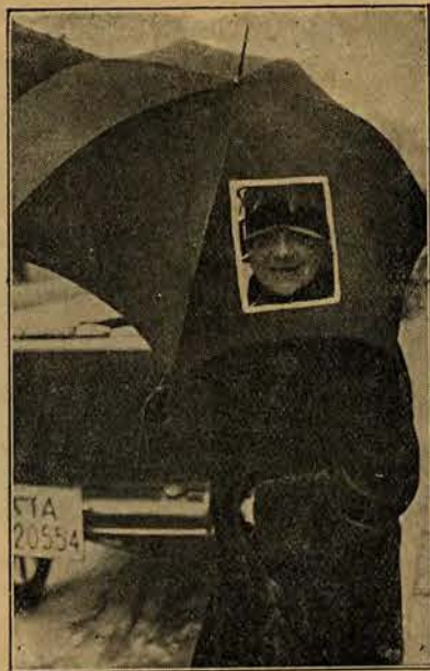
Berlin wprowadza modę parasolek z okienkiem.