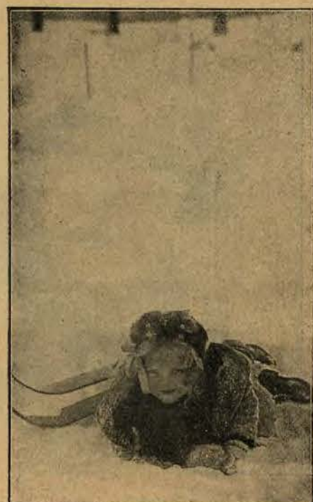
Wypadek podczas nauki jazdy na nartach nie należy do rzeczy najmniej przyjemniejszych.