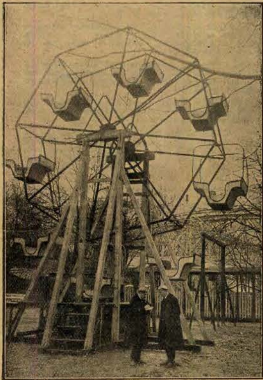
Tydzień Akademicki. Djabelski młyn w Łobzowiance.