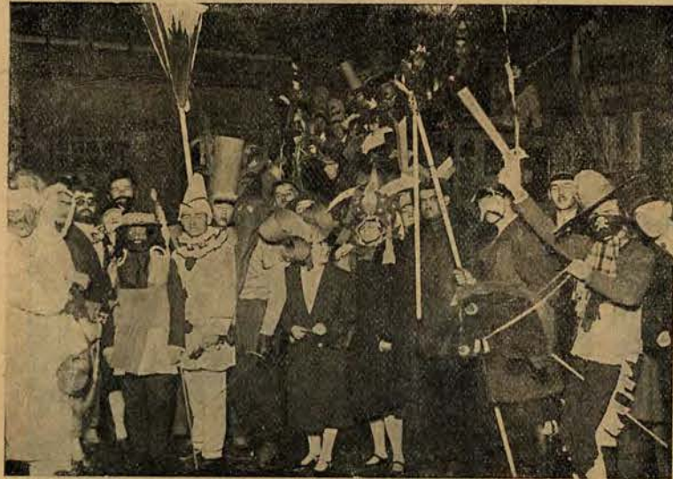
Pochód masek, zorganizowany przez Komitet „Tygodnia Akadem.”.