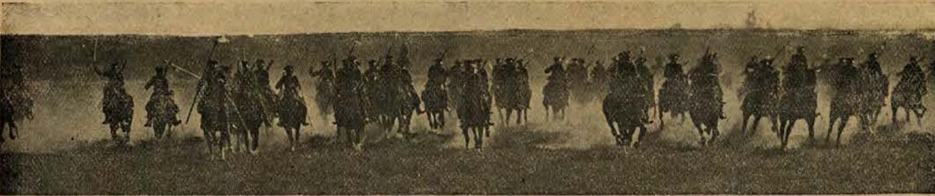
Na koniu czy bez konia.