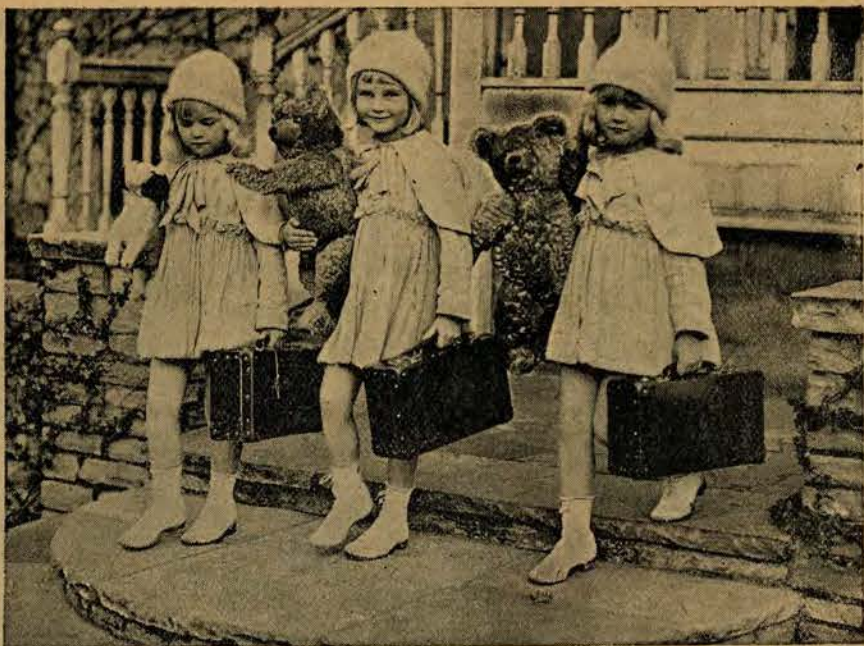
Trzy małe angielski przybyły do Hollywood, marząc o błyskotliwej karierze filmowej.