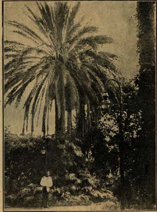
Park na Maderze.