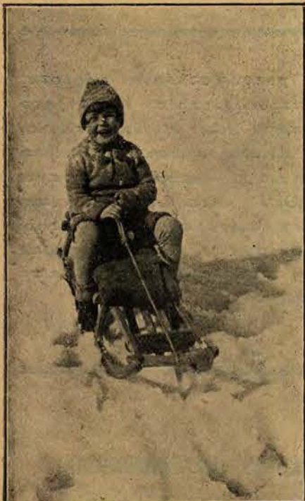
Norwegowie od lat dziecięcych zaprawiają się w sportach zimowych. Na zdjęciu młody Norweg podczas saneczkowania.