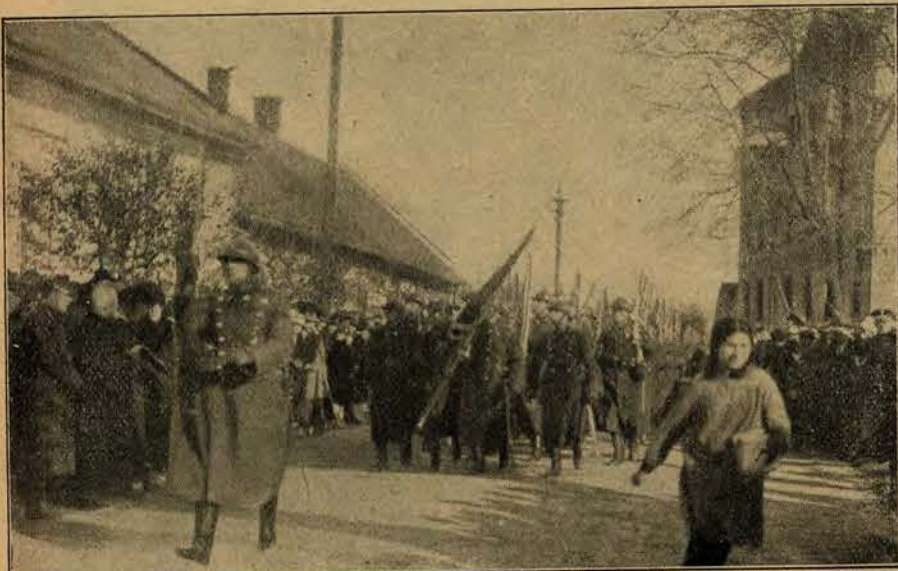
Defilada I P. S. P. przed władzami i generalicją w Nowym Sączu.