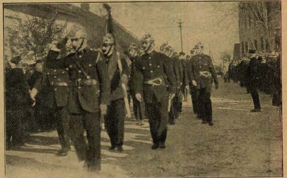
Defilada ochotniczej straży pożarnej przed władzami i generalicją w Nowym Sączu.