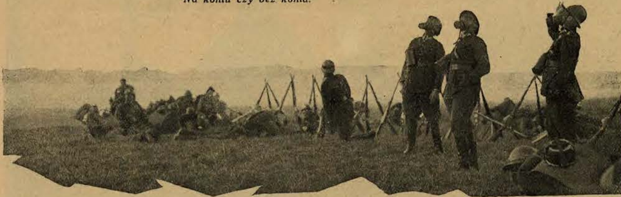
Nieprzyjaciół rzuca z aeroplanów bomby gazowe, żołnierze w okopach przywdziali maski.