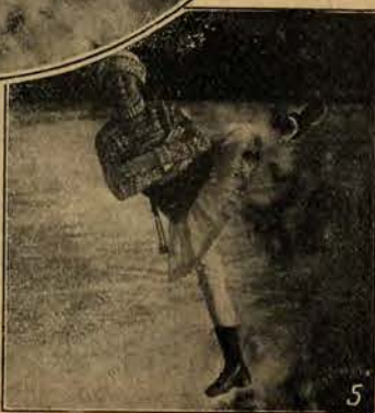
1. Zaprzęg reniferowy w górach norweskich. 2. Jazda na nartach za koniem, bardzo lubiana przez narciarzy. 3. Na terenach narciarskich w Nordmarkem w pobliżu Oslo. 4. Młodyciany mistrz narciarski. 5. Słynna mistrzyni łyżwiarstwa Sonja Henie.