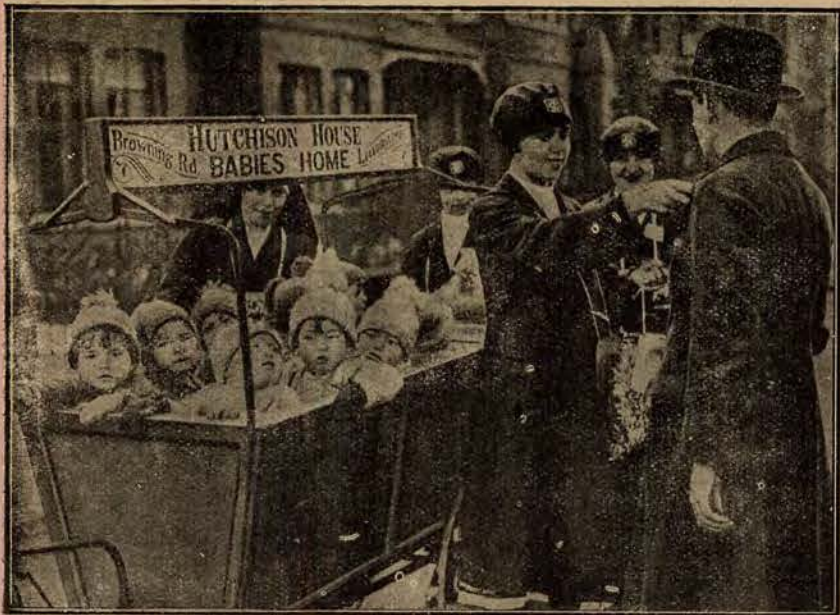
Pomysłowość Anglii. Uliczna zbiórka ofiar na sieroty, które w specjalnych wózkach wożone są po ulicach Londynu.