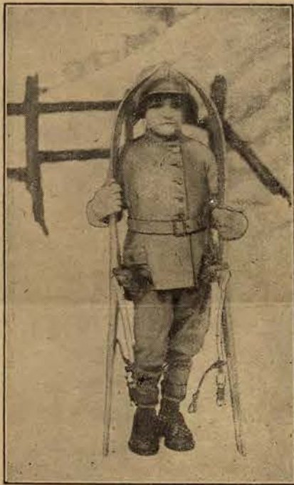
Najmłodszy narciarz w Anglii.