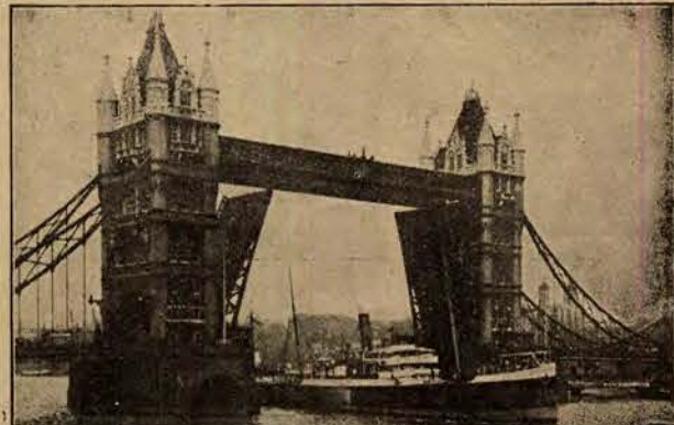
B. Tower Bridge.