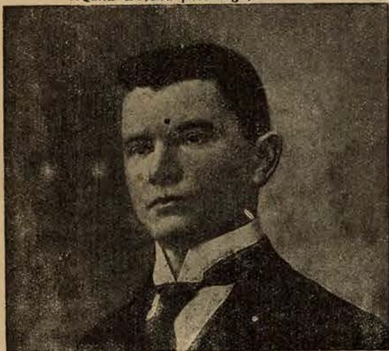
Premjer litewski Waldemaras, rosjanin, Niemiec, obecnie kowieński fałszywa, nieprzejednany przeciwnik Polski.