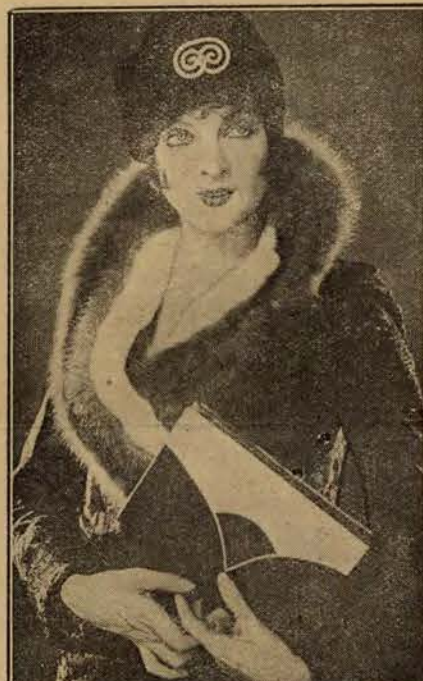
Tegoroczna moda zimowa nakazuje noszenie różnych kombinacji futrzanych. Przestrzegać tego mogą w pierwszym rzędzie dobrze zarabiające gwiazdy filmowe.