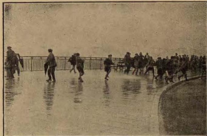
Zima w Nicei. Publiczność uciekająca z bulwarów przed atakiem burzliwego morza.