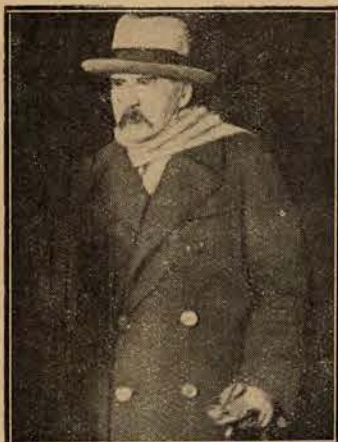
Przyjazd Marszałka J. Piłsudskiego z Genewy (w cywilnym ubraniu).