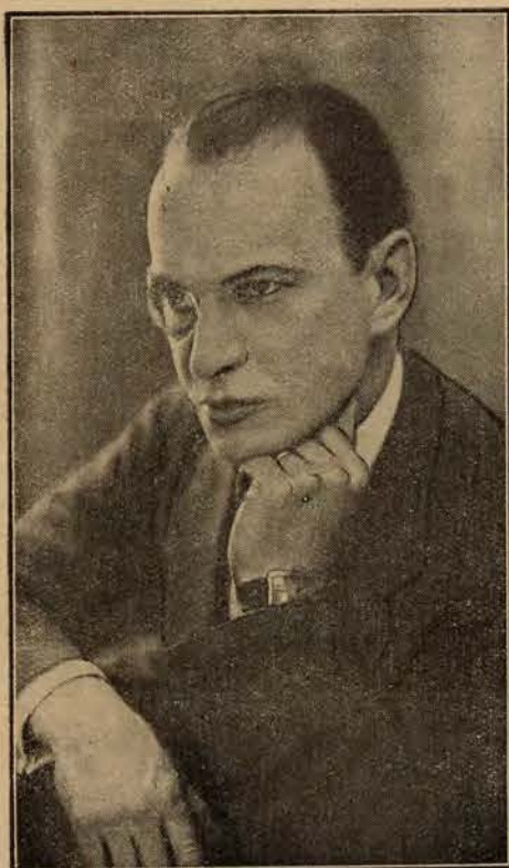
Wł. Ludwik Ewert, znany literat, jeden z wybitniejszych publicystów, powołany został z dn. 1 grudnia r. b. na odpowiedzialne stanowisko redaktora Naczelnego „Polski Zbrojnej” — organu wojska polskiego.