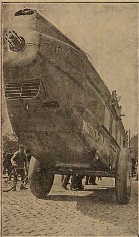
Transportowanie niemieckiego krążownika powietrznego przez ulice Berlina.