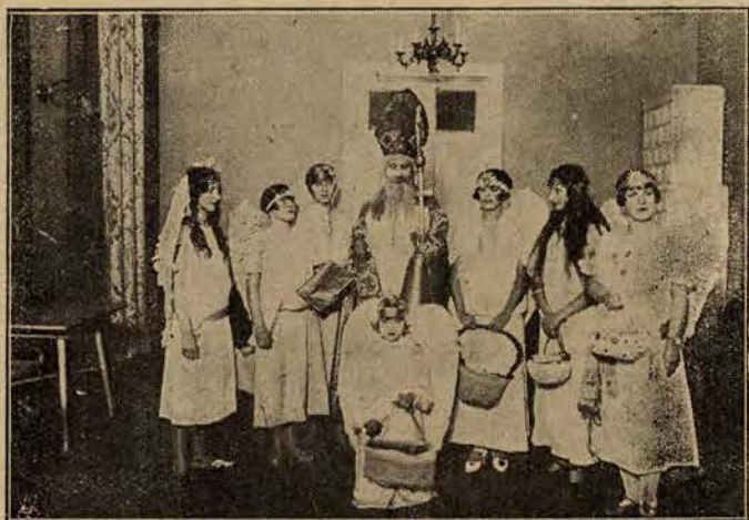
Tradycyjny obchód św. Mikołaja. Na zdjęciu wiadać przygotowywania podarunkowe.