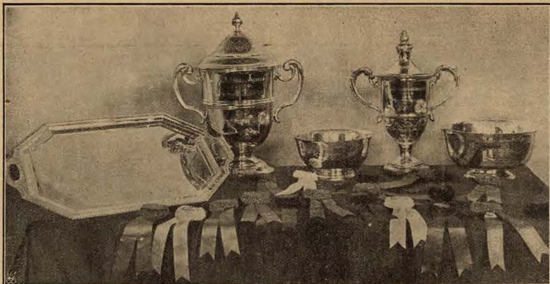
Nagrody zdobyte przez naszych znakomitych kawalerzyków na konkursach hippicznych w Nowym Jorku.