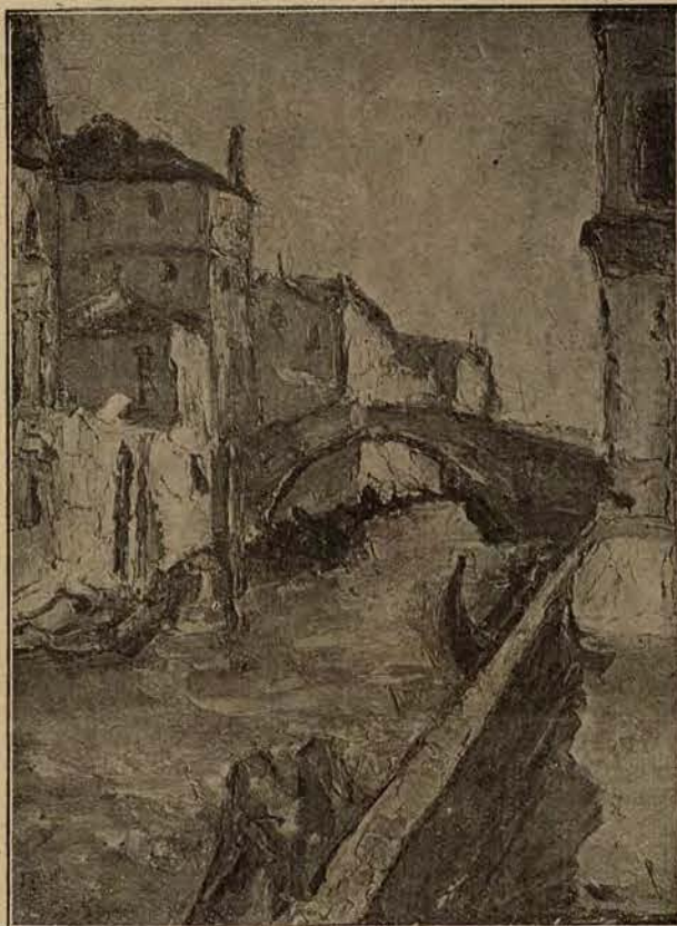
Ponte del Cavallo w Algierze