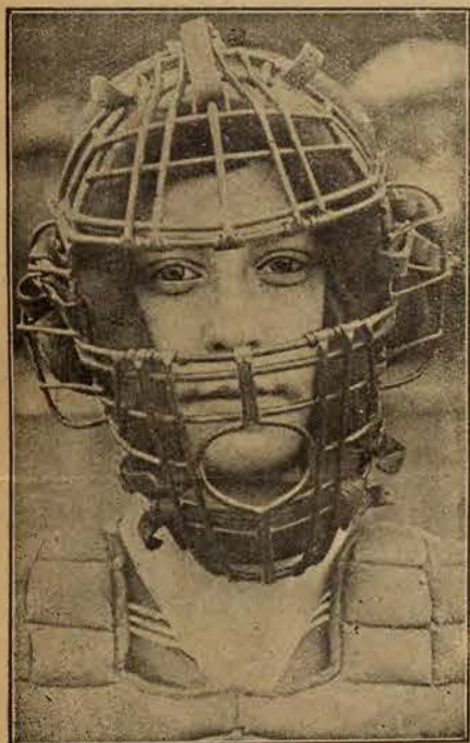
Najnowszy typ maski przy grze w piłkę.