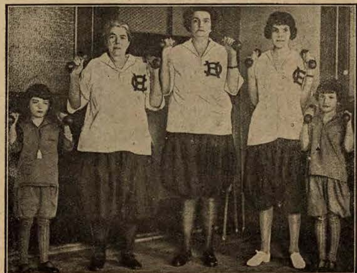
Ćwiczenia gimnastyczne uprawiane przez prababkę, babkę, matkę i dzieci.