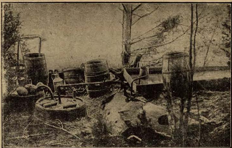
Tak wygląda tajna gorzelnia na „eksport”, wykryta w lasach nad granicą.