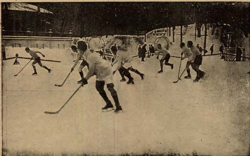
Gra w hokeja drużyny hokejowej A. Z. S., która wyjeżdża na objazd Europy.