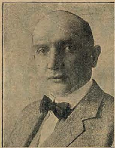
Minister A. Zaleski — z listy Nr. 1.