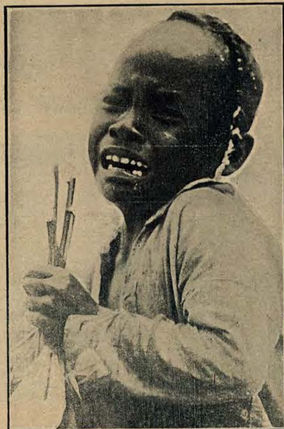
Na uprzejmą prośbę fotografa o „przyjemny wyraz twarzy” mały mieszkaniec Sumatry tak zareagował.