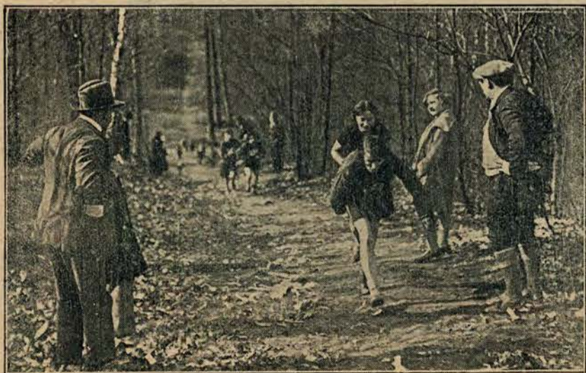
Finish francuskiego damskiego biegu naprzelaj w St. Cloud przed Paryżem.