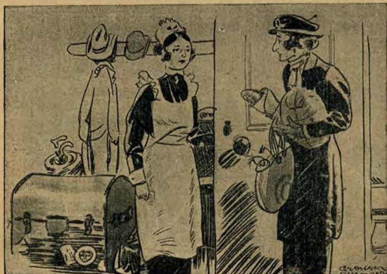
Właścicielka pensjonatu do służącej: „Czy nasza nowa lokatorka jest piękna?” „Tak, nawet bardzo”. „A, to w takim razie proszę położyć słomiankę przed lustrem, gdyż ona dywanik za bardzo zniszczy”.