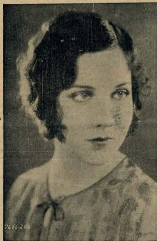
Jedna z najpiękniejszych mieszkanek m. Hollywood.