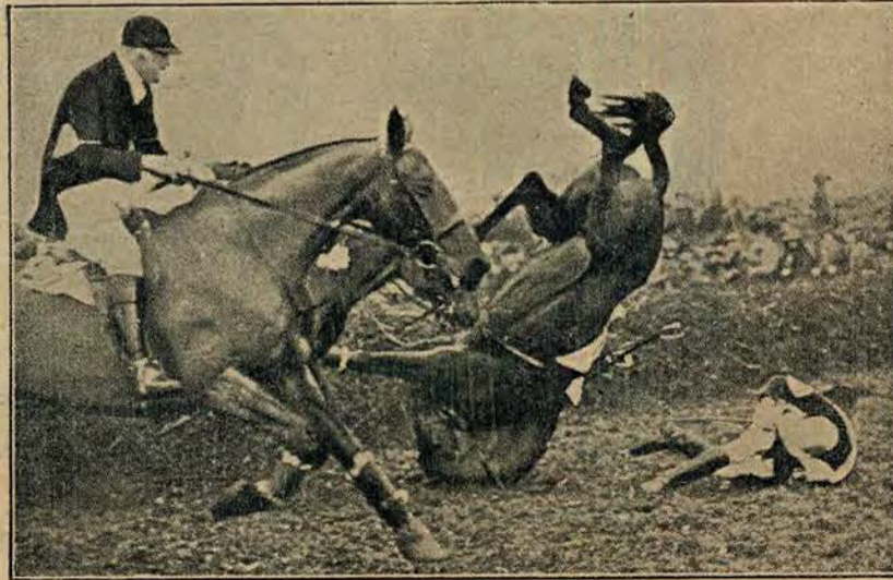
Z wyścigów oficerskich w Londynie: koń wyracający kozła na przeszkodzie.