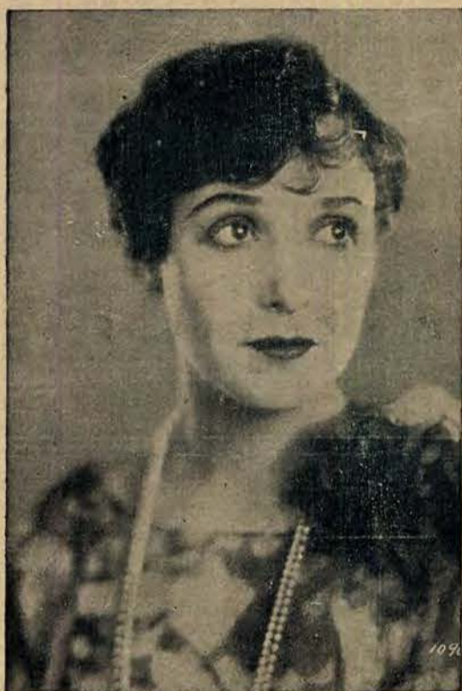
Florencja Vidor, utalentowana artystka filmowa.