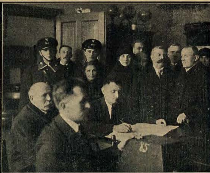
Głosowanie w lokalu 85 obwodu na Pogoni.