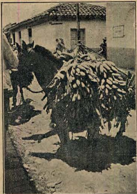
Transportowanie bananów z plantacji do składów.