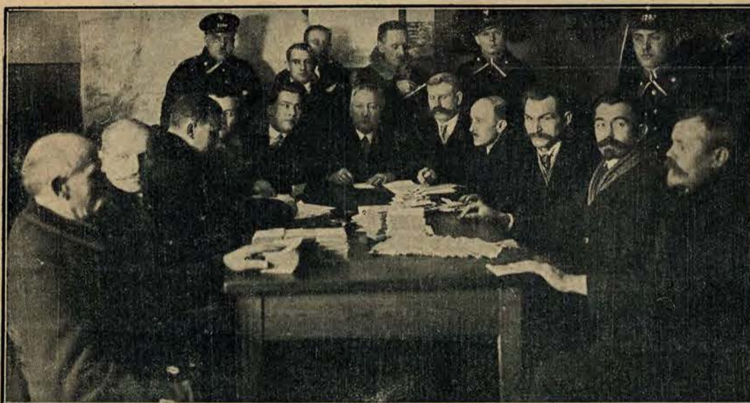
Obliczanie głosów w lokalu 85 obwodu na Pogoni.