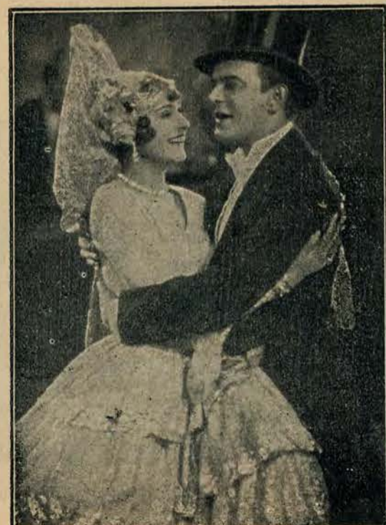
Fragment filmu „Dorma“ z Ernstem Verbesem..