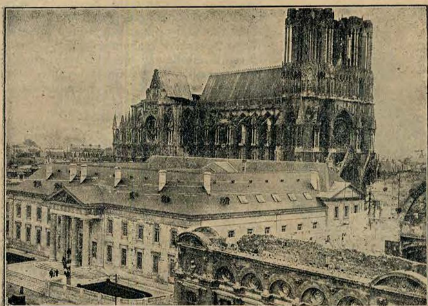
Katedra w Reims została już całkowicie odbudowaną po zniszczeniu jej w czasie Wielkiej Wojny.