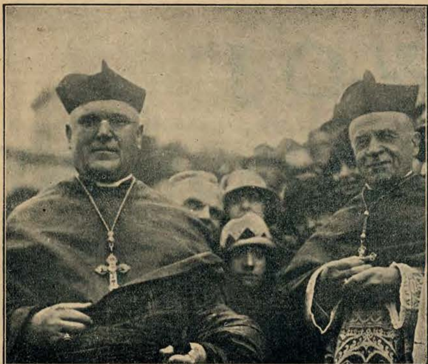
Z pobytu J. E. ks. Kardynała Kakowskiego w Paryżu: zdjęcie przed kościołem Sacré Coeur w Paryżu.