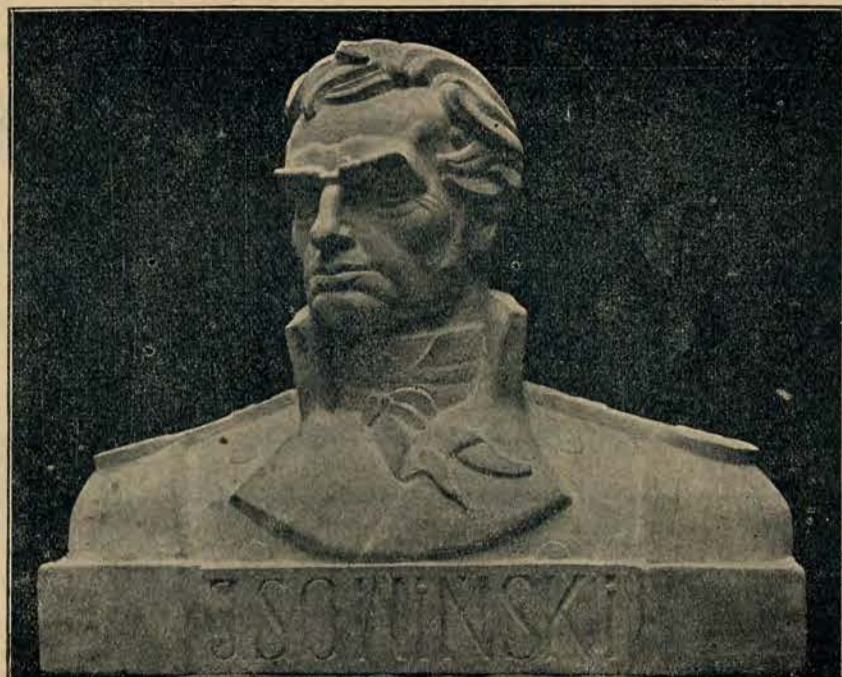
General Józef Sowiński (1-sza nagroda) A. Żurakowski.