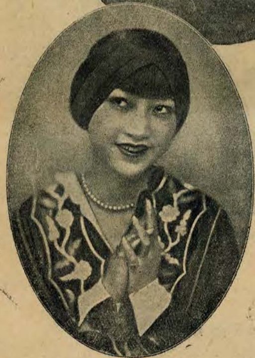
Chińska gwiazda filmowa Anna May Wong. Stroje przedstawicieli amerykańskiej plutokracji w Atlantic City.