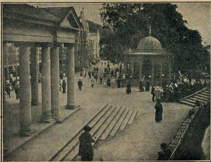
Aleja „Křížového pramene“.

Marjenbad, którego źródła alkaliczno-solankowe i cudna przyroda ściąga corocznie tysiące pragnących zdrowia i wypoczynku.