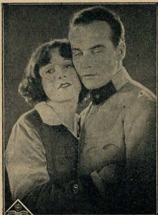
Fragment filmu „Strzelec CesarSKI“ z Igo Symem, naszym rodakiem.