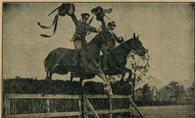
Akrobaticzne popisy angielskich żołnierzy.