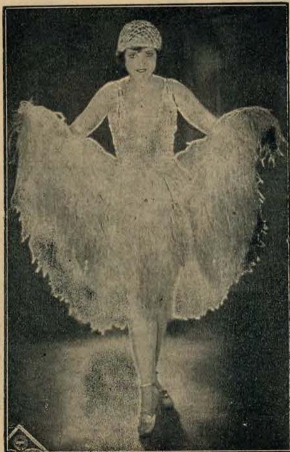
Fay Marbe w filmie „Dolar, serce i przypadek“.