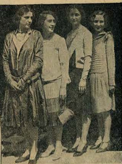
Europejskie laureatki piękności: Miss Italia, Belgja, Francja i Anglja, jadą walczyć w Ameryce o palmę pierwszeństwa.