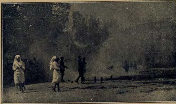
Patrol sanitarny rusza na stanowisko podczas pokazu wojny gazowej.