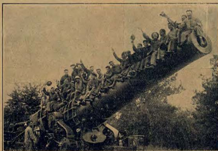
16-calowe działo kolejowe na manewrach w Fort Story w Wirginji.

NAJLEPSZE KSIĄŻKI! DZIAĆ BEZ PŁ. PROSPEKTÓW. WARSZ. KREDYTOWA. 1.