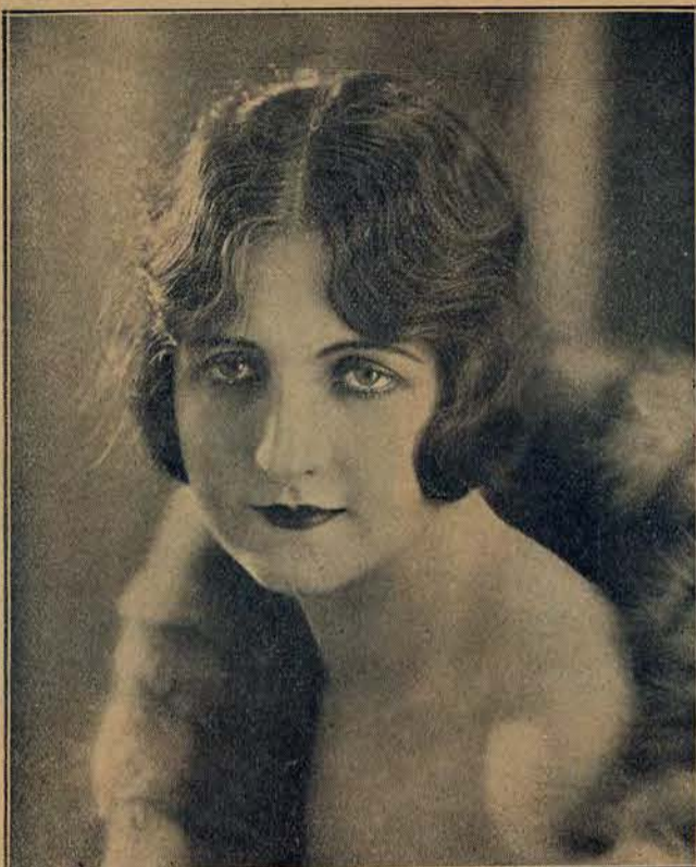
Znana gwiazda filmowa, Jadwiga Smosarska, została zaangażowana do teatrów Miejskich w Warszawie.