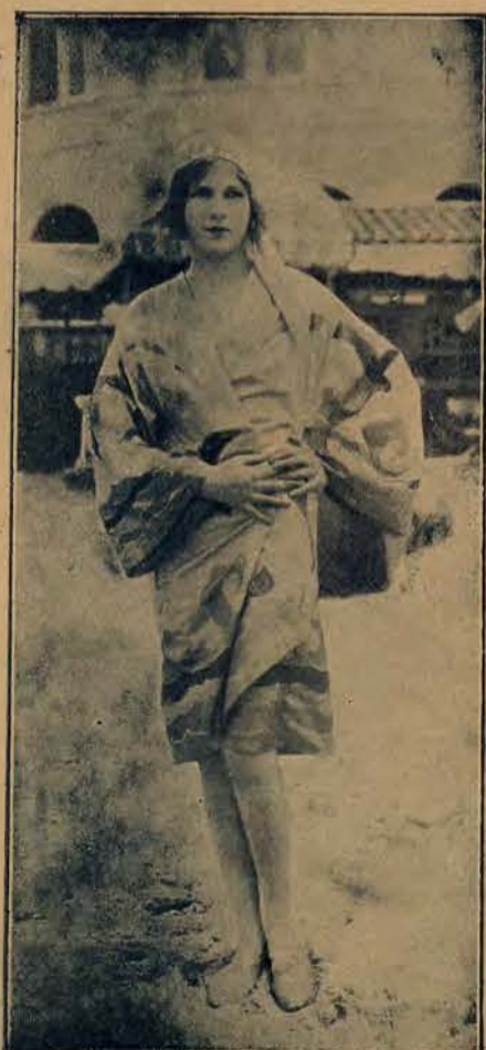
Najmodniejszy kąpielowy płaszcz używany przez amerykanki.