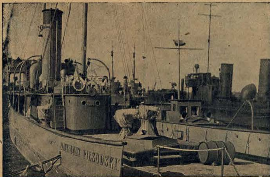
Kanonierka „Komendant Pilsudski” na postoju w porcie wojennym w Gdyni.