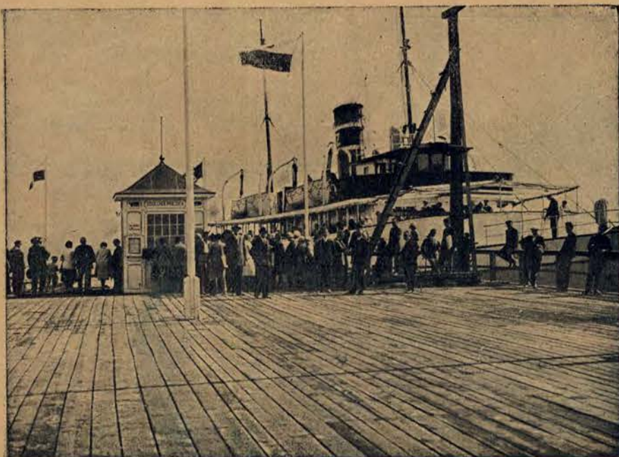
Przystań w Gdyni.

Nasze wybrzeże z dniem każdym rozrasta się i rozbudowuje. Nasz port Gdynia osiągnął już roczny przeladunek taki, jaki miał Gdańsk w roku 1913, t. j. 2.000.000 tonn rocznie. Obecne bandery coraz to częściej ukazują się w Gdyni, wiaac też i polską banderę na statkach radziowej „szkoly roskiej”.