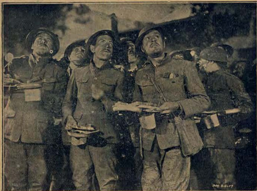
Filmy wojskowe mają teraz coraz to większe powodzenie. Obok podajemy fragment filmu p. t. „Bohaterka Wielkiej Wojny”.