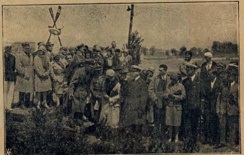
Otwarcie przystani Yacht-Klubu Warszawskiego.