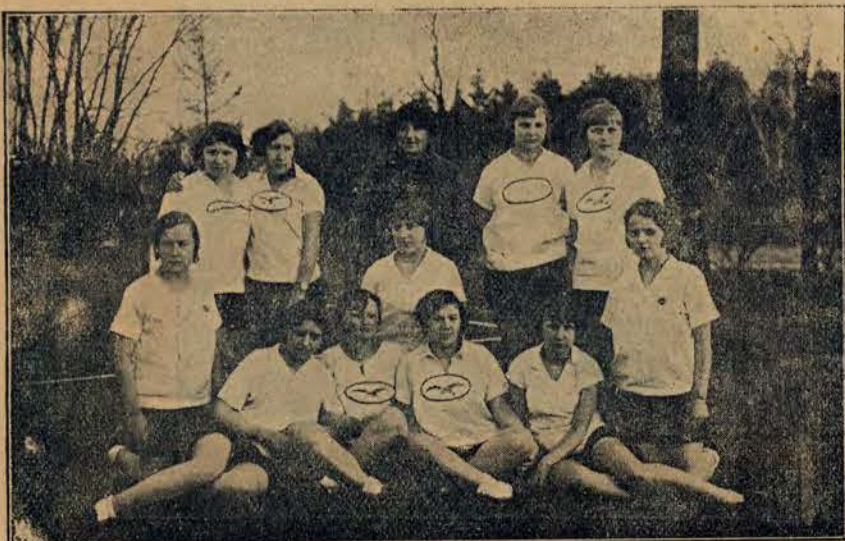
Drużyna „Hazeny” gniazda sokolego przy ul. Skierniewickiej w Warszawie