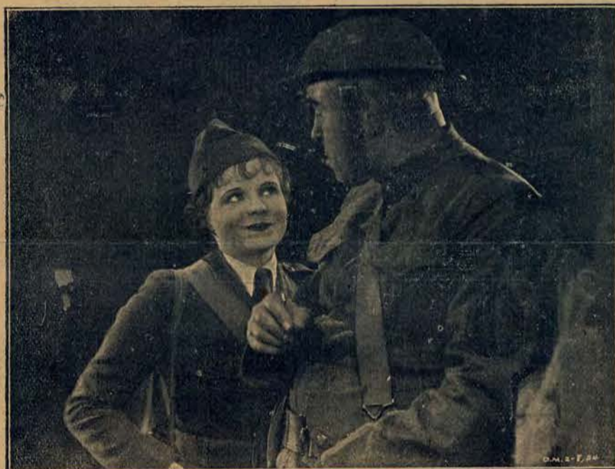
Vera Keynolds, jako „Bohaterka Wielkiej Wojny” w pięknym filmie amerykańskim.