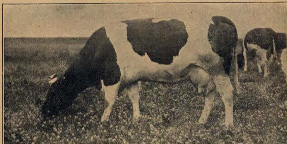
Piękny okaz krowy.