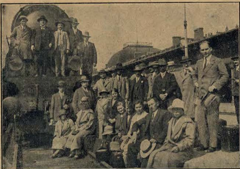
W dniu 22 lipca przybyła do Warszawy wycieczka Polaków z Danji, która ma zwiedzić najważniejsze miasta polskie.