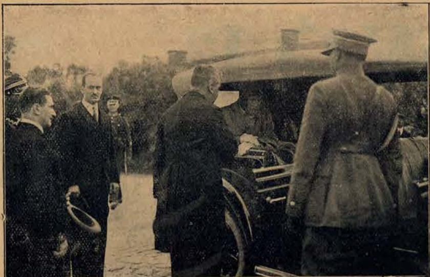
P. Prezydent Mościcki witany przez wojewodę poznańskiego hr. Borkowskiego na granicy województwa.