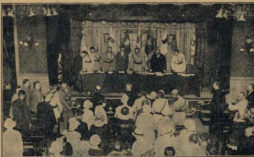
W Paryżu w sali Societes Savantes odbył się Kongres Związku Hallerczyków, któremu przewodniczył gen. Józef Haller.