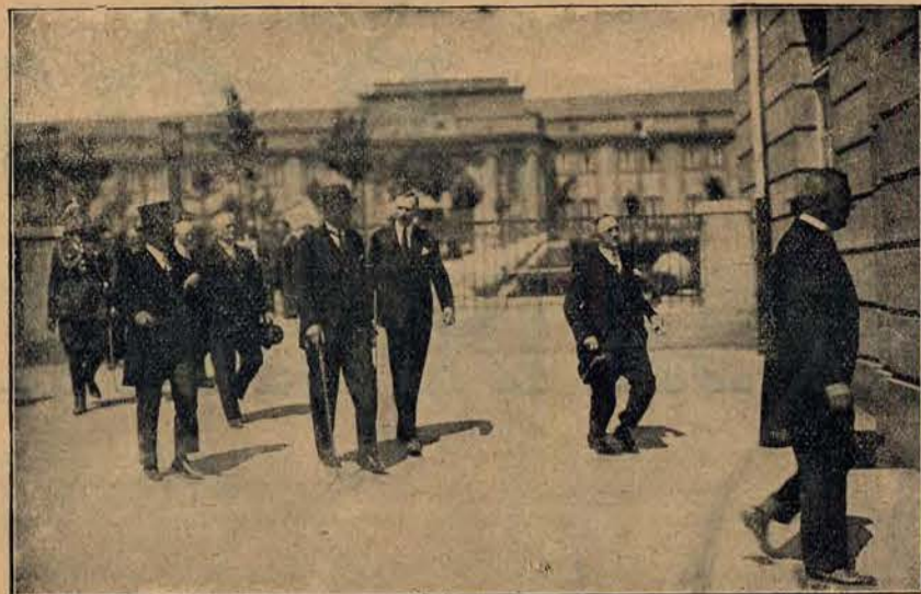
P. Prezydent Rzplitej zwiedzał w Poznaniu główne tereny wystawowe Wystawy Powszechnej Krajowej.