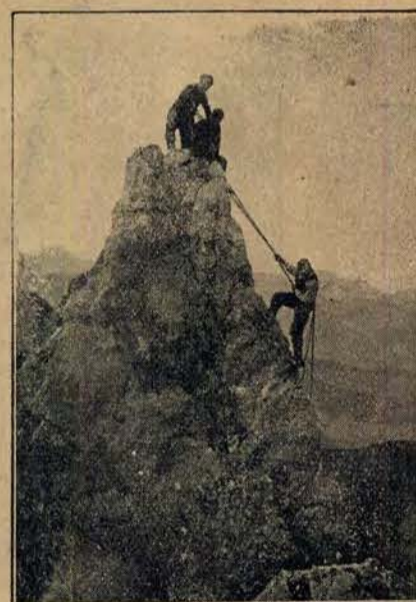
Karkołomne spacery alpinistów.