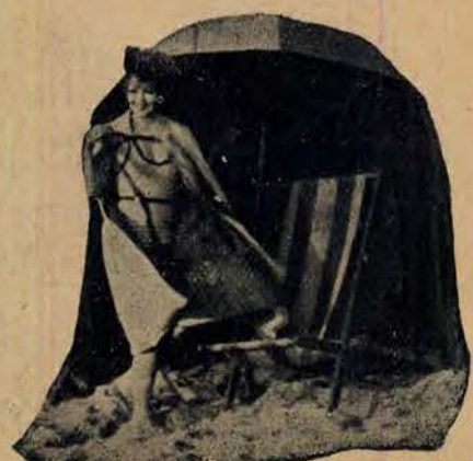
„Mój mały buduar na plaży”...