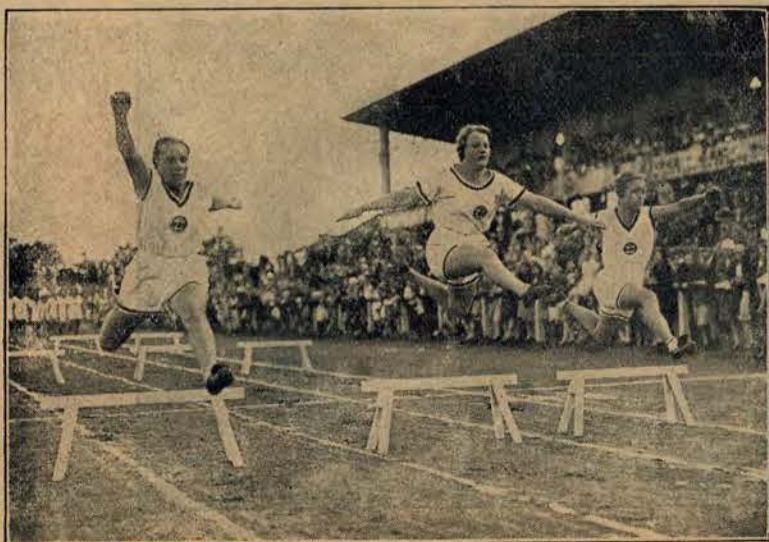
Eliminacyjne zawody pań w Estonji przed Olimpiadą.