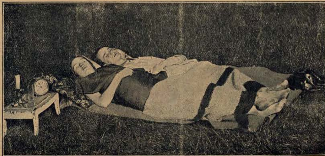
Oryginalna sypialnia pod gwiazdami na przedmieściu jednej ze stolic.