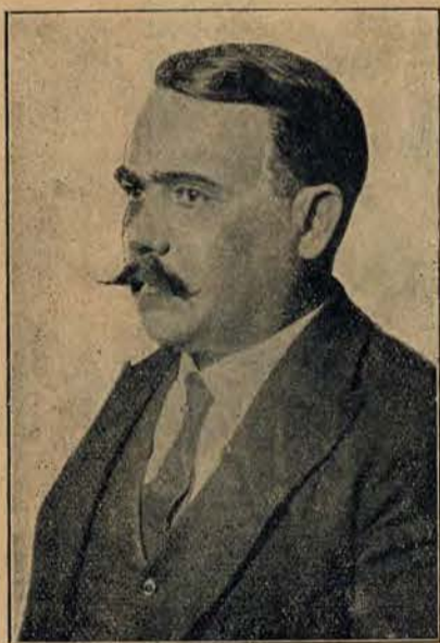
Zamordowany prezydent Meksyku gen. Obregon.