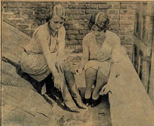
Jajko, smażące się na rozpalonym dachu w Londynie.