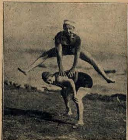
Wesołutko bywa latem na plaży.