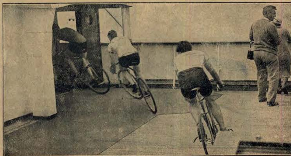
Na okręcie, płynącym do Holandji, kolarze amerykańscy trenują z uczestnikami Olimpiady.