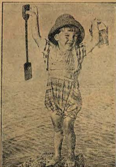
Temu upały nie szkodzą.

Za jeden złoty tygodniowo każdy nasz abonent może mieć