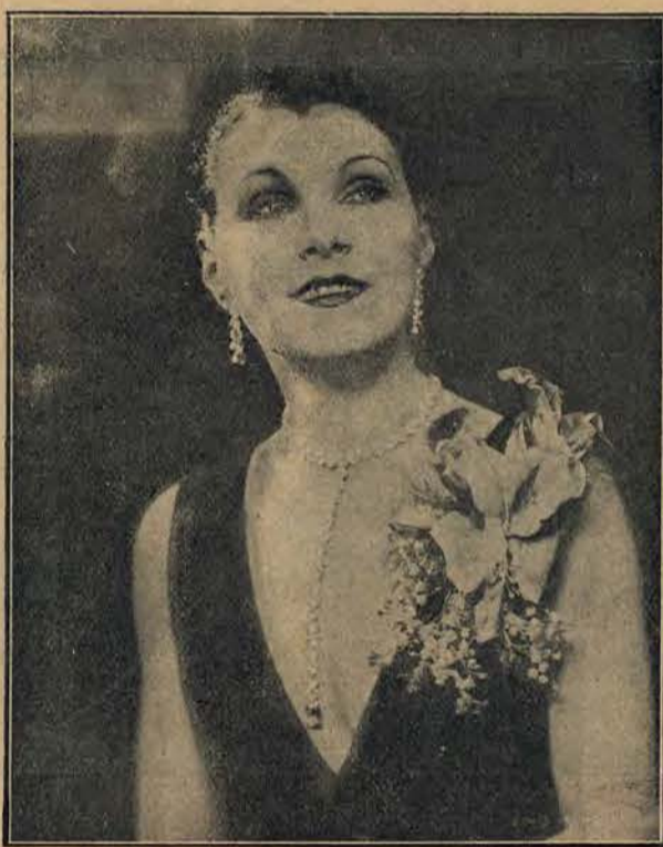
Leatrice Joy, artystka filmowa, którą ujrzymy jako „Pieszczotkę” i w filmie „Droga do piekła”.