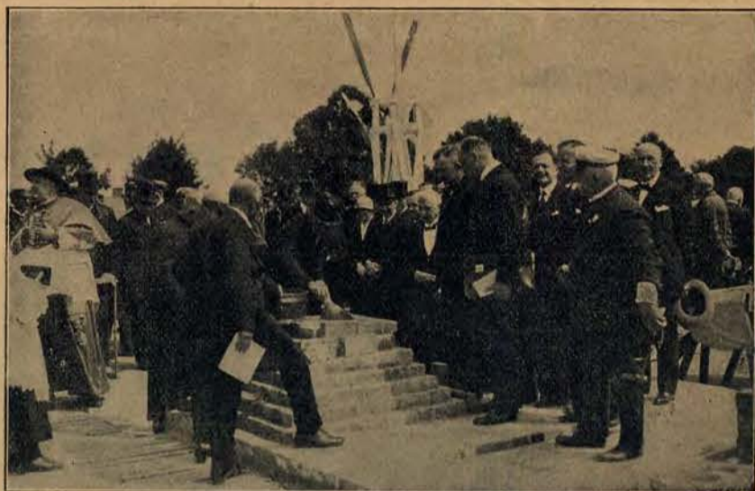
Wmurowanie kamienia węgielnego pod szkołę handlu morskiego i techniki portowej w Gdyni.