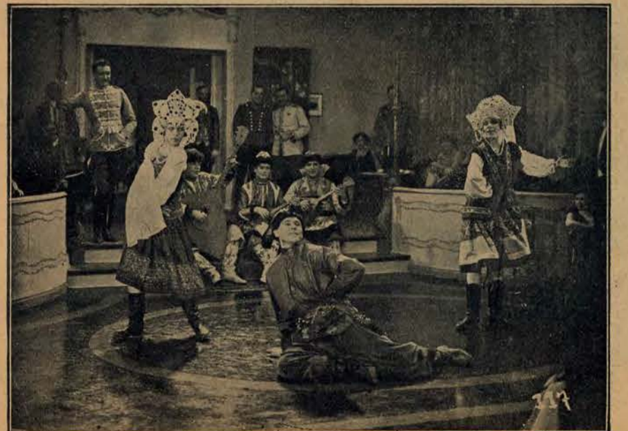
Scena w kabarecie w filmie „Tajemnica twierdzy w Dęblinie”.