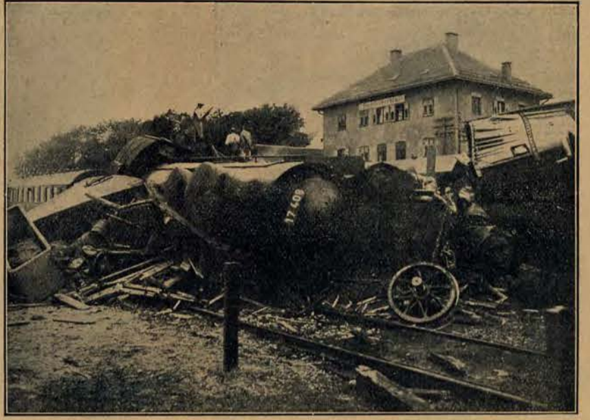
Katastrofa kolejowa w Dinkelscherben, w której zginęło 17 osób, a 33 osoby odniosło rany.