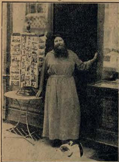
W Wogezach w m. Plombiers zamieszkuje p. Delait posiadająca bujną brodę i wasy.