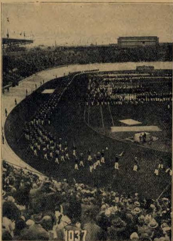
Sportowcy 44 narodów na stadionie amsterdamskim.