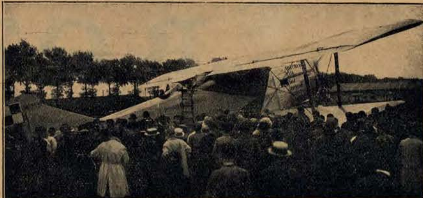
Samolot „Marszałek Piłsudski” przed startem.