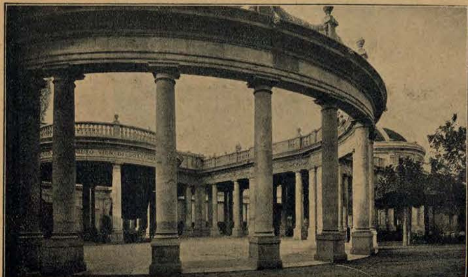
Wspaniałe stabilimento „Tettuccio” w Montecatini, które w ostatnich latach stanęło w pierwszym rzędzie widowisk świata.