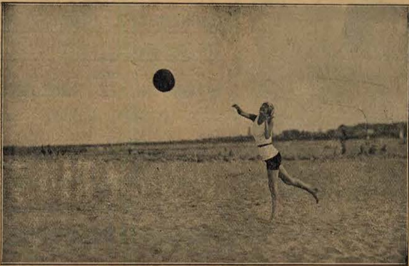
Wspaniały rzut piłką.