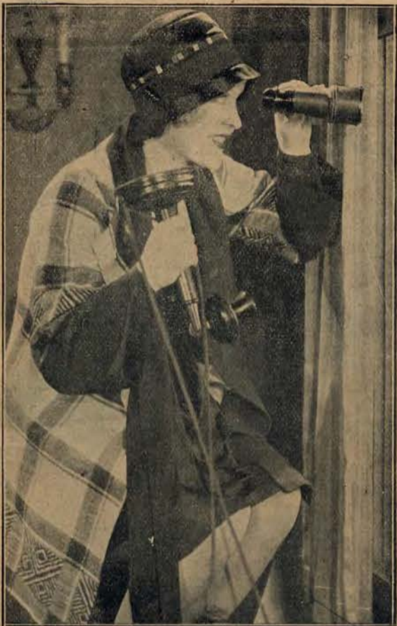
Zapalona wielbicielka wyścigów konnych.