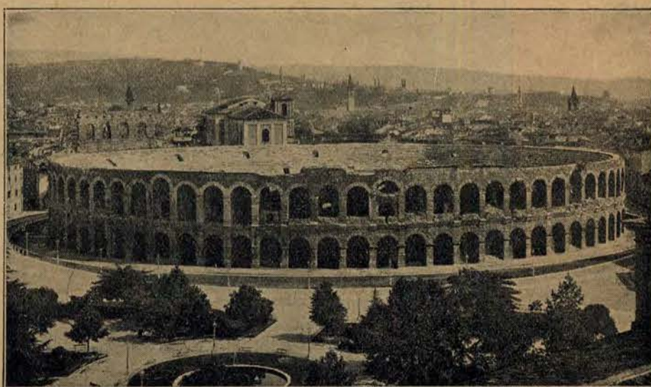
Starożytny amfiteatr w Veronie, gdzie odbyły się obecnie wspaniałe przedstawienia operowe „Verona” Boito i „Turandot” Pucciniego z udziałem kilkuset osób