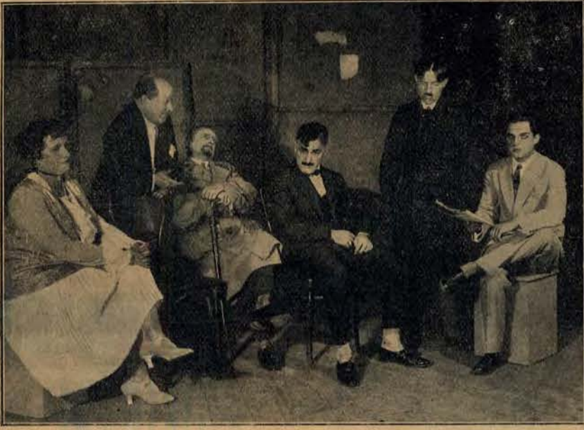
Teatr Polski gra z powodzeniem czeską komedię Kurta „Goetza” p. t. „Hokus-Pokus”.