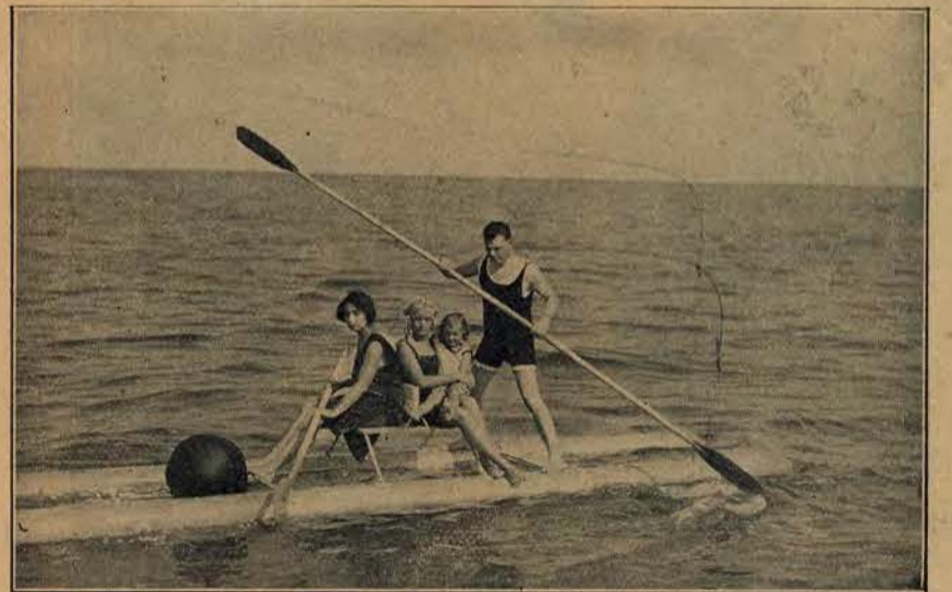
Przejażdżka na nartach wodnych.