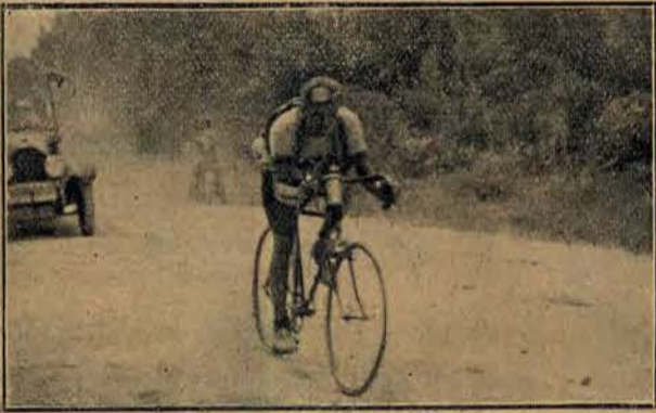
Fröss na 216 kilometrów ucieka grupie czołowej i prowadzi sam przez dalsze 110 klm.