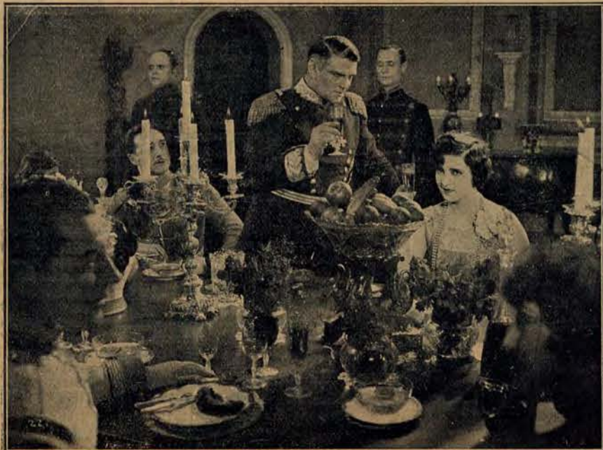
Scena bankietu w filmie „Tajemnica twierdzy w Dęblinie”.