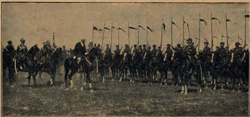
P. Prezydent Rzplitej przed frontem 15 pułku ułanów w Poznaniu.