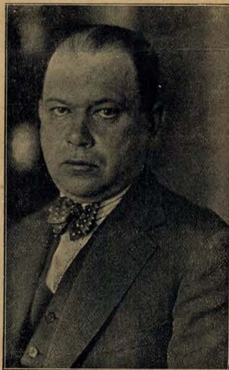
Prof. Władysław Skoczylas otrzymał 3-cią nagrodę w dziale malarstwa.