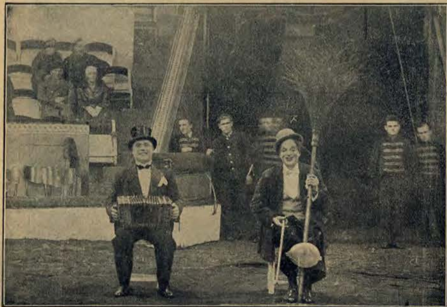
Bim - Bom, ulubieńcy publiczności.