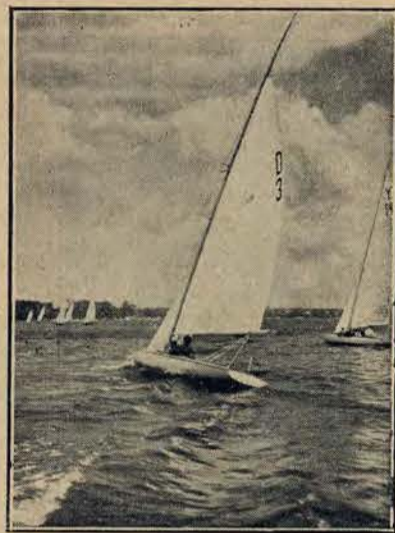
Regaty żaglówek na m. orzu Niemiec.