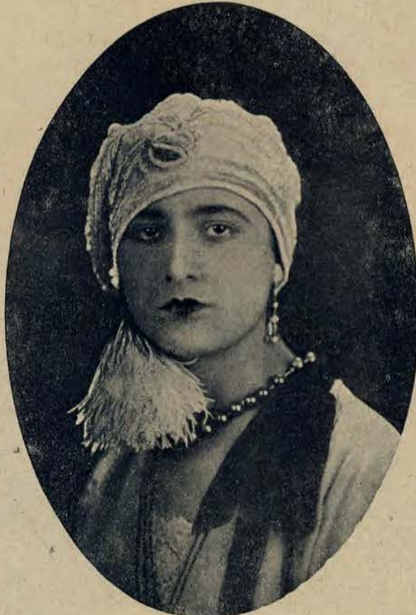
Dwa arcygastowne kapelusze zimowe.