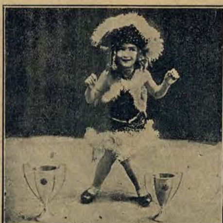
Pięcioletnia gwiazda choreograficzna Nowego Jorku, nagrodzona 40 nagrodami.