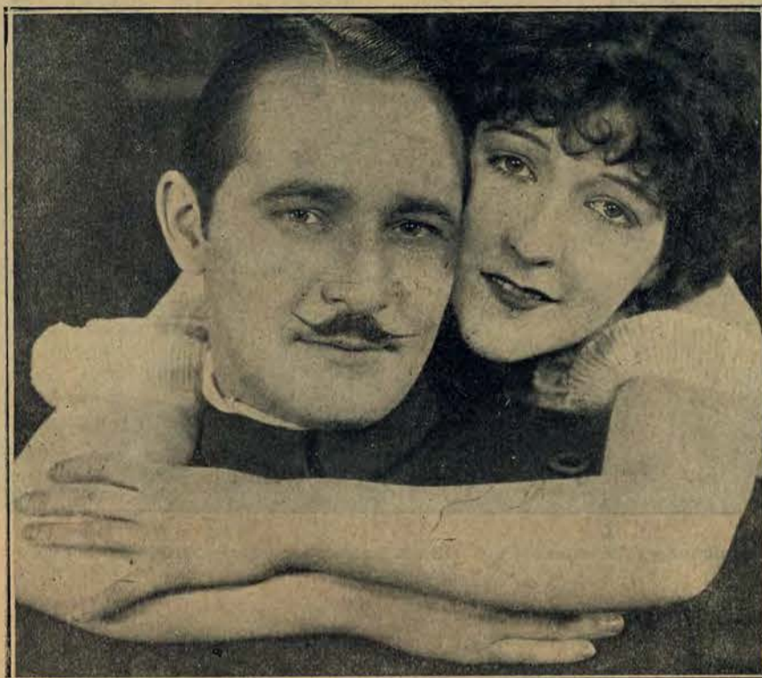
Norman Keory i Ailen Pringle w filmie „Ciało i dusza”.