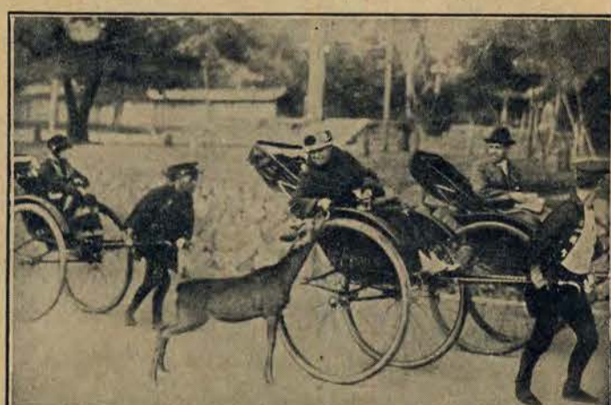
Na ulicach japońskiego miasta Nara widuje się gajele, uważane tam za święte zwierzęta.