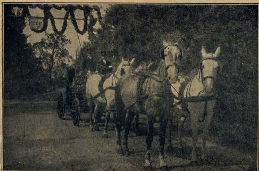
Tak rzadko widziana w obecnej dobie czwórka w zapreżu.