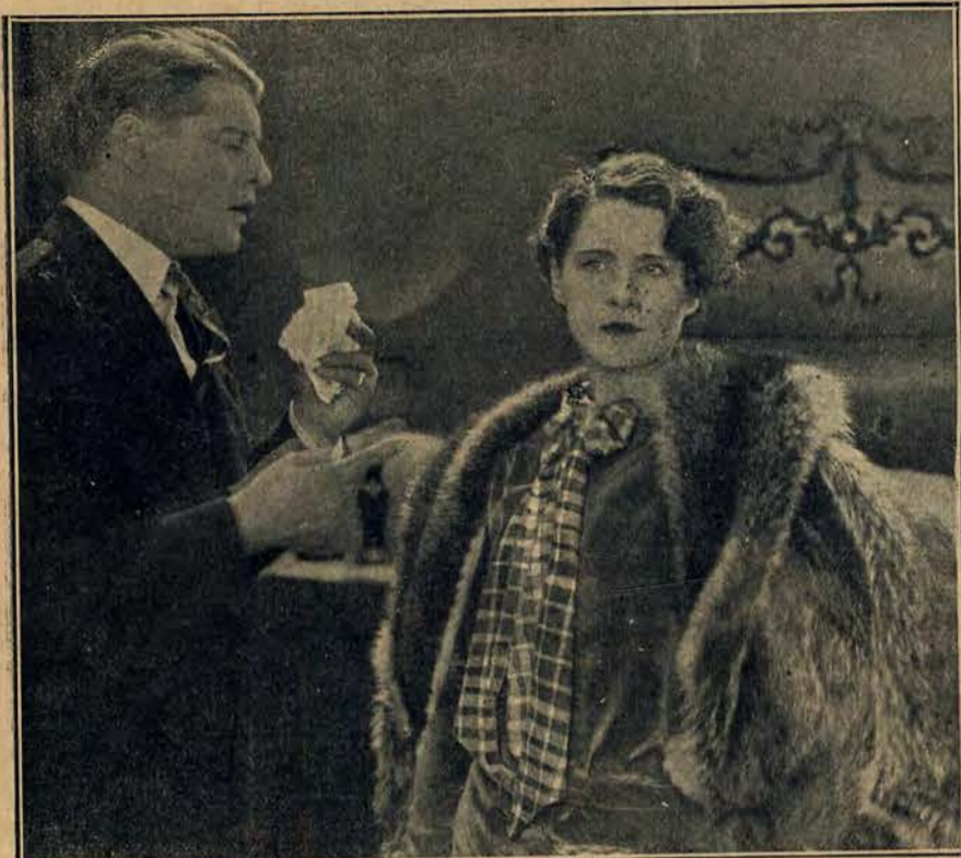
Norma Stearer i Ralph Forbes w filmie „Kobieta a interes”.