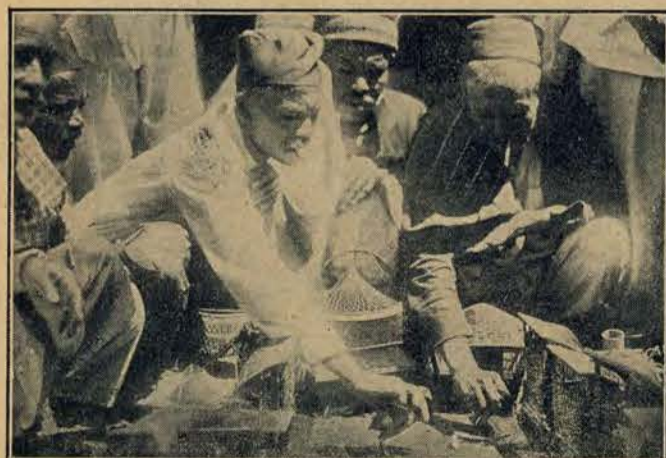
Walka kogutów przepiórek, ulubiony sport mieszkańców Sumatry.