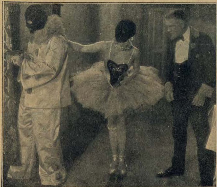
Fragment słynnego filmu z Lon Chaneyem Brodway. Taniec młodzieży plemienia Moro.