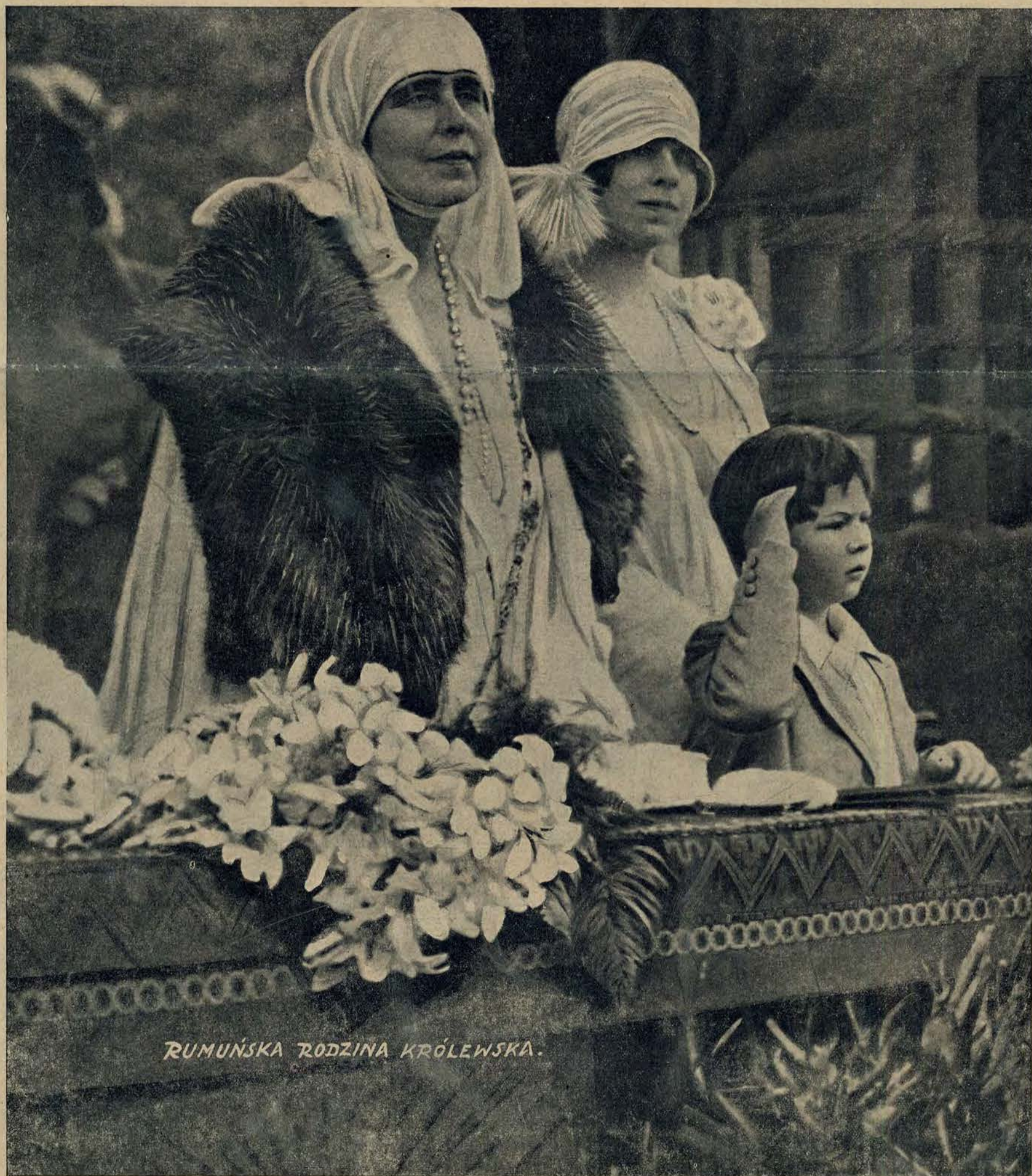
RUMUŃSKA RODZINA KRÓLEWSKA.

DZIESIĘCIOLECIE WIELKIEJ RUMUNJI I. XII. 1913—I. XI. 1923 R.