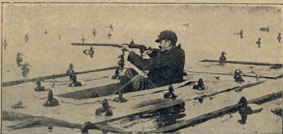
Myśliwy, polujący na kaczki z zasadki, zamaskowanej obecnością pływających modeli.