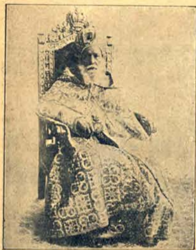
Nowy patriarcha koptyjski Egiptu Juannis XIX, uroczwicie wstąpił na tron w Kairze.