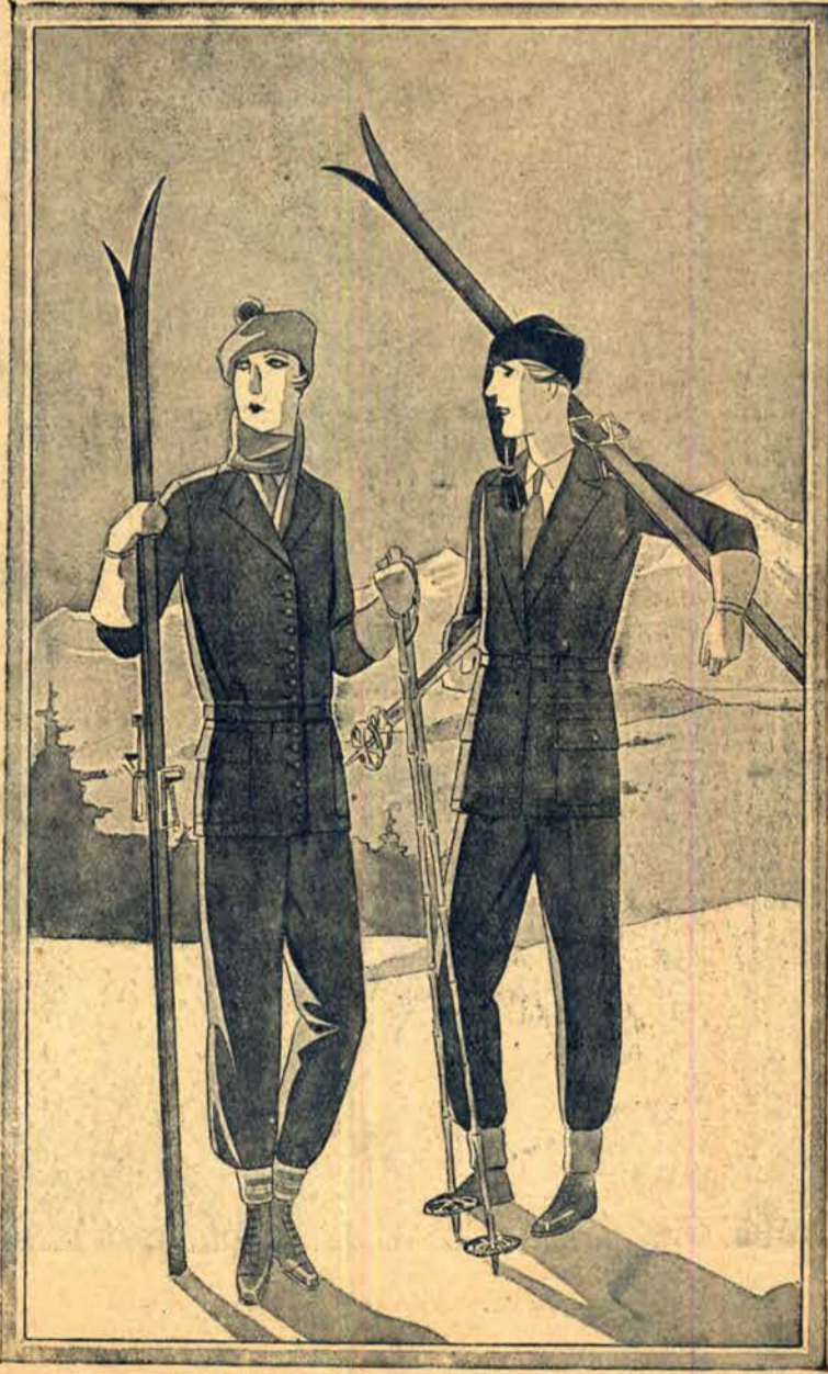
Nowoczesna kobieta nie zaniedbuje żadnego ze sportów: narciarstwo liczy już wiele wybitnych zwolenniczek.