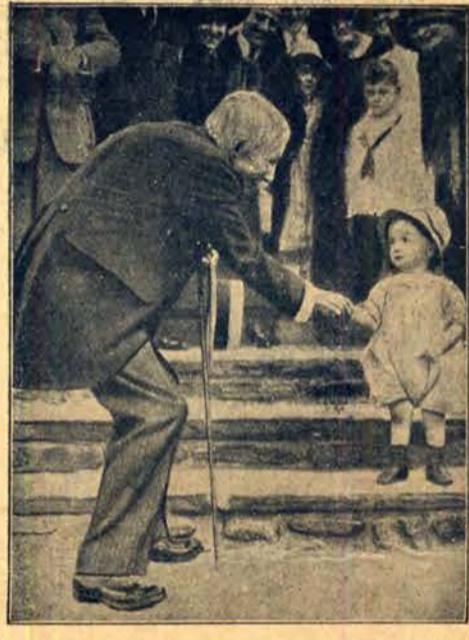
J. Rockefeller i najmłodsze jego pociechy!