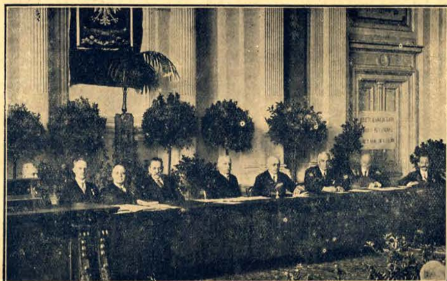
Prezydjum Zjazdu hydrotechnicznego, który obradował w Warszawie.