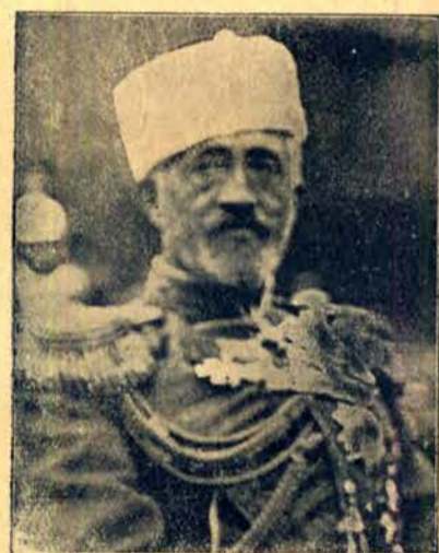
Naczelnny wódz armji rosyjskiej w r. 1914, wielki książę Mikołaj Mikołajewicz, zmarł w Cap Antibes.