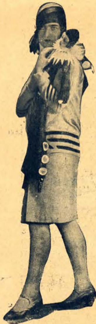
Model sukni wizytowej i gustownego kapelusika do niej.

ZADAC BEZPL. PROSPEKTÓW. WARSZ. KREDYTOWA 1