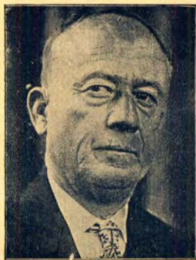
Generał Jose Moncada, następcą Diaza, nowy prezydent Nicaraguy.