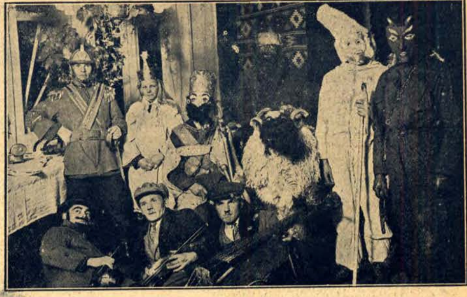
Szopka góralska w Zakopanem.