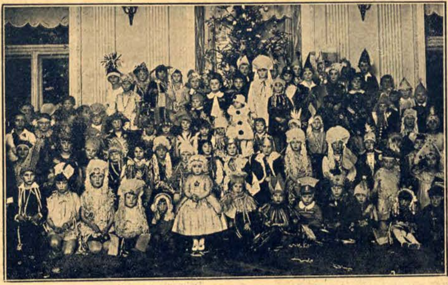
„Król Migdałowy” w Związku Rzem. Chrz. w Warszawie.

„KULAWA NUBIELI” W każdym numerze pomań 100 no... życia kobiety i rodziny. „Przegląd Kobiety” — to wręcz niezbędna lektura każdej kulturalnej kobiety. wzędach pocztowych Rzplitej Polśkiej. Redakcja i Administracja: Warszawa, Długa 45. Zędiecie bezpłatnych numerów okazowych.