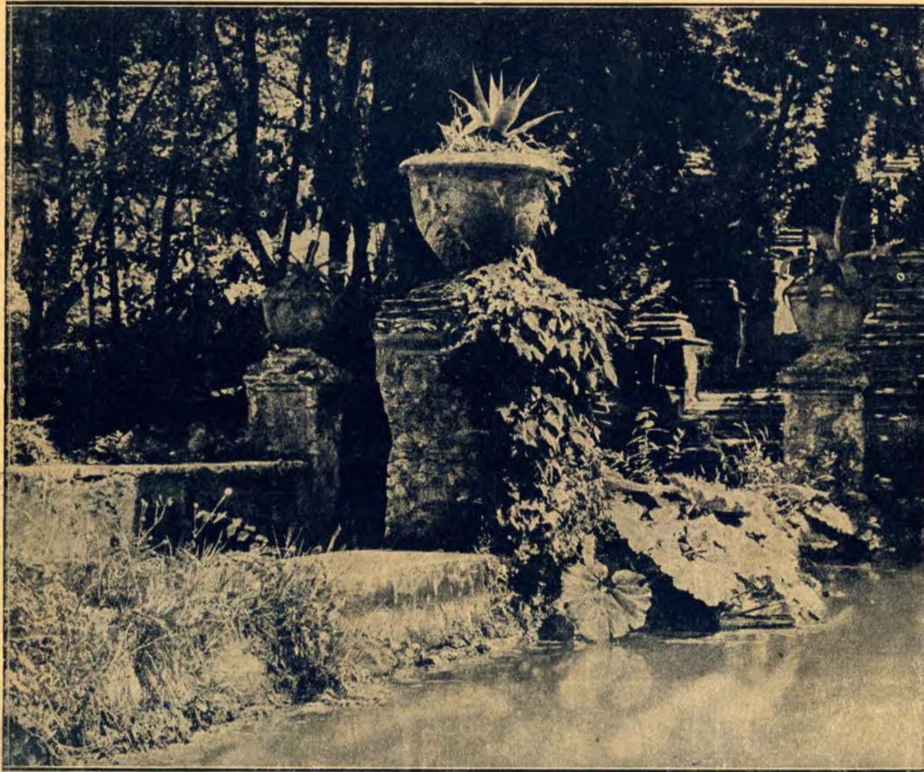
Fragment parku, tętnący ciszą i pogodą.