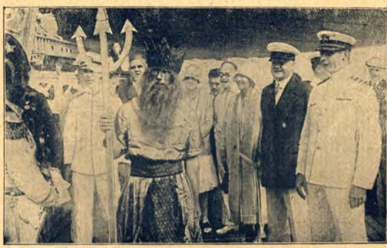
Państwo Hoover na pokładzie „Marylandu” w podróży do Ameryki Południowej uczestniczyli w marynarskiej uroczystości przekraczania równika.