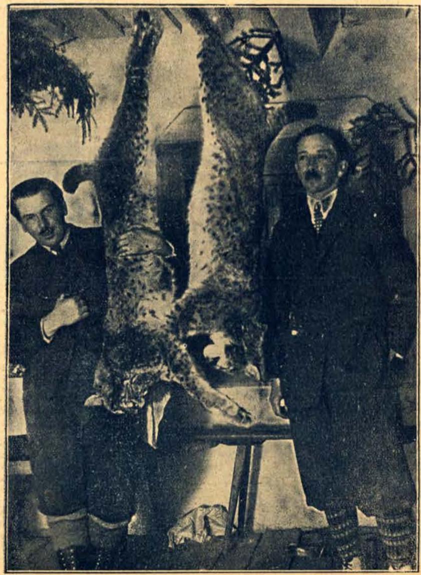
Jedynie na ziemiach Polski drapieźniki kociego rodu, rysie upolowane na kresach wschodnich.