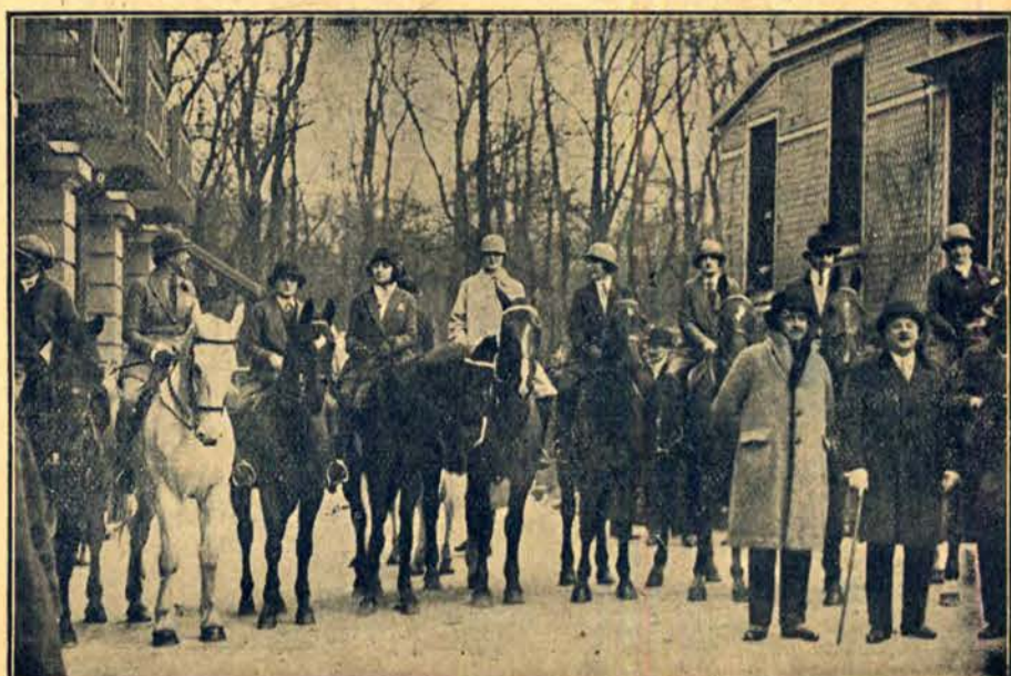
Sport ogarnia wszystkie warstwy: Start eleganckich amazońek do raidu Paryż—Canes i start do zawodu o lokalny rekord szybkości.

DDZFCI AD KODIECY" jest obecnie najpopularniejszym i najbardziej ozdobnym polskim miesięcznikiem, poświęconym kobiecie i aktualjom jej życia. Bezkonkurencyjny dział MODY.