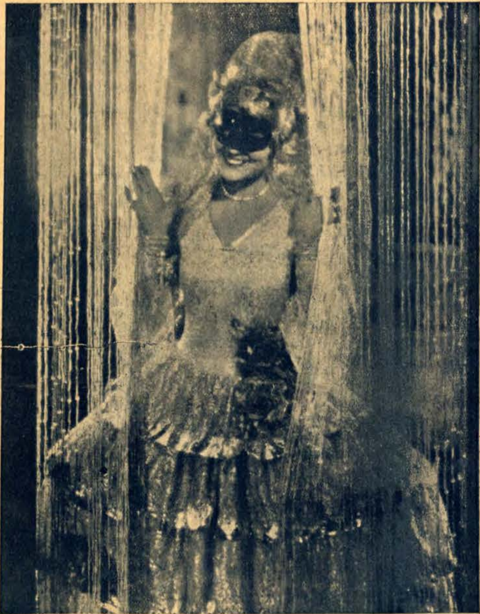
Tak się bawią warszawianki doby obecnej.