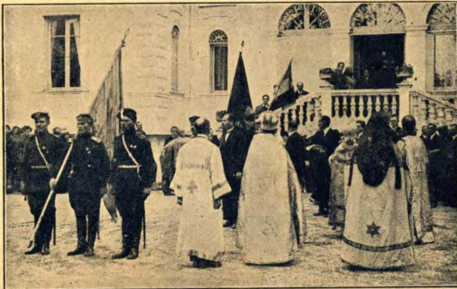
Pogrzeb W. K. Mikołaja Mikołajewicza w Antibes