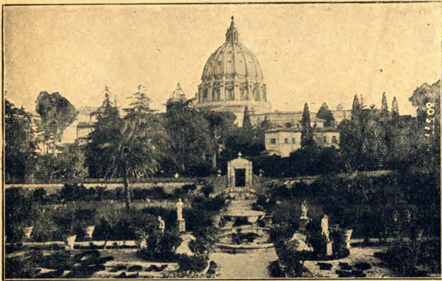
Ogrody Watykanu, stanowiące jedyne miejsce przejazdów papieża, zanim sprawa watykańska nie będzie inaczej uregulowana o czym mówią coraz częściej