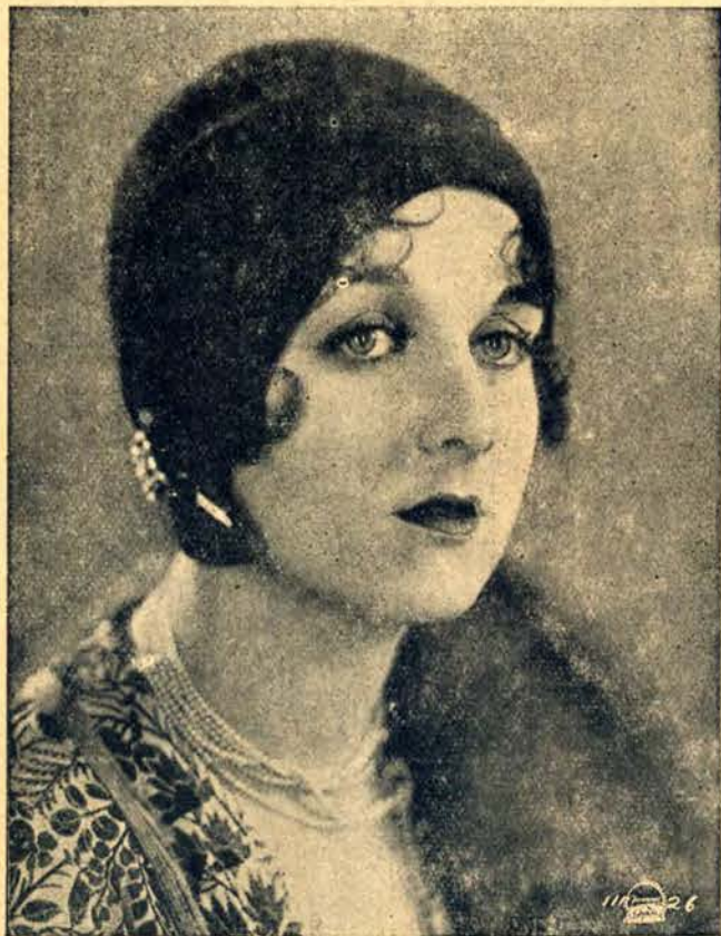
Model najmłodniejszego kapelusika, obciskającego głowę, a odsłaniającego czoło

NAJLEPSZE KSIĄŻKI! ZADĄĆ BEZPŁ. PROSPEKTÓW. WARSZ. KREDYTOWA 1.