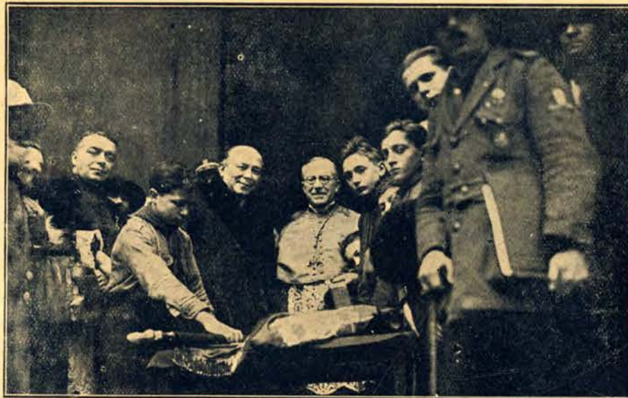
Ambasador Chłapowski na poświęceniu sztandaru skautów w Paryżu