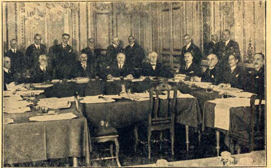
Posiedzenie Komisji Odszkodowań w Paryżu. Zasiadają tu (od prawej) przedstawiciele Rumunii, Belgii, Japonii, Francji, Stanów Zjednoczonych i Włoch