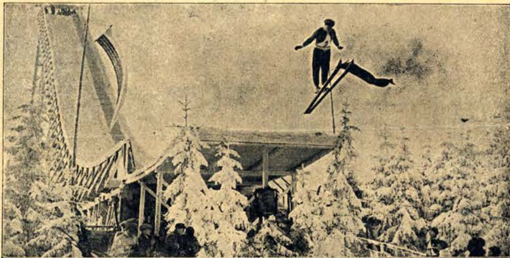
Skok narciarza ze sztucznej skoczni

NAJLEPSZE KSIĄŻKI! ZADĄĆ BEZPŁ. PROSPEKTÓW. WARSZ. KREDYTOWA 1.