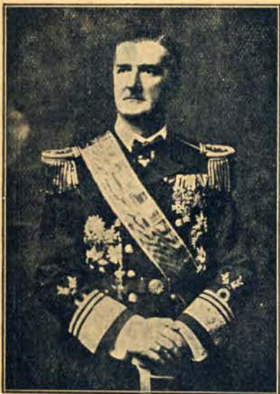
Regentowi Węgier, admirałowi Horthy'emu, poseł polski w Budapeszcie wręczył, w imieniu Prezydenta Rzeczypospolitej, Wielką Wstęgę Orła Białego