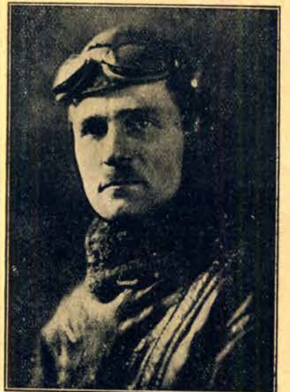
Wspaniały rekord czasu ustanowiony przez majora armii amerykańskiej, Carla Spatza, utrzymującego się w powietrzu przez 150 godz. 47 min. bez przerwy