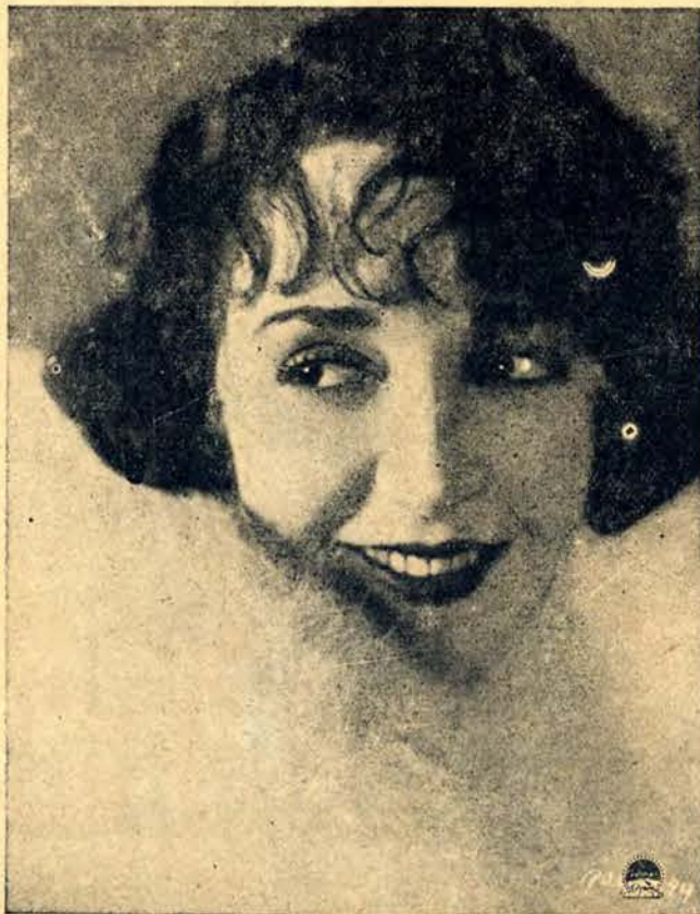
Pesymiści wróżą już zmierzch fryzurze krótkowłosej, narazie jednak króluje ona niepodzielnie