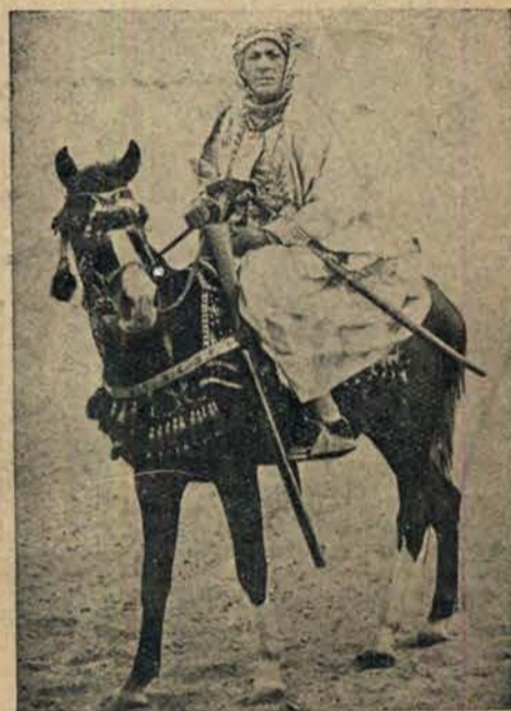
Lądowy Alain Gerbault — Georges Bistany, podróżnik-samotnik, wybrał się do Nubi w poszukiwaniu białego nosorożca.