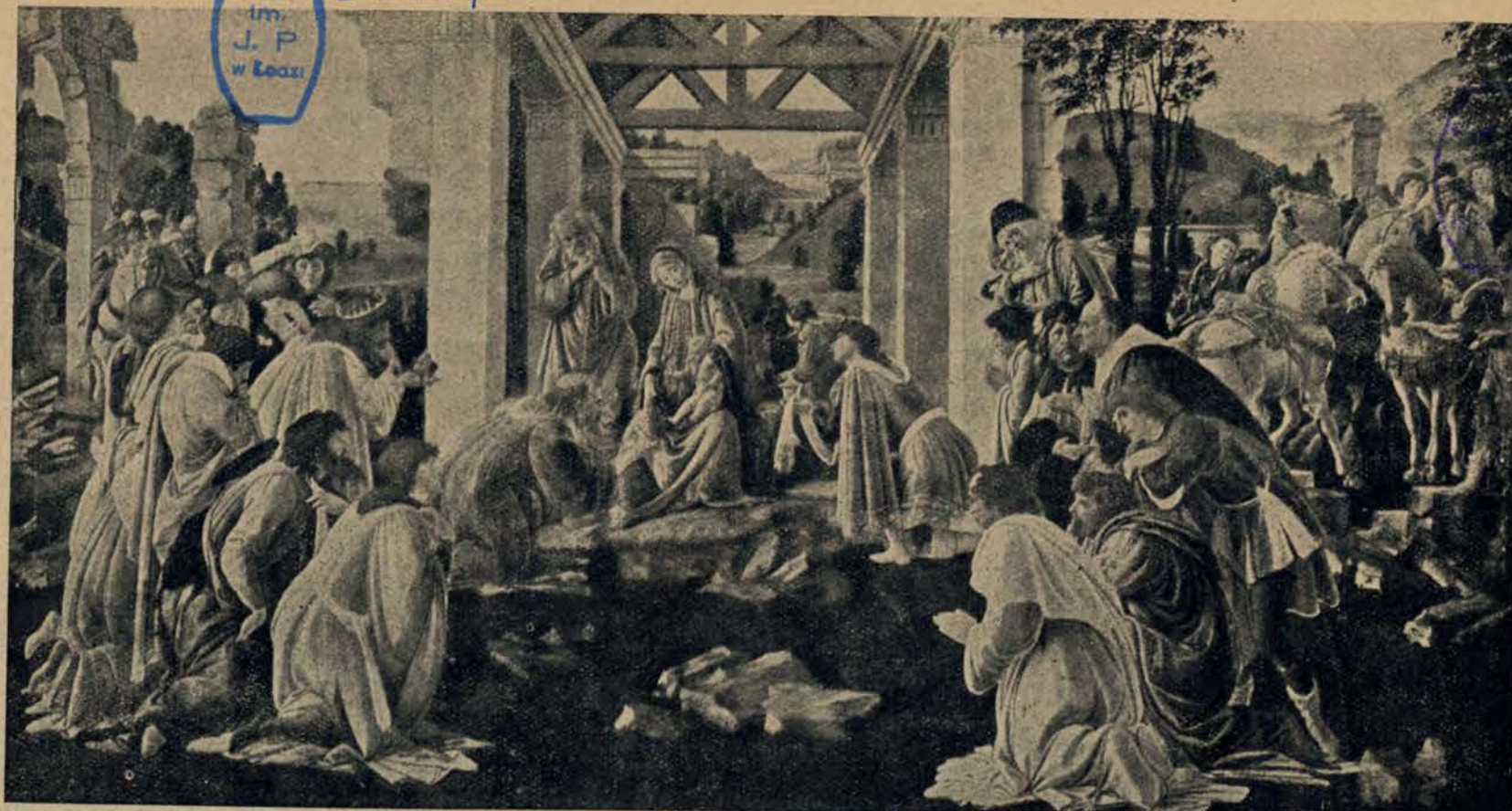
Hołd Trzech Króli.