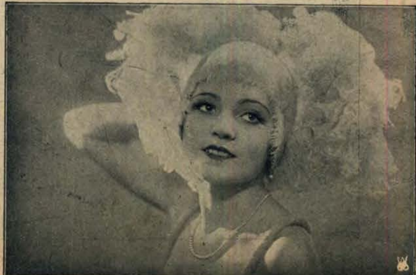
Fryzura i przybranie głowy na karnawał.