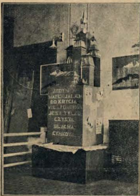
Stoisko Zjednoczonych Walcowni Błachy Cynkowej na wystawie ruchomej w Piotrkowie Trybunalskim.