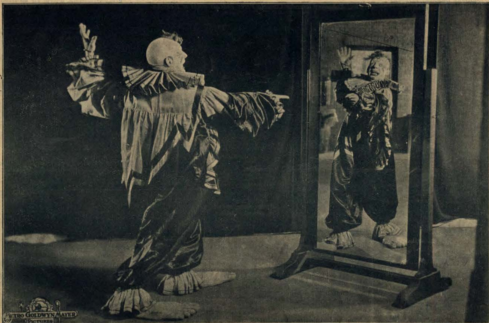
Komik, opracowujący przed zwierciadłem swą nową rolę.