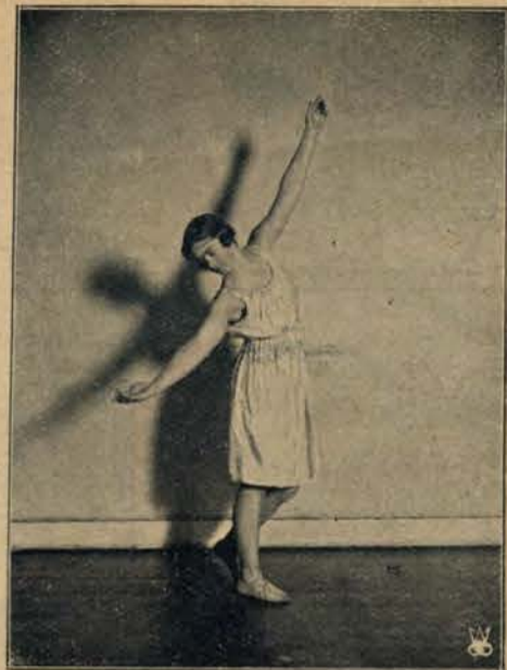
Pokaz gimnastyki dla pań w Towarzystwie higienicznym w Warszawie.