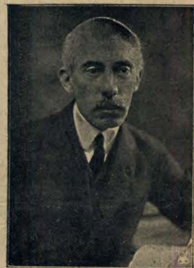
Inż. Santos Dumont, który w r. 1895 pierwszy okrążył wieżę Eiffla na sterowcu otrzymał Legję honor.