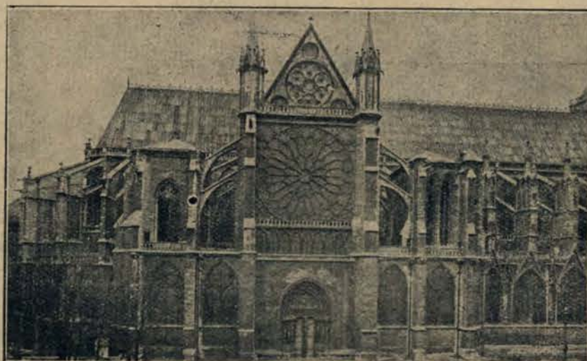
Kościół w St. Denis, w którym spoczywają prochy królów Francji.