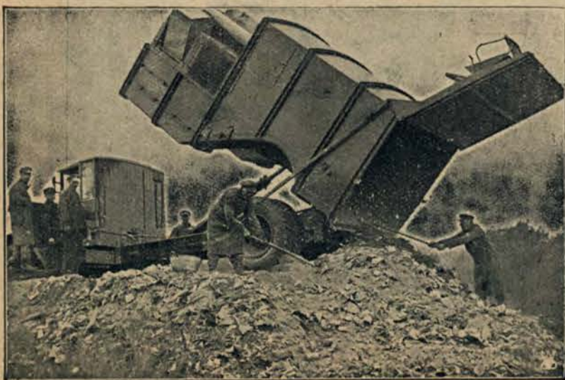
Nowa maszyna do wywożenia śmieci.