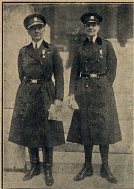
Kongres feministyczny w Sorbonie zgromadził różnorodne typy kobiet współczesnych. Na zdjęciu widzimy policjantki londyńskie.