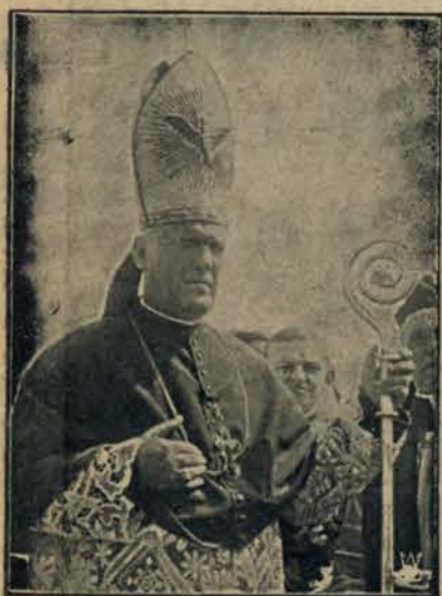
J. Em. ks. kardynał Kakowski obchodził 10-cio lecie godności kardynalskiej.