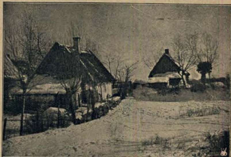
Powsinek pod pierwszym śniegiem