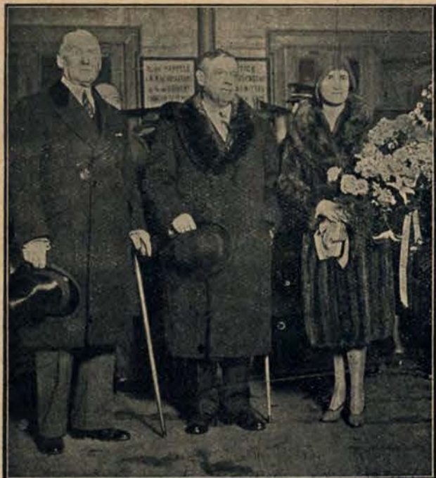
Nowomianowany ambasador Stanów Zjednoczonych we Francji, Walter Edge, przybył do Paryża w towarzystwie małżonki.

„Przełga Kobiety” można przenieść we wszystkie... Ządajcie bezpłatnych numerów okazowych. do przycz... Redakcja i Administracja: Warszawa, Długa 45. urzędach pocztowych Rzplitej Polskiej.