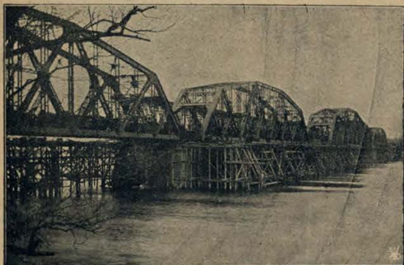
Nowy most kolejowy przez Wisłę pod Dęblinem.