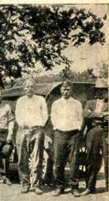
„Ściuszko” w Texas.