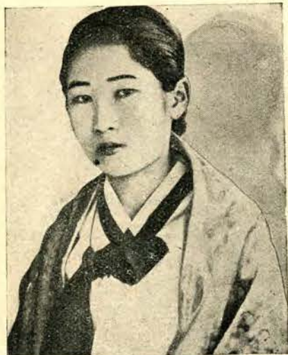
Typ pięknej tancerki Koreańskiej z Heijo.