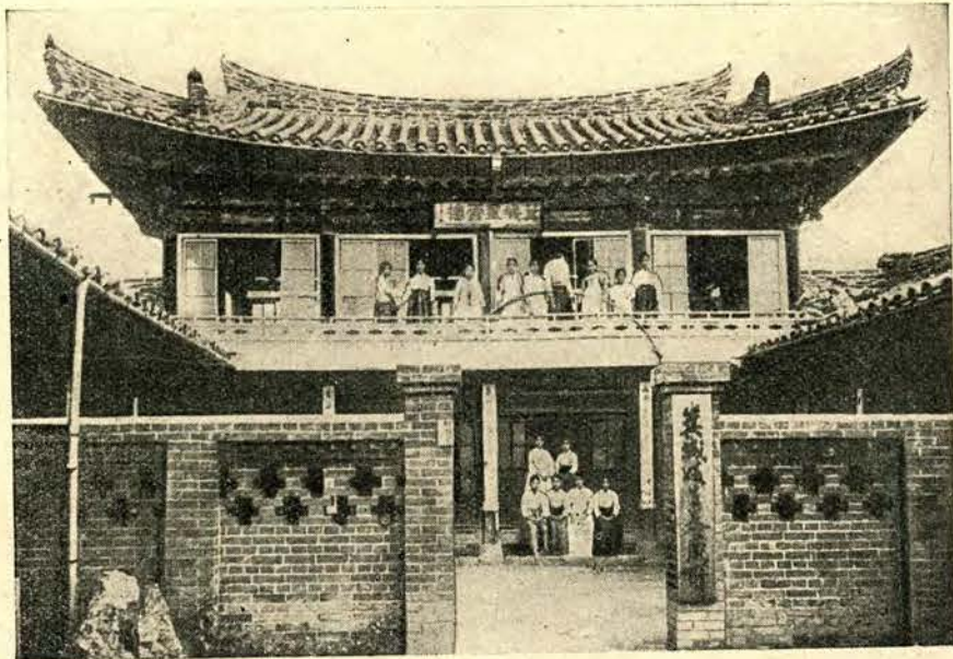
Gmach szkoły tańca w Heijo.