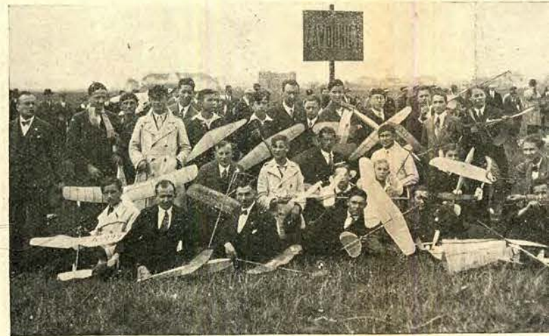
Dnia 13 b. m. odbył się na lotnisku Mokołowa w Warszawie konkurs deli latających. Ze względu na złą pogodę, konkurs ten został i przełożony na rok przyszły. Na zdjęciu zawodnicy przed s