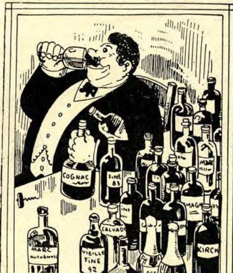
Obywatel suchej Ameryki taką posyła teraz swym przyjaciołom fotografię z podróży po Europie.