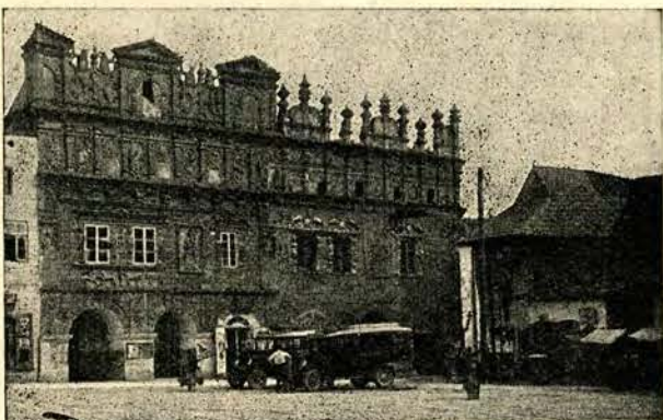
Magistrat w Kazimierzu Dolnym.