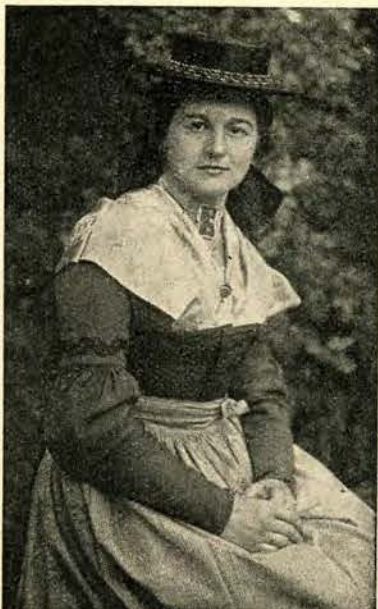
Strój ludowy w Gastein.