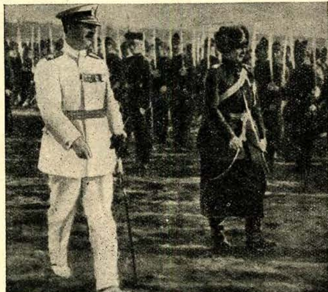
Królowa Jugosłowiańska, Marja dokonała w Costanzy, nad Morzem Czarnym, w asystencji brata swego, króla Karola, przeglądu rumuńskiego pułku piechoty, którego jest honorowym szefem.