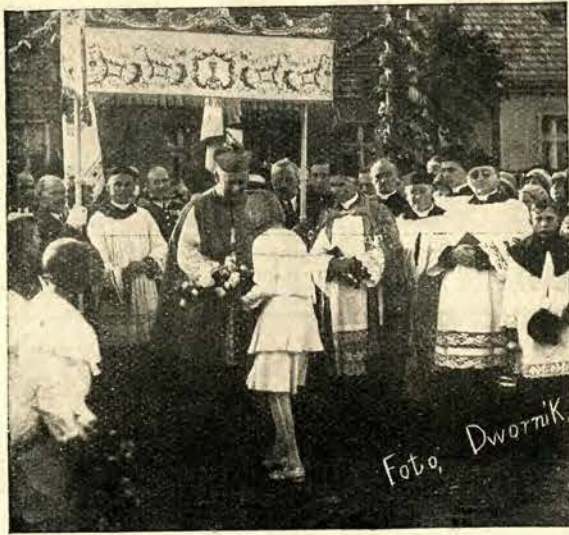
Powitanie J. Eks. Ks. Biskupa Dymka w Sarnowie.