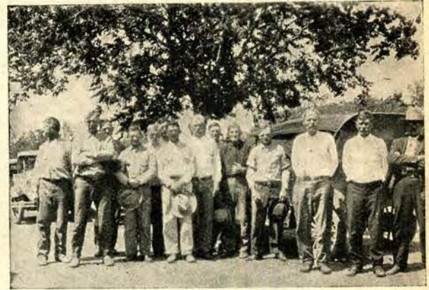
Farmerzy polscy w osadzie „Kościszko” w Texas.