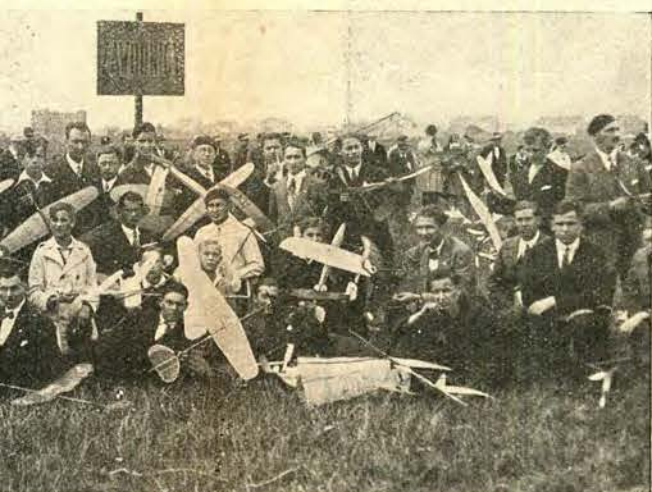
ę na lotnisku Mokołowa w Warszawie konkurs mo- łędu na złą pogodę, konkurs ten został przerwany przyszły. Na zdjęciu zawodnicy przed startem.