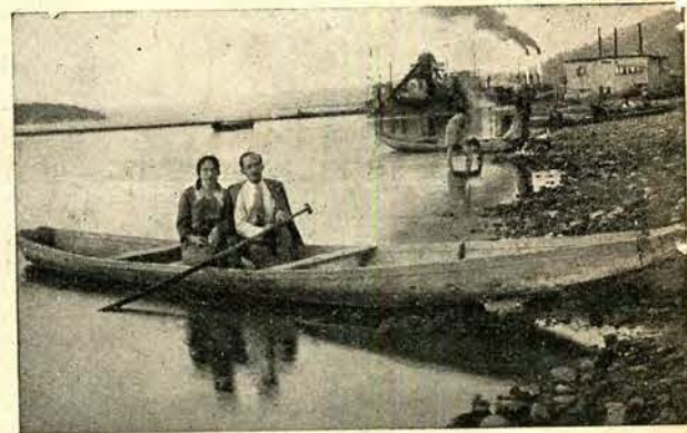
Port-przystań w Kazimierzu Dolnym.