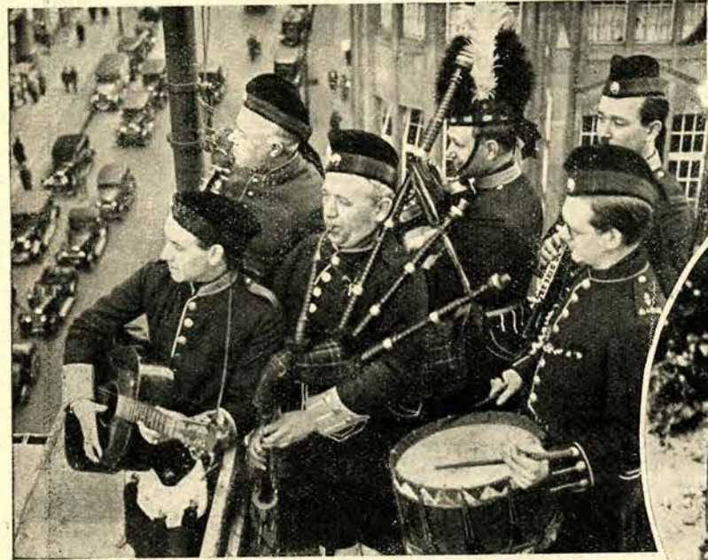
Kapela szkocka w Berlinie daje koncerty na dachu.