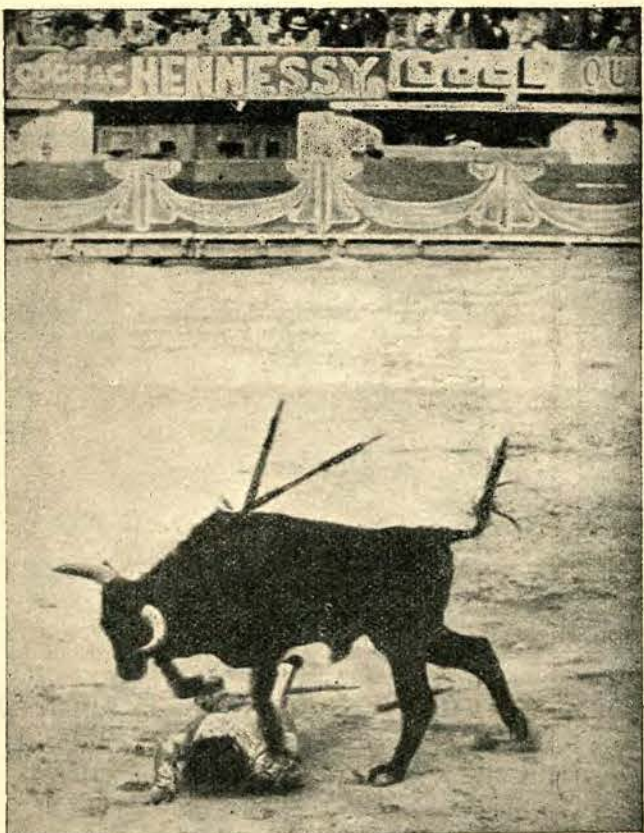
Tragiczny moment w czasie walki byków w Meksyku: matador dostał się pod kopyta rozjuszonego zwierza.