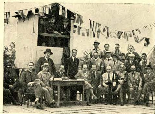
Sędziowie przy pracy.