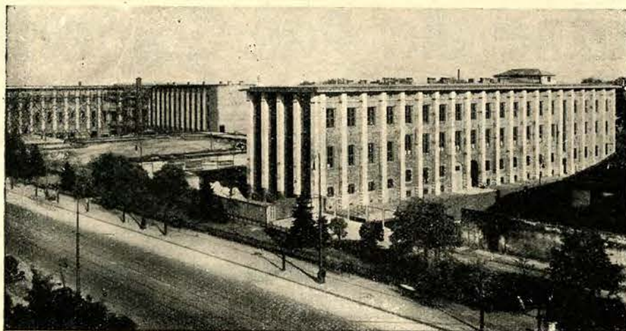
W najbliższych dniach odbędzie się otwarcie dwóch skrzydeł Muzeum Narodowego w Warszawie. Całkowite wykończenie tego imponującego gmachu jest spodziewane w r. 1935.