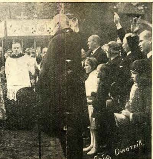
a Dymka w Łaszczynie, pow. Rawicz.