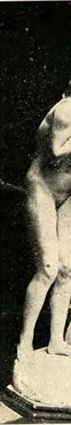
Rzeźba „Ad... two