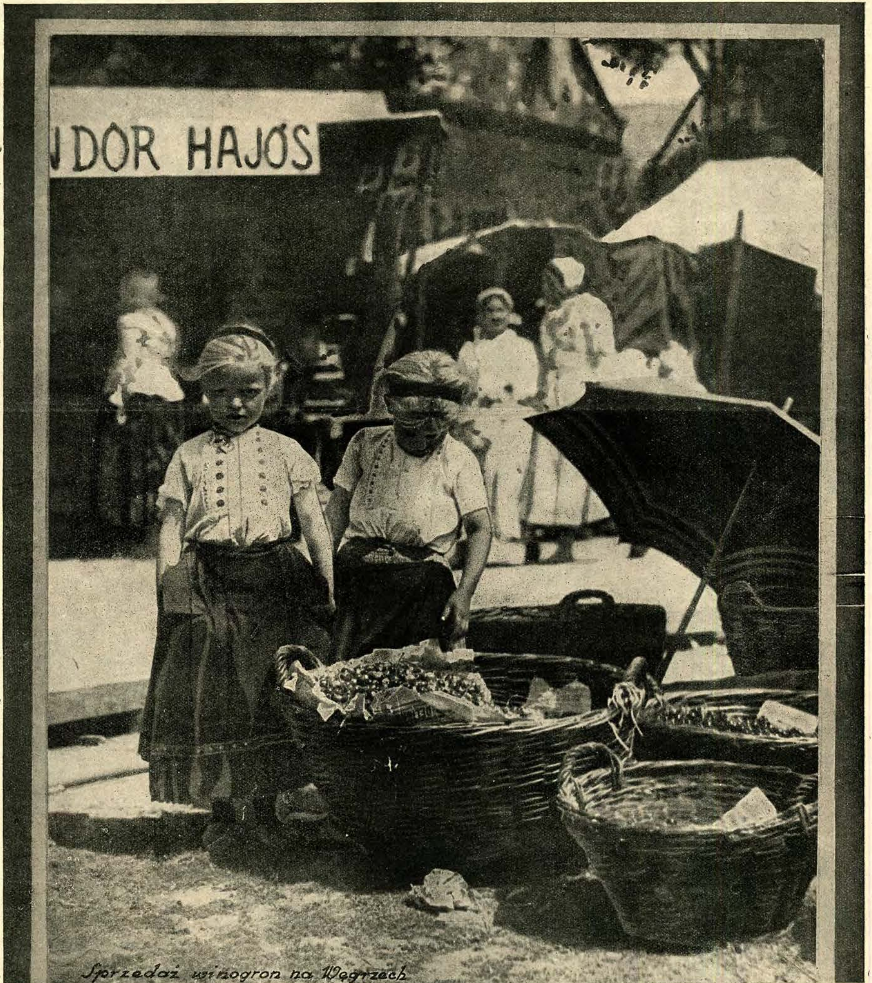
Sprzedaz winogron na Węgrzech