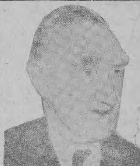
John Boyd Orr — przewodniczący Międzynarodowej Organizacji Żywnościowej — zwołał konferencję 52 państw w sprawie sytuacji żywnościowej w Europie.

sprawie współpracy wojskowej Stanów Zjednoczonych z krajami Ameryki Łacińskiej.