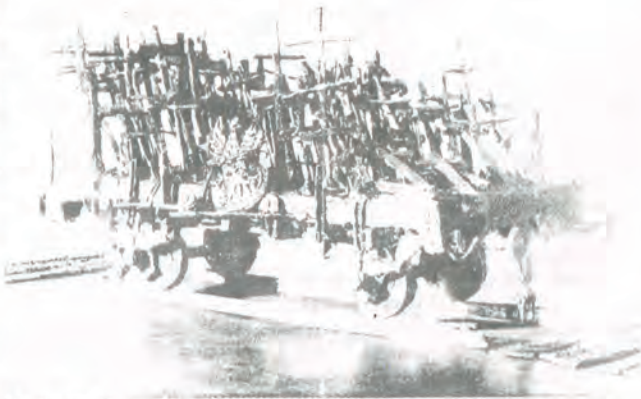
Makieta Pomnika Poległym i Pomordowanym na Wschodzie, który wkrótce wzniesiony zostanie w centrum Warszawy.

10 listopada, 32 niedziela zwykła; Ew. Mk 12, 38-44