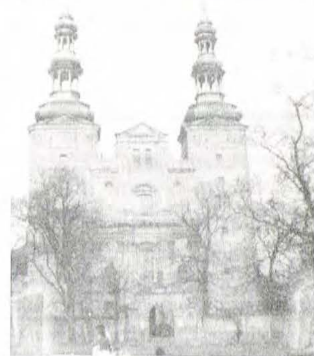
łowickiej (mieszkający aktualnie na terenie utworzonej diecezji łowickiej) stali się automatycznie członkami kapituły katedralnej.

- poinformował, że zgodnie z wyjaśnieniami muncjusza apostolskiego apb. Józefa Kowalczyka na mocy przepisów prawa kanonicznego wszyscy kanonicy prymasowskiej kapituły