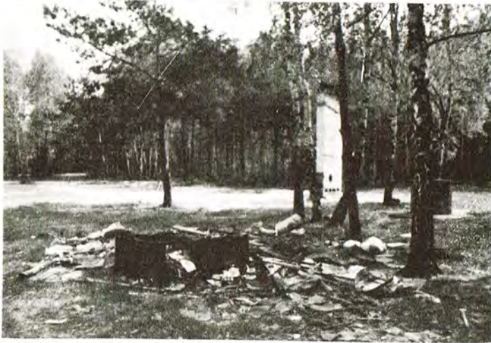
Od kilkunastu lat łowicki hufiec Związku Harcerstwa Polskiego posiadał stałą, zagospodarowaną bazę w Puszczy Bolimowskiej. W ubiegłym roku harcerze zrezygnowali z dalszego użytkowania bazy, podniszczone pawilony rozebrali. Jaki "porządek" po sobie zostawili widać na tej fotografii.