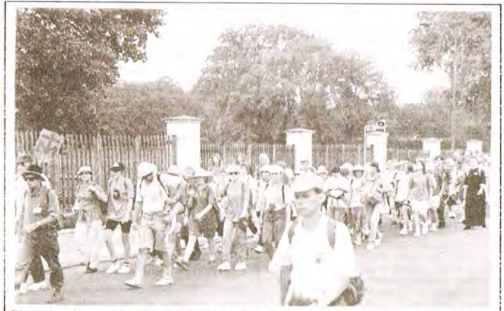
Pierwsza diecezjalna łowicka młodzieżowa pielgrzymka piesza na Jasną Górę wyruszyła z Łowicza 9 sierpnia, by następnie połączyć się z pielgrzymką warszawską. Do rogatki miasta odprowadzali kilkuset młodych pątników obaj łowiccy biskupi. Pielgrzymów sfotografowaliśmy w Nieborowie.