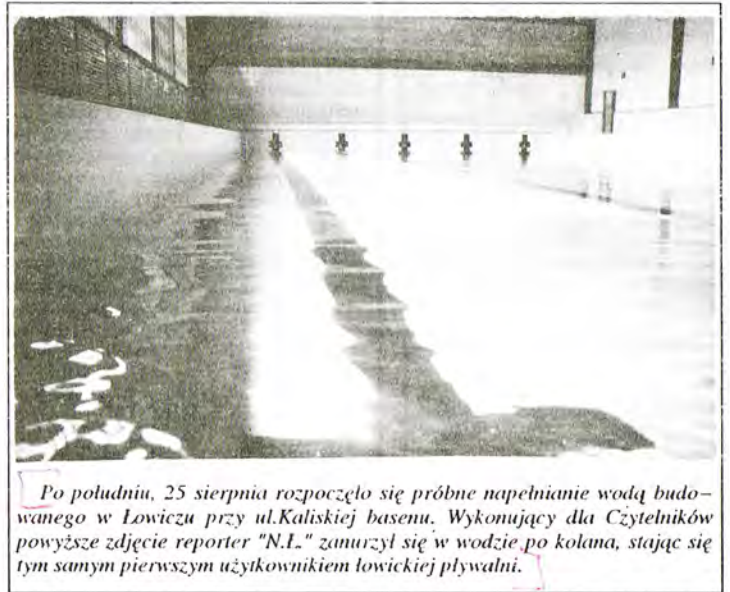
Po południu, 25 sierpnia rozpoczęło się próbné napełnianie wodą budowanego w Łowiczu przy ul. Kaliskiej basenu. Wykonujący dla Czytelników powyższe zdjęcie reporter "N.I." zamurzył się w wodzie po kolana, stając się tym samym pierwszym użytkownikiem łowickiej pływalni.

"Siódemka" kosztowała dotąd 10,85 miliarda złotych, z czego blisko jedną trzecią pokryło Kuratorium Oświaty, resztę miasto. Trwają nadal prace przy wznoszeniu sali gimnastycznej, która powinna zostać oddana