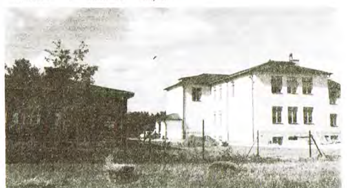
Z lewej stara, z prawej nowa szkoła w Kęszycach.