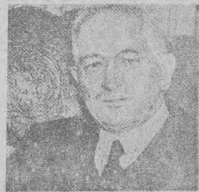
DR. EDWARD BENES prezydent Republiki Czechosłowackiej.