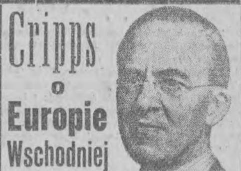
Cripps o Europie Wschodniej

LONDYN (obsł. wł.). Brytyjski minister handlu sir Stafford Cripps omawiając sprawę układu handlowego radziecko - brytyjskiego, podkreślił, iż rząd Wielkiej Brytanii przekonany jest o konieczności nawiązania kontaktów gospodarczych z państwami Europy Wschodniej. Min. Cripps oświadczył, iż Wielka Brytania jako państwo opierające swą gospodarkę na eksporcie, musi dążyć do zdobycia jaknajwiększej ilości rynków zbytu we wszystkich częściach świata, a przede wszystkim w Europie Wschodniej.