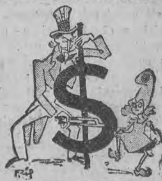
„Kuszenie Marianny” („France Nouvelles”)