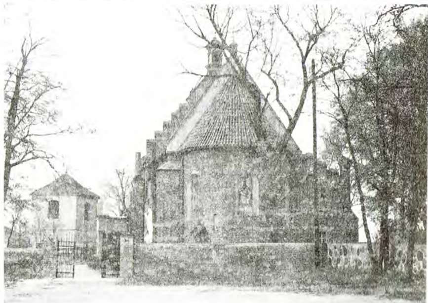
Na zdjęciu: absyda kościoła parafialnego w Chruslinie.