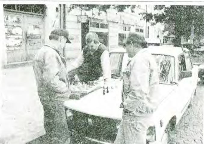
Z życia wzięte: taksówkarze oczekujący na klientów na postoju na Rynku Kościuszki skracają sobie chwile oczekiwania partią szachów. Ale co tobie – powiedział jeden z nich – jeśli mamy średnio tylko po trzy kursy dziennie...