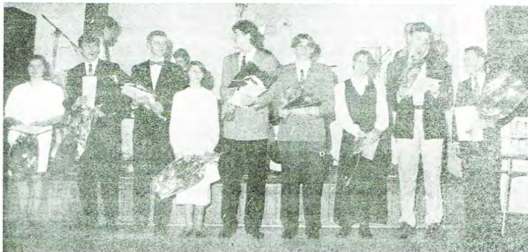
III Plebiscyt rozstrzygnięty