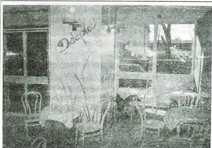
Kawiarnia „Dziupla” mieszcząca się dotąd w dawnym budynku MDK przy ul. Podrzecznej przeniesiona została do foyer kina „Bzura”. Kawiarnia chce ocalić coś ze swego dawnego klimatu, ale wprowadza też zmiany: nie wolno w niej będzie palić. Szczegóły na str. 2.