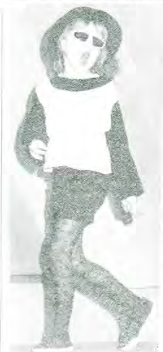
Zachwycony spontaniczną radością wykonawców wrócił ze zorganizowanej w Szkole Podstawowej w Zielkowicach „Mini-listy przebojów” nasz reporter. O imprezie czytaj na str. 17.