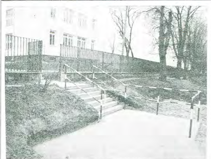
Pisaliśmy niedawno (NL 5/95), że utrudniony jest dostęp do nowo wybudowanego gmachu Zespołu Szkół Ekonomicznych, gdyż od strony ulicy Kaliskiej nie ma utwardzonego dojścia. Miło nam pokazać, że w ciągu minionych tygodni zostały wykonane schodki wraz z barierką uniemożliwiającą gwałtowne wtargnięcie na jezdnię. Urządzenie schodów zwrócić jednak tym bardziej uwagę na inny defekt: brak chodnika po wschodniej stronie Kaliskiej.