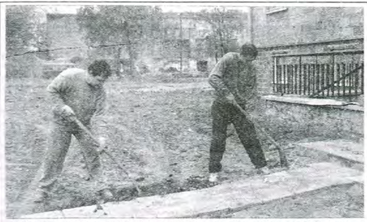
Mieszkańcy bloku spółdzielni „Domino” przy ulicy Bolimowskiej w Łowiczu sami chwycili za łopaty i zaczęli porządkować teren przed wejściem do swoich klatek schodowych. Jak dotąd plac między ulicą a nowym osiedlem należał do najbardziej zaniedbanych w Łowiczu.

zwłok oraz badań towarzyszących, która przedstawiona zostanie wkrótce przez lekarza specjalistę, biegłego z dziedziny medycyny sądowej. Bez miarodajnej opinii posekcyjnej nie mają sensu jakiegokolwiek rozważania na temat faktycznej czy domniemanej przyczyny śmierci Mariana R. – powiedziano nam w prokuraturze, zapewniając jednocześnie, że wszystkie wątki tej sprawy będą dokładnie badane.