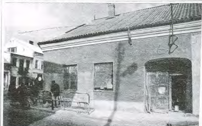
Coraz ładniej wygląda odnawiana gruntownie, bo kładziona na nowo po zbićiu starego tynku, elewacja kamienicy przy narożniku Zduńskiej i Rynku Kilińskiego. Narożnikowy dom był jeszcze kilka lat temu własnością miasta, po wykupieniu przez prywatnych właścicieli zmienia się nie do poznania.