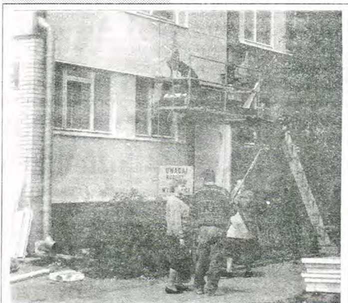
Rozpoczęły się prace przy ocieplaniu frontowych ścian bloków na os. Starzyńskiego. Czytaj na stronie 2.