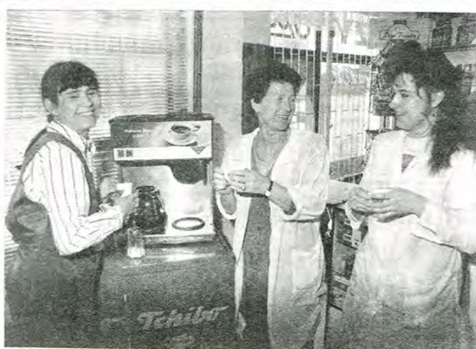
Degustację wyrobów różnych firm w naszych sklepach stają się z wolna czymś, co nie wzbudza już sensacji. W środę i w czwartek w ubiegłym tygodniu w sklepie spożywczym „Społem” na rampie bloku 24 na osiedlu Dąbrowskiego filiżankę kawy „Tchibo” serwowały za darmo klientom dwie dziewczyny z ekipy promocyjnej koncernu o tej samej nazwie.