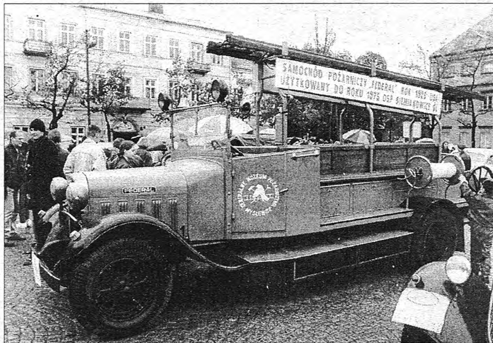
FEDERAL – samochód pożarniczy z 1925 roku.