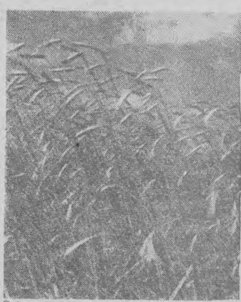
Zniwa są już na ukończeniu w całej Polsce. Pełne ziarna kłosa dały zbiory na ogół lepsze, niż przewidywano.

PRACY. Polak jest DOBRYM ROBOTNIKIEM, DOBRYM GORNIKIEM. Takich górników potrzeba, aby wydobywać więcej węgla, aby przy pomocy tego węgla odbudowywać szybciej i skuteczniej wielki przemysł niemiecki.