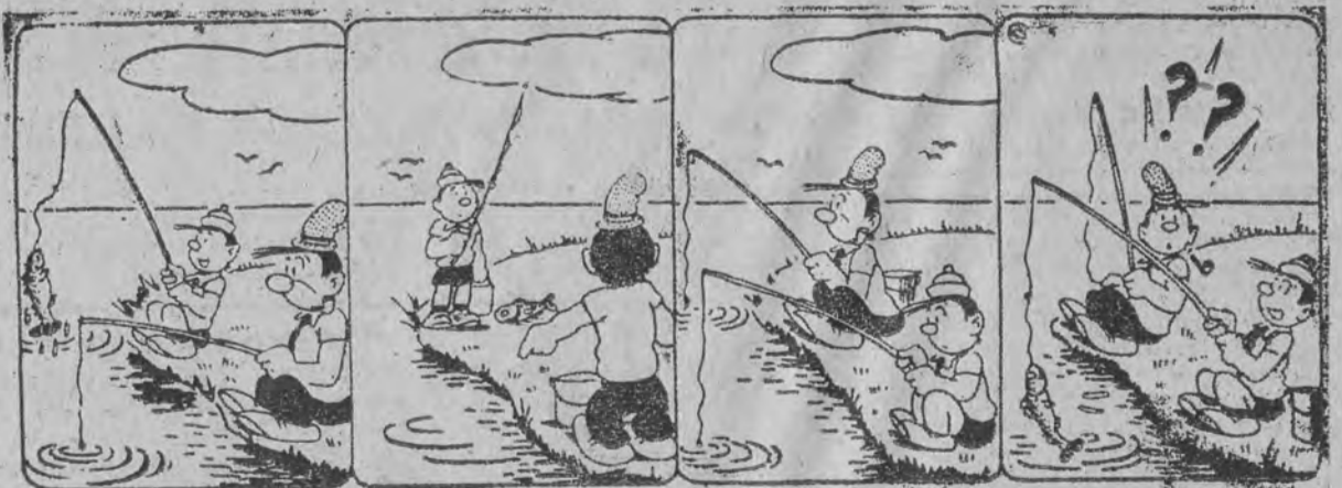
Ma chłopak szczęście