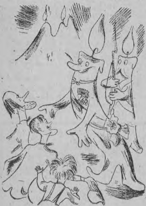
108. Wódz Gromnica, wraz ze świta, Uroczyste ich powitał, I poprosił, by zechcieli Miasto zwiedzić przy niedzieli.