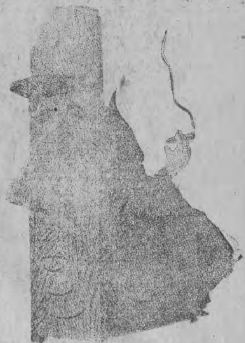
Co kryje się za de Gaulle'm? Najczarniejsza reakcja — faszystom „Action”

greckiego. Przywódca partii liberalnej Temistokles Sofjalis odrzucił propozycje Tsaldarisa współpracy z partią populistów w nowym rządzie.