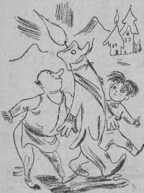
109. Za Gromnicą szli ulica Cała pokapana świąca, A za nimi tłum miejscowy. Same zapalone głowy.