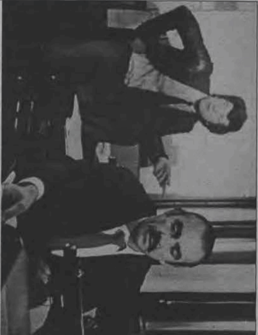
'Agresja' - film fab. prod. angielskiej - reż. Sidney Lumet, wyk. Sean Connery, Trevor Howard, Viven Merchant i inni. Emissja: niedziela, 26 maja, TVP 2, godz. 0.50.