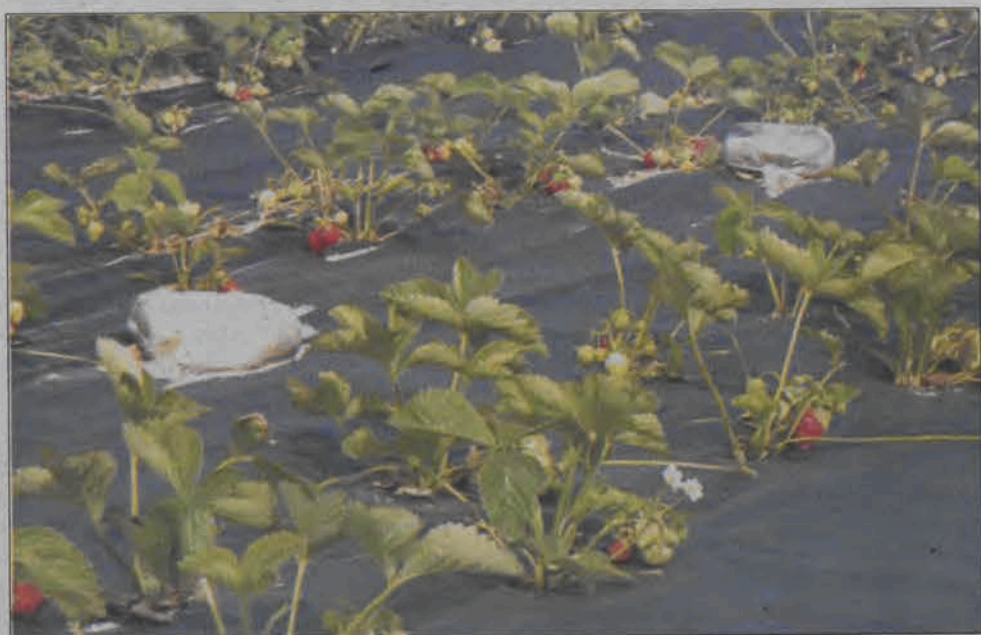
Już teraz pojawiają się pierwsze owoce, zatem rozpoczęcia sezonu truskawkowego możemy spodziewać się w tym roku wcześniej niż zwykle.