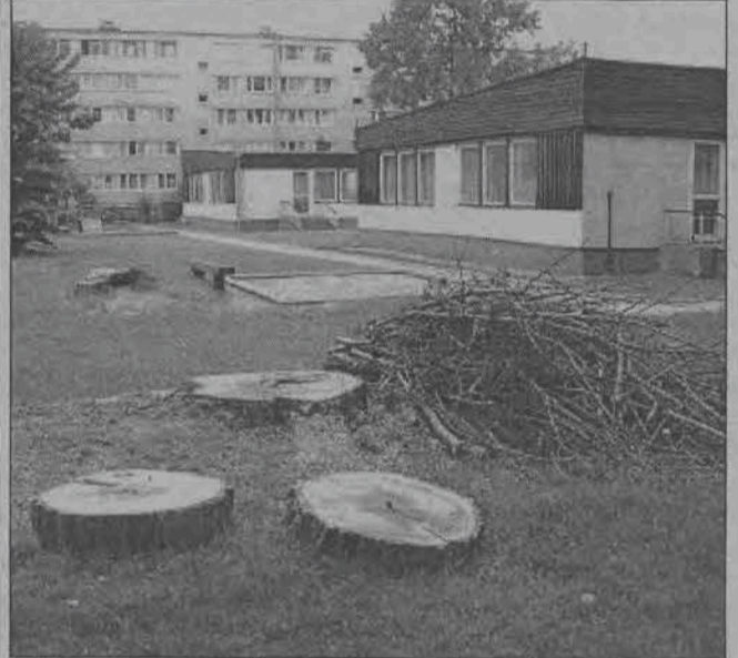
Tylko sterczące z ziemi pnie znaczą miejsce, gdzie rosły topole.