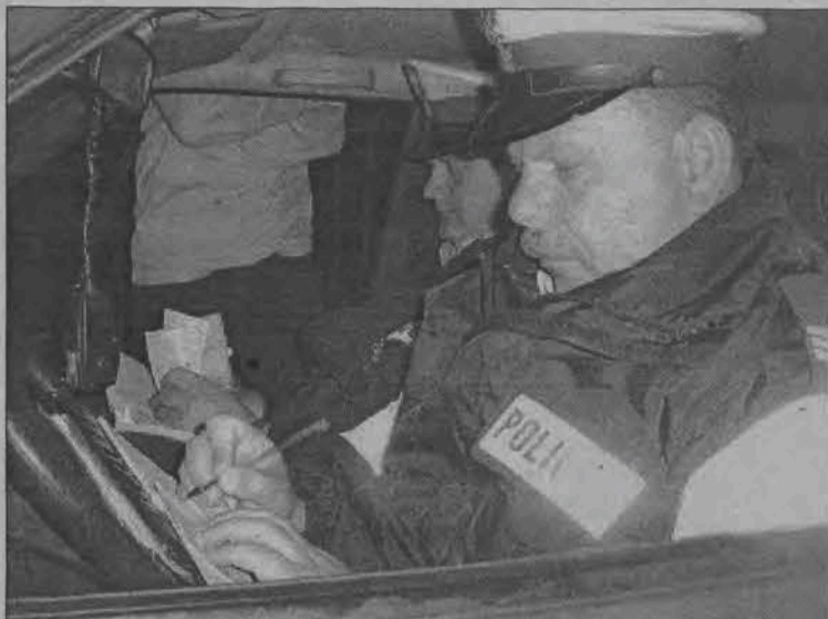
Dużo pisania mieli funkcjonariusze sekcji ruchu drogowego łowickiej komendy.

Około 22.30 radiowozy ustawiły się na wszystkich drogach dojazdowych do zabawy, organizowanej przez strażaków w Osieku i zaczęto kontrolę. Kierowcy byli zaskokowani tak dużą liczbą policjantów. Jeden z nich jadący od strony Wejście do Łowicza na wysokości skrzyżowania z drogą do Kocierzewa, zatrzymując się, krzyknął sfrustrowany przez okno - Zwirowaliście! Trzeci raz chcecie mnie kontrolować? Pozostali kontrolowani wykazywali więcej pokory. Zatrzymany w tym samym miejscu do kontroli młody człowiek powiedział zdziwiony - Od dziesięciu miesięcy nie widziałem tu policji. Sławek G., któremu zabrano dowód rejestracyjny za niedokonywanie badań okresowych samochodu także nie krył zdziwienia policjantami - Jestem zaskoczony ich obecnością,