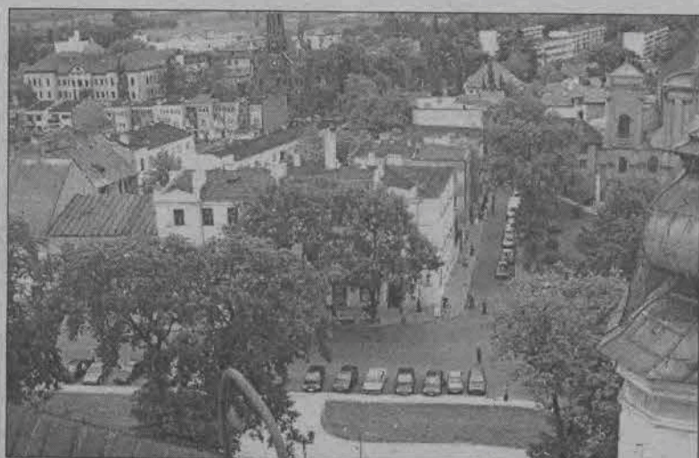
Widok z wieży na stronę południową miasta. W głębi nowy budynek MWSH-P, kościół mariawicki, osiedle Starzyńskiego.

Wszyscy, którzy chcieliby o Juwenaliach wiedzieć więcej, mogą skorzystać z Internetu: www.rockmetal.pl (aj)