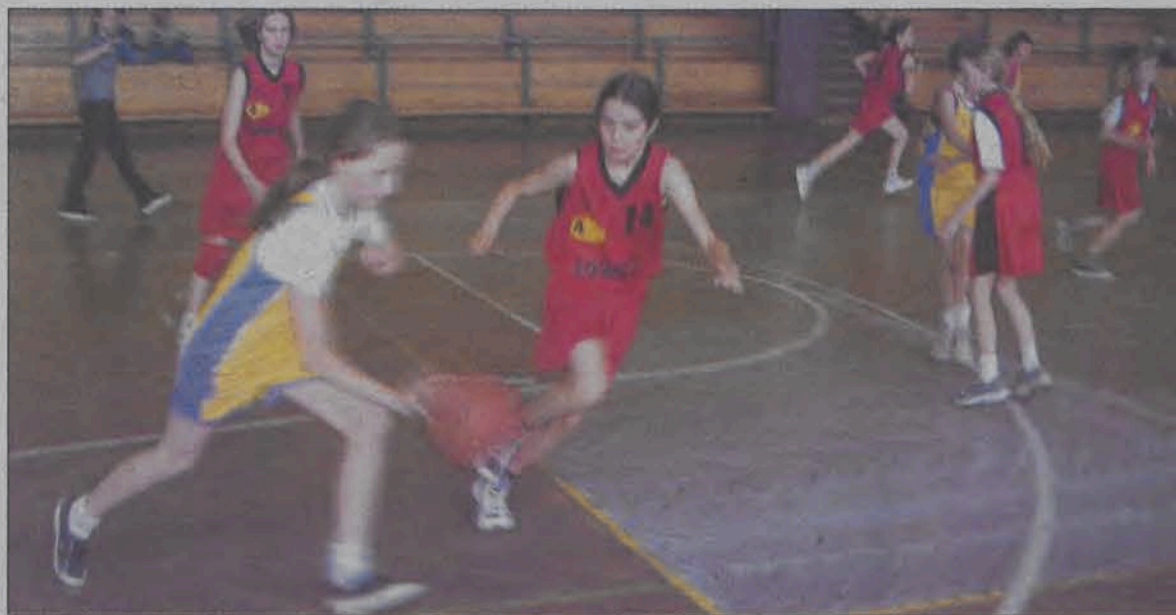
„Centerki” po dwóch kolejnych zwycięstwach coraz bliżej awansu do czołowej czwórki w lidze żaczek.

Koszykówka - Wojewódzka Liga Żaczek - rocznik 1990