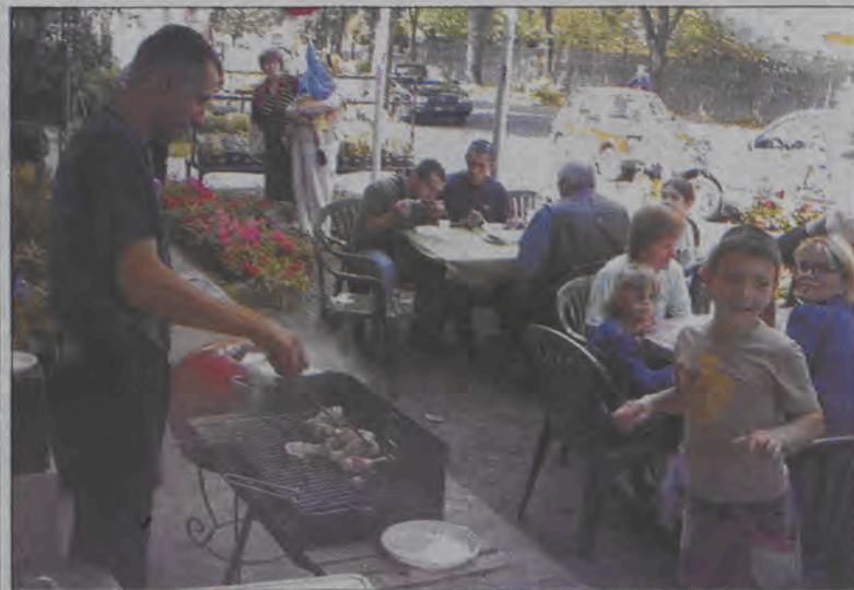
Oferta firmy spotkała się z ogromnym zainteresowaniem klientów.

O innych konkursach - wynikach i atmosferze im towarzyszącej - piszemy na stronie 8. (aj, wal)