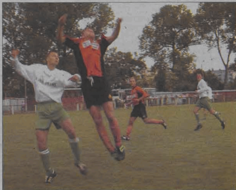
Wypadek przy pracy, czy...?

Koszykówka - międzynarodowy mecz juniorów