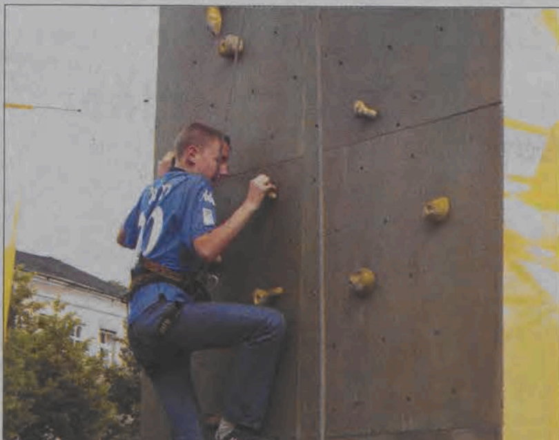
Ścianka wspinaczkowa ustawiona na Starym Rynku cieszyła się dużym powodzeniem.

W najbliższą niedzielę, 26 maja na boisku sportowym w Kiernozi o godz. 10.00 odbędą się Powiatowe Zawody Strażackie. Wezmą w nich udział zarówno drużyny męskie, jak i żeńskie OSP, które w ubiegłym roku uzyskały najwyższe noty w zawodach na szczeblu gminnym. Przypomnijmy tylko, że rywalizacja w Kiernozi, to zaległe ubiegłoroczne zawody, które z powodu niesprzyjającej aury nie odbyły się jesienią na stadionie OSiR w Łowiczu. (ljs)