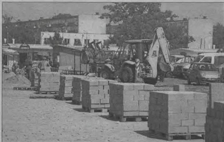
Część prac remontowych na łowickim targowisku dobiega już końca.