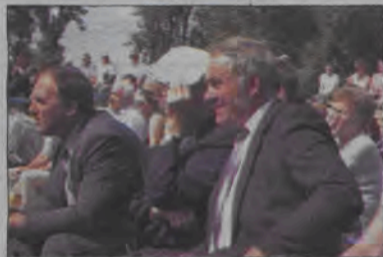
Część artystyczna uroczystości odbyła się na muszli koncertowej.