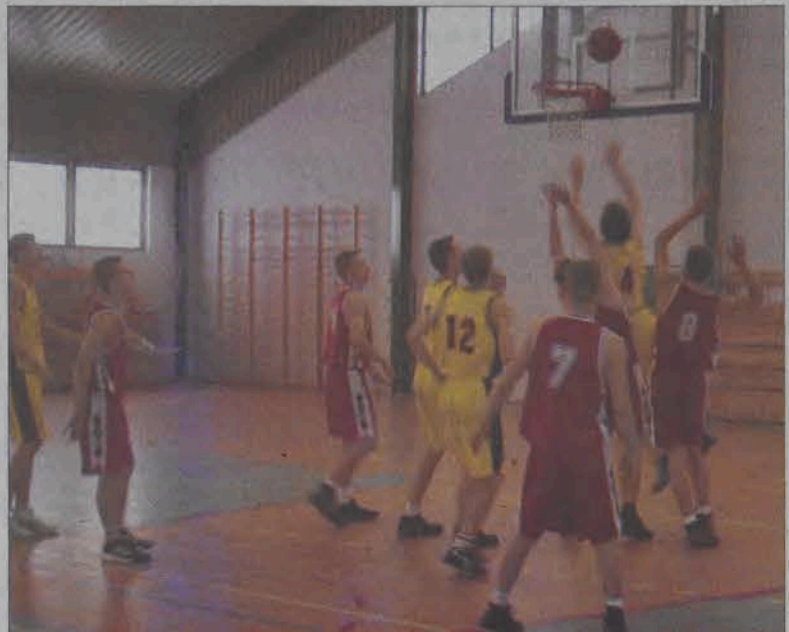
Pomimo przewagi wzrostu Czechów łowiczanie dobrze radzili sobie „na tablicach”.