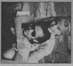
witryn sklepowych, ze ścian domów. Nawet Aniel pojawia się w jego wyobraźni jako postać z telewizyjnej reklamy. Spełnia jednak w życiu dziecka niezwykłą ważną rolę.