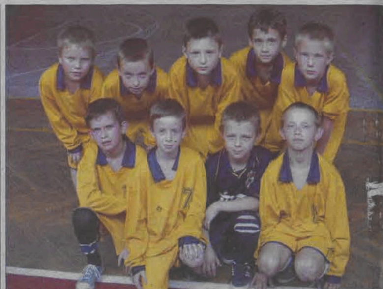
Bardzo dobrze w rywalizacji jedenastolatków radzą sobie IV-klasiści z SP 3 Łowicz.

● 9.00 - Pływalnia Miejska w Łowiczu, ul. Kaliska; 10. Zawody Pływackie o Puchar Dyrektora Pływalni Miejskiej w Łowiczu.