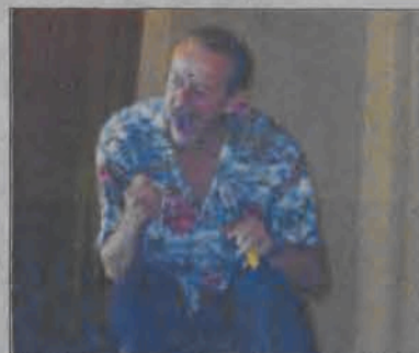
Daniec na scenie to istny żywioł...

Zajęliśmy miejsca i rozpoczął się program. Całe szczęście, że się nie spóźniliśmy. Ci, którzy weszli już podczas trwania występu mieli przechłapanie. Dżentelmen, który nieopacznie zasiadł na widowni dwie minuty po czasie, został momentalnie „ofiara” artysty. Oczywiście nikt nie obrażał się, bo przecież nawet gdy Daniec się z niego nabijał,