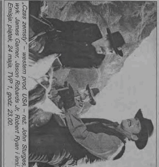
„Czas zemsty” – western prod. USA – reż. John Sturges, wyk. James Garner, Jason Robards Jr, Robert Ryan i inni. Emissja: piątek, 24 maja, TVP 1, godz. 23.00.