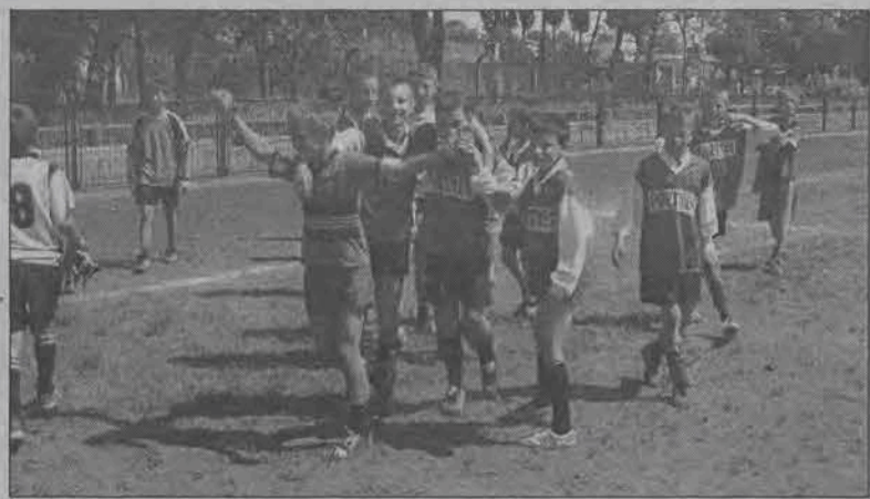
Chłopcy z Łyszkowic mieli powody do radości tylko po meczu półfinalowym...