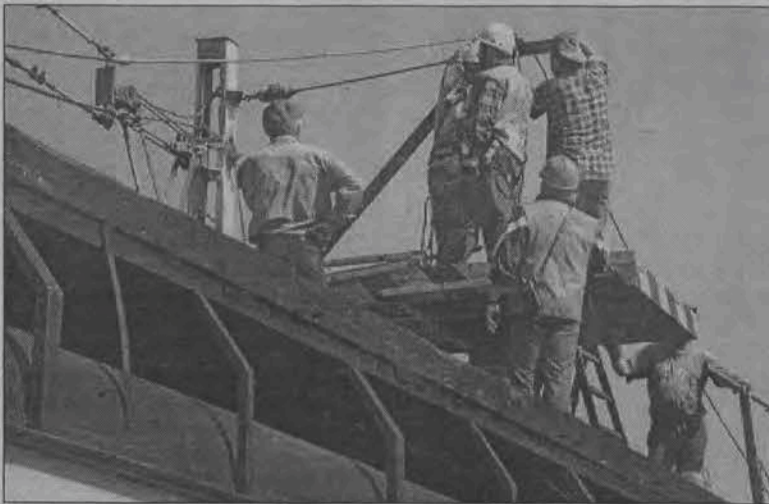
Zakład remontowy PKP z Łodzi cały dzień naprawiał trakcję elektryczną w Grudzach.

O godzinie 2.55 przez Grudze, w kierunku Łowicza przejeżdżał pociąg pocztowy, którego nie ma w rozkładzie jazdy PKP i dlatego złodzieje nie mogli o nim wiedzieć. Słyszając pociąg wsiedli do samochodu i odjechali, pozostawiając linki i kabel przy toro-