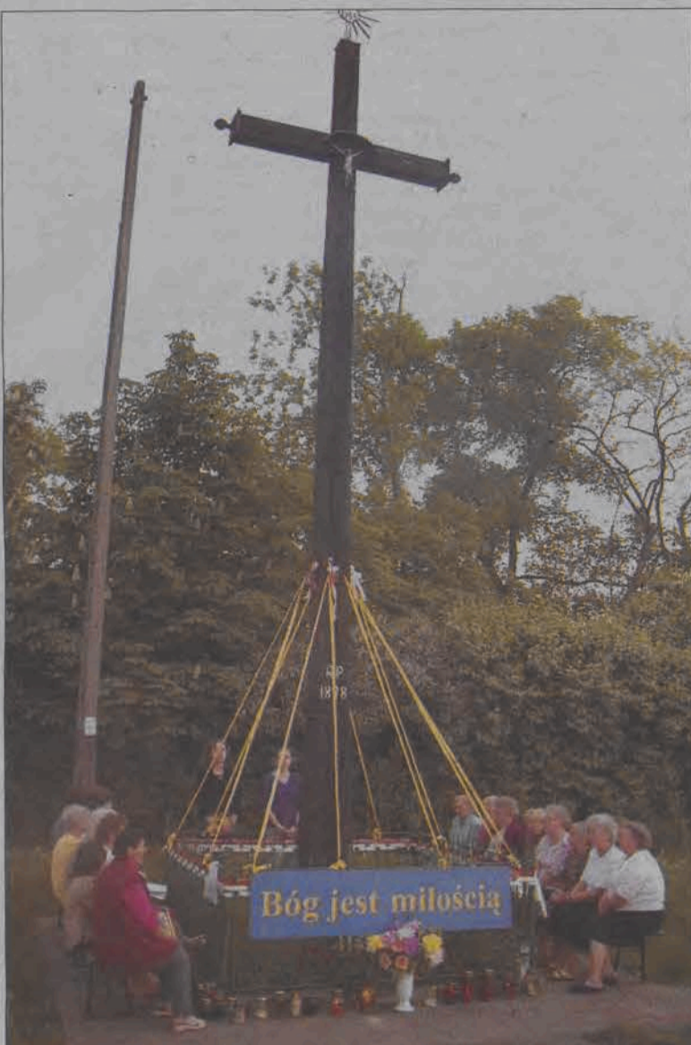
W każdy majowy wieczór zbierają się wierni, by oddać cześć Maryi. Na zdjęciu: modlitwa pod krzyżem na skrzyżowaniu ul. Blich z Zamkową.

Wiele osób zbiera się również na codziennej modlitwie przy krzyżu w Małszycach. Dla większości z nich to co-