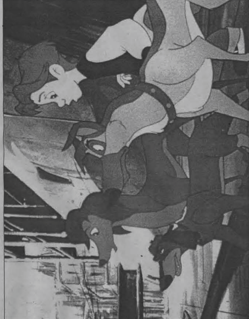
„Wszystkie psy idą do nieba” – film animowany prod. USA – reż. Paul Sabella, Larry Leker. Emisja: czwartek, 30 maja, TVP 2, godz. 9.05.

2 czerwca, niedziela godz. 17.00; TVPULS; OŚRODZIE Z PIENIĘDZMI Zalutniony w mienicy Harry Lucas zostaje oskarżony o umyślne zniszczenie 60.000 dolarów.