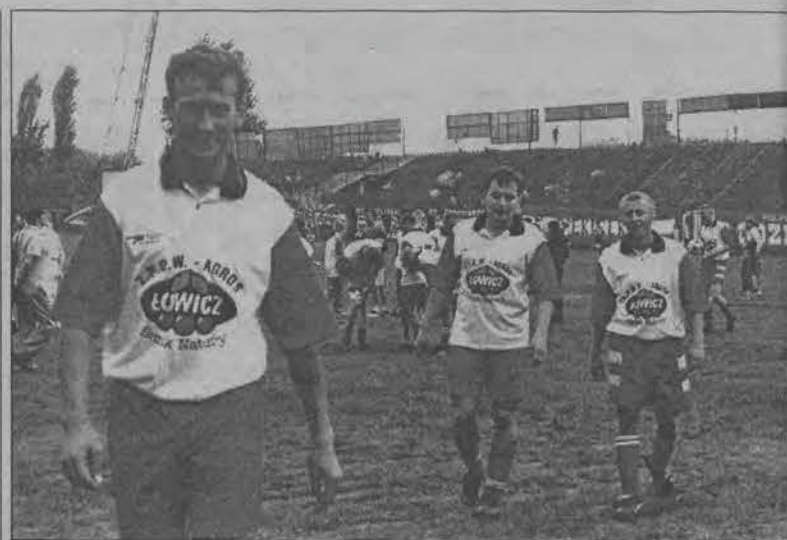
Łowiccy kibice Widzewa okazali się mocni nie tylko „w gębie”