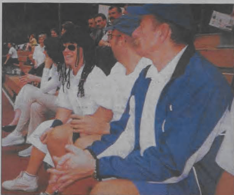
Na turniej tenisowy przybyły gwiazdy estrady i srebrnego ekranu.