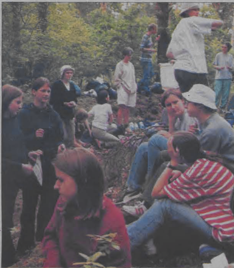
Ubiegłoroczna sesja dla młodzieży w Puszczy Kampinoskiej. W tym roku Wspólnota Chemin Neuf zaprasza w góry.

Jak co roku z parafii na Korabce zorganizowany zostanie wyjazd dla młodzieży w okolice Augustowa na spływ kajakowy w II połowie lipca. Spływ będzie trwał dwa tygodnie, koszt na jednego uczestnika będzie wynosił 300 - 400 zł. Z wyjazdu skorzysta około 40 osób. Spływ będzie odbywał się rzeką Czarną Hańczą