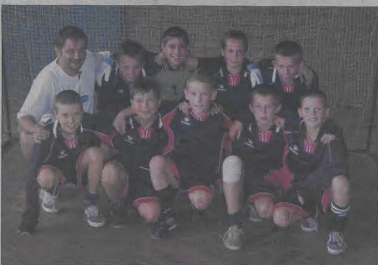
Po raz drugi w historii triumfatorami jedenastolatków okazali się gracze SP 4 Łowicz.