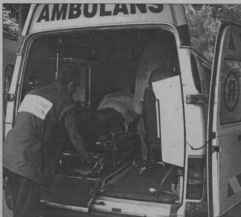
Gdy pod szpital podjeżdża karetka, liczy się czas. Dlatego SOR musi mieć odrębne wejście dla pacjentów i podjazd dla karetek. Zdjęcie zrobione przed głównym wejściem szpitala.

Jeżeli łowicki szpital zostanie zaakceptowany jako placówka biorąca udział w programie ministerialnym, na pewno konieczna będzie modernizacja pomieszczeń i mała przeprowadzka w szpitalu. Ponieważ SOR musi znajdować się na parterze i jego mini-