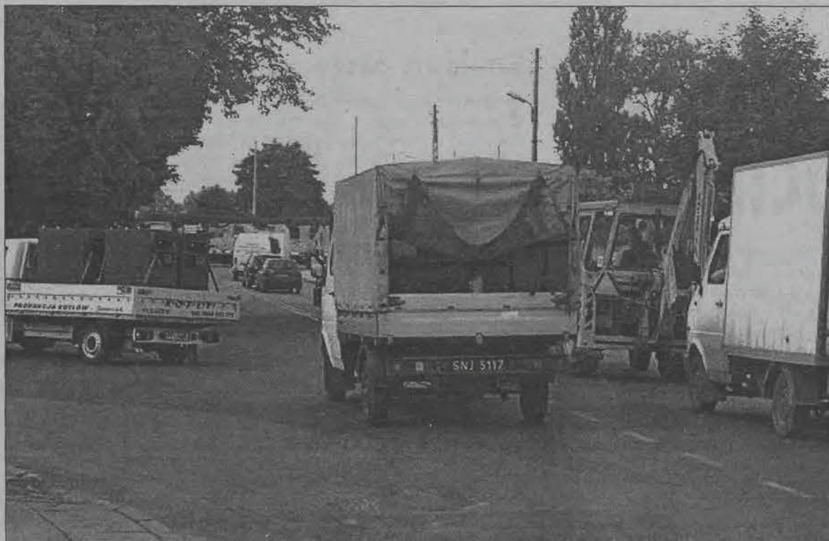
Ruch na skrzyżowaniu ulicy Warszawskiej i Bolimowskiej w piątek około godz. 10.