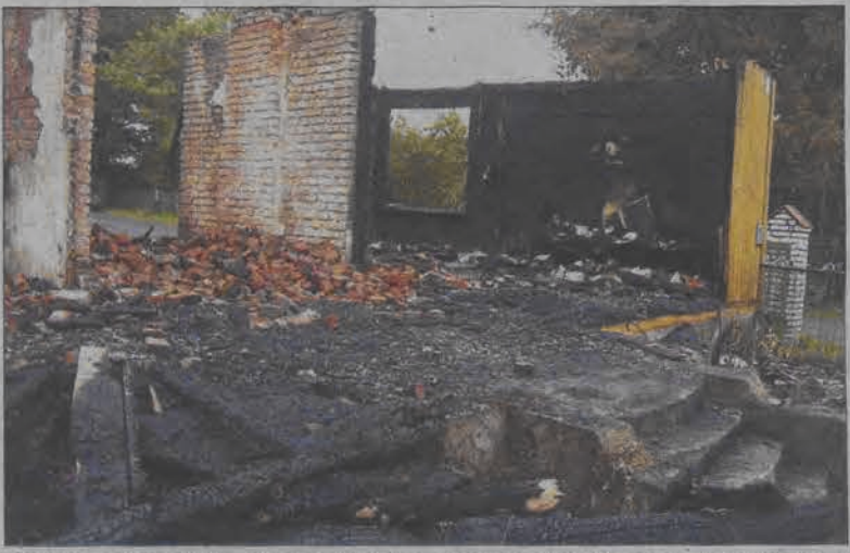
Sześć osób zdołało ująć z życiem z pożaru drewnianego domu mieszkalnego, który spłonął niestety doszczętnie, w nocy z niedzieli na poniedziałek w Boczkach Chełmońskich. O tragedii czytaj na str. 4.