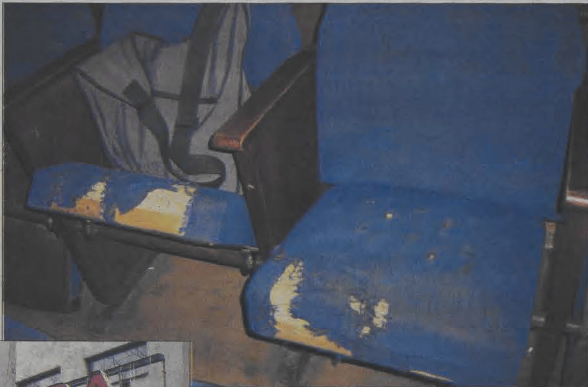
Nie wszystkie fotele tak wyglądają, ale na sali kinowej można znaleźć jeszcze gorsze.

Na 31 maja przewidziany jest koniec remontu domu kultury przy ulicy Podrzecznej 20, w czasie wakacji Łowicki Ośrodek Kultury przeniesie się tam z dotychczasowej siedziby przy ulicy Pijarskiej - na której zostanie tylko kino. Sytuacji prawnej administrowanego przez miasto budynku kina w żadnym stopniu to jednak nie zmieni, pozostanie ona nadal niewyjaśniona. Za interesowane gmachem są dwie strony: Urząd Miejski i powstałe w 1994 roku w Łowiczu Towarzystwo „Dom Ludowy” uznające się za dziedziców towarzystwa z 1934 roku, które budynek wybudowało. Przeciagający się proces ustalania prawowitego właściciela budynku powoduje, że wnętrze kinowej sali nie odpowiada już jakimkolwiek standardom. Wysiedzenie w ustawionych zbyt blisko siebie, zniszczonych i liczących prawie 30 lat fotelach w czasie dwugodzinnego filmu to nie lada wysiłek.