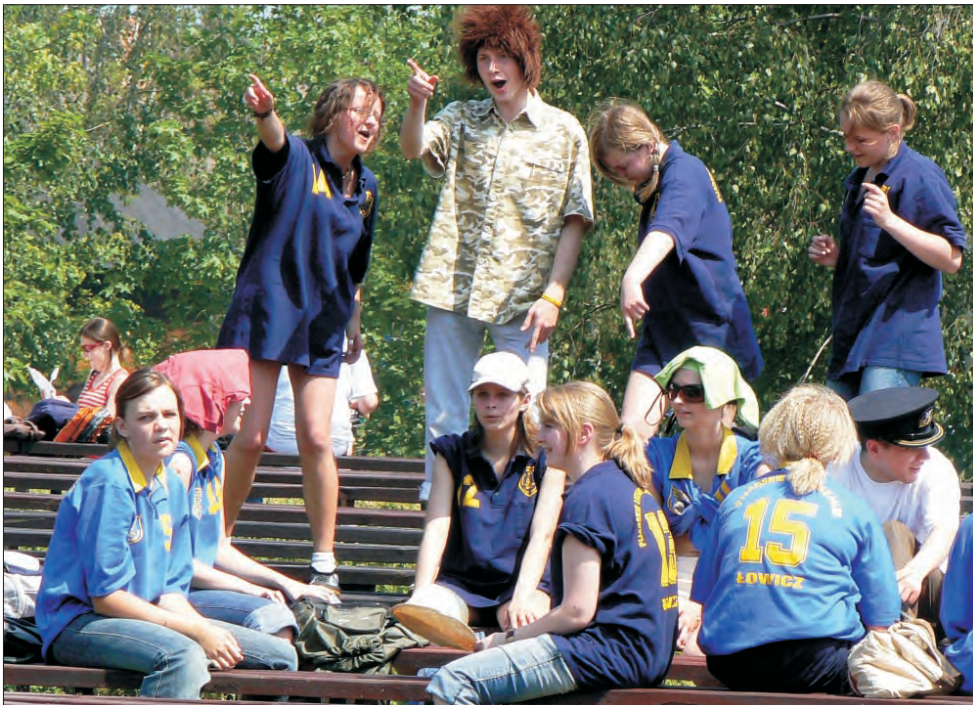
Licealiści z zapalem kibicowali młodszym kolegom podczas prezentacji klasowych.