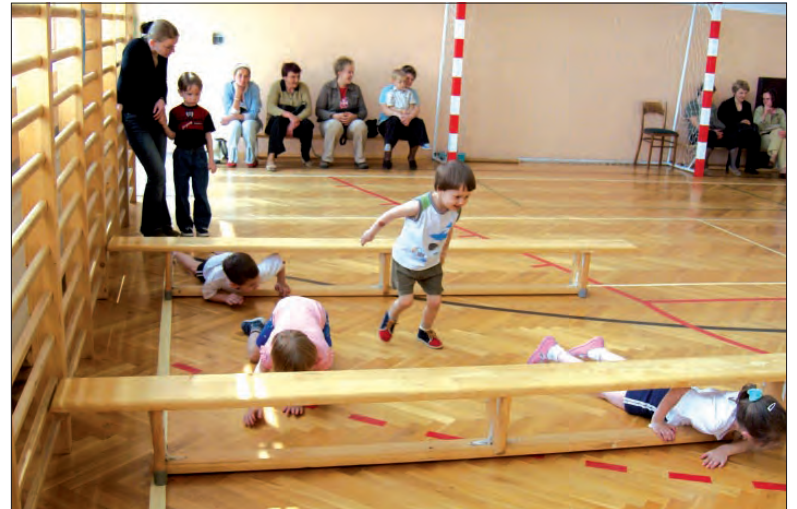
Przyszli jak i obecni zerówkowicze, udając samochody, wykonują ćwiczenia na gimnastycznych ławeczkach.