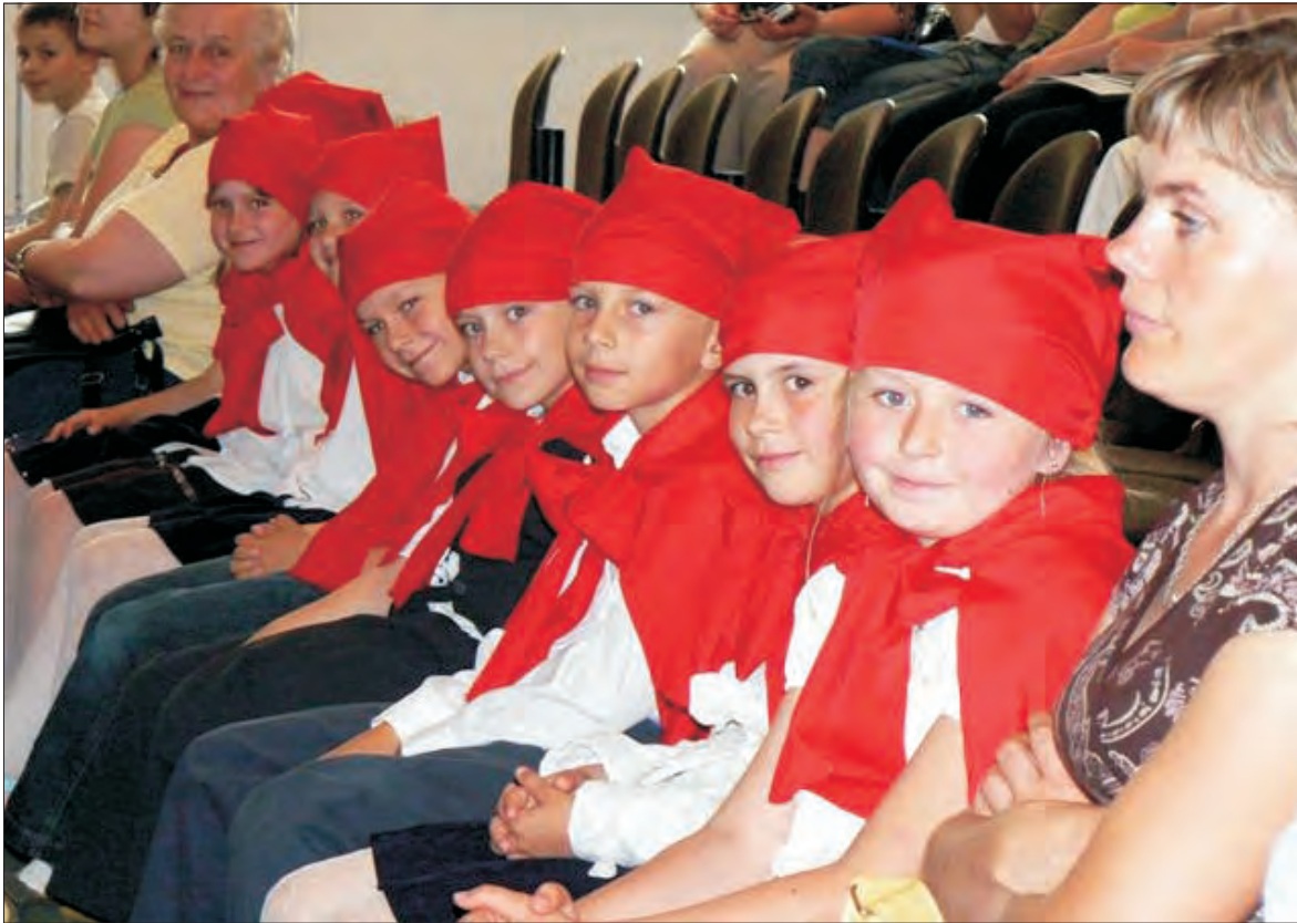
Karasoludki z Wygody.