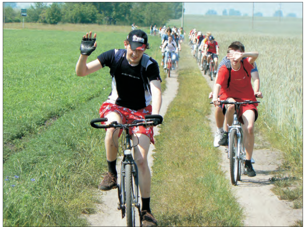
Lejący się z nieba żar nie spowolnił jazdy na rowerach.

Na miejscu uczestnicy wyprawy rozstawili sprzęt nagłaśniający, przy-