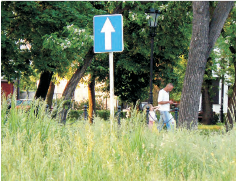
Sięgająca pasa trawa na zieleńcu przy skrzyżowaniu ulic: Nowej i Alei Sienkiewicza musi jeszcze poczekać na koszenie.