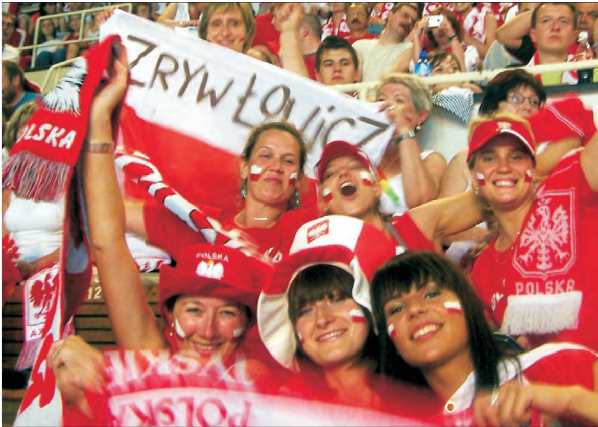
Po raz kolejny w Łodzi rozgrywane były mecze siatkarskiej Ligi Światowej, a na trybunach pojawiła się jak zwykle spora grupa fanatyków z Łowicza. Na zdjęciu niezwykle sympatyczne zawodniczki KS Zryw Łowicz.