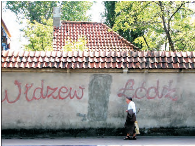
Czerwona farba jest też obecna na murach łowickiego muzeum.