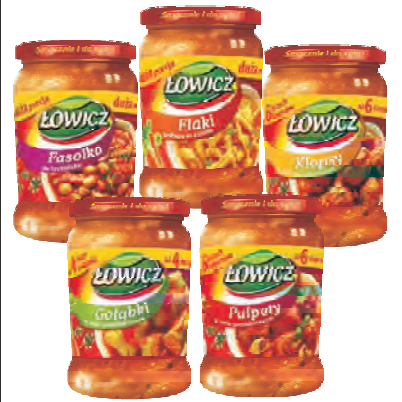
Dania gotowe firmy Agros Nova mają logo marki Łowicz znane z opakowań sosów.