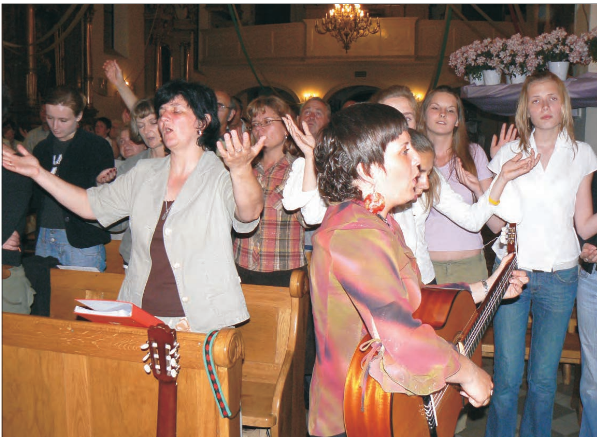
Głośnym i radosnym śpiewem modlili się w nocy z soboty na niedzielę członkowie wspólnot Odnowy w Duchu Świątym.