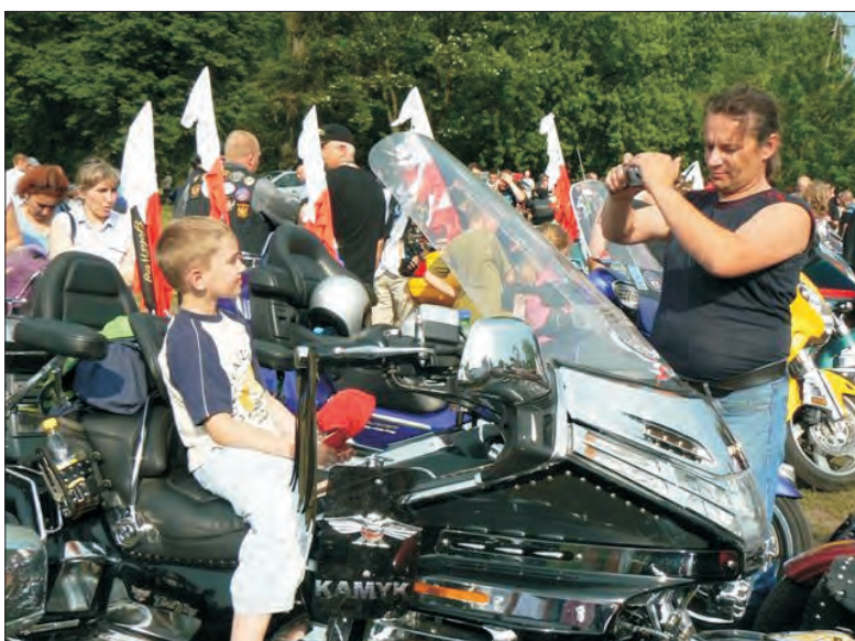
Pamiątkowe zdjęcia na co atrakcyjniejszym motocyklu. Pozowały przede wszystkim dzieci, ale nie tylko.

się, że aż 200. Do godziny 17.00 trwał po- kaz możliwości terenowych kartingów oraz motocykli krosowych.