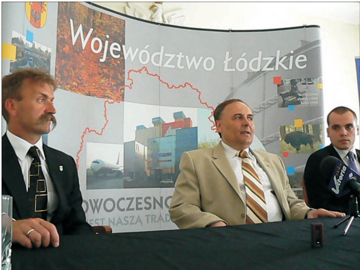
Marszałek Włodzimierz Fisiak (w środku) przywiozł do Łowicza dobre wiadomości.