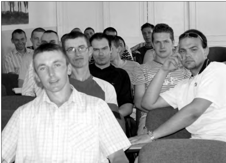
Słuchacze policealnego studium na Blichu z zainteresowaniem słuchali czego oczekują od nich potencjalni pracodawcy.

„Funkcjonowanie firmy ochroniarskiej na rynku pracy” to temat spotkania z pierwszym i drugim rokiem słuchaczy Policealnego Studium Ochrony Fizycznej Osób i Mienia w Łowiczu, które odbyło się 27 maja w ZSP nr 2 na Blichu.