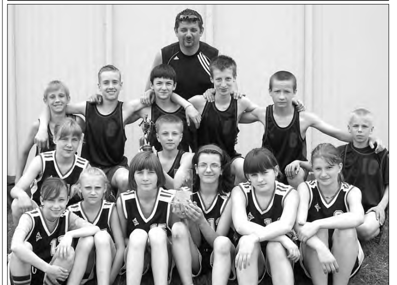
Tym razem awans na zawody rejonowe wywalczyły obie drużyny z „Czwórki”.

Sport szkolny - Powiatowe IMS w czwórboju la