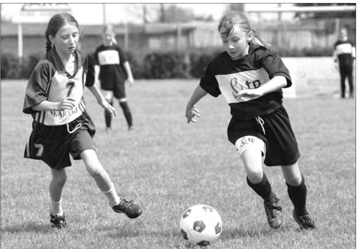
Reprezentantki SP Skarłatki pojedą na ogólnopolski półfinał do Ciechanowa.

Piłka nożna - eliminacje do XII Turnieju im. Marka Wielgusa