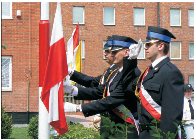
Uroczystość przy strażnicy rozpoczęła się wciągnięciem flagi państwowej na masz.