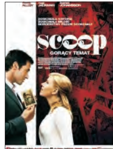
„Scoop - gorący temat” w reż. Woody Allena.

Pierwszy seans „W poniedziałek rano” w reżyserii Otara Josselianięgo odbędzie się 14 czerwca. Tydzień później, 21 czerwca, wyświetlony zostanie film Woody Allena „Scoop - gorący temat”.