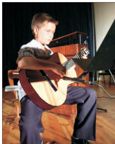
Sobotni koncert młodych adeptów muzykowania, obecnie pobierających nauki w Społecznym Ognisku Muzycznym.