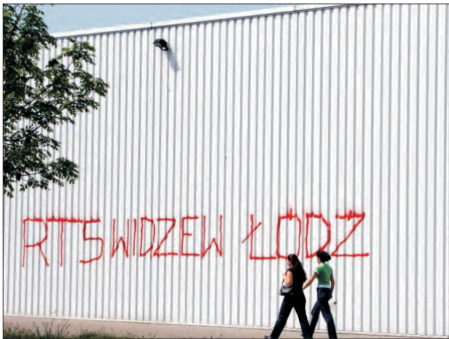
Ostatnio napis Widzewa pojawił się na budynku Intermarche. Naprawa takiej szkody to nawet 10 tys. zł.