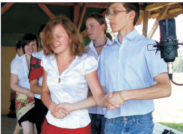
Duże owacje zebrała ludowa prezentacja klasowa.

gotowali boiska do rozgrywek, rozstawiono grill z kiełbaskami i kaszanką, w jednym z ocienionych pomieszczeń posiłek można było się ciastem - przygotowali je rodzice uczniów klas pierwszych i drugich, którzy też zadbał o dostarczenie wypieków na miejsce.