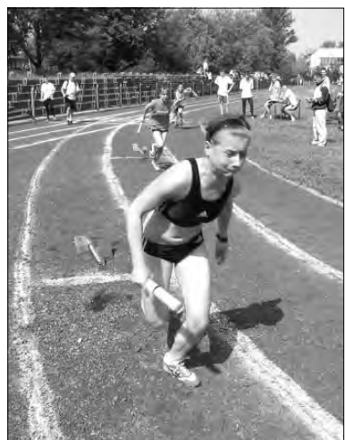
W sztafecie 4x100 m dziewcząt najlepszą okazała się ekipa GP 3.