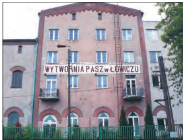
Główny budynek dawnej Paszarni jeszcze czeka na nabywcę, jeżeli klient się nie znajdzie - zostanie rozebrany.

Pierwsze rozmowy z notariuszem w sprawie sprzedaży działek łowickim przedsiębiorcom zostały przeprowadzone w ubiegłym tygodniu. Firma Provimi Rolimpex, która była właścicielem firmy „Dobropasz”, wycofała się z prowadzenia działalności przy ul. Klickiego z uwagi na zły stan techniczny obiektów, które wymagały modernizacji. Powodem był ponadto brak dostatecznej sprzedaży wytwarzanych produktów, a co za tym idzie ich nadprodukcja. Firma wycofała się z Łowicza na początku 2004 roku. Od ponad 2 lat próbuje sprzedać swój teren przy ul. Klickiego.