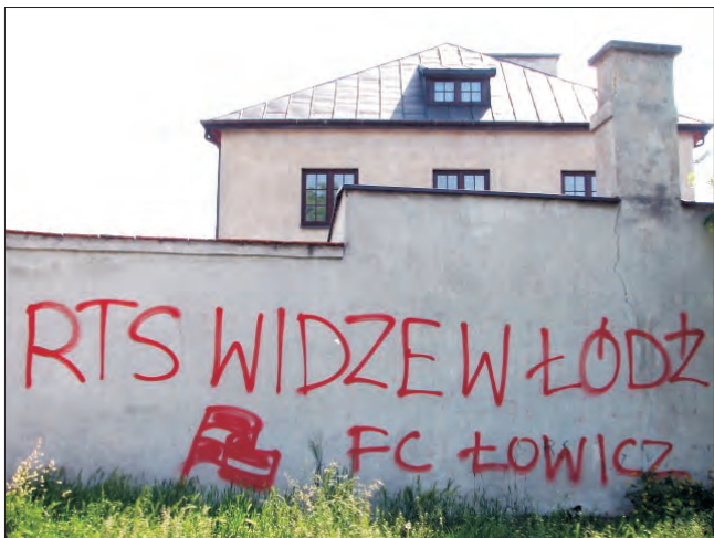
Na klasztorze bernardynek już od dawna napis szpeci „szary mur”.