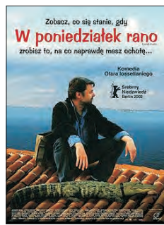
„W poniedziałek rano” w reż. O. Josselianięgo.

Gruziński reżyser Otara Josseliani już od ponad 20 lat tworzy we Francji filmy pełne barwnych postaci, przedstawione z odrobiną ironii i subtelnym humorem.