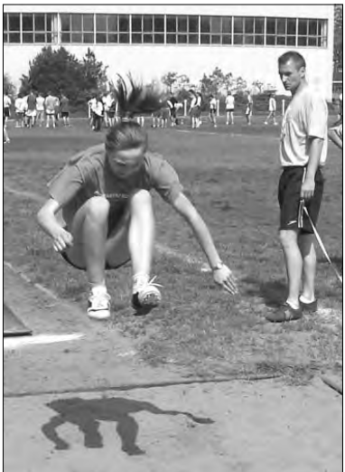
Na skoczni w dal tym razem odległości nieco krótsze.