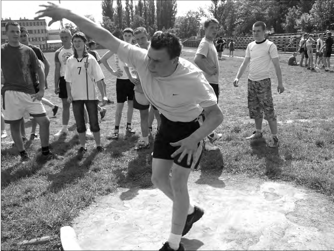
Gimnazjaliści biegali, skakali i... pchali.

Sport szkolny - Powiatowa Gimnazjada Szkolna w lekkiej atletyce