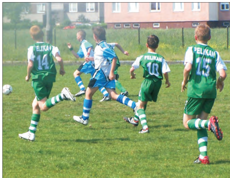
W ostatnim meczu ligi orlików Pelikan I wygrał z drugim zespołem aż 9:0.