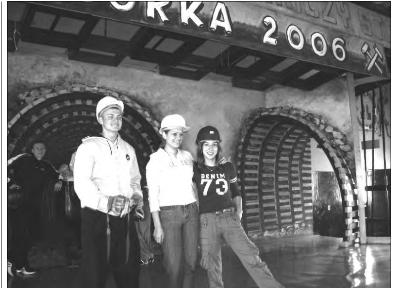
Co prawda uczennice nie wyglądają na górników, ale w kaskach im do twarzy.

Pod hasłem „Spotkania z Kalasancjuszem” odbędą się w sierpniu 2 turnusy obozów dla dzieci i młodzieży w miejscowości Koninki w Gorcach. Organizatorem tego przedsięwzięcia jest również Stowarzyszenie Parafiada. Weźmie w nich udział około 300 osób. W programie obozu przewidziana są m.in. wycieczki. (mwk)