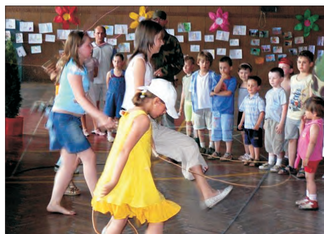
W konkursach sportowych brały udział nie tylko przedszkolaki, ale także ich starsze rodzeństwo.

Święto Rodziny rozpoczęły 26 maja o godzinie 10.00 maluchy programem artystycznym skierowanym do rodziców i dziadków. Hala ośrodka sportu została zastawiona stolikami kawiarnianymi. Ustawiono je również na zewnątrz budynku. Stoły uginały się od smakołyków. Sałatki i surówki przygotowywały mamy, słodycze zakupi-