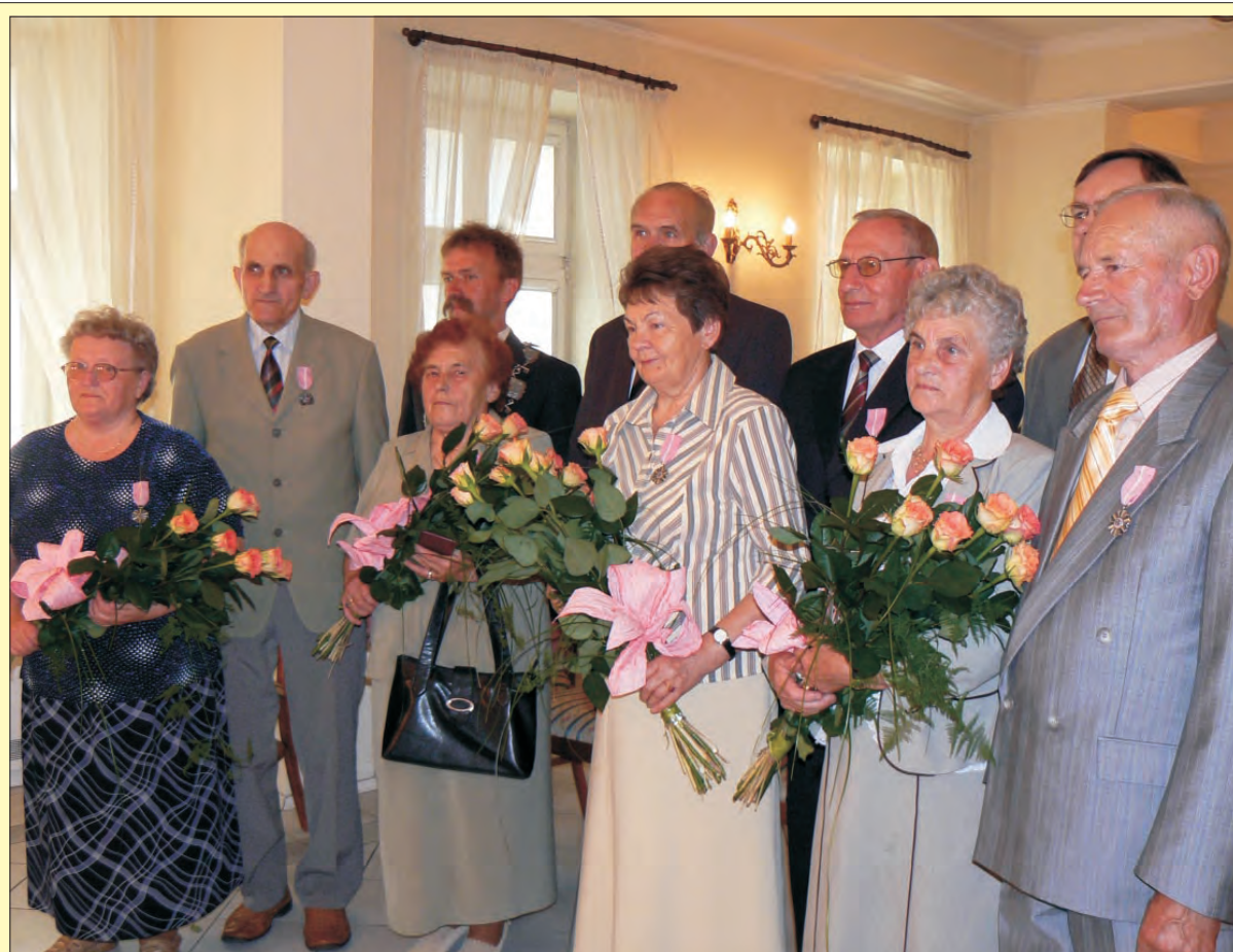
Pamiątkowe zdjęcie małżonków z 50-letnim stażem.

Dodatkowymi atrakcjami święta będzie prezentacja samochodów marki Toyota z możliwością odbycia jazdy próbnej, wojskowa grochówka i słodki poczęstunek przygotowany przez działające na terenie gminy Chąśno Koła Gospodyń Wiejskich. (tb)