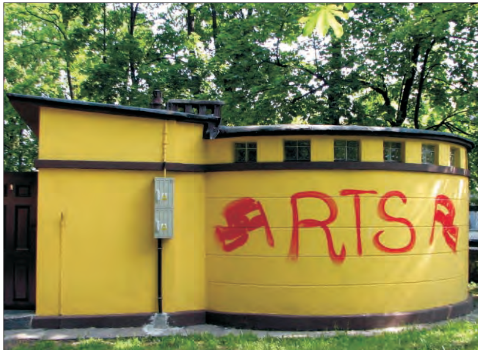
Niedawno odnowiony miejski szalet będzie trzeba ponownie pomalować dzięki działalności „kibiców” Widzewa.