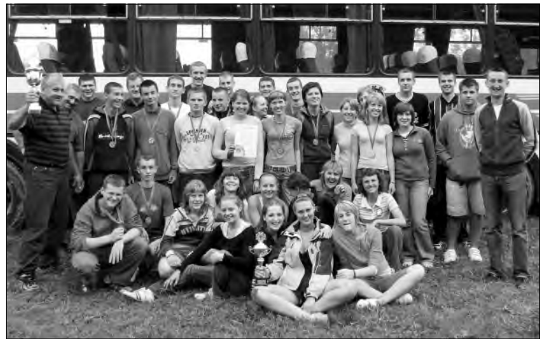
Tym razem ekipa z Ziemi Łowickiej zajęła piąte miejsce.