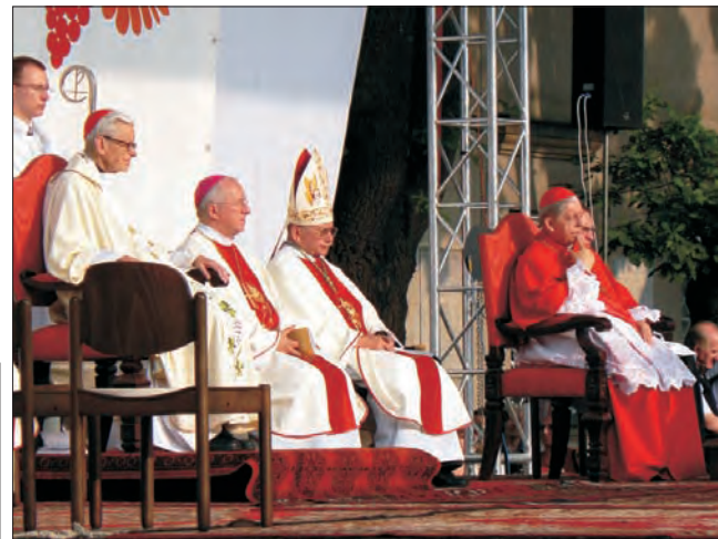
To tylko niektórzy z biskupów obecnych na uroczystości: od lewej kard. F. Macharski, bp A. Dziuba, bp A. Orszulik i prymas J. Glemp.