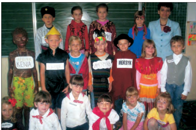
Pierwszoklasiści i zerówkowicze ze szkoły w Wygodzie razem przygotowali program dla swoich młodszych kolegów.