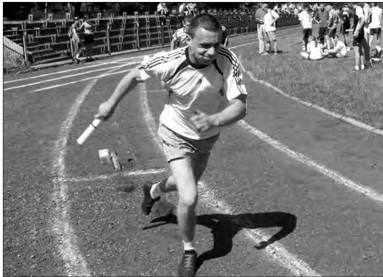
Tegoroczna rywalizacja rozpoczęła się od sztafet 4x100 m.