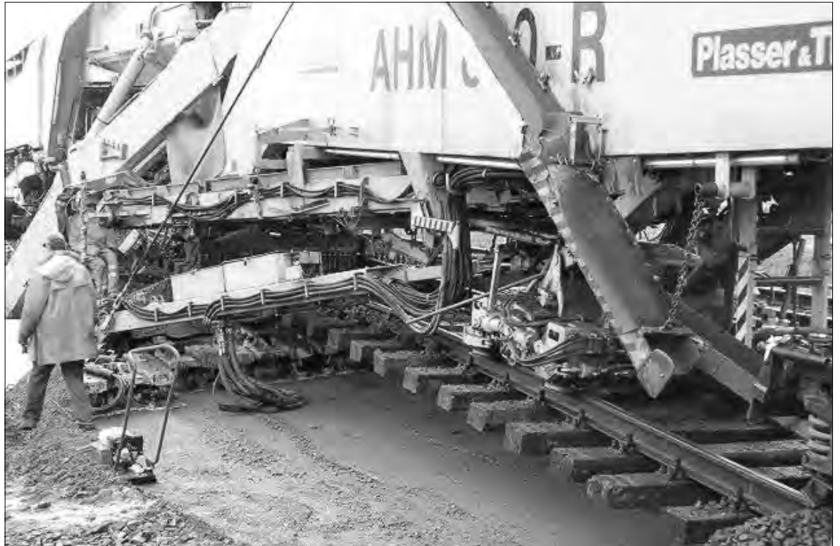
Wielkie, specjalistyczne maszyny, które unosiły torowisko, modernizowały dwa lata temu linię kolejową w stronę Kutna. Roboty o jeszcze większym zakresie mają być przeprowadzone w kierunku Łodzi w przyszłym roku.