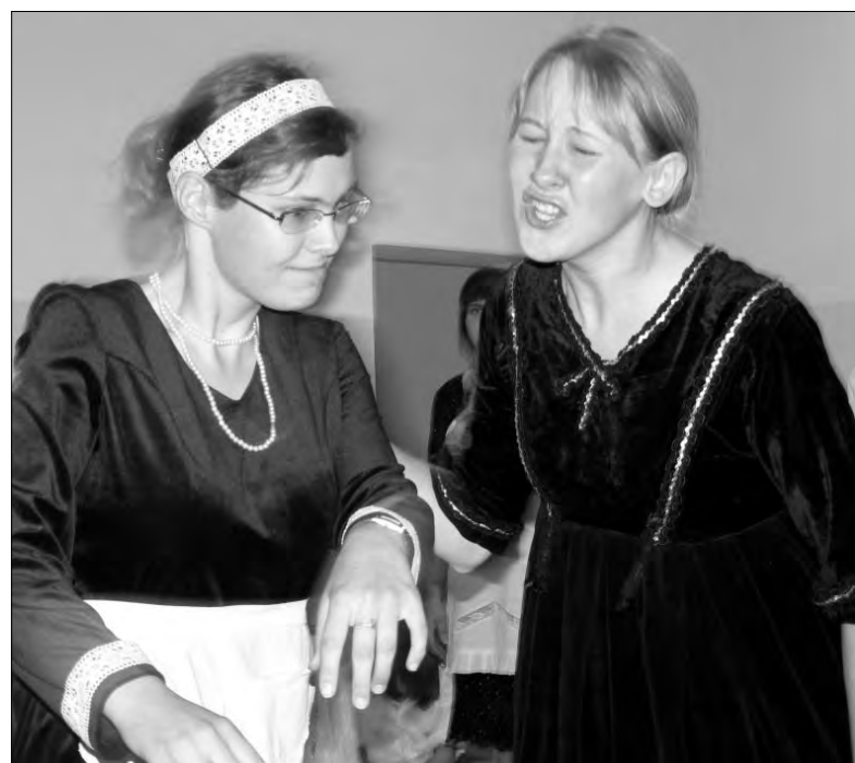
Świętoszek jest komedią, jednak emocji i ekspresji na scenie nie brakowało.