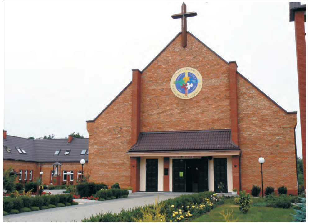
Parafia na Korabce erygowana była w 2000 roku, o czym przypomina napis z symbolem Wielkiego Jubileuszu. 30 czerwca odbędzie się konsekracja kościoła.

Przed tą uroczystością w kościele na Korabce zamontowany zostanie nowy ołtarz z granitu, wykonany przez firmę Granmos z okolic Radomia. Nowy ołtarz będzie repliką drewnianego ołtarza papieskiego, który na Korabce jest od początku istnienia kościoła. Przypomnijmy, że jest to ten ołtarz, przy którym 14 czerwca 1999 roku mszę św. w Łowiczu sprawował Jan Paweł II. Na ołtarzu tym znajdują się rzeźby symbolizujące ewangelistów, które odtwo-