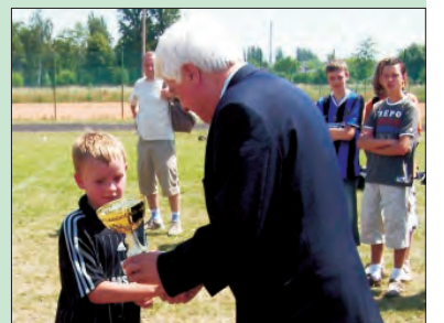
Kolejne zwycięstwo Primy-1.