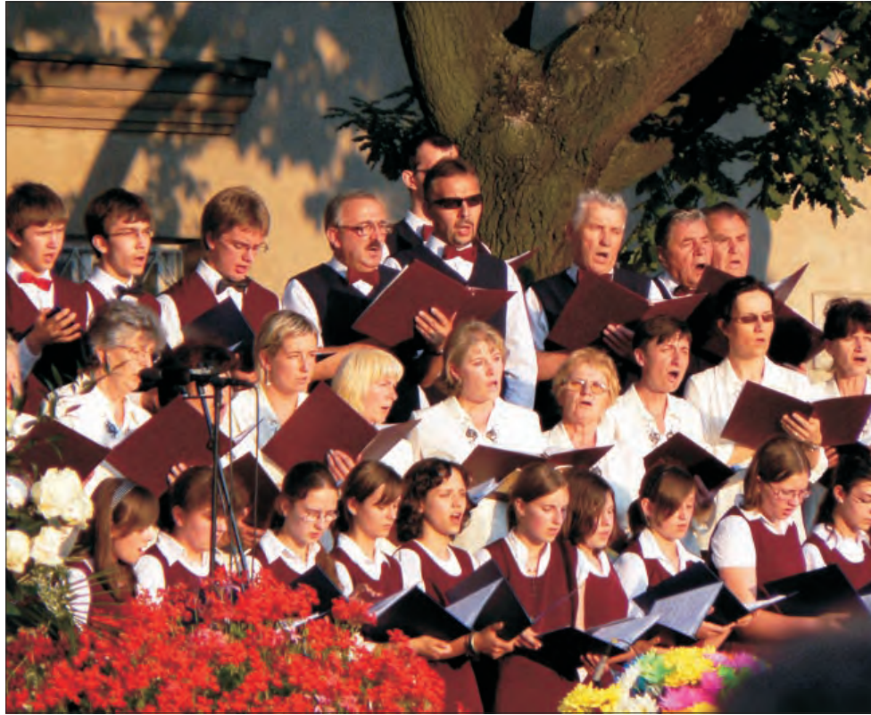
Pięknie wyglądali w zachodzącym słońcu chórzyci z Sochaczewa. Śpiewali jeszcze pięknie.

brali udział, przeżyli piękną uroczystość, w której uczestniczyli m.in., oprócz biskupów łowickich, także abp łódzki Władysław Zieliński, a nadto prymas Józef Glemp i kard. Franciszek Macharski. W ciepły, pogodny wieczór, nad Starym Rynkiem rozbrzmiały na zakończenie piękne strofy Te Deum , śpiewane przez wiernych i znakomity chór, stworzony przez chórzystów Towarzy-