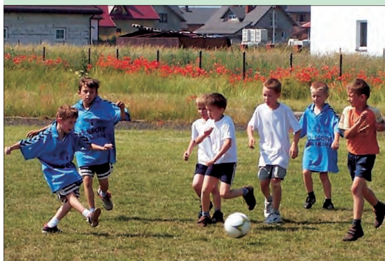
Na razie jeszcze wszyscy próbują biegać za piłką...