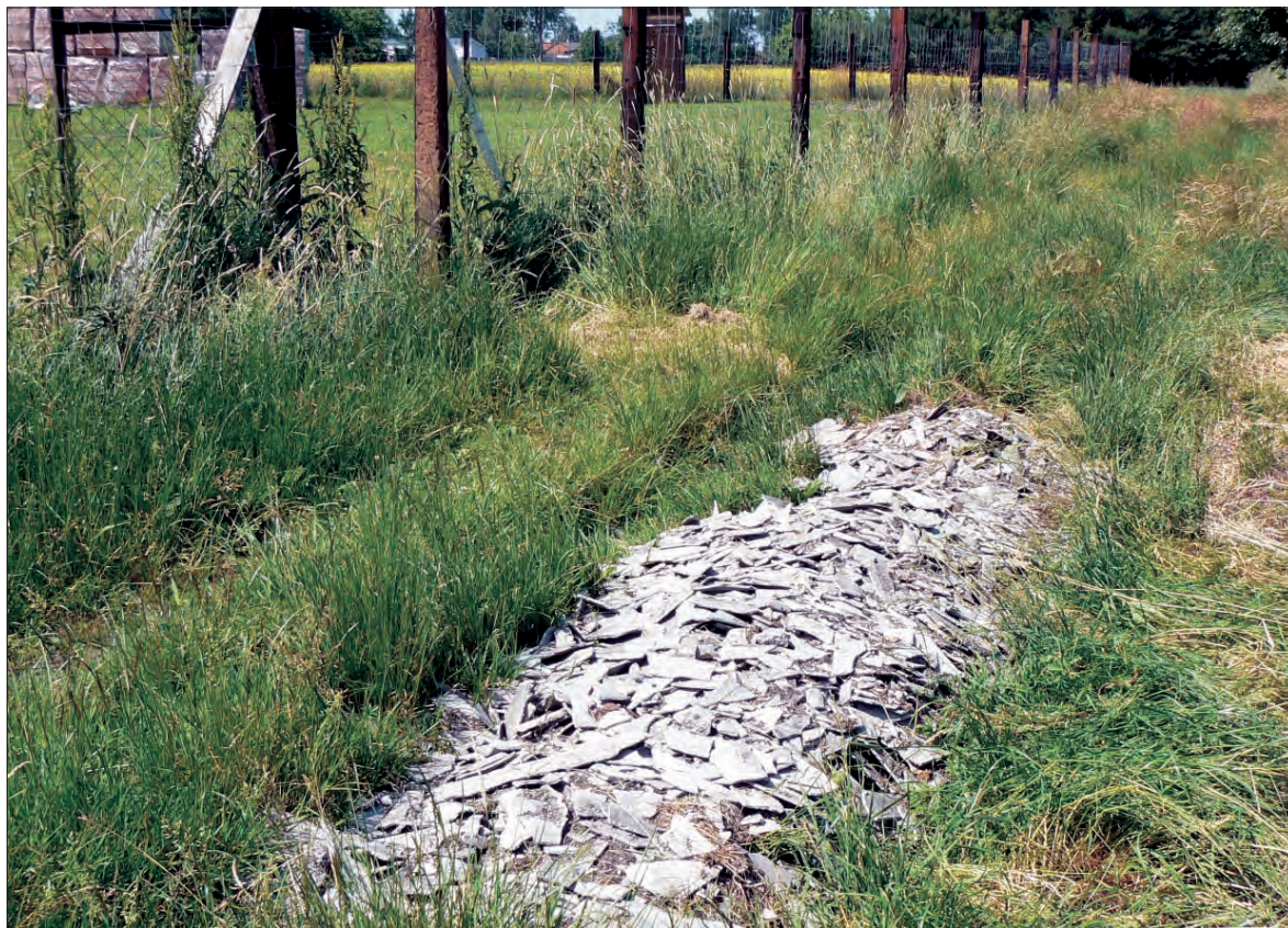
Potłuczony eternit został wyrzucony tuż za ogrodzeniem prywatnej posesji.