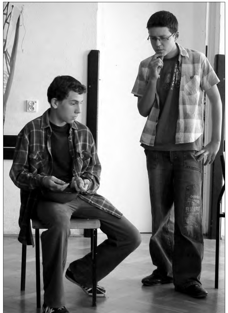
Tym razem uczniowie wcieli się w parę Szkotów, którzy są sąsiadami. Jeden z nich próbuje pożyczyć od drugiego motocykl, samochód lub buty.