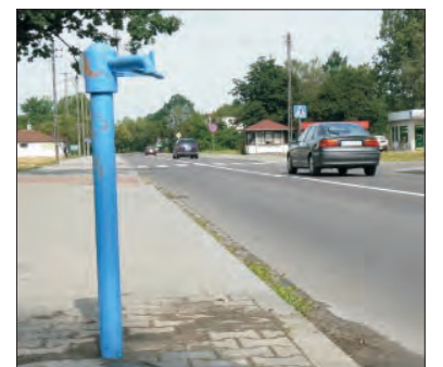
Ciekąca pompa ma zostać wkrótce wymieniona na nową.

Koszt wymiany to 500 złotych. Kierownik Wydziału Wodociągów i Kanalizacji ZUK Zbigniew Bochenek obiecał do czasu wymiany zabezpieczyć ciekącą pompę, zaznacza jednak, że przeciek wynika ze złego ułożenia rączki pompy. Kiedy zostanie ona w złej pozycji, strużka wody znów będzie ciekła. - Najlepiej byłoby zli-