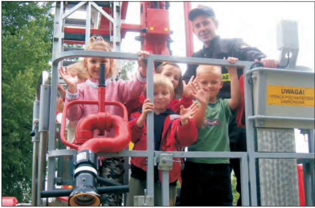
Największą frajdą dla dzieci okazał się podnośnik wozu strażackiego, który według nich jest sto razy lepszy od karuzeli.