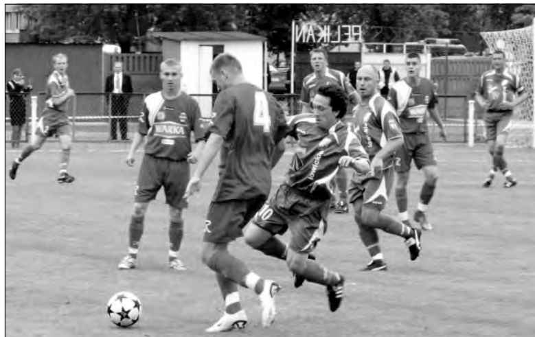
Dziś szkoda Pelikanowi, że nie udało się wygrać np. z Radomiakiem, Gossostalą, czy Świtem.

W meczach barażowych o prawa gry w skierniewickiej lidze okręgowej mierzą się Orleća Cielądz z Kopernikiem Kierozia. Pierwszy mecz odbędzie się w niedzielę 24 czerwca o godz. 17.00 w Kieroziu, a rewanż w niedzielę 1 lipca o godz. 17.00 rozegrany zostanie w Cielądzu. Paweł A. Doliński