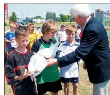
Najlepsi gracze XVI edycji.