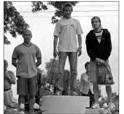
Na podium dwaj łowiczanie.