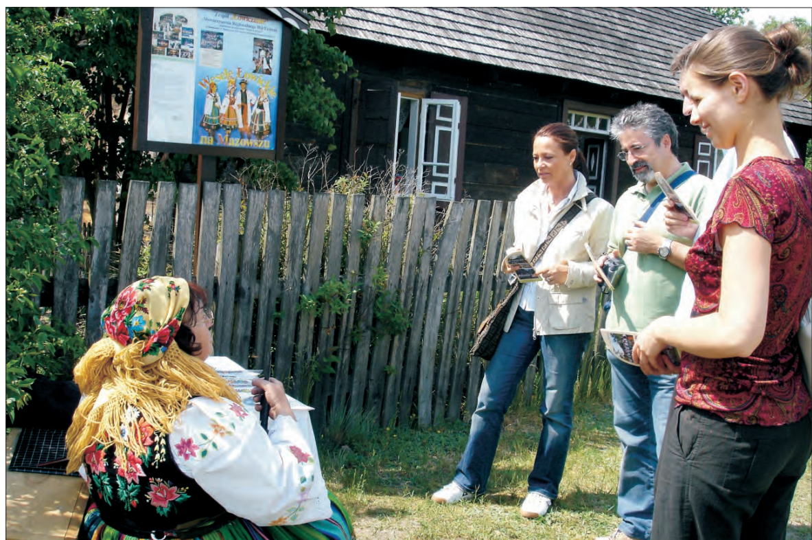
Łowicka chata jest chętnie odwiedzana nawet w Kampinoskim Parku Narodowym.