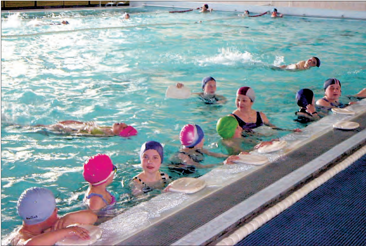
Jeśli w Łowiczu nie będzie prywatnych szkółek, odpłatną naukę i doskonalenie pływania prowadzić będą instruktorzy zatrudnieni na basenie. Młodzi łowiczanie i tak uczą się pływać na lekcjach wf.