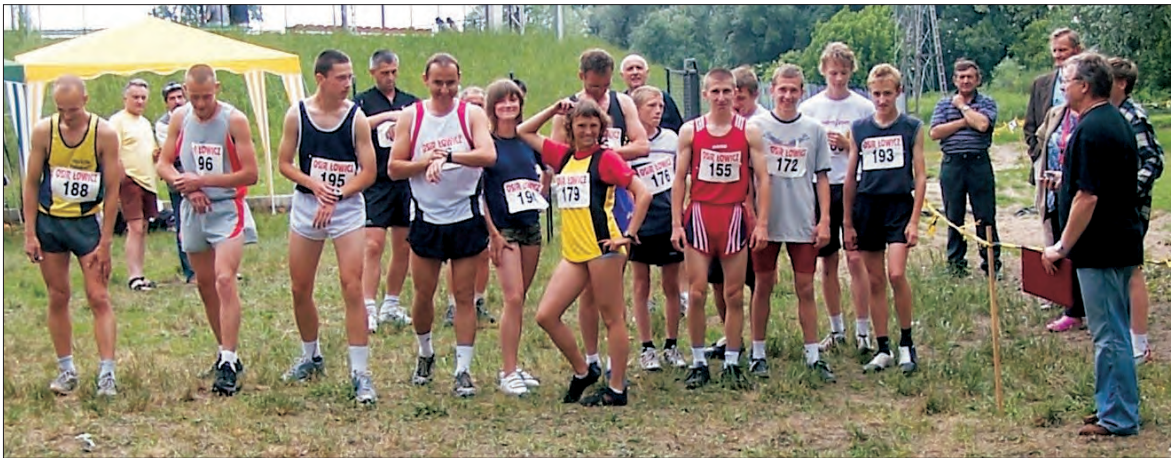
Najliczniej obsadzony był bieg główny na dystansie 5 km, w którym wystartowało 16. zawodników.