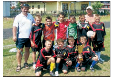
Po raz piątą najlepszą ekipę z SP 4.