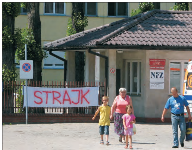
Strajk w łowickim szpitalu trwa bez zmian. Związkowcy mówią o możliwości jego zaostrenia.