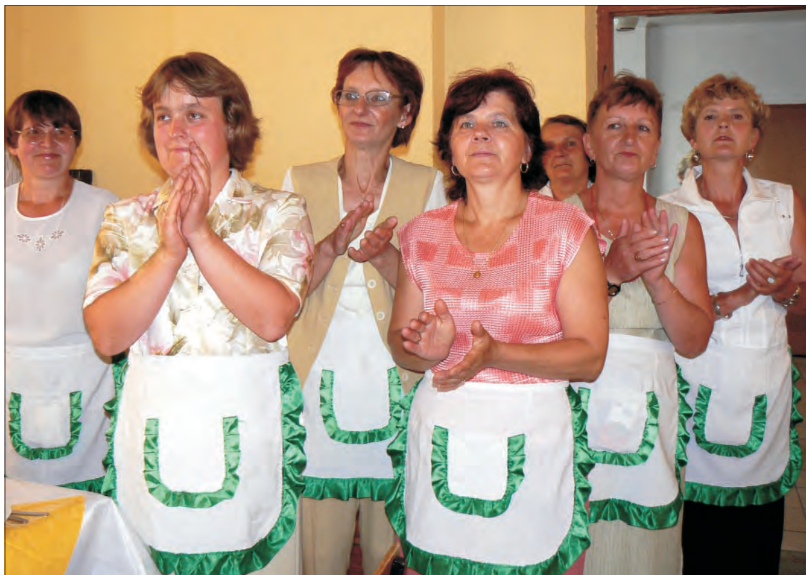
Członkinie koła pracujące przy organizacji jubileuszu 55-lecia organizacji.

Start imprezy ustalono na godz. 21.00, koniec około 4 rano, bilet wstępu kosztuje 20 zł. Organizatorzy przewidują, że na stadion OSiR przyjdzie z ponad 5 tysięcy osób. W ubiegłym roku w Łyszkowicach było około 4 tysięcy. (mak)