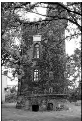
Baszta Klickiego - zabytkowy obiekt uratowany przed całkowitą dewastacją.

wieckiej Fundacji Społeczno-Kulturalnej spisany pomiędzy miastem a fundacją 9 lutego 2000 roku. Baszta została zakupiona na działalność kulturalno-charytatywną nie związaną z działalnością zarobkową za kwotę około 10 tysięcy zł. Paragraf 5 punkt „a” tej umowy określa, że strona nabywająca zobowiązuje się do zagospodarowania nieruchomości poprzez doko-