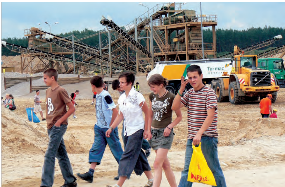
Kopalnię w Kalenicach zwiedzały głównie grupki młodzieży.

Grupa Tarmac rozpoczęła swą działalność na rynku polskim w 1997 roku od nabycia większościowego pakietu udziałów we Wrocławskich Kopalniach Surowców Mineralnych S.A. Obecnie w skład grupy wchodzi 5 przedsiębiorstw; w sumie 14 zakładów, które mogą dostarczać na rynek ponad 7 mln ton kruszyw rocznie. Zakłady Tarmac Kruszywa oferują żwiry, piaski oraz grysy granitowe i kwarcytowe. W regionie centralnym Grupa Tarmac rozpoczęła działalność w 2001 od nabycia pakietu większościowego w Kopalniach Surowców Mineralnych „Kosmin” Sp. z o.o. do których należą między innymi kopalnie Czatolin oraz Rydwan-Guźnia. Kopalnia