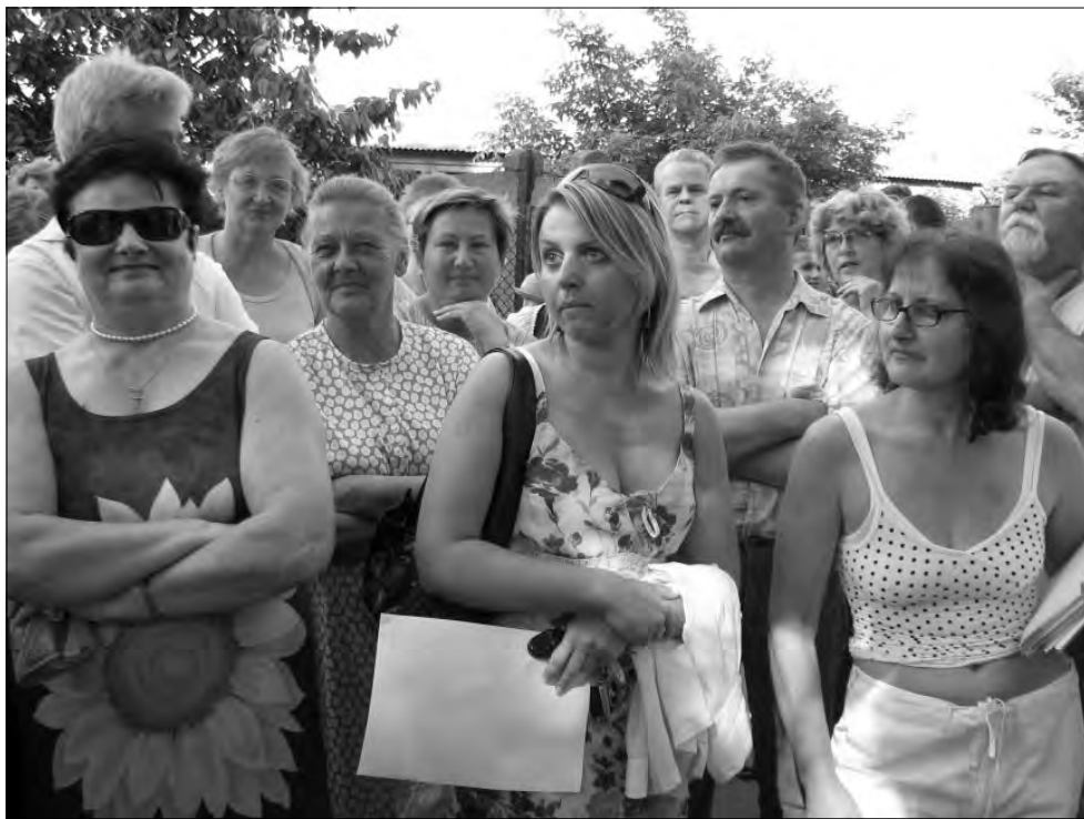
Mieszkańcy są zdeterminowani, chcą aby teren wokół baszty wrócił pod skrzydła miejskie.

Decydujące zmiany w sprawach własności baszty wprowadził akt notarialny jej sprzedaży i przekazania w użytkowanie wieczyste gruntu w jej sąsiedztwie na rzecz Mazo-