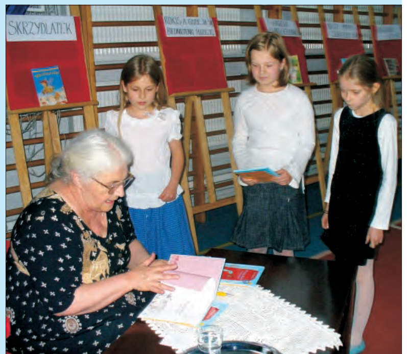
Uczniowie „Siódemki” z niecierpliwością czekają na autograf pisarki.