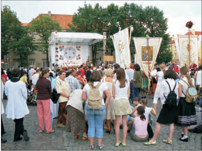
Wierni przyszedli na mszę św. kończącą Kongres, ale tłumów nie było.

Być może też formuła Kongresu Eucharystycznego, jako sposobu publicznego wyrażenia wiary, już się przeżyła, być może trzeba szukać form innych, bardziej odpowiadających wrażliwości współczesnego człowieka. Ci jednak, którzy w mszy św. przed gmachem muzeum