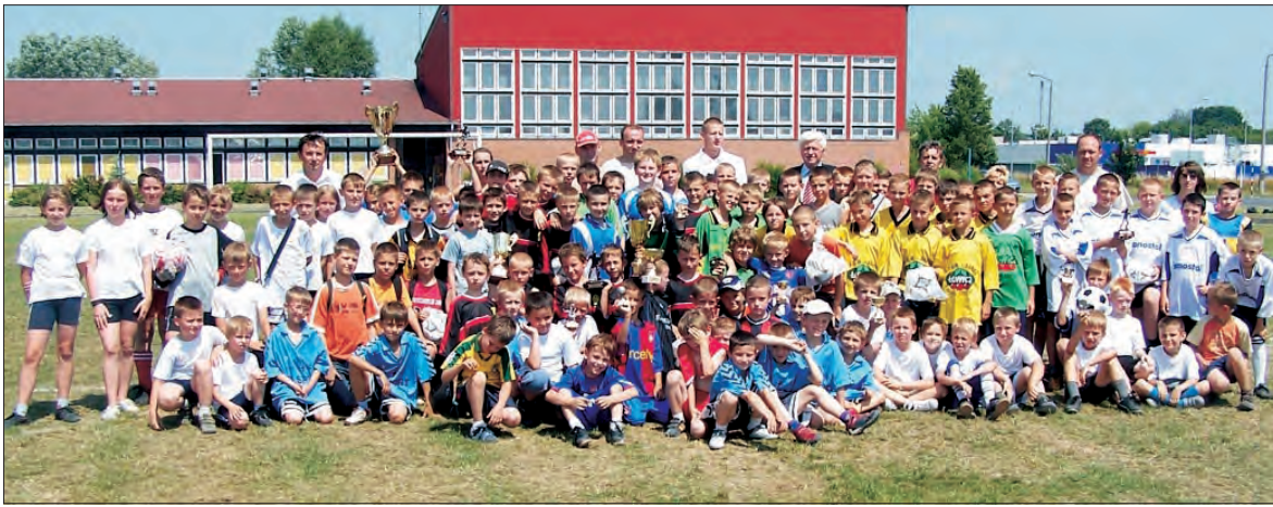
Ostatecznie w turnieju jedenastolatków zagrało osiem zespołów, a wśród ośmiolatków trzy.

Piłka nożna - XVI edycja Turnieju Jedenastolatków o Puchar NŁ