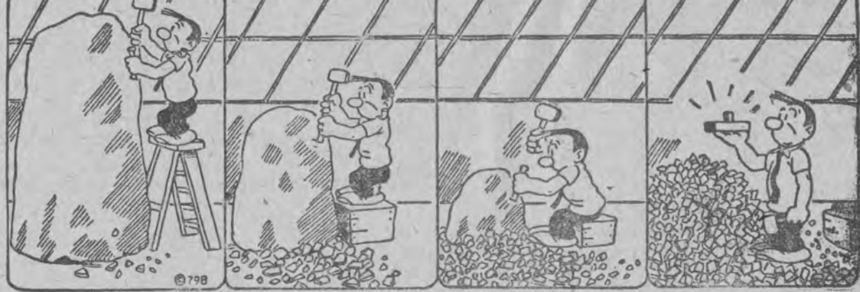
Zabawa w rzeźbiarzal Robota idzie aż miło. Niedługo skończą! Proszę, jaki piękny przycisk!