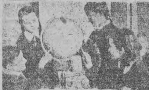
Nauka przy globusie