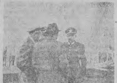
Pelzhausen składa meldunek na dziedzińcu więzienia „dostojnikom” z Rzeszy.

Wstrząsający akt oskarżenia odsłania potworny obraz katuszy, zgrozy i mordów