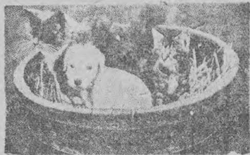
Lada wśród nieprzyjaciół

— I powiedziec na razie nie mogę... — Cóż to za tajemnica! — obraziła się Oleńka.