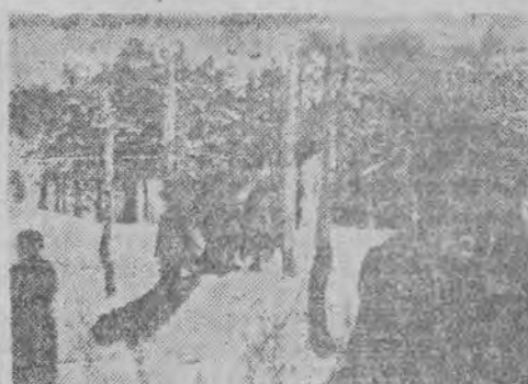
Egzekucja w lesie Łuźmie ekim. Pelzhausen osobiście eskortował 100 przewożonych więźniów tramwajem na tę egzekucję, która wstrząsnęła całą Łodzią.

Montaż 78-metrowego masztu wykonano w rekordowym czasie zaledwie 4-ch tygodni. Porcelanowe izolatory, potrzebne do wieży antenowej wykonała Państwowa Fabryka Porcelany w Chodzieży. 80 procent urządzeń radiostacji toruńskiej wykonali robotnicy polscy spod gruzów, a tylko 20 procent zakupiono i sprowadzono z zagranicy.