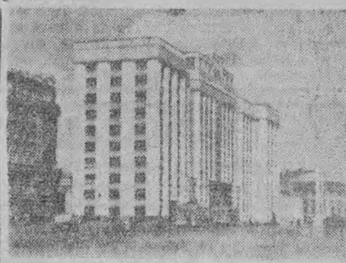
Dom Rady Ministrów ZSRR