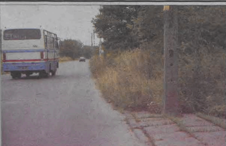
Chodnik wzdłuż ul. Chełmońskiego jest miejscami nie do przejścia. Na pewno widok taki nie należy do zbyt estetycznych, nie jest to także bezpieczne. Piesi zmuszeni są przez rosnącą na nim gęstą trawę do schodzenia na jezdnię. (tb)

dzie w terminie 29 lipca - 3 sierpnia. Jak planuje ks. Wiesław Frelek, opiekun KSM i proboszcz parafii na Korabce, w tygodniowym programie szkolenia będzie też przewidziany czas na zwiedzanie Łowicza i okolic. (mwk)