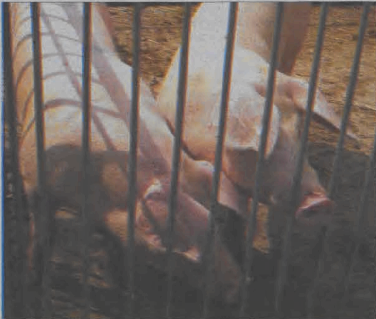
Młode knurki rasy pbz na wybiegu przy chlewni w Wyborowie.

Warchlaki o wadze 40-45 kg poddawane są typowaniu. Wtedy rolnik wraz z zootechnikiem wybiera najlepsze sztuki, które będą przeznaczone do hodowli oraz tzw. odpady - czyli zwierzęta, które będą poddane tuczo wi do odpowiedniej wagi i sprzedane na mięso. Jerzy Szachogłuchowicz mówi, że