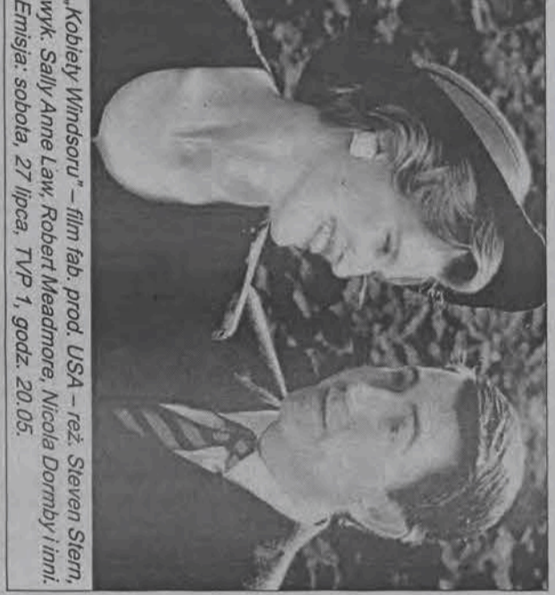
'Kobiety WindSORU' - film fab. prod. USA - reż. Steven Sliem, wyk. Sally Anne Law, Robert Meadmore, Nicola Dormby i inni. Emisja: sobota, 27 lipca, TVP 1, godz. 20.05.