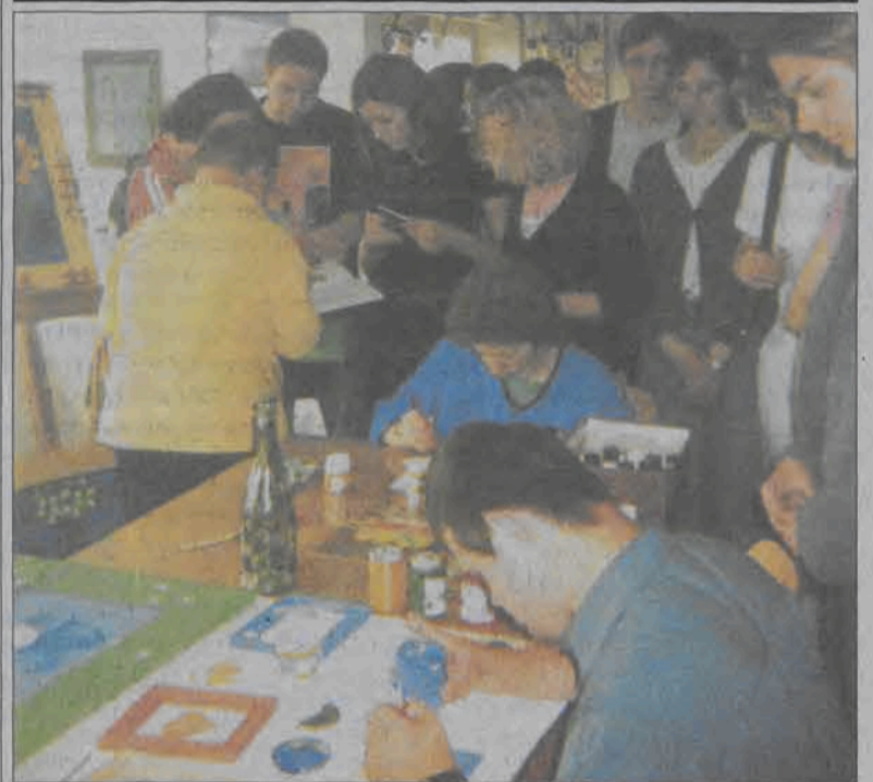
Wolontariusze z Łowicza podpatrują pracę Centrum Warsztatowo-Rehabilitacyjnego w Konarach koło Krakowa.