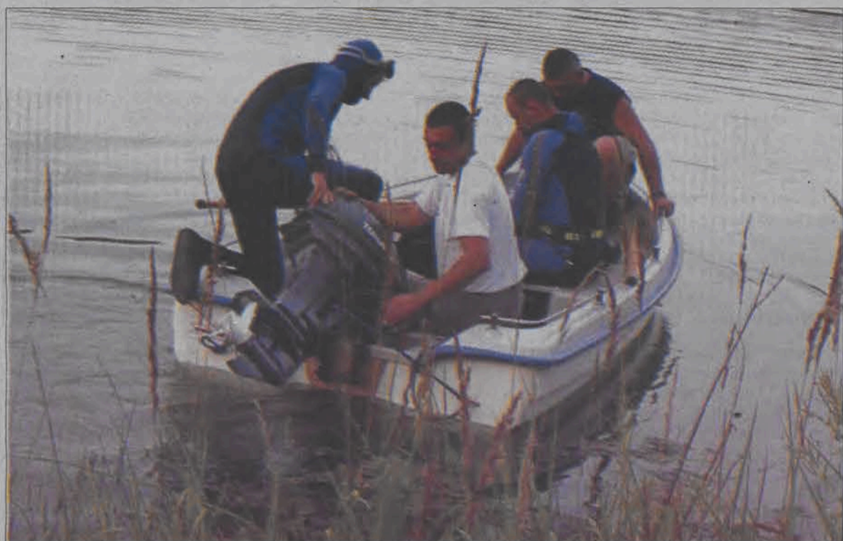
Strażacy - nurkowie z łowickiej Państwowej Straży Pożarnej podczas niedzielnego poszukiwania topielca.