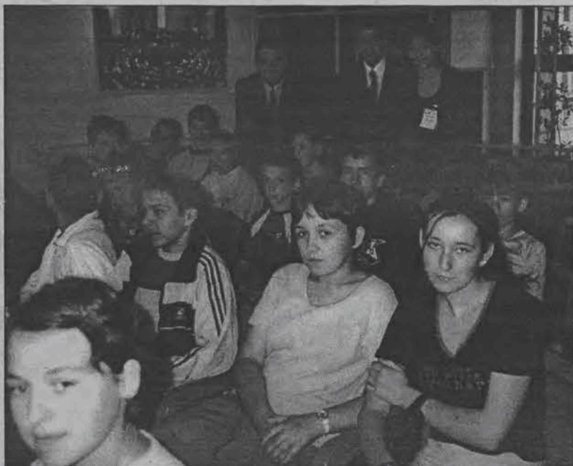
Podczas wycieczki do Sejmu RP, w której brali udział członkowie UKS Korabka, uczniowie spotkali się m. in. z Sebastianem Florkiem (stoi z tyłu w środku) - kiedyś uczestnikiem programu Big Brother, teraz posłem SLD.

Podczas zajęć młodszej grupy UKS Korabka wszystko zmienia się szybko jak w kalejdoskopie. Ćwiczenia następują