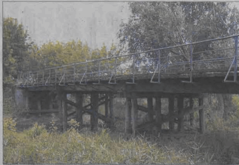
Spośród mostów na Bzurze most w Wierznowicach (na zdjęciu) będzie remontowany przez gminę Zduny jako drugi, po moście w Strugienicach.