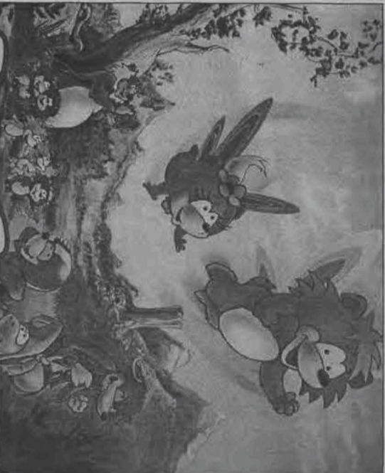
'Latające misie' - serial animowany dla dzieci prod. USA. Emisja: niedziela, 28 lipca, TVP 1, godz. 7.35.

natkoku codziennych obowiązków powoli wypalają się ich uczucia. Wprawdzie nadal traktują się z szacunkiem, ale dawna namieknęła zaszczerpa nury. Udając, że wszystko jest w najlepszym porządku, świętują nawet w rodzinnym gronie 20 rocznicę swego ślubu. I właśnie z tej okazji dzieci wręczają im oryginalny prezent: zaproszenie na wygodny podłogi w luksusowym kurorcie na egzotywniej wyspie Manzanilla.