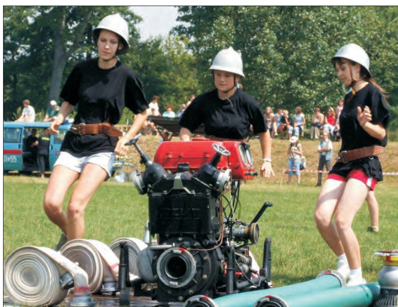
Płec piękna pokazała na zawodach w Bolimowie na co ją stać uzyskując wyniki nie wiele gorsze niż panowie.