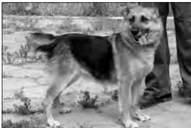
Suczka nr 540/423