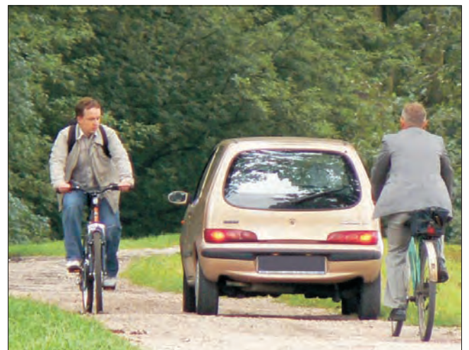
Samochody wjeżdżają nawet na wał przeciwpowodziowy, który biegnie wzdłuż Parku Błonia.

Co więcej, owa likwidacja wjazdu na wał od Mostowej polegała jedynie na podwyższeniu krawężnika (jego jedno obniżenie i tak jest - prowadzi na drogę na tyły ratu-