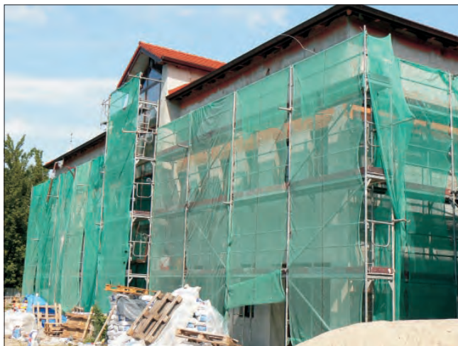
Obecnie trwa tynkowanie budynku od strony hotelu Zacisze.

siąca, przeprowadzka - 2-3 tygodnie. Zatem - zdaniem Chablewskiego - sąd i prokuratura będą mogły rozpocząć pracę w nowym budynku już na początku drugiego kwartału 2008 roku.