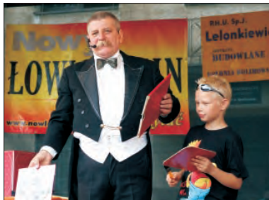
Dzieci ze strachem w oczach, ale wsiadały do mknących nad bolimowskim rynkiem wagoników rollercoastera, część z nich „zdradziła” wesołe miasteczko i obejrzała pokaz iluzjonistyczny. Dla dorosłych grała Kapela Bałucka z Łodzi.