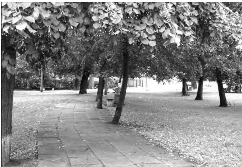
Do końca tego roku zostanie opracowany projekt rewitalizacji parku Mickiewicza.

Dopiero czwarta procedura przetargowa zakończyła się wyłonieniem firmy „Park i Ogród” z Miedniewic, która od 1 marca zajmuje się pielęgnacją zieleni miejskiej. Za usługę tę miasto zapłaci 220 tys. zł brutto. Dla porównania w ciągu dwóch poprzednich lat miasto wydało 370 tys. zł, w każdym roku po 185 tys. zł. Wprowadzono zmiany w stosunku do ubiegłorocznych zasad konserwacji zieleni. Zwiększona jest powierzchnia gruntów komunalnych przeznaczonych do pielęgnacji z 15 ha do 17 ha a zmniejszona gruntów przeznaczonych do bieżącej konserwacji z 27 do 25 ha. Mniejsza będzie także liczba koszeń trawy z pięciu do dwóch w ciągu roku. Aby zmniejszyć koszty zrezygnowano ponadto z obsadzenia 100 donic, które co roku wisiały na latar-