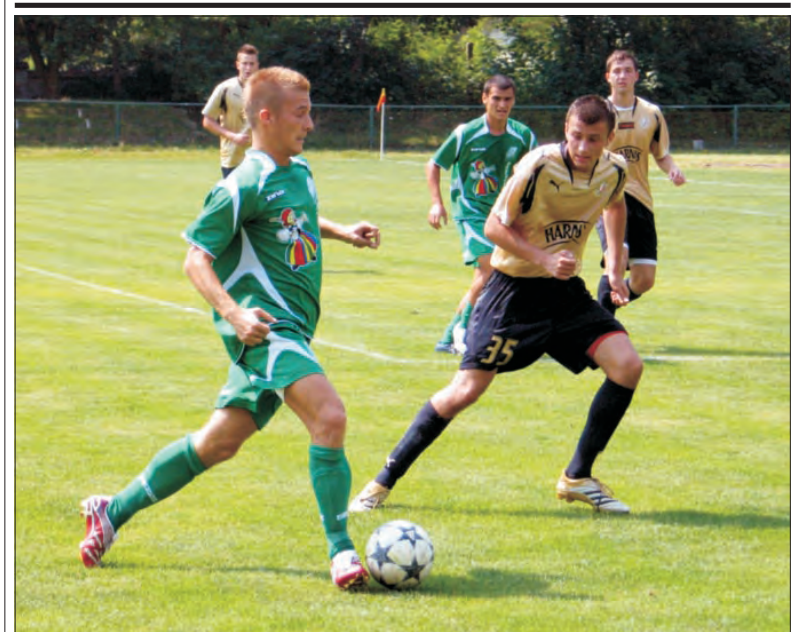
Zespół bardzo dobrze się spisuje. Z liderem wygrał 3:2.

1. kolejka II ligi (sobota - niedziela, 28-29 lipca): PELIKAN Łowicz - ZNICZ Pruszków (historię meczów ze Zniczem prezentujemy na str. 35), GKS Jastrzębie - ŁKS Łomża, POLONIA Warszawa - WISŁA Płock, ODRA Opole - PIAST Gliwice, MOTOR Lublin - TUR Turek, LECHIA Gdańsk - ARKA Gdynia, WARTA Poznań - STAL Stalowa Wola, PODBESKIDZIE Bielsko-Biała - ŚLĄSK Wrocław i POGOŃ Szczecin - GKS Katowice. (p)