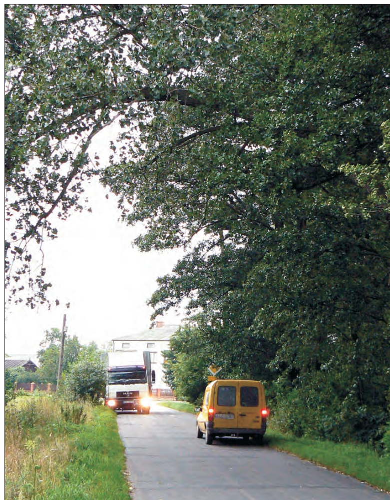
Ruch na tej drodze jest duży. Czy zwisający nad nią konar zagraża bezpieczeństwu?