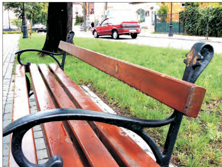
Dwa lata temu, zaraz po otwarciu parku w Alejach, ktoś porąbał jedną z ławek siekierą, teraz ktoś inny kradnie drewniane sztachety z oparcia.

Naczelnik nie ukrywa, że zachowanie niektórych łowiczian wobec tak zwanej małej architektury jest co najmniej nieodpowiednie, w Alejach widać to bardzo dobrze. My na ubiegłotygodniowym spacerze dostrzeżliśmy brak jednej z drewnianych desek stanowiących oparcie w przynajmniej jednej ławce, ale największe zniszczenia dotyczą metalowych, niskich barierek odgradzających ciąg pieszy od trawnika. Nie zauważyliśmy braku słupków, ale płaskowniki stanowiące barierkę w wielu miejscach zostały powyginane, wyciągnięte z ujm w słupkach, a w niektórych miejscach całkowicie zniknęły.