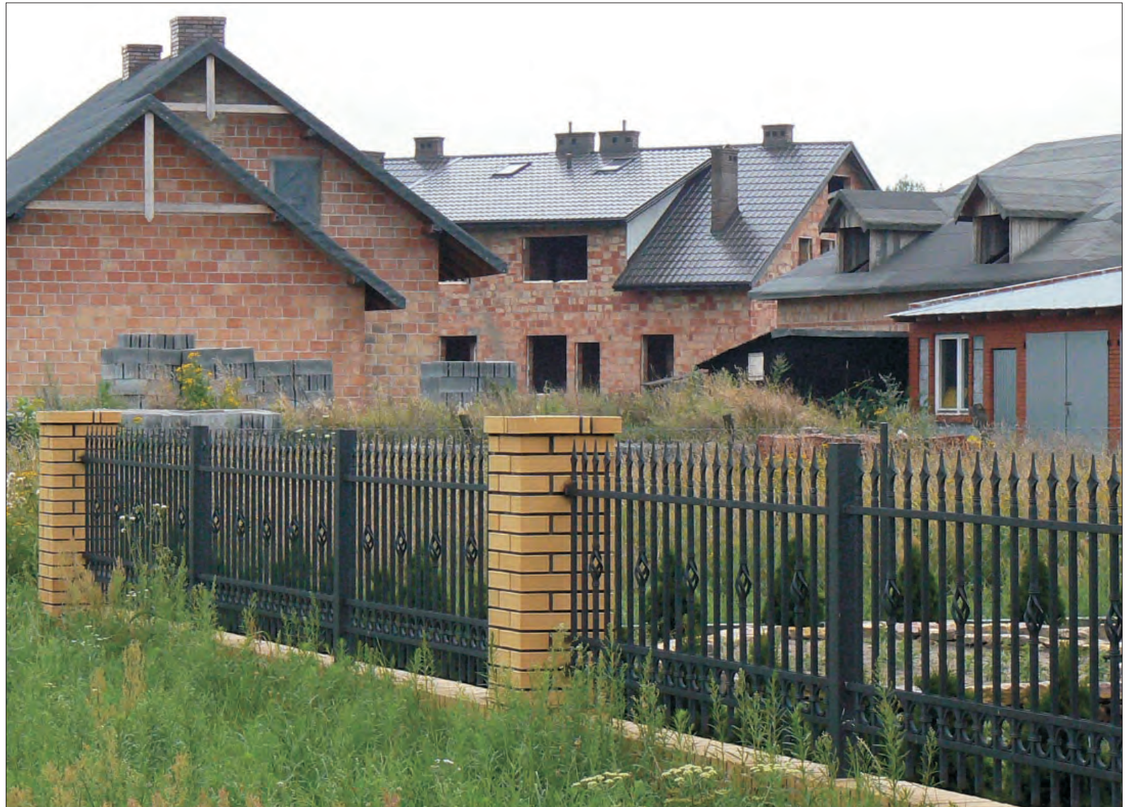
Wystarczy spojrzeć tylko na jedno łowickie osiedle na Bratkowicach, by stwierdzić, że buduje się dużo. Czy wkrótce nie będzie komu stawiać takich domów?

W Zespole Szkół Ponadgimnazjalnych nr 1 w tym roku prowadzony był nabór na kierunki zawodowe murarz oraz betoniarz -