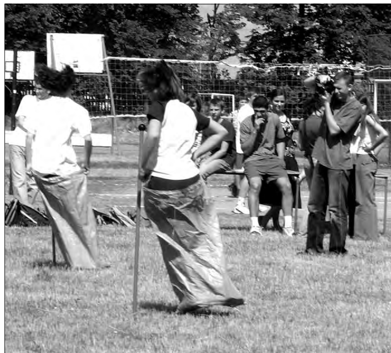
Atmosfera na boisku była gorąca, zarówno ze względu na doping kibiców, jak i pogodę, która dopisała.