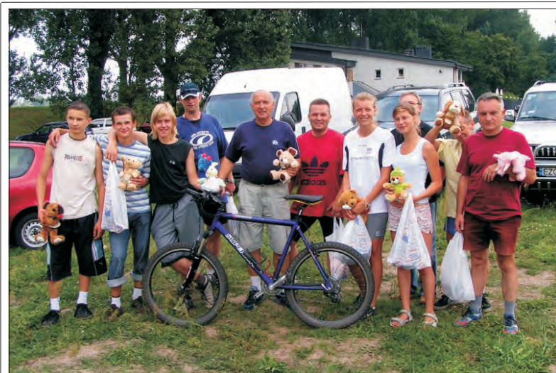
Miłośnicy rowerów rywalizowali na łowickich Błoniach.