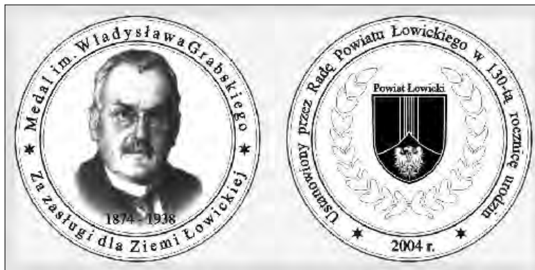
Wizerunek Władysława Grabskiego na medalu nie może budzić kontrowersji, ale herb na rewersie już tak. Czy zostanie zmieniony?

Już w chwili przyjmowania herbu budził on wiele kontrowersji - określano go na przykład słowami „kod kreskowy”. Nie mniejsze kontrowersje wywoływał twórca herbu, artysta plastyk, magister sztuki Michał Marciniak-Kożuchowski, który na wspomnianej sesji wobec negującego jego projekt przewodniczącego komisji heraldycznej użył słów: - Niech się nie wpi... - za przeproszeniem - w sprawy, na których się nie zna. Wtedy jednak radnych słowa te w ogóle nie