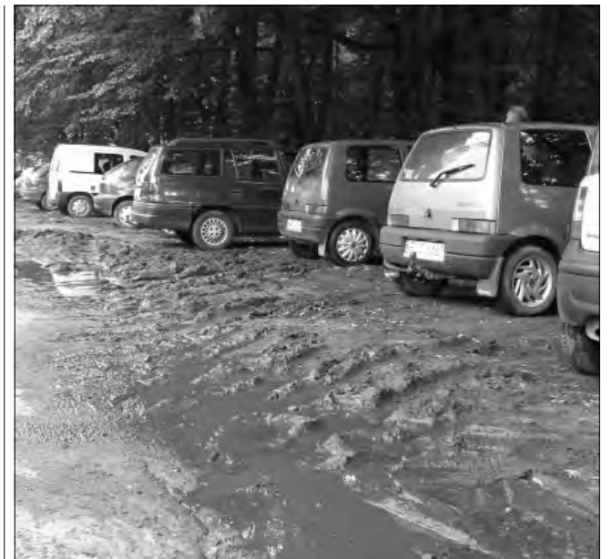
Tak wyglądało pobocze drogi Kiernoza - Wejsce 13 lipca, przy parku podczas Dnia Kiemozkiego Dzika.

od kilku lat uczestniczy w programie, w ramach którego montowane są platformy legowe dla bocianów na tych słupach, na których były gniazda tuż nad przewodami. Platformy tych są już dziesiątki na całym obszarze działania zakładu. W przypadku stacji transformatorowych niestety nie można ich zabudować, by zasłonić przewody, zakład instaluje poprawiające bezpieczeństwo kołpaki osłaniające izolatory, iskrowniki i zaciski transformatorów. Prace takie są jednak współfinansowane przez organizacje ekologiczne zajmujących się m. in. ochroną bociana. Czy coś takiego znajdzie się na słupie w Nieborowie - nie wyklucza, jeśli tylko znajdują się na to zewnętrzne środki.