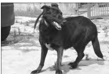
Suczka nr 496