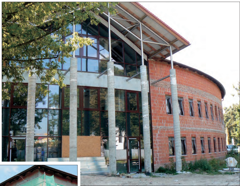
Główne wejście do nowej siedziby Sądu i Prokuratury Rejonowej w Łowiczu znajduje się od strony skrzyżowania ulicy Kaliskiej i Końskiego Targu.

Cały cykl inwestycyjny byłby więc rok krótszy, niż początkowo planowano, bo miał trwać 3 lata i zakończyć się w grudniu 2008 roku. Gdyby jednak budowa nie zakończyła się w tym roku, to najdłużej trwać będzie do końca lutego 2008. Urządzenie i meblowanie budynku trwać ma około mie-