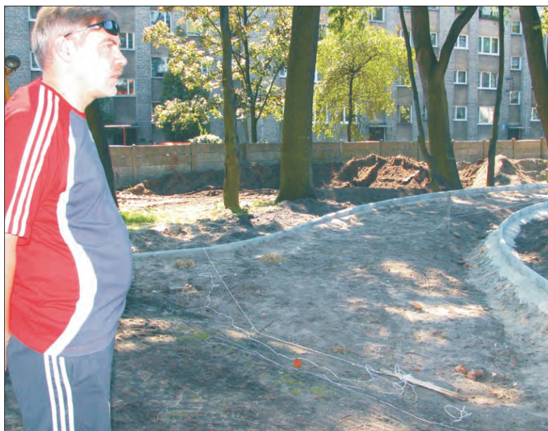
Dyrektor SP 4 wskazuje wyprofilowaną niedawno bieżnię wokół modernizowanego boiska przy szkole.