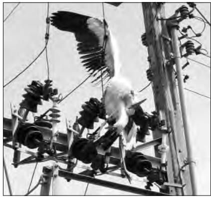
Spalone pióra, rana na szyi to skutki zdarzenia ze stacją transformatorową i porażenia prądem.

W sprawie bocianów zadzwonił do nas czytelnik, mieszkający opodal stacji. Na miejscu ukazał się nam dramatyczny widok, młody bocian z tegorocznego lęgu wisiał zaczepiony na przewodach energetycznych powyżej transformatora, umieszczonego na dwóch słupach. Od porażenia prądem miał stopione pióra na skrzydłach i ranę na szyi. Prawdopodobnie, jako niedoświadczony jeszcze lotnik, uderzył w przewody. Drugi z bocianów, w pełni dojrzały osobnik, prawdopodobnie rodzic młodego leżał pod stacją. Na pierwszy rzut oka wszystko było z nim w porządku, ale okazało się, że ptak ma całkowite bezwładne nogi. Nie mógł na nich stanąć, nie mówiąc już o tym by poderwał się do lotu.