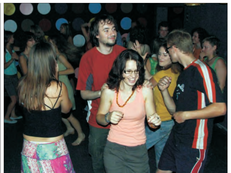
Latino Najt - zabawa na parkiecie na całego.