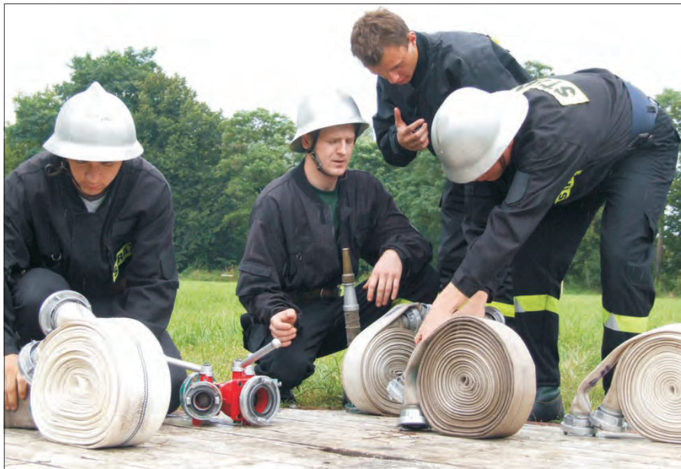
Właściwe stawianie węża i osprzętu przed częścią bojową strażackich zawodów to bardzo ważny element przygotowań przed startem.

W czasie zawodów przez chwilę zaczął padać deszcz, nie przeszkodziło to w ich kontynuowaniu. Jednak zarówno młodej publiczności, jak i strażakom było mało tej ochłodzonej przez zaciętej rywalizacji i kilku osób