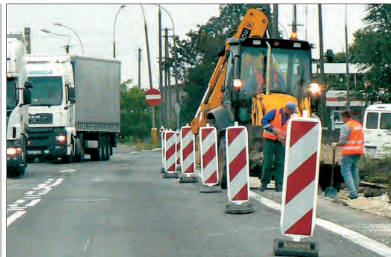
Firma Strabag zaczęła remont „dwójki” od ul. Warszawskiej.

Gwiazda wieczoru Doda wraz z zespołem pojawi się około 22.00. Na łyszkowickiej scenie będzie gościła do północy. (eb)