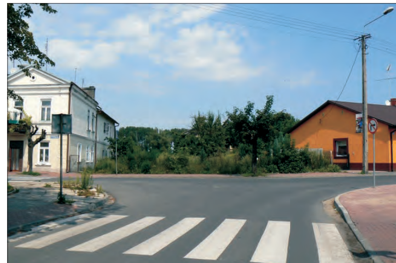
Przyrynek to atrakcyjne miejsce, więc zakup działki wywołał emocje.

Różnica pomiędzy ceną działki do zabudowy mieszkaniowej a rekreacyjnej jest oczywista, na korzyść tej pierwszej. - Miasto może wywłaszczać tylko pod cel publiczny. Droga spełnia ten warunek, ale nie rekre-