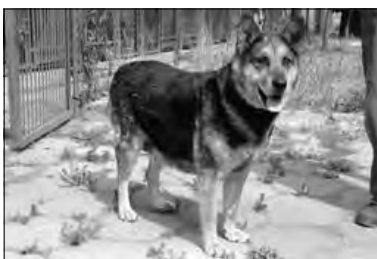
Suczka nr 770