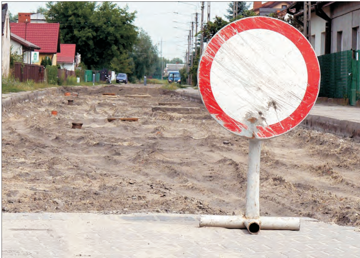
Pracownicy ZUK rozpoczęli od wykorytowania pasa jezdni roboty przygotowawcze do ułożenia kostki w ul. Zagrodowej.

Naczelnik Wydziału Inwestycji i Remontów w ratuszu Grzegorz Pelka pytany, kiedy mieszkańcy sąsiednich ulic: Korczaka, Jeżewskiego i Makuszyńskiego mogą liczyć na realizację kanalizacji deszczowej i nawierzchni na tych ulicach, odpowiedział, że decyzja leży po stronie radnych uchwalają-