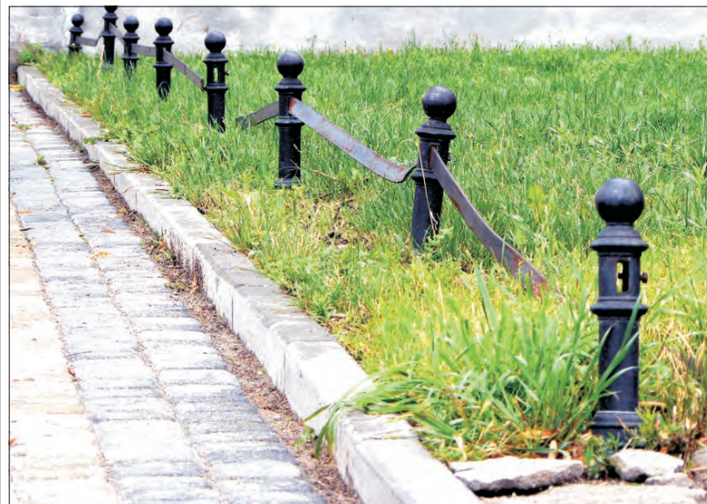
Metalowe barierki w Alejach miały być ozdobą parku, jednak trudno o to, gdy tak wyglądają.

Gawroński powiedział nam, że naprawa barierek zostanie zlecona firmie zewnętrznej, będzie to kosztować kilkadziesiąt złotych. Naprawa ławki zostanie przekazana firmie zajmującej się w mieście zielenią, gdyż jest to zagwarantowane w umowie podpisanej z miastem. Nie będą to jednak pierwsze prace naprawcze w Alejach, bo wcześniej naprawiano już i ławki i barierki, jak i uliczny zródł zamontowany naprzeciwko skrzyżowania z ul. Browarną.