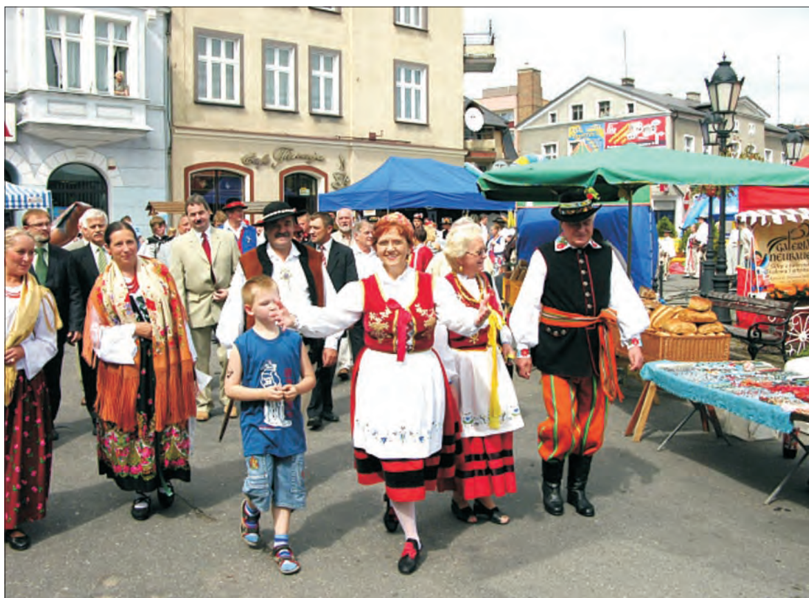
Nasza delegacja była dobrze widoczna wśród Kaszubów i górali.

Ta sama firma prowadzi kontrole w autobusach komunikacji miejskiej m.in. w Sochaczewie, Ostrołęce, Mińsku Mazowieckim i innych miejscowościach. W skali miesiąca w Łowiczu mandaty za jazdę „na gapę” płaci po kilku pasażerów. Więcej w ciągu roku szkolnego, mniej podczas wakacji. (mak)