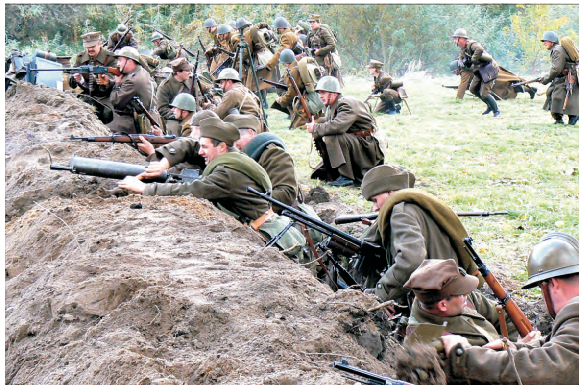
Ponad 100 zapaleńców „walczyło” na łowickich Błoniach, kilka tysięcy mieszkańców obserwowało. O sobotniej i niedzielnej rekonstrukcji walk o Łowicz w 1939 roku czytaj na str. 20-21.

Prawo i Sprawiedliwość nie będzie kleić nowych billboardów. Są one umieszczone na dużej wysokości i dlatego jest to kłopotliwe i drogie. Nie może też zresztą przekroczyć określonych już wydatków na kampanię. Na terenie Łowicza zostaną jedynie rozwieszone plakaty z wizerunkiem Janusza Michalaka. (tb)