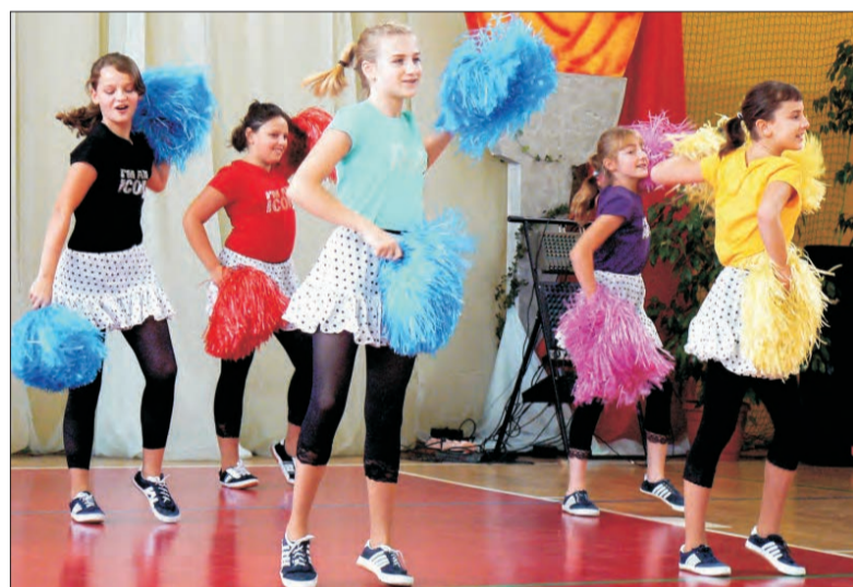
Stachlewskie cheerleaderki mogły po raz pierwszy wystąpić przed publicznością w nowej sali gimnastycznej.

Jeszcze w tym roku gmina Bielawy planuje wykonać odwiert nowej studni głębinowej w Waliszewie Starym. Dotychczasowa studnia o głębokości 41 metrów zostanie zasypana. Odwiert planuje się na głębokość 50 m. Dzięki temu znacznie poprawi się jakość wody w wodociągu wiejskim, na której stan mieszkańcy Waliszewa ostatnio narzekali. Wykonawca odwiertu i likwidacji starej studni zostanie wyłoniony 29 października. Prace mają zakończyć się do 15 grudnia. (eb)