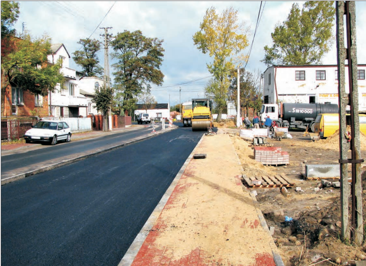
W ubiegłą sobotę nowy chodnik po prawej stronie drogi był już ułożony. Trwały prace przy nowej nawierzchni asfaltowej drogi prowadzącej w kierunku Osmolina i Sannik.