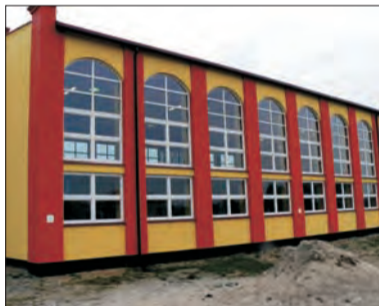
Budynek sali gimnastycznej w Stachlewie.

W przyszłym roku ma zostać zorganizowane boisko przy szkole oraz zostanie ona ogrodzona.