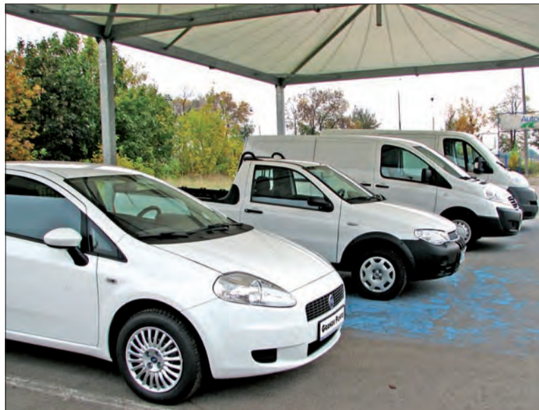
Dostawcze modele Fiata dostępne są w kilku modelach, a każdy z nich w wersji dostosowanej do potrzeb klienta.

w pierwszym tygodniu sprzedaży odnotowano rekordową ilość zamówień - 50 tysięcy sztuk. W Polsce sprzedawcy spodziewają się, że będzie to model raczej niszowy, kupowany głównie przez kobiety. Warto dodać, że jest on produkowany w fabryce Fiat Auto Poland w Tychach.