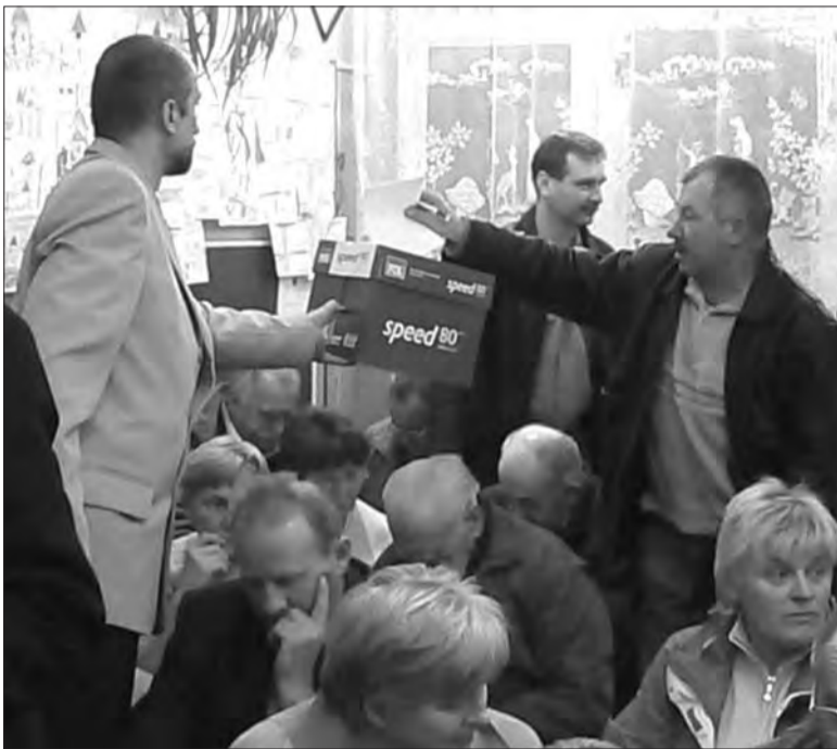
W zebraniu na Górkach udział brało ponad 50 osób. Wybrano przewodniczącego i 9-osobowy zarząd.

Nie sposób przytoczyć pełnej listy nazw ulic, wymagających ułożenia nawierzchni, które wymieniali obecni na zebraniu. Były to m.in. Piątkowska, Rzemieślnicza (dokończenie), Orzeszkowej, Działowa, Podgórna, Sadowa. - Mieszkamy to 30 lat lub więcej, a czujemy się obywatelami drugiej kategorii - tego typu wypowiedzi kilkakrotnie padały z sali. Burmistrz przyznawał rację mówiąc, że faktycznie woda czy droga to podstawowe sprawy, jednak wszystkich potrzeb