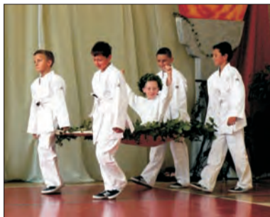
Program artystyczny w wykonaniu uczniów SP Stachlewie.