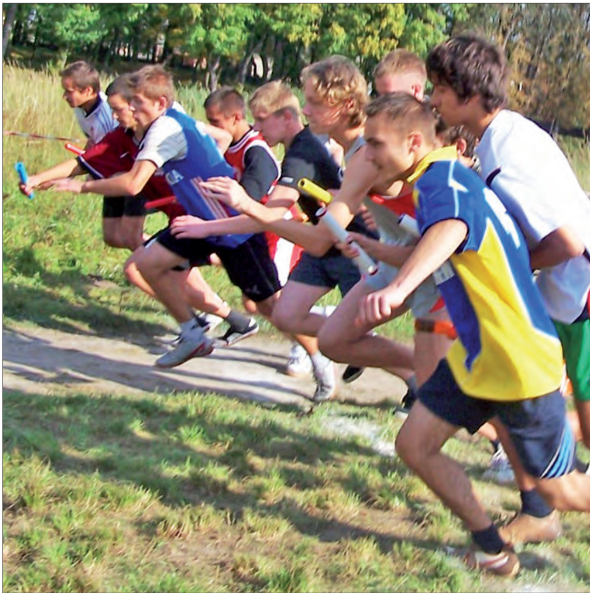
Bardzo interesująca była walka na starcie gimnazjalistów.