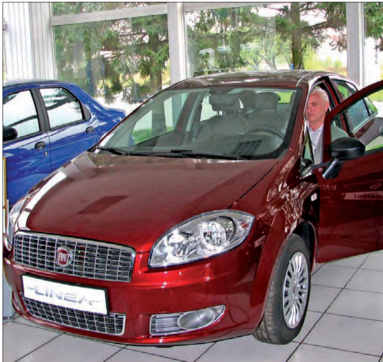
Fiat Linea - samochód średniej klasy, którym można wyjechać z Polmobiczu za przystępną cenę (od 39.900 zł).

- Kia trafiła w potrzeby łowiczanie, co wnioskuje się ze wzrostu sprzedaży. W tym roku do chwili obecnej sprzedaliśmy 176 samochodów, z których większość stanowią Cee'd-y hatchback oraz combi - mówi Tataj. Trudno ocenić, ile jeszcze pojazdów będzie sprzedane w tym roku. W październiku lub listopadzie zaczynają się zwykle promocje na sprzedaż pojazdów z danego roku. Już w tej chwili na Picanto jest promocja 4.000 zł (cena przed promocją 30.000 zł), a na droższe modele nawet 17.000 zł.