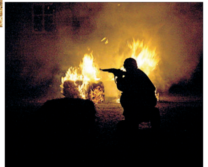
Wybuchy, palący się kiosk po bombardowaniu i walczący żołnierze - jak w 1939 roku.

Niektóre z grup rekonstrukcyjnych (np. SRH „Cytadela”) stosu-