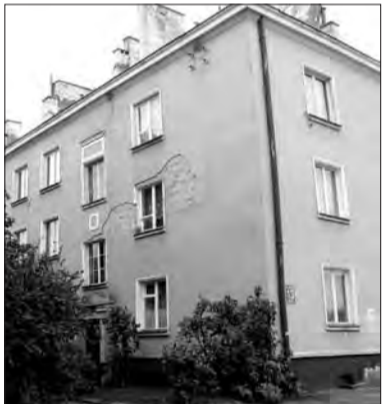
Os. Kostka: każda wspólnota mieszkaniowa musi dbać o swój blok.

Chodnik na ul. Czajki oraz kanalizacja na osiedlu Kostka to dwie najpilniejsze inwestycje, których mieszkańcy samorządu Kostka oczekują od władz miasta. Problemy te rozważano na zebraniu wyborczym 10 października.