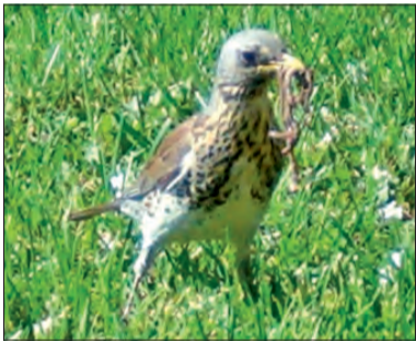
Drozd kwiczoł, kuzyn bardziej popularnego kosa, zbierający dżdżownicę na trawniku pod katedrą.

Łowicz jest też dość łaskawy dla ssaków. W 2002 roku rowerzyści przejeżdżający ul. Mostową zatrzymywali się na dźwięk głośnego chrobotania dochodzącego z zadrzewień po wschodniej stronie ulicy, w pobliżu zakładu energetycznego. Bardziej dociekliwi sprawdzili za dnia, co się tam działo. Nie dziwiła leżąca w stojącej tam wodzie topola, ale sposób jej ścięcia