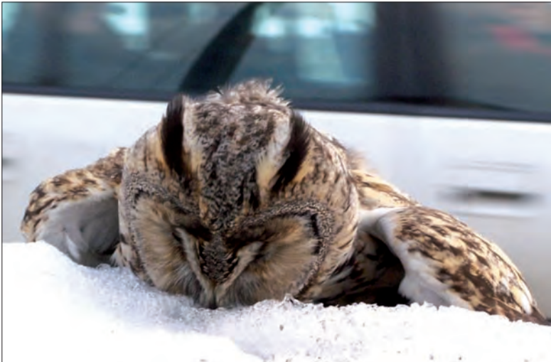
Niestety o tym, że w Łowiczu są dzikie zwierzęta dowiadujemy się po ich śmierci. W lutym 2006 pisaliśmy o martwej sowie uszatej znalezionej przy ul. 3 Maja.

wskazujący na działanie bobra. W ubiegłym roku, wiosną, bobry też korzystały z dobrodziejstwa, jakim jest Bzura i udało