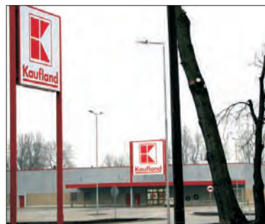
Na otwarcie trzeba jeszcze poczekać.

D wunastego lipca Powiatowy Inspektor Nadzoru Budowlanego nakazała inwestorowi zaniechanie robót budowlanych przy niedokończonym markecie Kaufland przy ul. Starzyńskiego w Łowiczu. Przedstawiciel Igloo Polska zaskarżył decyzję. Wojewódzki Inspektor Nadzoru Budowlanego decyzją z 24 sierpnia utrzymał w mocy decyzję wydaną na szczeblu powiatu. Została ona zaskarżona do WSA w Łodzi.