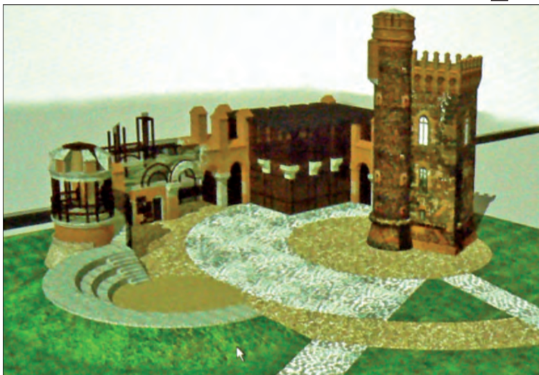
Czy tak kiedyś będzie wyglądać otoczenie baszty?