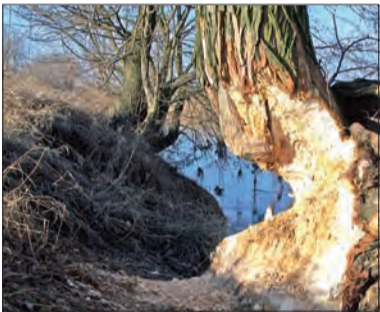
Nie siekiera, ale bobrze zęby zostawiły te ślady - okolice oczyszczalni ścieków - 2006 rok.

wskazujący na działanie bobra. W ubiegłym roku, wiosną, bobry też korzystały z dobrodziejstwa, jakim jest Bzura i udało