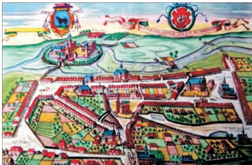
Rycina Brauna z 1617 roku przedstawia Łowicz z zamkiem prymasów, ratuszem na Nowym Rynku i płynącą tam rzeczką, z której wodę wykorzystywano do warzenia piwa.

Zaraz potem burmistrz mówił o tym, co jest charakterystyczne w planie budowy miasta - struktura szachownicy, która przypomina strukturę rzymskiego obozu wojskowego. - Takiej struktury nie ma żadne z okolicznych miast, ta-