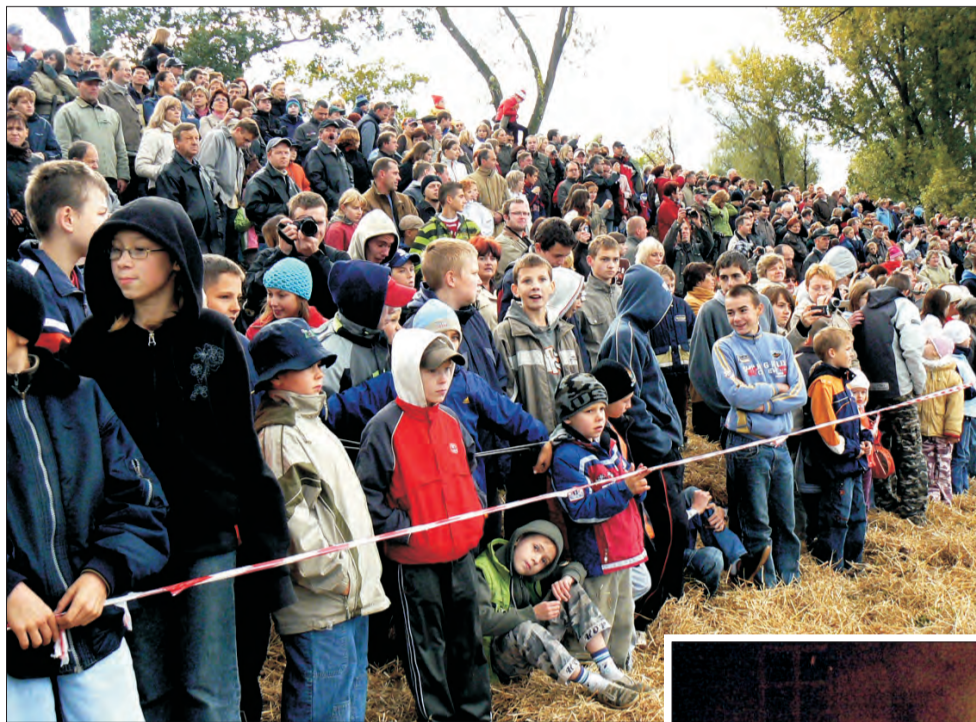
Wał przeciwpowodziowy wzdłuż Bzury stworzył naturalną widownię, z której skorzystało kilka tysięcy osób.

Zanim jednak rozpoczęły się próby, grupy rekonstrukcyjne rozlokowały się na sali gimnastycznej w Gimnazjum nr 1 w Al. Sienkiewicza. Tam rekonstruktorzy nocowali i mieli pierwsze odprawy ze swoimi dowódcami. Baza sprzętu, który brał udział w rekonstrukcji walk, była na dziedzińcu ratusza. Przez dwa dni stacjonowały tam polskie samochody pancerne, niemiecki czołg Pzkwf II, ciężarówka Mercedes (wypożyczony z Muzeum Motoryzacji w Otrębusach), którym jeździli dowódcy niemieccy oraz motocykle. Wypożyczone z prywatnego Muzeum Czynu Zbrojnego w Lipcach Reymontowskich 40-milimetrowe działko Boforsa