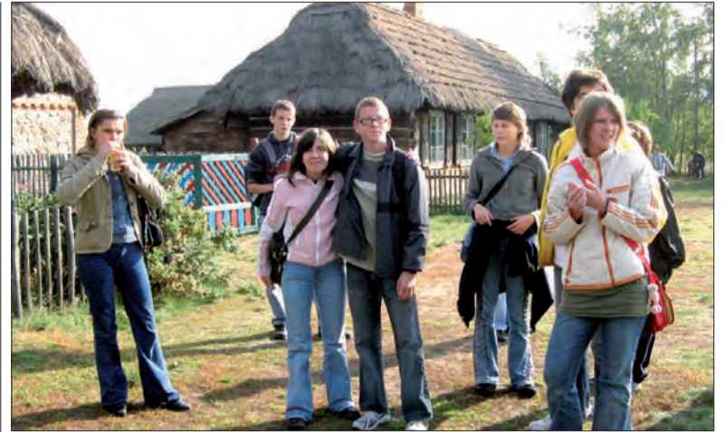
Młodzież z ośrodka w skansenie w Maurzycach.