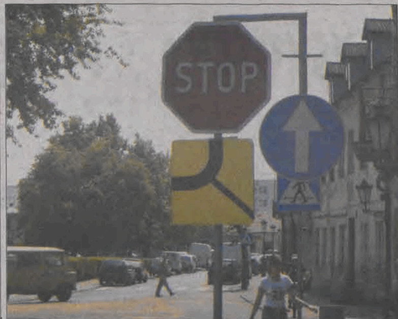
Taki zestaw znaków został ustawiony w miejscu, gdzie ulica Bielawska styka się z Nowym Rynkiem.