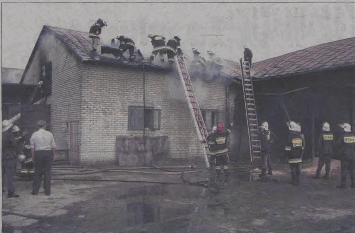
Po ugaszeniu pożaru budynki nadają się wyłącznie do rozbiórki.