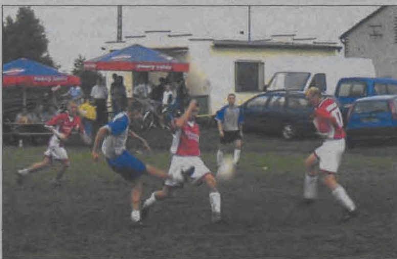
W wielkim finale raz po raz „iskrzyło” pod jedną i drugą bramką...