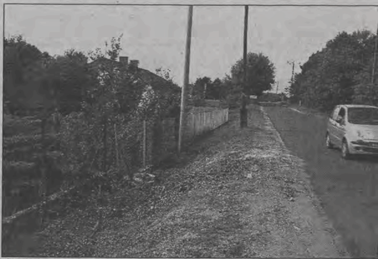
W Zielkowicach nadal widać ślady zdarzenia, które rozegrało się w minioną sobotę. Na zdjęciu pień wyciętej olchy nieopodal drogi.

Nastoletnia dziewczyna usiłowała natomiast zatrzymać ruch pojazdów od strony