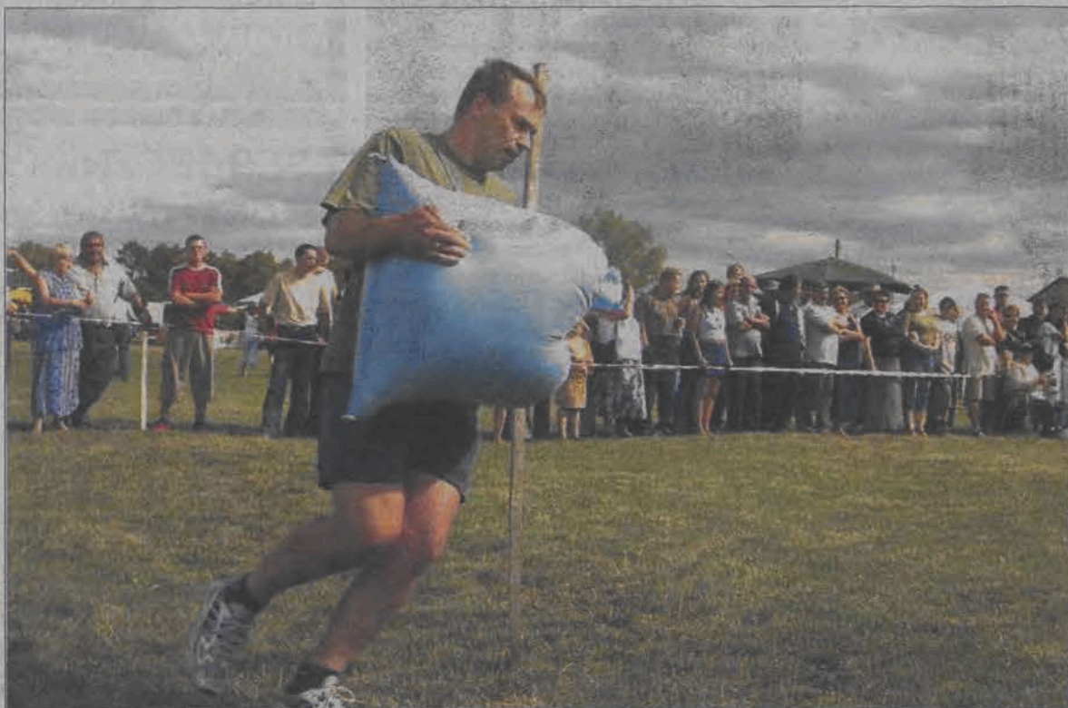
Po twarzy zawodnika widać, że to już nie pierwszy worek, z jakim obiega wbitą w ziemię tyczkę.

W turnieju wziąć mogli udział tylko mieszkańcy wsi znajdujących się na terenie gminy Bielawy, a w skład drużyn wchodzić mogły jedynie osoby na stałe zameldowane w danej miejscowości. Drużyny, w skład których wchodziło 5 mężczyzn i 4 kobiety startowały w ośmiu konkurencjach o zagadkowych nazwach: baba z wozu koniom łęź, na waszcie, wałkiem w teściową czy gospodyni na medal. Pod tymi terminami kryły się usportowione wersje czynności, z którymi każdy rolnik czy gospodyni domowa radzić musi sobie w życiu codziennym. Od południa do godziny 14 rozegrano cztery pierwsze konkurencje, do których należały wspomniana baba z wozu... - czyli przeciąganie wozu, dalej na waszcie, czyli rzut belką słomy, wałkiem w teściową - nazwa mówi sama za siebie, tyle że prawdziwą teściową zastępowała kukła. Pierwszą część sportowych zmagani zakończyła konkurencja o nazwie piąte koło u wozu, polegająca na przeciążeniu opony.