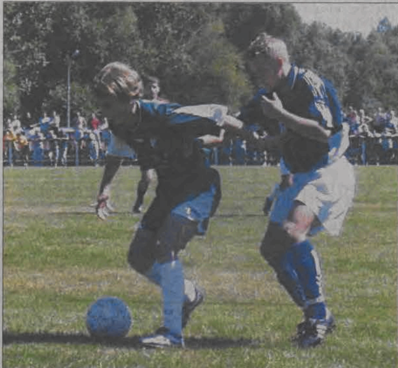
Trzynastka okazała się niezbyt szczęśliwa dla Pelikana. W derbach po raz trzeci w Łowiczu lepsi okazali się gracze Unii Skier-niewice.