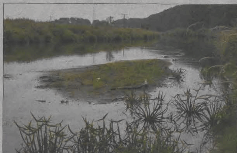
Tak niskiego stanu wód w naszych rzekach nie było od dziesięcioleci. W Łowiczu Bzura pokazuje już swe dno tam, gdzie go nigdy nie odkrywała - jak w tym miejscu blisko mostu na Prymasowskiej. O suszy czytaj na str. 3.

NAKŁAD KONTROLOWANY ZWIĄZEK KONTROLI DYSTRYBUCJI PRASY