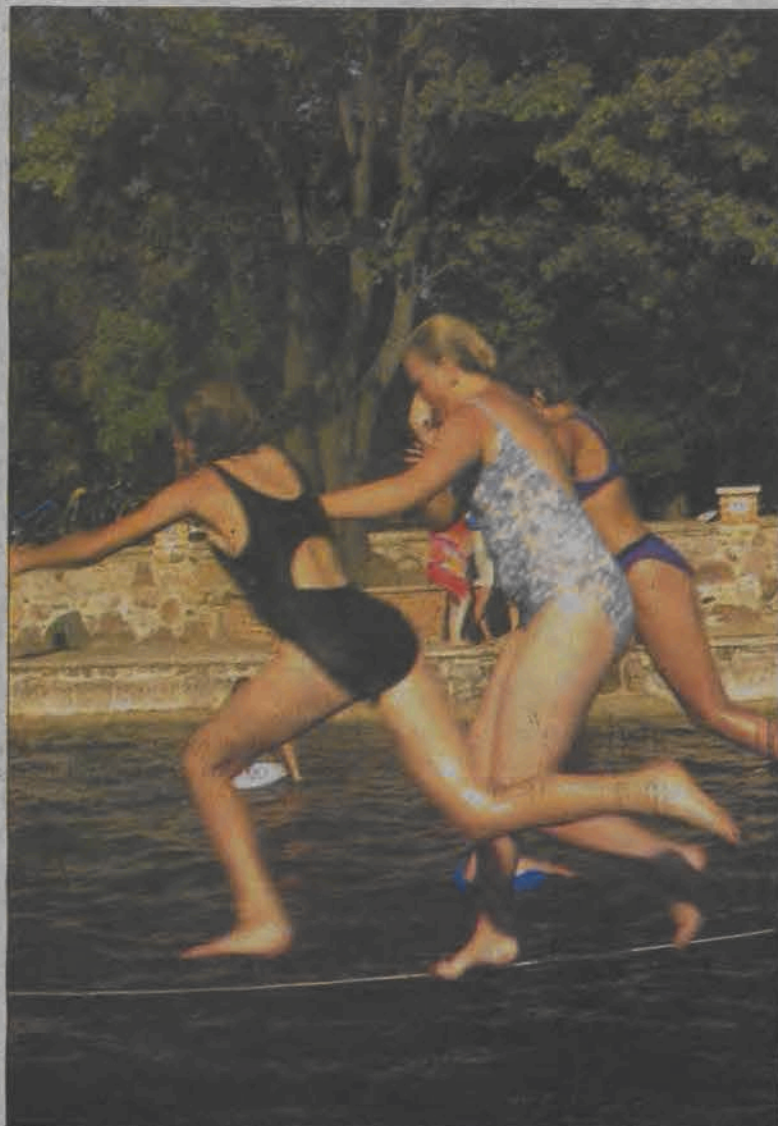
Pływanie i zabawy w czystej wodzie to coś, na co młodzież w Kiernozi czekała.