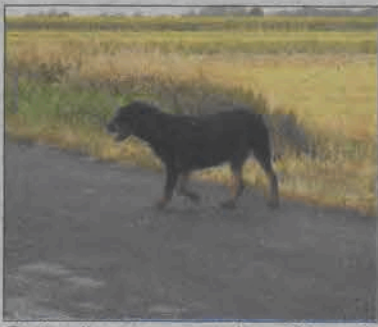
Rottweiler spacerował po ulicy cały środowy ranek w nadziei, że właściciel po niego wróci.

Jeśli faktycznie pies został porzucony, to sposób i miejsce w którym to zostało zrobione świadczy o ludzkiej głupocie i braku wyobraźni. Psy rottweilery