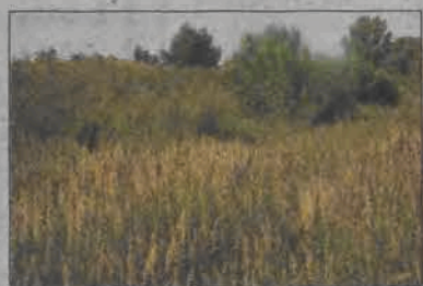
Nie jest to wiejski pagórek ani polana w lesie, ale wał przeciwpowodziowy na terenie miasta Łowicza.

Na terenie miasta Łowicza znajduje się 2250 metrów bieżących wałów przeciwpowodziowych. Znają je i spacerują po nich niemal wszyscy mieszkańcy. Spacer nie jest jednak dziś już przyjemnością, bowiem wały są obecnie potwornie zarosnięte i od października ubiegłego roku niczego nie robiono, aby je uporządkować. Właściwie ma się wrażenie, iż wały toną w wysokiej trawie, uschłych badyłach, połaciach pokrzyw i przewyższających znacznie rozmiary człowieka odnogach czarnego bzu. Górą wału idzie się bez większych przeszkód, ale nie ma co marzyć o zejściu z niego w kierunku rzeki, a już na pewno trzeba porządnie naszukać się miejsca, gdzie chaszczki są nieco niższe.