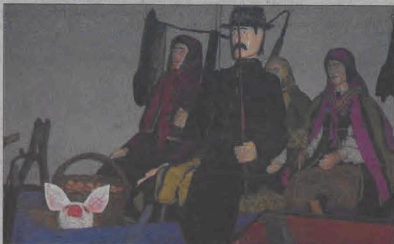
Gospodarz i gospodyni jadą na targ sprzedać jajka i prosiaka. Z tyłu siedzą zabrane po drodze sąsiadki.

Radni mieli podjąć decyzję w sprawie wyboru koncepcji radzenia sobie ze ściekami komunalnymi, ale na sesji 10 lipca żadna wiążąca decyzja nie zapadła. Jest to temat na posiedzenia komisji i przyszłe sesje. (wcz)