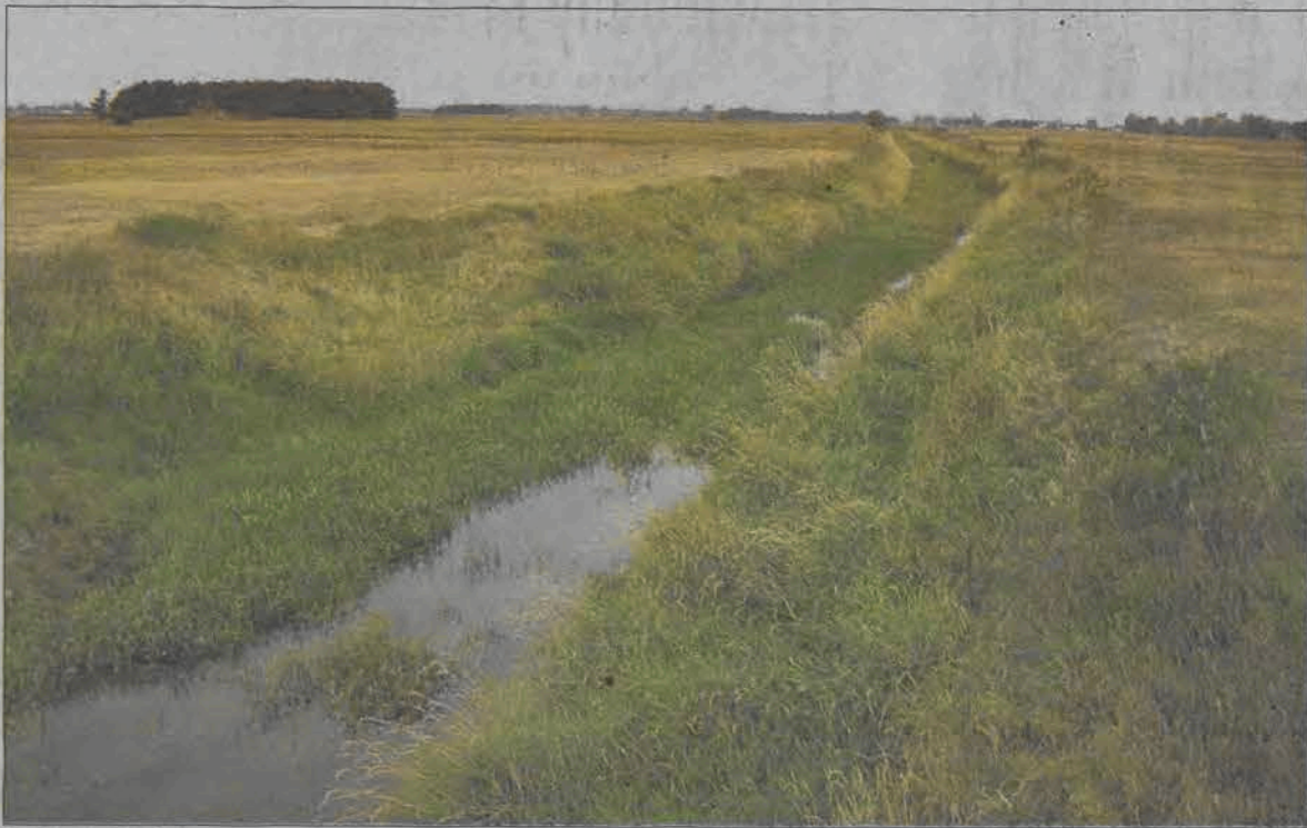
To była Słudwia - można powiedzieć patrząc na rzekę, która od dłuższego czasu wygląda jak trawnik.