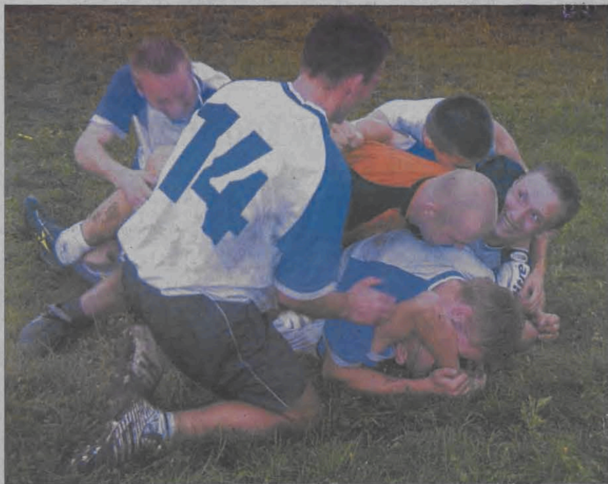
Po serii rzutów karnych znowu najlepsi w gminie Bielawy okazali się gracze Pieczarki.

Piłka nożna - 13. kolejka i finały Bielawskiej Ligi PN Sześciuosobowej