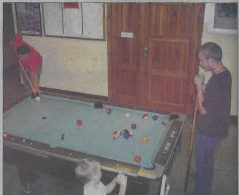
Stół bilardowy stojący w łowickim OSiR Nr 1 znowu ściąga entuzjastów tego sportu. Po wakacjach planowany jest otwarty turniej w odmianie pool-biarda, tzw. „ósemce”.