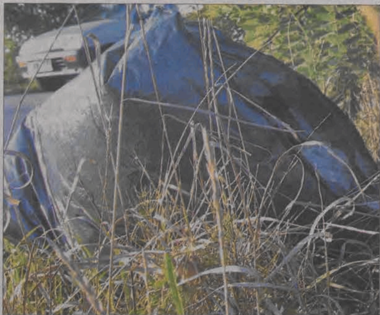
Zapomniany worek wypełniały puste plastikowe butelki, które podczas akcji zebrali uczniowie.