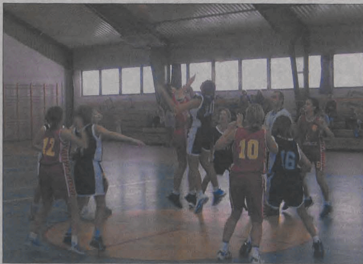
Najwyższe zwycięstwo „Centerki” odniosły nad ekipą SKS 12 Warszawa.