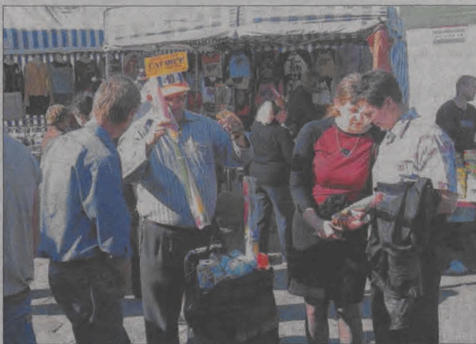
Nawet spakowane w torbie latawce wzbudzały duże zainteresowanie na łowickiej targowicy. Ale co najciekawsze - było w górce, poza kadrem, przywiązane do ręki sprzedającego.

Mężczyzna okazał się emerytem z Łodzi, nie chciał się nam przedstawić. Panie, ja jestem już sławny, w tylu gazetach o mnie pisano. A raz nawet dali tytuł „sklep w powietrzu”. O latawca i jego pracy łatwiej jest mu mówić niż o sobie. Ja mam towar pierwsza klasa. Nie tylko sprzedam, ale pokażę co zrobić, żeby latawiec latał jak należy, znam się na tym, jestem modelarzem i od siedmiu lat sprzedaję latawce - powiedział nam sympatyczny emeryt. Sprzedawane przez niego latawce to różne wzory tak zwanych lotniolatawców (od kształtu powierzchni nośnej) z popularnymi bohaterami z bajek Disneya za 15 zł, jak i proste latawce wykonywane z kolorowej folii - za 10 zł. To nie jest trudna sztuka, trzeba mieć dobrą matrycę, by wykroić folię, potem ją skleić, od niej wszystko zależy, wszystko trzeba jednak dopracować - powiedział nam.