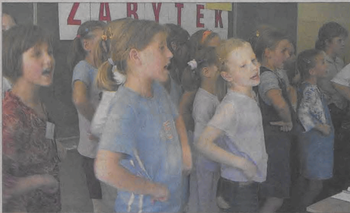
Dzieci z klasy trzeciej zaśpiewały ludowe piosenki wzbudzając zachwyt wszystkich nauczycieli.