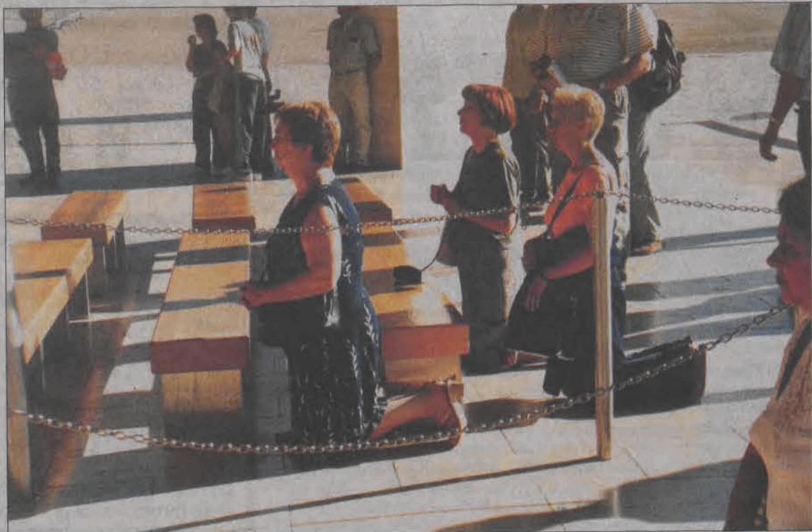
Po to jechali tysiące kilometrów: modlitewne spotkanie podczas mszy św. na placu przed kaplicą objawień w Fatimie.