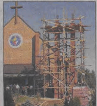
Dzwonnica stoi już od kilku tygodni czekając na zawieszenie na niej dzwonów.

Parafia czeka w tej chwili jeszcze na dzwony, najcięższy ważący 580 kg poświęcony Matce Bożej Nieustającej Pomocy - patronce kościoła, średni ważący 290 kg poświęcony papieżowi oraz najmniejszy o wadze 190 kg poświęcony patronce diecezji łowickiej, św. Wiktorii.