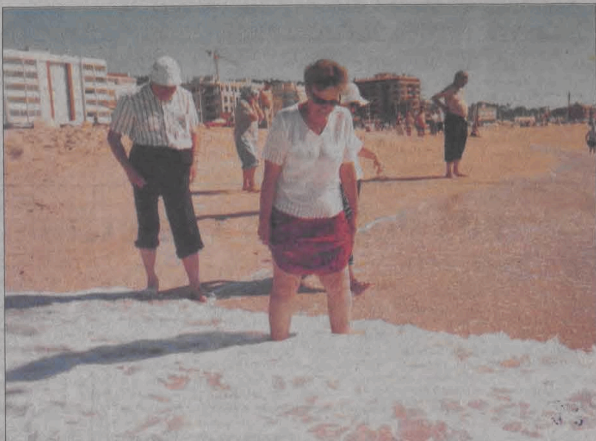
Chwile relaksu na wybrzeżu Oceanu Atlantyckiego.