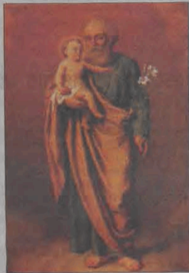
Skradziony obraz z XIX w. przedstawiający Św. Józefa z dzieciątkiem na rękach.