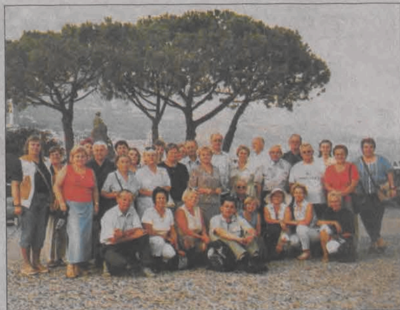
Łowicka grupa w komplecie. W tle Lizbona.

Podróż przebiegła spokojnie i bez żadnych problemów. Każdy podziwiał tamtejsze autostrady i dobrą jakość dróg, które w Polsce są rzadkością. Przy obwodnicy w Zurychu pielgrzymka napotkała na korek i musiała przejechać przez centrum miasta. Akurat dobrze się złożyło, bo uczestnicy mieli okazję zapoznać się