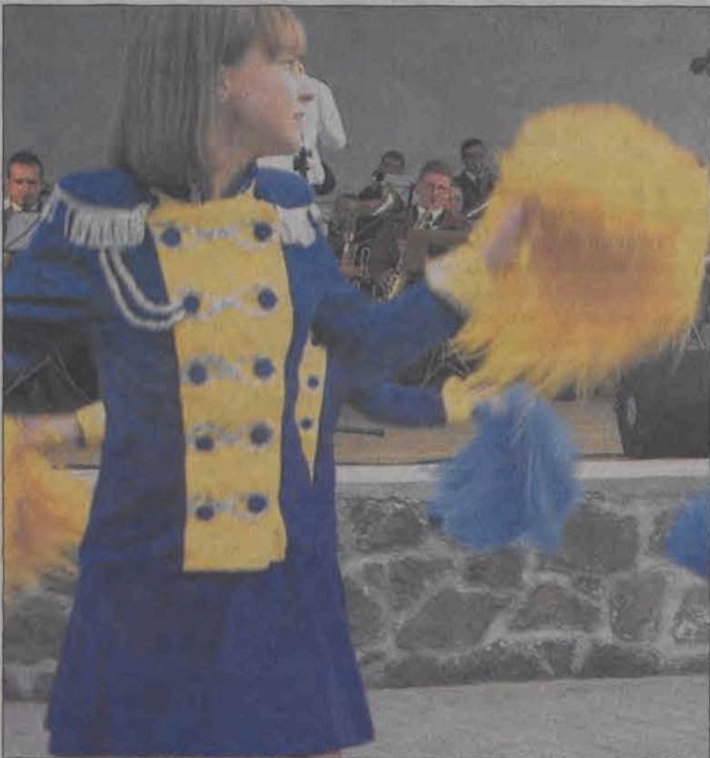
Orkiestrze z Poddębic towarzyszyły kolorowo ubrane czirlidkerki.

No, tego jeszcze w Łowiczu nie było - tak mówiły niemal wszystkie osoby zmiernające w ostatnią niedzielę 28 września w kierunku łowickiej muszli koncertowej. Tego dnia do naszego miasta zawitało 8 strażackich orkiestr dętych, aby zaprezentować się publiczności, a przede wszystkim walczyć o nagrodę główną - Złotą Lirę, jako że to właśnie Łowicz w tym roku był gospodarzem II Przeglądu Orkiestr Dętych Województwa Łódzkiego „Złota Lira”. Atmosferę podgrzewał fakt, iż mające wystąpić orkiestry to sama śmietanka, wyłoniona z ponad stu orkiestr, jakie działają w naszym województwie. Poza Zotą Lirą, zespoły walczyły także o puchar starosty łowickiego i burmistrza miasta Łowicza.