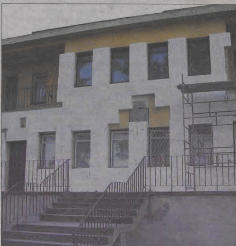
W minionym tygodniu elewacja budynku okładana była płytami styropianu.