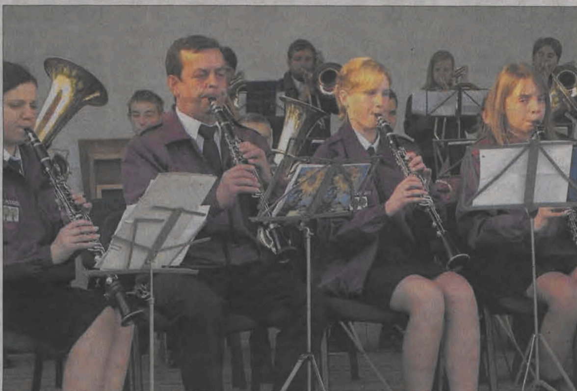
Członków orkiestry z Poddębic dało się rozpoznać po bordowych kurtkach, ufundowanych przez sponsora specjalnie na ten występ.

obok osób starszych widać było grających z zapalem młodych, kilkunastoletnich ludzi. W trakcie koncertu usłyszeć można było wszystkie - od motywów operowych, przez standardy jazzowe, aż po wiązanki przebojów The Beatles, Michaela Jacksona czy Abby.