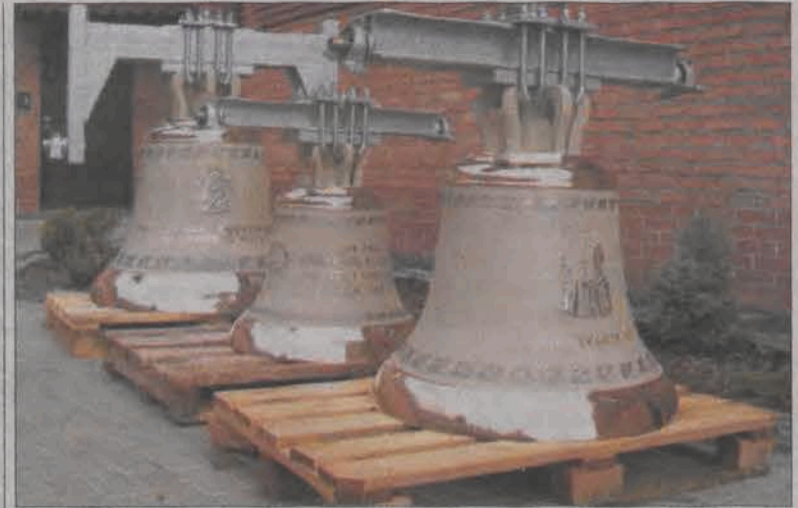
Trzy dzwony ofiarowane przez społeczność parafii można oglądać do poniedziałku 6 października, we wtorek i środę będą wieszane na dzwonnicy.

Ostatni taki remont odbył się w latach 80., kiedy część budynku funkcjonowała jako Gminny Ośrodek Kultury.