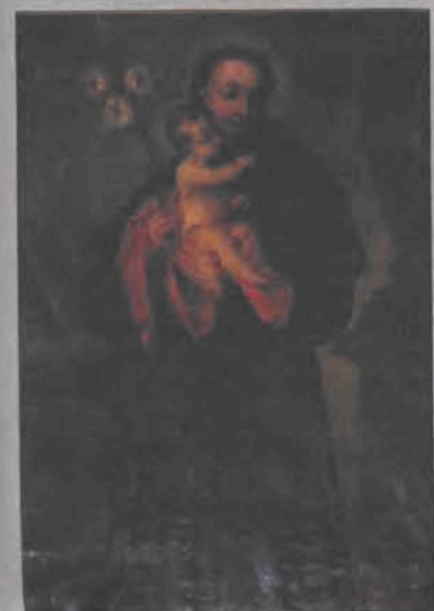
Skradziony obraz z XVIII w. przedstawiający Św. Antoniego z dzieciątkiem na rękach.