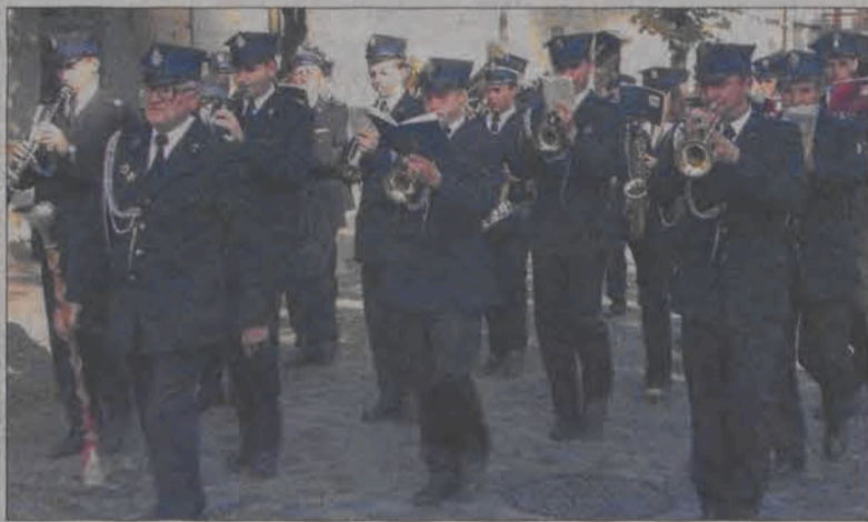
Przy dźwiękach trąbek i werbli orkiestry maszerowały ulicą Podrzeczną.

stry - choć nie wszystkie, częstokroć miały w swoich składach zestawy perkusyjne i gitary basowe. W każdym niemal składzie