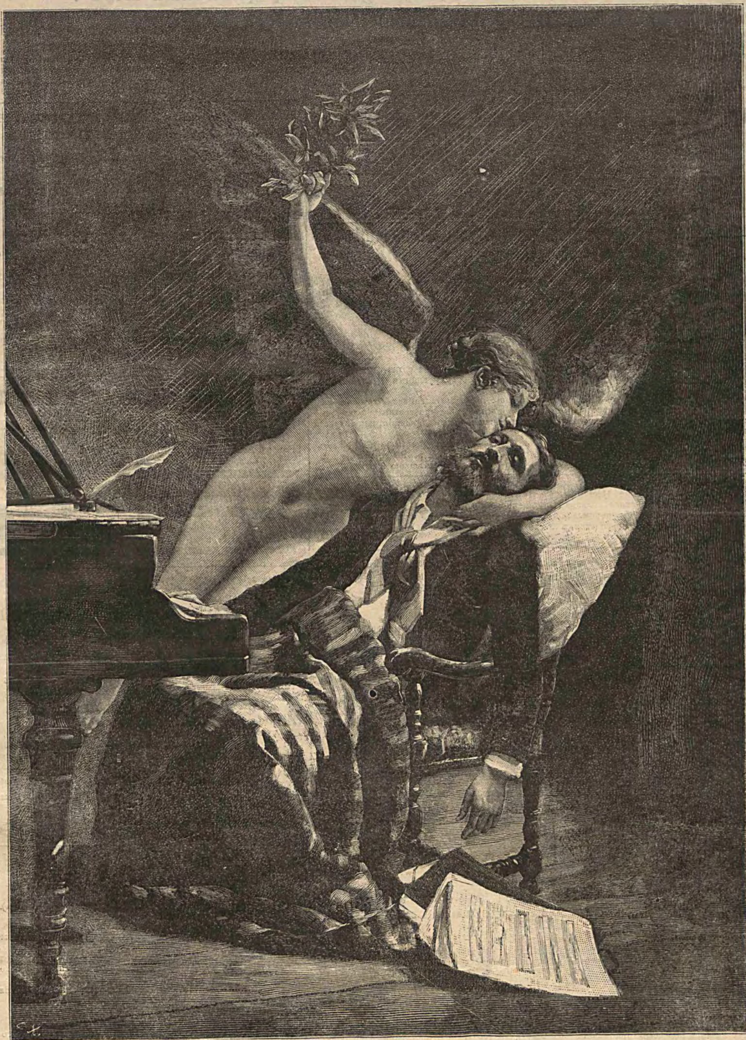
СЛАВА. Съ картины І. А. Ривсана. (Помѣщено въ „Иллюстрирован. Мірѣ“).

О подпискѣ на „Иллюстрированный Міръ“ 1885 г.