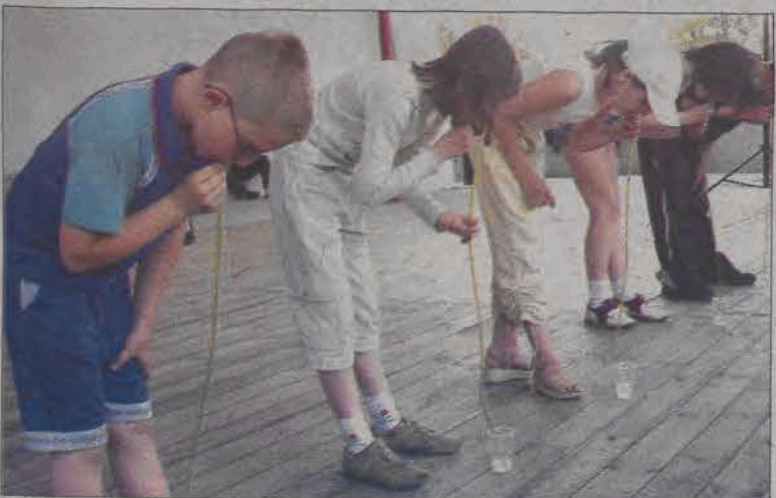
Jednym z konkursów dla najmłodszych było wypicie wody w jak najszybszym czasie za pomocą rurki.

towali uczniowie i uczennice łowickich szkół. Wystąpił wreszcie łowicki zespół pop rockowy Aspirine, grupa The King's Friends grająca przeboje Elvise Presleya, Perła i jej bracia - grupa z Pabianic w repertuarze cygańskim, Coco Band z muzyką latynoamerykańską, wreszcie Postman, zespół grający przeboje Beatlesów. Wszyscy oni jak tylko mogli starali się rozruszać widownię, tyle że z niewielkim skutkiem, gdyż ludzie preferowali raczej statyczne przyglądanie się wycynom artystów. Niektórzy ożywili się przy muzyce The King's Friends - potwierdza się maksyma, iż stare rock'n'rolle