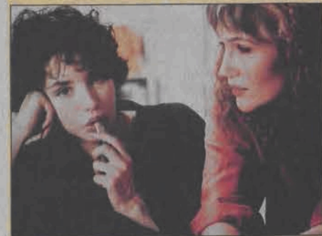
Kino Europy: Toksyczna miłość - film fab. prod. fran- cuskiej - emisja poniedziałek 7.06.2004 r. TVP1, godz. 23:50