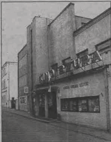
Kino Bzura nie tylko zmieni właściciela i wygląd, ale także nazwę. (Foto z archiwum NŁ, XI 2003 r.)

Choć zawarto wstępne porozumienie, to ani łowicki przedsiębiorca, ani Kołaczek, nie chcieli nam powiedzieć, jakie kwoty padały w czasie odbytych już negocjacji w sprawie budynku. Przypomnijmy więc, że na walnym zebraniu członków Towarzystwa, które odbyło się zimą tego roku ustalono, że Towarzystwo wyjdzie z propozycją sprzedaży miastu kina za kwotę 500 tys. zł. Propozycję tę ratusz odrzucił, uważając, że kino powinno trafić w ręce miejskie nieodpłatnie w drodze darowizny. Przedsiębiorca powie-