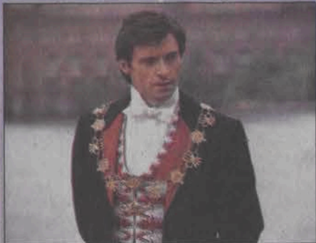
Kate i Leopold - film fab. prod. USA - emisja sobota 5.06.2004 r. TVP1, godz. 20:15