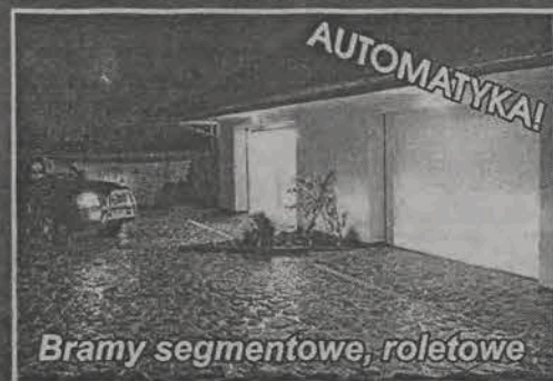
Bramy segmentowe, roletowe