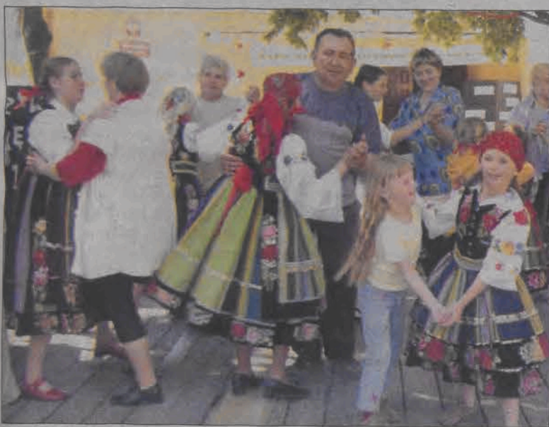
Deski ugiwały się pod tańczącymi.