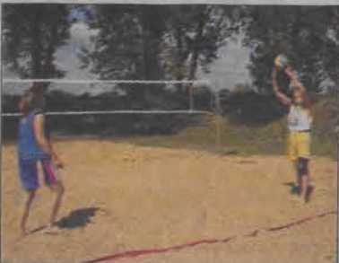
Nie tylko występy muzyczne były atrakcją pikniku. Na zdjęciu trening przed meczem siatkówki plażowej.

Jeśli chodzi o repertuar muzyczny, organizatorzy zadbałi o dużą rozpiętość stylistyczną propozycji. Był przecież sobotni koncert muzyki ska, było też coś na łowicką nutę - występ Koderek i Młodzieżowej Kapeli Ludowej, układy taneczne do muzyki rozrywkowej prezen-