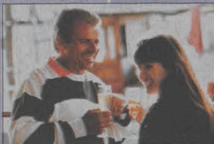
Okruchy życia: Opętana - film fab. prod. USA - emisja środa 9.06.2004 r. TVP1, godz. 20:15

19:58 Sport 20:04 Pogoda 20:15 Okruchy życia: Opętana - film fab. prod. USA 21:50 Bezpieczna Jedyńka 22:20 Babilon.pl - telenowela dokumentalna 23:00 Monitor Wiadomości 23:10 Biznes - perspektywy 23:20 Wiatr historii: Przesłuchanie - dramat prod. polskiej, reż. Ryszard Bugajski wyk. Krystyna Janda, Adam Ferency, Janusz Gajos, Agnieszka Holland