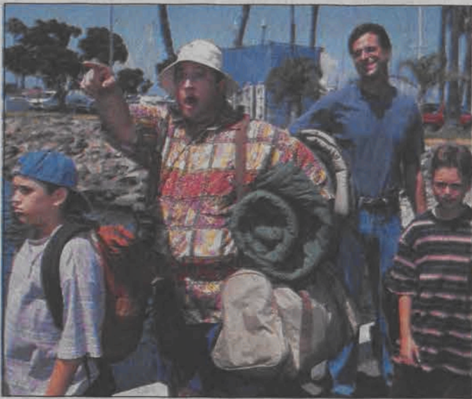
Tata i skaut - film rodzinny. Emisja: niedziela, 06.06, TVN, godz. 08:50