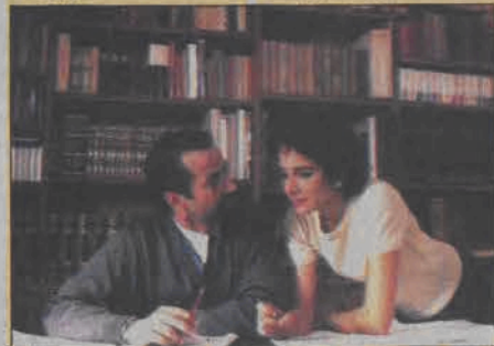
Co przyniesie życie - serial prod. włoskiej - emisja piątek 4.06.2004 r. TVP2, godz. 10:30