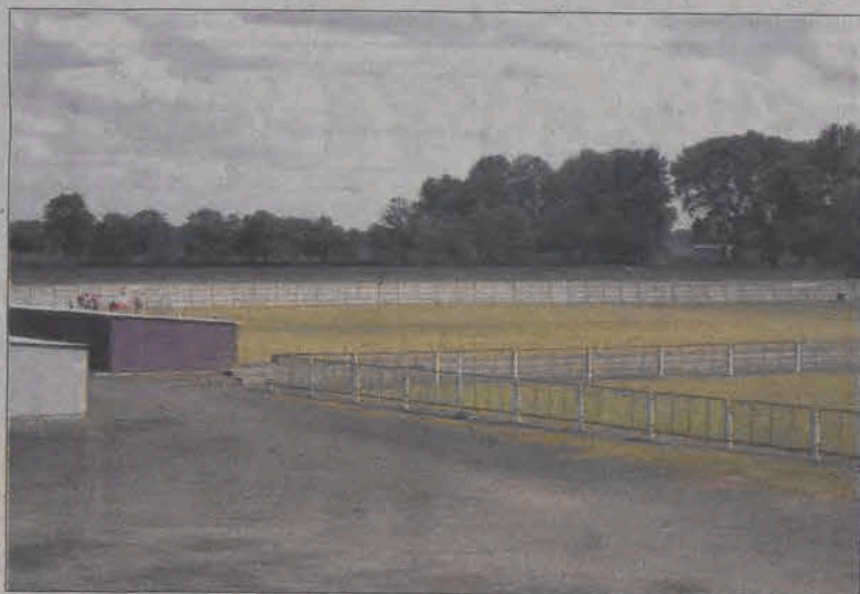
Droga ewakuacyjna ma powstać za trzyschodkową trybuną tuż za ogrodzeniem boiska. Ostatnim elementem modernizacji stadionu będzie likwidacja części blaszanych garaży, z którą trzeba się będzie liczyć za około dwa lata.