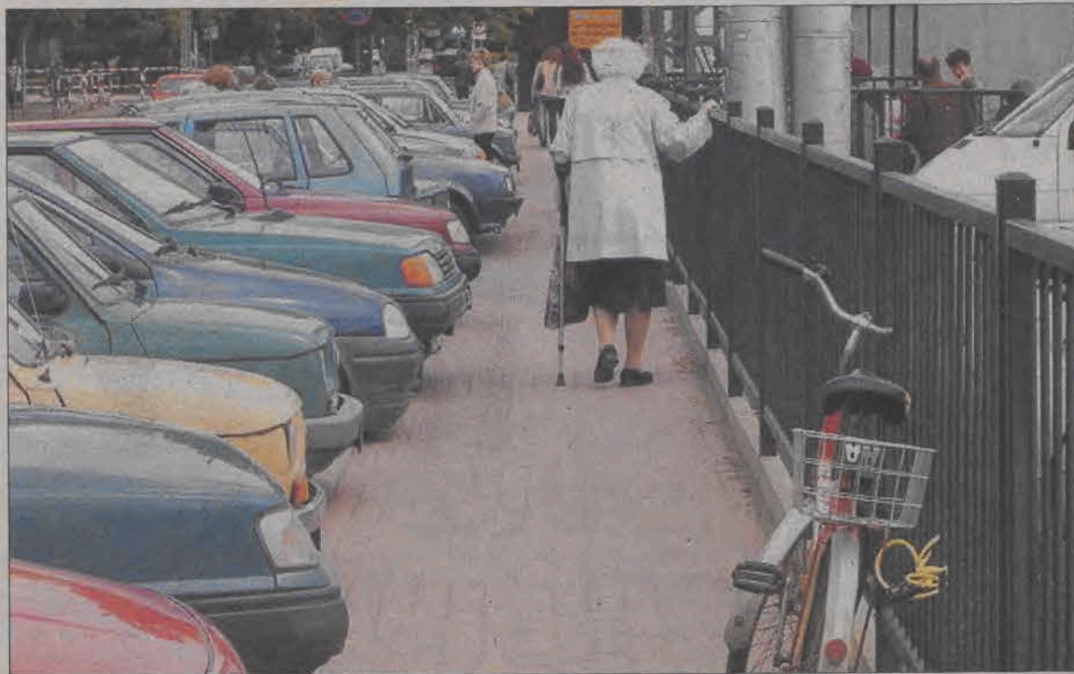
Dwóm osobom minąć się na tym chodniku jest trudno.