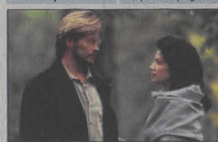
Niebezpieczne kłamstwa. Emisja: 09.06. TVN, godz. 20:40

16:15 Biały welon - telenowela 17:05 Najstabsze ogniwo - teleturniej 18:00 Rozmowy w toku - talk show 19:00 TVN Faktury 19:30 Sport 19:40 Pogoda 19:45 Uwaga! 20:10 Na Wspólnej - serial obyczajowy 20:40 Niebezpieczne kłamstwa - film sensacyjny 22:35 Alfabet mafii - serial fabularno-dokumentalny 23:10 Camera Cafe - serial komediowy 23:25 Lawina - film katastroficzny 01:30 Jarmark Europa - serial fabularno-dokumentalny 02:00 Nic straconego - powtórki programów