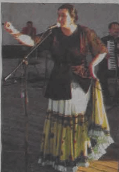
Organizatorzy zadbałi o urozmaicony repertuar muzyczny. Twórczość cygańską zaprezentował zespół Perła i jej bracia.

Pogoda istotnie dopisała tak w sobotę, jak i dnia następnego. Pierwszego dnia pikniku w godzinach popołudniowych na muszli koncertowej zorganizowany został festiwal „Ska nad Bzurą”, który zgromadził wszystkie możliwe chyba subkultury młodzieżowe. Pod sceną w rytm reagge, wspólnie szaleli zarówno posiadacze dredów, jak i osobnicy z malowniczo prezentującymi się irokezami, wreszcie ci zupełnie łysi i mocno wytatuowani. Jakaś przygodnie przybyła na koncert pani narzekała co prawda, że ze sceny na okrągło słychać tylko hubu dubu , ale wielbicielom ska o to właśnie chodziło. Podczas samego koncertu ekscesów nie zanotowano, a wielu widząc dziwnie wyglądającą festiwalową publiczność mocno się tego obawiało. Dopiero na sam koniec festiwalu grupki skinheadów z Łodzi i Warszawy próbowały