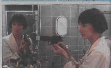
Policjantki z FBI. 10.06. TVN, godz. 14:00

15:40 Miss Universe 2004 - gala finałowa 17:40 Dzieciaki z klasą - finał - program rozrywkowy 19:00 TVN Fakty 19:30 Sport 19:40 Pogoda 19:40 Uwaga! 20:10 Na Wspólnej - serial obyczajowy, Polska 20:40 Bodyguard - film sensacyjny, USA, reż. Mick Jackson wyk. Kevin Costner, Whitney Houston, Gary Kemp, Bill Cobbs, Ralph Waite, Tomas Arana 23:20 Jarmark Europa - serial fabularno-dokumentalny 23:50 Siłacze - program rozrywkowy 00:55 Nic straconego - powtórki programów