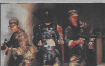
Akcja ostaniej szansy. Emisja: 04.06, TVN, godz. 22:20

16:00 Fakty 16:10 Wielki Test z III RP 16:20 Biały welon - telenowela, Meksyk 17:10 Najstabsze ogniwo - teleturniej 18:00 Rozmowy w toku - talk show 19:00 TVN Fakty 19:30 Sport 19:40 Pogoda 19:45 Uwaga! 20:10 Na Wspólnej - serial obyczajowy 20:40 SUPERKINO: Pasażer 57 - film sensacyjny, USA 22:20 Akcja ostaniej szansy - film science-fiction, USA, reż. Ian Gilmour wyk. Brian McNamara, Marjean Holden, Callan Mulvey, Brett Tucker, Jeremy Callaghan 00:10 Nic straconego - powtórki programów