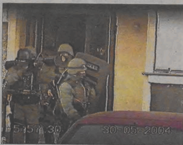
Brygada antyterrorystyczna na osiedlu Bratkowice w Łowiczu. Zatrzymanie w tym miejscu trwało tylko kilka minut.

Policjanci weszli w Łowiczu jednocześnie do ośmiu mieszkań w niedzielę, 30 maja o godz. 6.00. Większość przestępców była zaskoczona poranną wizytą brygady antyterrorystycznej i nie stawiała oporu. Byli zakuci w kajdanki już kilkanaście minut po szóstej i trafili najpierw na „dolek” do łowickiej KPP. Około godziny 9.30 do Prokuratury Apelacyjnej w Łodzi sprzed łowickiej komendy wyjechał pod specjalnym nadzorem konwoj z zatrzymanymi przestępcami.