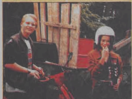
Kino bez rodziców: Molly - emisja sobota 5.06.2004 r. TVP2, godz. 10:50