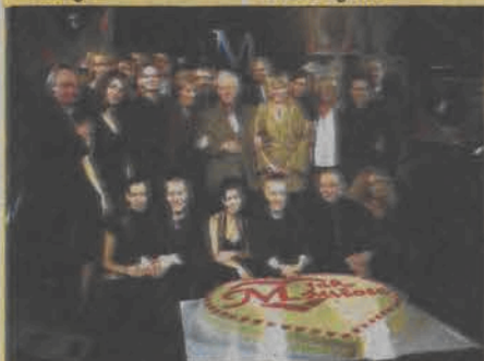
Benefis M jak miłość - program rozrywkowy - emisja wtorek 8.06.2004 r. TVP2, godz. 20:05