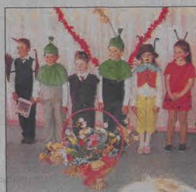
Maluchy ze Szkoły Podstawowej w Stachlewie same przygotowywały swoje stroje.

Zaproszone na uroczystość mamy zgromadziły się w jednej z większych sal lekcyjnych szkoły w Stachlewie. Szkoła bowiem nie posiada sali gimnastycznej, a której można by organizować takie spotkania. Przed mamami wystąpiły wszystkie dzieci, które uczą się w szkole.