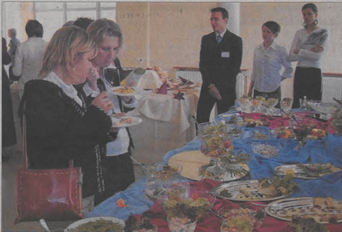
Przy stołach przygotowanych przez uczniów ZSP nr 2 i nr 3 można było skosztować ciekawe potrawy, na przykład ciasto z marchwi.