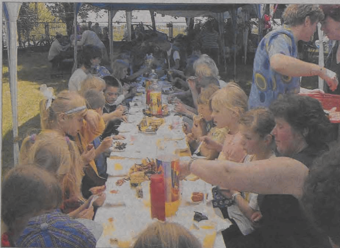
Po konkursach i zabawach na powietrzu apetyt dopisywał wszystkim dzieciom ze Szkoły Podstawowej w Gaju Wojewodzy, tym bardziej, że kiełbaski na grillu przygotowywali tatusiowie.

Po kilku chwilach spędzonych na parkiecie dzieci i rodzice zaproszeni zostali do wspólnego grillowania. Gorące kiełbaski i grillowana kaszanka smakowały wszyst-