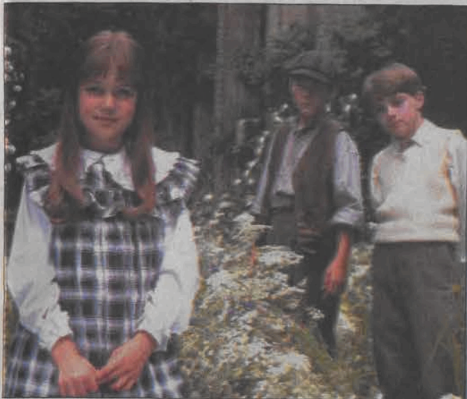
Tajemniczy ogród - film rodzinny. Emisja: czwartek 10.06, TVN, godz. 07:40

HBO 06:30 Przypadkowy turysta 08:30 Wola życia 10:05 Jak dzięki konie 11:40 Od drzwi do drzwi 13:15 Monsieur Batignole 15:00 Splacić dług 16:35 Gwiezdne wrota V 17:20 Dobry jak chleb 19:00 Przypadkowy turysta 21:00 Frida 23:00 Jakoś to będzie 00:35 Helikopter w ogniu 02:55 Haker 04:25 Monsieur Batignole