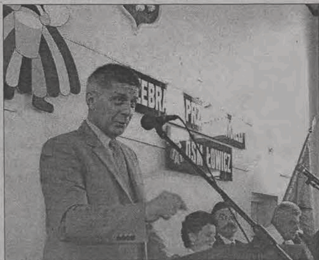
Prof. Marek Belka podczas Zebrania Przedstawicieli OSM Łowicz w poniedziałek, 31 maja.

kładnie sprawdzali, co kto ma w torbie, a wykrywaczem metali - czy nie posiada przy sobie metalowych przedmiotów. Ich działania wzbudziły spore zainteresowanie wchodzących na spotkanie. Ze względów bezpieczeństwa strażacy musieli m.in. wyprowadzić wozy bojowe stojące w garażach pod salą konferencyjną na parking za remizą. Ruchem na skrzyżowaniu ulic Podrzeczna i św. Floriana kierowali łowiccy policjanci, natomiast nad Łowiczem latał helikopter.