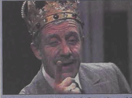
Teatr Telewizji: Iwona Książniczka Burgunda - emisja poniedziałek 7.06.2004 r. TVP1, godz. 21:25