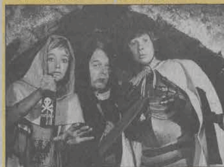
Samochodzik i Templariusze - serial prod. polskiej - emisja środa 9.06.2004 r. TVP2, godz. 14:10