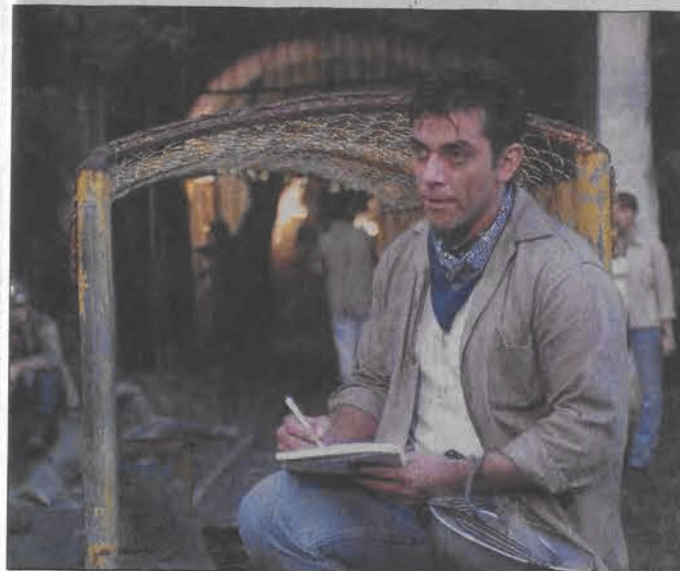
Zakłęte serce - telenowela. Emisja: wtorek, 08.06, TVN, godz. 14:10

06:20 Strefa P - magazyn muzyczny 06:45 Informator Prawny - magazyn Gazety Prawnej 07:00 Muzyczne listy 07:45 TV Market 08:00 Rajdowe Mistrzostwa Świata - Rajd Akropolu 09:00 Strażacy 09:30 Drogówka - magazyn policyjny 10:00 Słodka trucizna 11:00 Cud miłości 12:00 Informator Prawny 12:15 Gdzie diabeł mówi dobranoc 13:15 Muzyczne listy 14:00 V.I.P. 15:00 Eek! The Cat 15:30 Słodka trucizna 16:30 Cud miłości 17:00 Komenda 18:00 Z życia wzięte 18:15 Daję słowo 19:00 Panna Mary 21:00 Dziennik 21:20 Informacje sportowe 21:25 Prognoza pogody 21:30 Arena marzeń PEPSI & TV4 21:40 Strażacy 22:10 Pałac wagabundów 22:40 Joker - talk-show 23:40 Sztukateria 00:10 Śledztwo prowadzi Nero Wolfe: Podejrzany - FBI - film kryminalny 01:55 Muzyczne listy 02:40 VIP wydarzenia i plotki 03:05 V Max