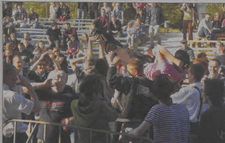
Niektórzy wykonawcy wprost noszeni byli na rękach.