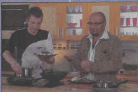
Kuchnia z Okrasą - gość: Piotr Gąsowski - magazyn kulinarny - emisja niedziela 6.06.2004 TVP1, godz. 13:10