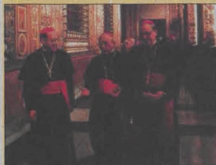
Za murami Watykanu - film dokumentalny - emisja czwartek 10.06.2004 r. TVP2, godz. 11:00