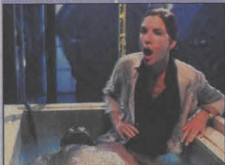
Dawca - film fab. prod. USA - emisja piątek 4.06.2004 r. TVP1, godz. 01:25

19:30 Wiadomości 19:58 Sport 20:07 Pogoda 20:20 Prawdziwe męstwo - western prod. USA 22:30 Męska rzecz...: Amerykański Ninja 5 - film fabularny prod. USA 00:10 Monitor Wiadomości 00:30 Biznes - perspektywy 00:35 Czas na...kontrowersyjny dokument: Plemiona Etiopii - Surma. Mistrzowie walki na kije 01:25 Dawca - film sensacyjny prod. USA