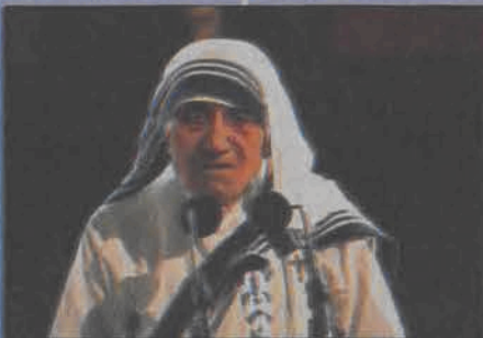
Matka Teresa z Kalkuty - Indyjska święta - film dokumentalny prod. włoskiej - emisja wtorek 8.06.2004 r. TVP1, godz. 13:10

19:00 Wieczorynka 19:30 Wiadomości 19:53 Sport 19:59 Pogoda 20:10 Uśmiech dnia: Wiosna panie sierżancie - komedia prod. polskiej 22:00 Wybory do Parlamentu Europejskiego 23:00 Monitor Wiadomości 23:15 Plus minus 23:40 Ostatnie lato - dramat prod. angielsko-amerykańskiej, reż. Philip Haas wyk. Kristin Scott Thomas, Sean Penn, Anne Bancroft