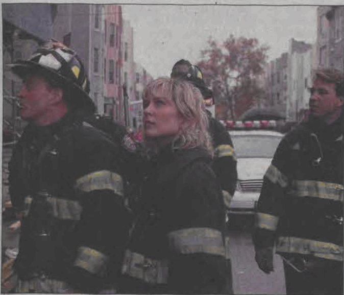
Brygada ratunkowa – serial. Emisja: poniedziałek 07.06, TVN, godz. 15:00

W wydanym w czwartek, 13 maja, oświadczeniu, aktorka napisała: „To dla mnie niezwykle istotne, aby stać się Amerykanką z prawem głosu. W sercu jednak nadal czuję się Kanadyjką i nie mam zamiaru rzekać się kanadyjskiego paszportu”.