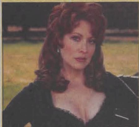
Shaughnessy - film fab. prod. USA - emisja niedziela 6.06.2004 r. TVP2, godz. 12:10