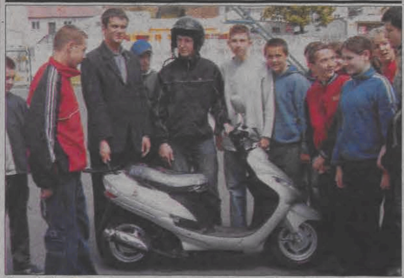
Z nauki jazdy na skuterze skorzystało 150 uczniów z klas I gimnazjum.

zainteresowanie taką formą pomocy, a więc - ile pieniędzy uda się zebrać. Organizatorzy zapewniają, że będzie możliwość zakupu prac za dowolną opłatą, jaką zechce uiścić każdy z uczestników kiermaszu. Kiermasz poprzedzony będzie prezentacją placyków i występem artystycznym. (mwk)