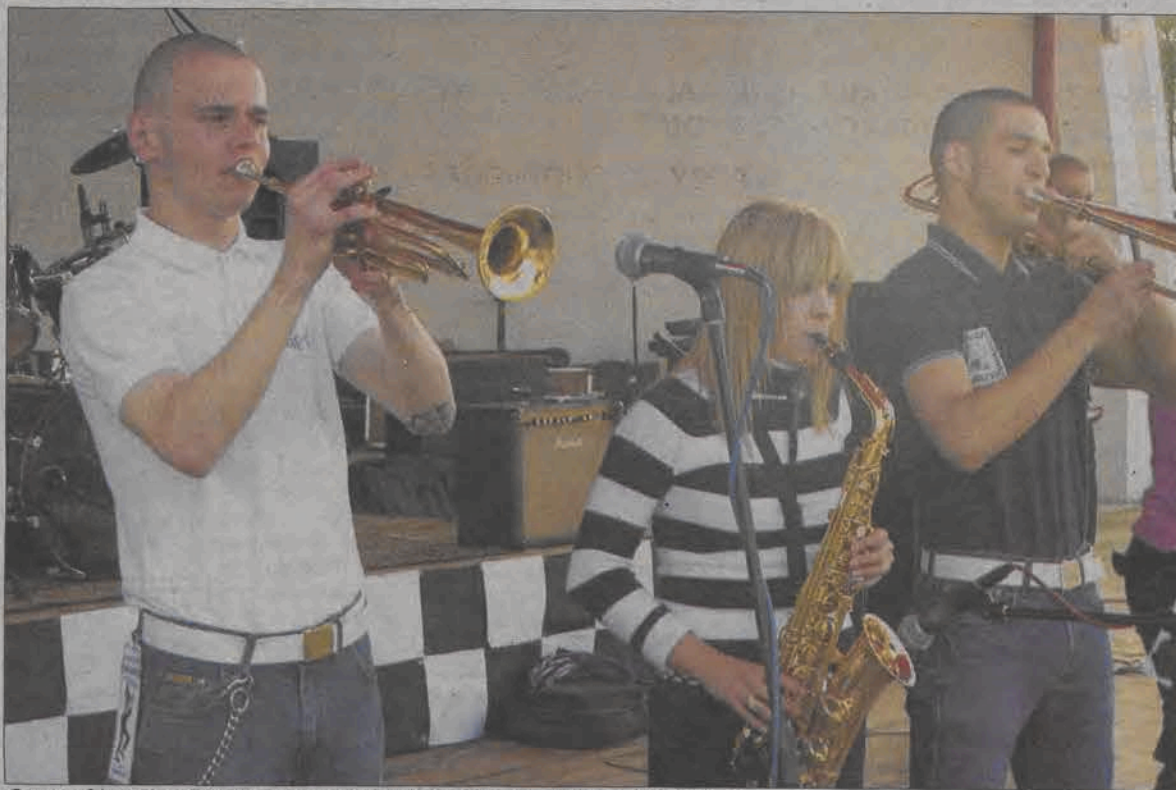
Grupa Skauci z Olsztyna w sekcji dętej miała urodziwą saksofonistkę.