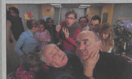
Camera Cafe. Emisja: 07.06, TVN, godz. 23:05

17:05 Najlepsze ogniwo - teleturniej 18:00 Rozmowy w toku - talk show 19:00 TVN Fakty 19:30 Sport 19:40 Pogoda 19:45 Uwaga! 20:10 Na Wspólnej - serial obyczajowy 20:40 Dzieciaki z klasą - final - program rozrywkowy 22:00 Usterka - serial fa- bularno-dokumentalny 22:35 Maraton uśmiechu - program rozrywkowy 23:05 Camera Cafe - serial komediowy 23:20 Fakty Wieczorne 23:45 Fakty, ludzie, pieniądze - magazyn ekonomiczny 00:15 Multikino 00:45 Co za tydzień - magazyn 01:10 Nic straconego