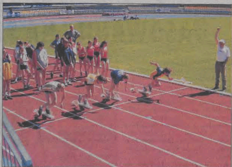
Na szybkiej tartanowej nawierzchni w Kutnie padło sporo rekordów życiowych w biegu na 60 m.