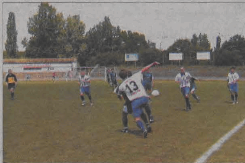
W meczu z Gwardią nasi gracze się nie popisali...