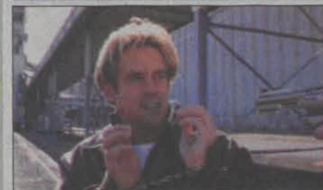
Klub muszkieterów. 05.06. TVN, godz. 00:15