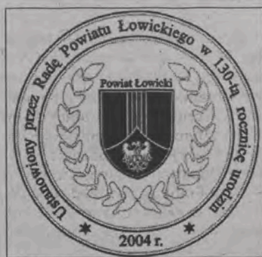
Awers i rewers medalu „Za zasługi dla Ziemi Łowickiej”.

banków, przewodniczący Rady Powiatu i przewodniczący zarządu powiatu.