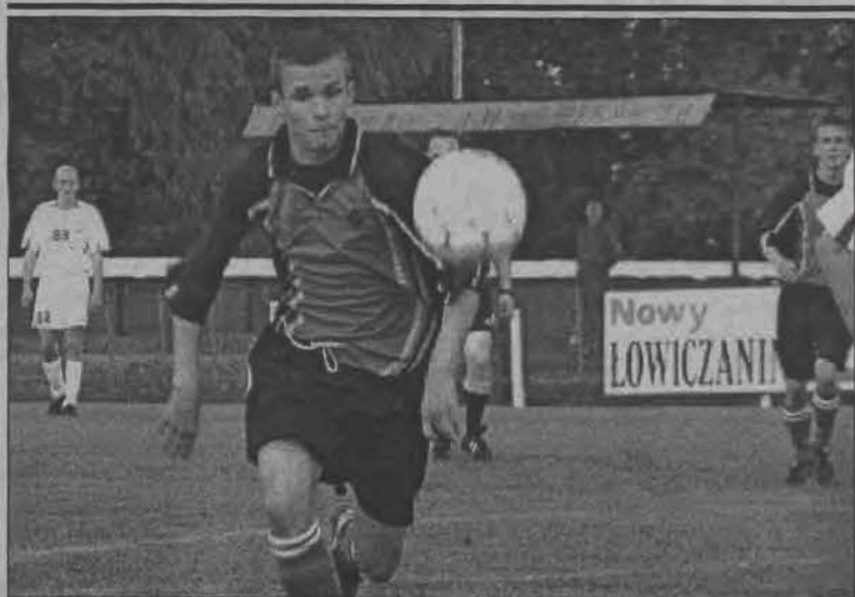
Łowiczanie zaprezentowali się w meczu z Widzewem bardzo dobrze, ale punkty pojechali jednak do Łodzi.

Szkoda, bo tego meczu można było nie przegrać. Ale taka jest piłka - kto nie strzela nie wygrywa i, niestety, spada... BoB