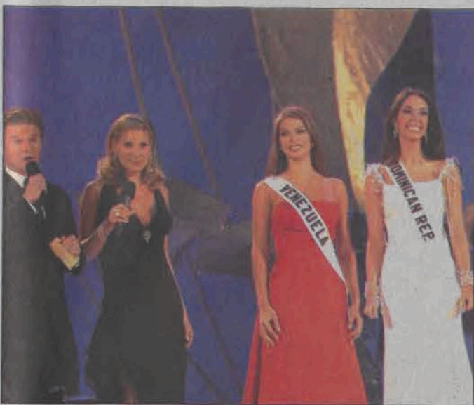
Miss Universe. Emisja: sobota 05.06, TVN, godz. 22:15

Astra kombi będzie miała światową premierę podczas Madryckiego Salonu Samochodowego.