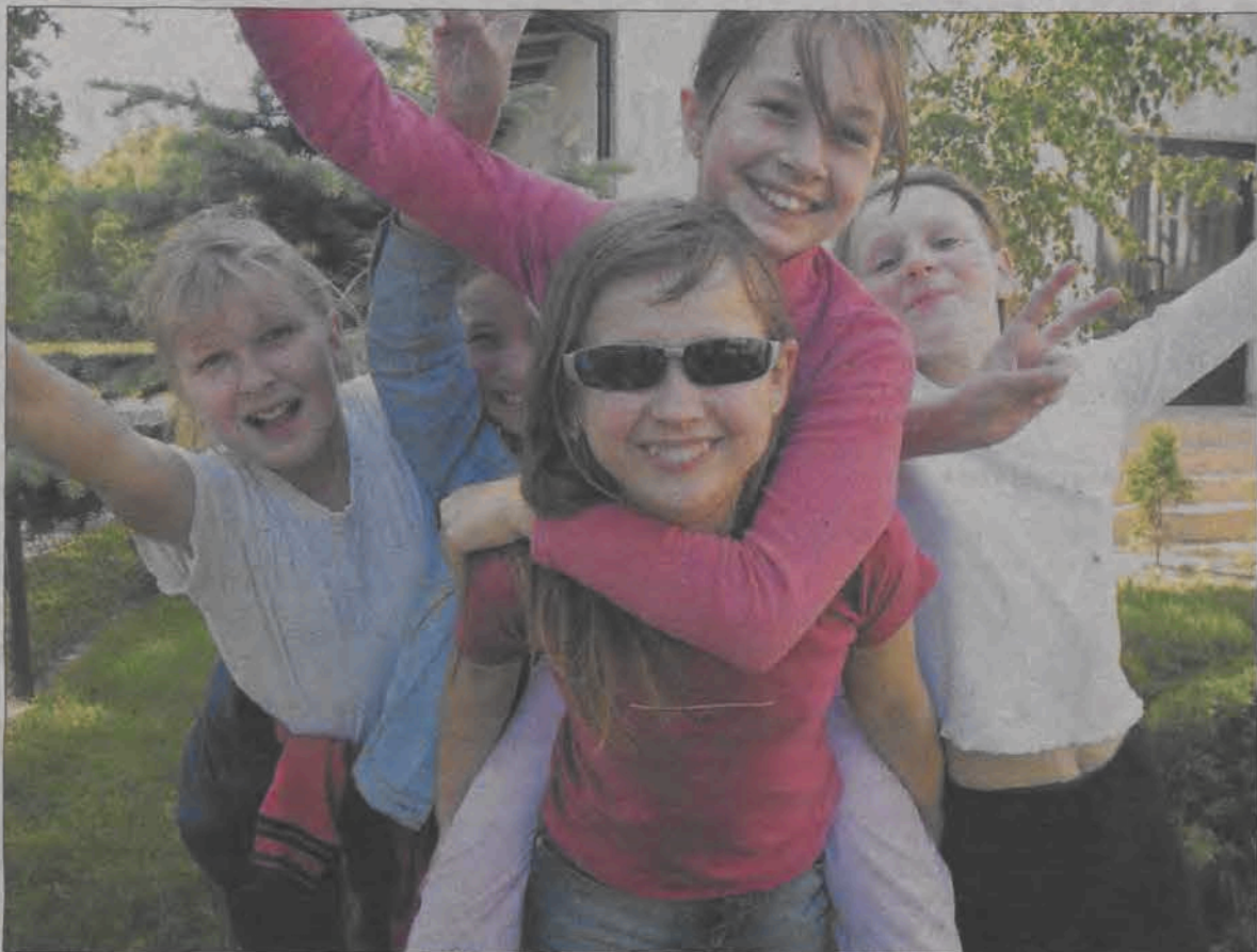
Wyjątkowo wesoły wtorek w Dąbkowicach. Dzień Dziecka – wtorek 1 czerwca – w Szkole Podstawowej w Dąbkowicach Dolnych wypełniły zawody sportowe dla najmłodszych, konkursy tańca, konkursy plastyczne, surfowanie w internecie itp. Był też poczęstunek dla dzieci. Nagrody i atrakcje sponsorował tym razem szkolny Komitet Rodzicielski. (mak)