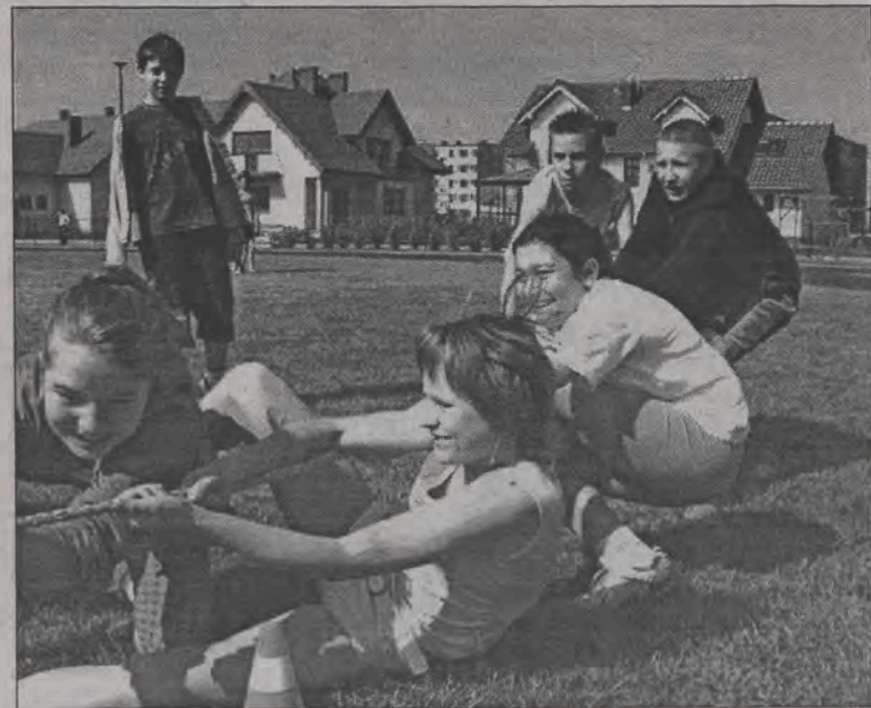
Przeciąganie liny na boisku „Siódemki”.

Uroczystość związana z zakończeniem rozruchu i próbnego obciążenia wodą rolniczego zbiornika retencyjnego Joachimów - Ziemiary w Gminie Bolimów, zaplanowana została na dziś, czwartek 3 czerwca, o godzinie 13.00. Podczas spotkania, które, jak informują realizatorzy projektu - Wojewódzki Zarząd Melioracji i Urządzeń Wodnych w Łodzi, nie jest jeszcze otwarciem zbiornika, ale zakończeniem jego budowy, nastąpi poświęcenie zalewu, zwiedzanie urządzeń i budowli zbiornika. Usłyszeć też będzie można szczegóły, co do dalszych losów zbiornika. Część artystyczną, na którą złoży się tańce i piosenki ludowe przygotowali uczniowie ze szkoły Podstawowej w Kęszycach. (wcz)