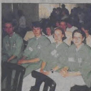
Czterosobowy zespół z Łowicza zajął w Łodzi drugie miejsce.