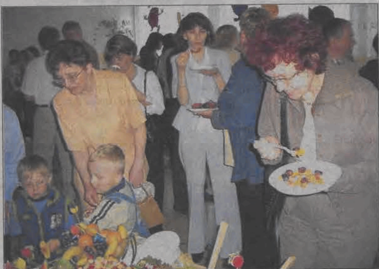
Goście chętnie korzystali z możliwości degustacji potraw.