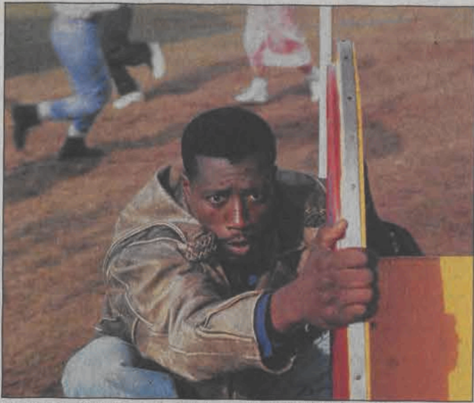
Pasażer 57 - film sensacyjny. Emisja: piątek, 04.06, TVN, godz. 20:40