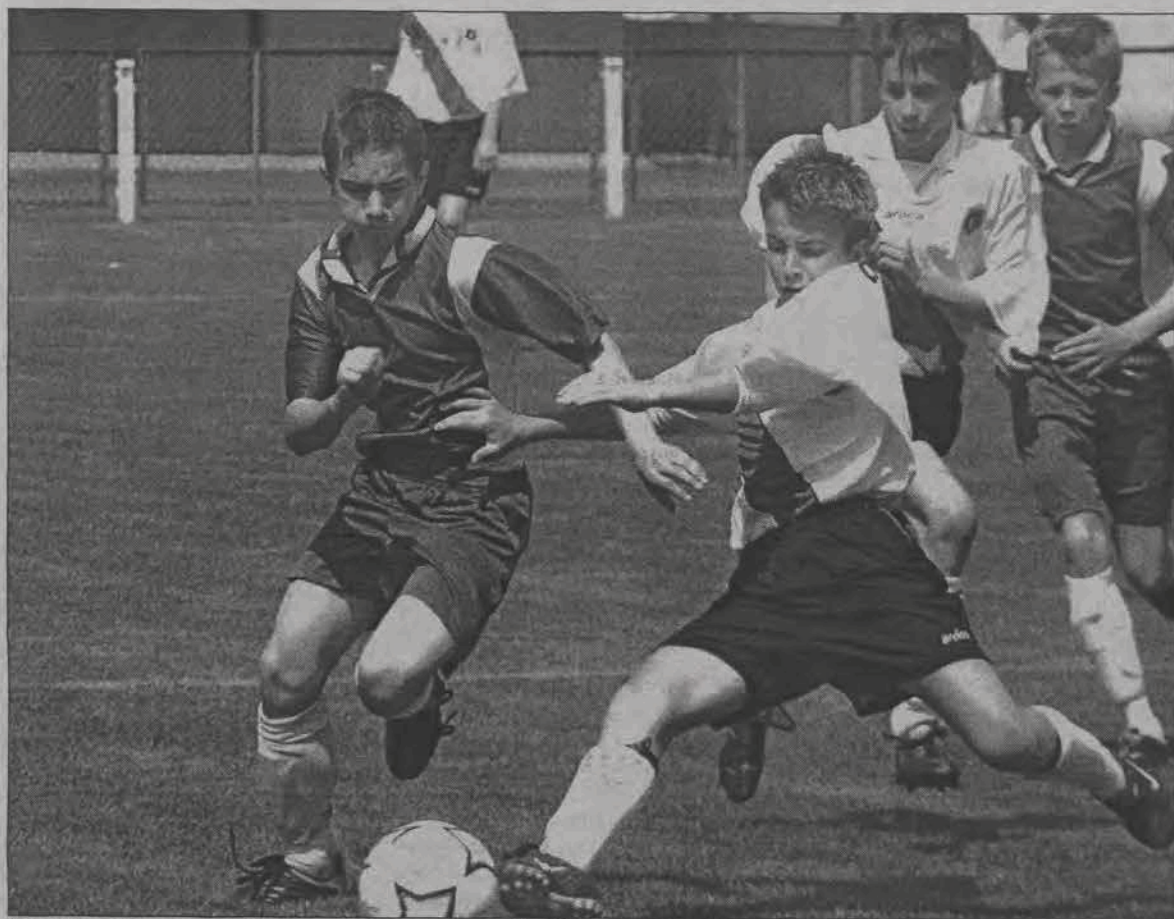
Młodym piłkarzom Pelikana ambicji wystarczyło tylko na pierwszą połowę...