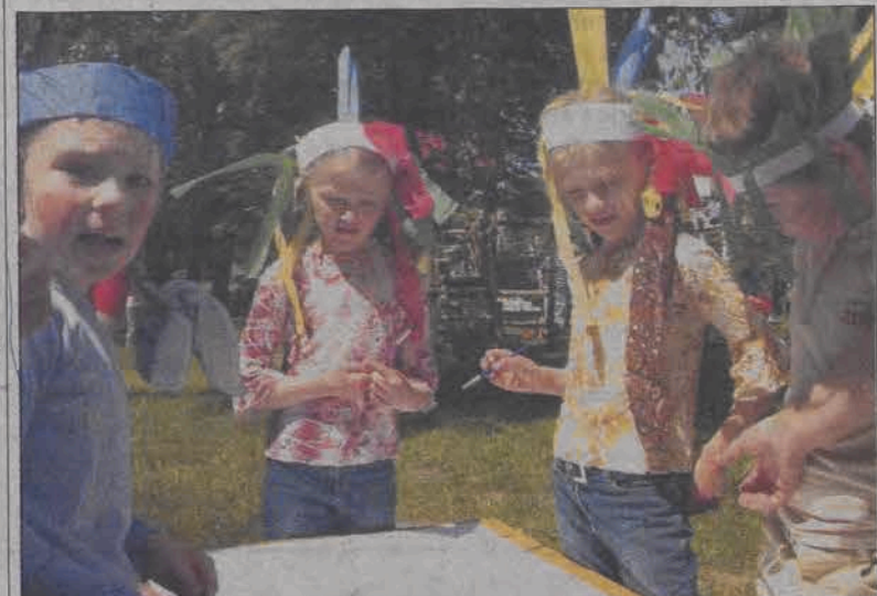
Pióropusze i barwy wojenne. Zabawa w Indian to tylko jeden z elementów pikniku organizowanego w przedszkolu przy ulicy Sikorskiego.