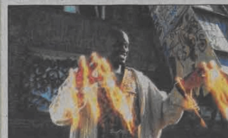
Kazaam. Emisja: 06.06. TVN, godz. 14:15

17:10 Chwila prawdy - program rozrywkowy 18:30 Trzy serca - program rozrywkowy 19:00 TVN Fakty 19:25 Sport 19:35 Pogoda 19:40 Uwaga! 20:00 Kasia i Tomek - serial komediowy 20:30 Dla Ciebie wszystko 21:55 Pod napięciem - talk show 22:25 Superwizjer 22:55 Nie do wiary - opowieści niesamowite 23:25 Alfabet mafii - serial fabularno-dokumentalny 23:55 Trzy serca - program rozrywkowy 00:25 Camera Cafe - serial komediowy 01:05 Nic straconego - powtórki programów