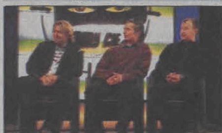
Mamy Cię! Emisja: 08.06, TVN, godz. 20:40

16:00 Fakty 16:15 Biały welon - telenowela 17:05 Najlepsze ognio - teleturniej 18:00 Rozmowy w toku - talk show 19:00 TVN Fakty 19:30 Sport 19:40 Pogoda 19:45 Uwaga! 20:10 Na Wspólnej - serial obyczajowy 20:40 Mamy Cię! - program rozrywkowy 22:00 Tajemnice Smallville - serial obyczajowy 23:00 Camera Cafe - serial komediowy 23:15 Fakty Wieczorne 23:40 Kasia i Tomek - serial komediowy 00:10 Superwizjer - magazyn 00:40 Nie do wiary - opowieści niesamowite 01:10 Nic straconego